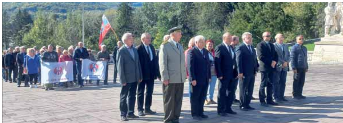
Vďaka osloboditeľom prejavujú členovia SZPB.