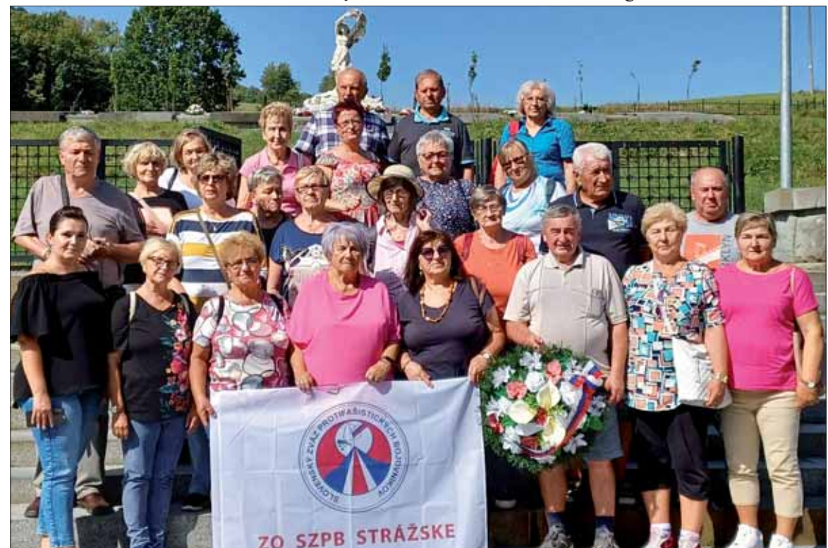
Každé pamätné miesto je nám drahé.