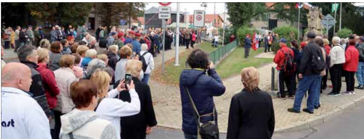
Aj snímka kladenia vencov pri pomníku padlých dokazuje, že tohtoročná účasť bola vskutku úctyhodná.