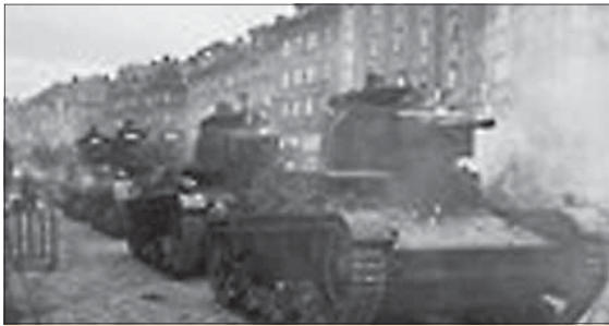
Október 1938. Poľské tanky v Českom Tešíne pred hotelom Piast.

Zachvátenie Sudetov Nemeckom v októbri 1938