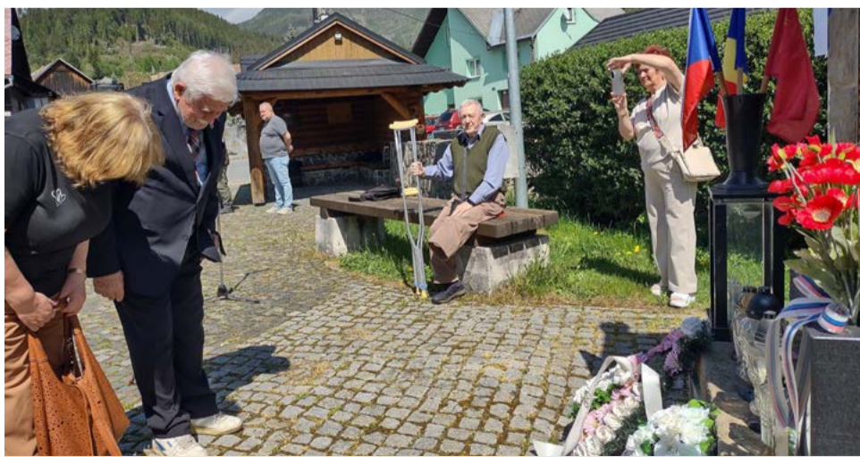
Kladenie vencov v Pohorelej.

Dňa 10. mája 2026 si obyvatelia Pohorelej pri pamätníku padlých v oboch svetových vojnách uctili pamiatku všetkých obetí vojnových konfliktov. Účastníci podujatia položili veniec, zapálili sviečky a poklonili sa občanom obce, ktorých mená sú vyryté na pamätnej tabuli, ako aj všetkým padlým vo vojnách.