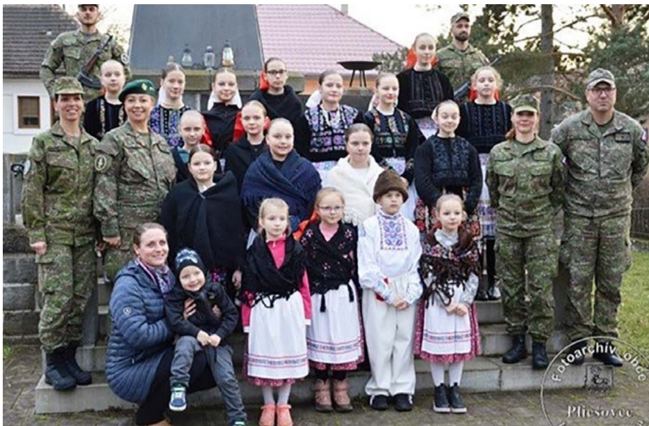
Spomienka prilákala aj najmladšiu generáciu.

Dňa 7. mája 2026 si obyvatelia Pliešoviec pripomenuli 81. výročie ukon-