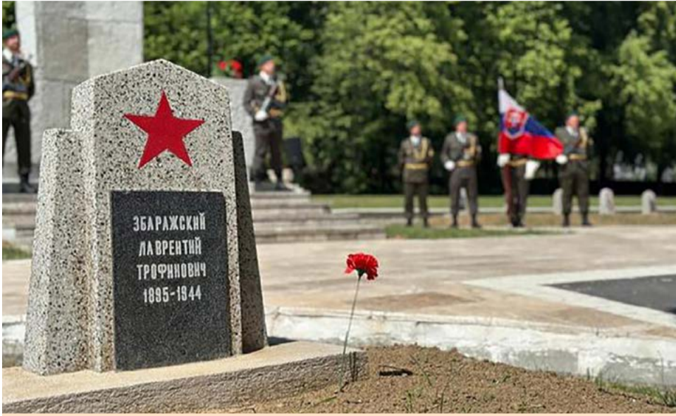
Pamätník v Michalovciach