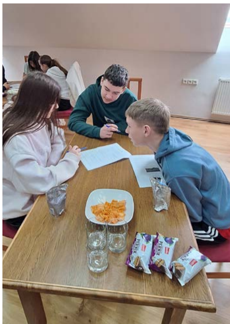
Porada súťažného družstva.