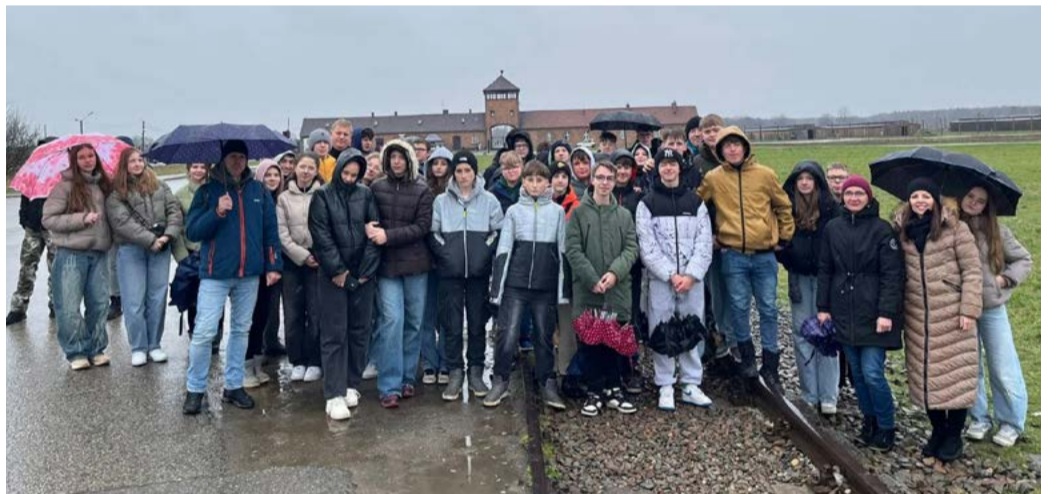
Spoločná fotografia študentov.