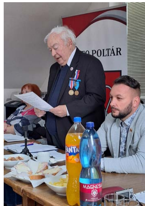
Prihovor predsedu ZO SZPB Poltár.