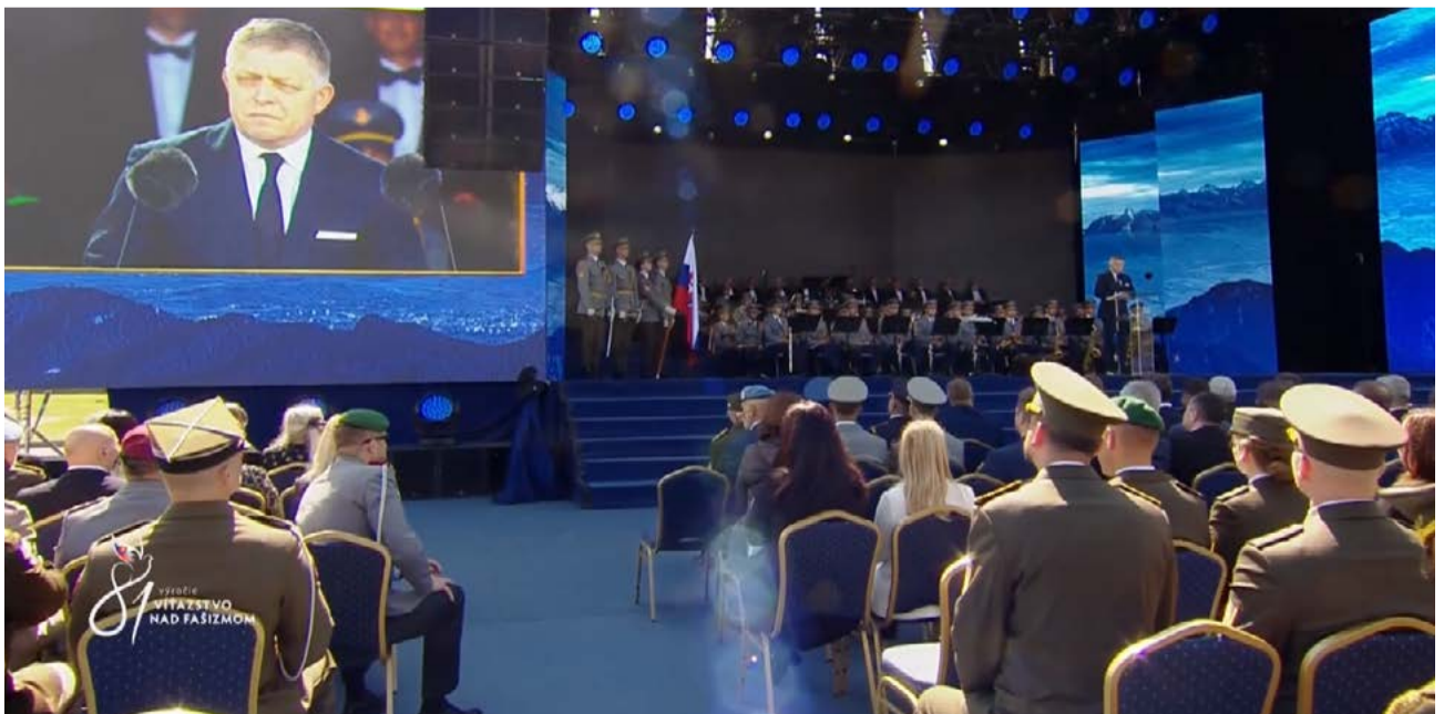
Príhovor predsedu vlády SR Roberta Fica.