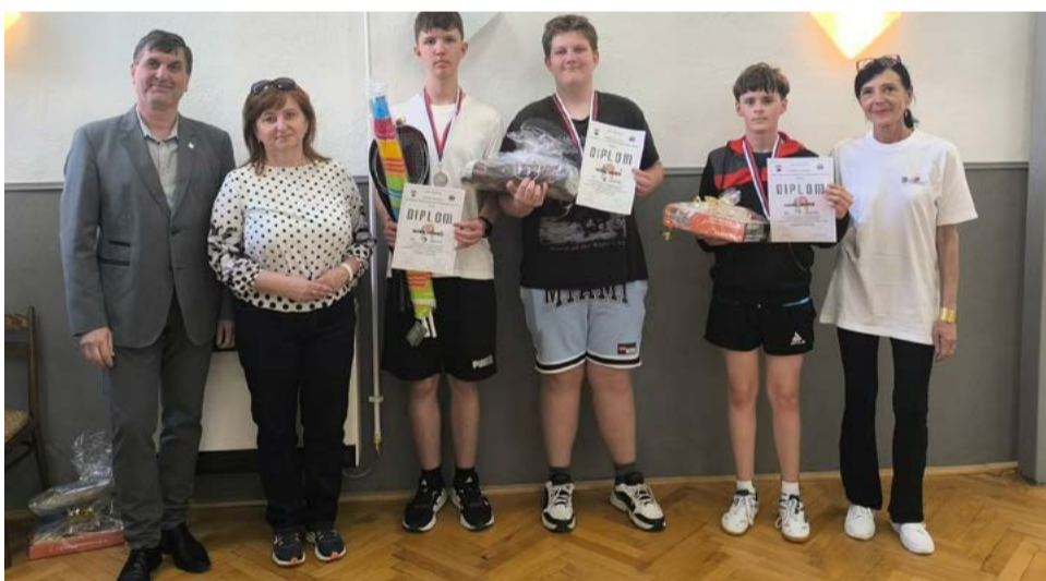
Účastníci stolnotenisového turnaju.