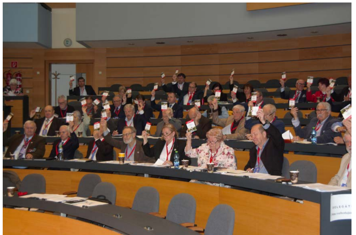
Hlasovanie delegátov XIX. mimoriadneho zjazdu.