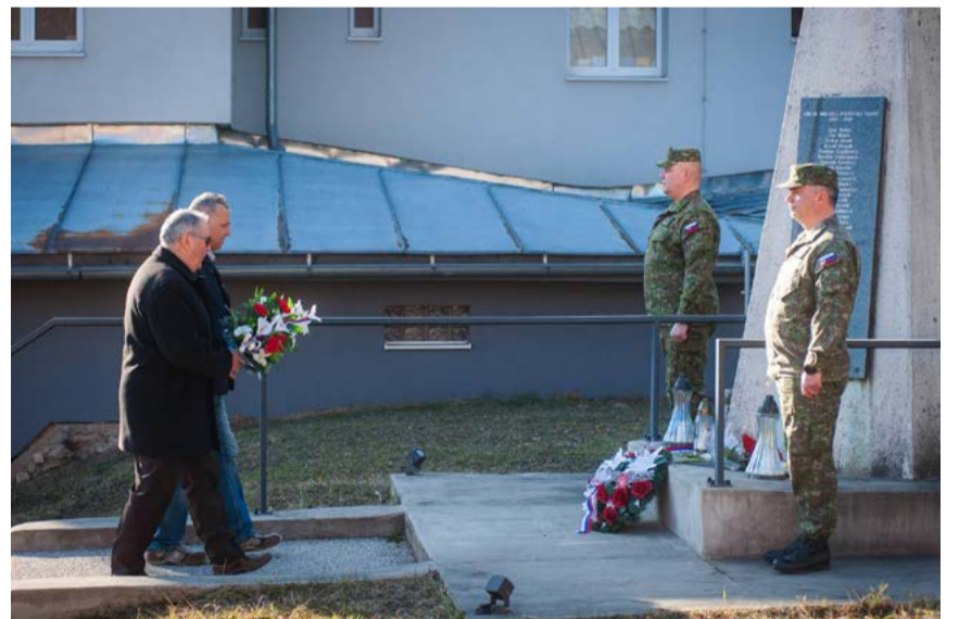
Kladenie vencov vo Valaskej.

Členovia výboru SZPB spolu so zástupcami obce, predstaviteľmi štátnej správy a vedením základnej školy položili kytice kvetov k pamätníku padlým hrdinom Slovenského národného povstania a k pamätníku obetiam prvej a druhej svetovej vojny.