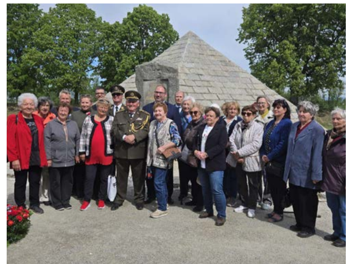
Pred Mohylou M. R. Štefánika.