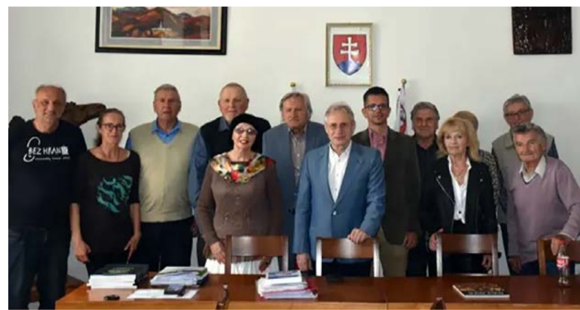
Účastníci schôdze klubu.