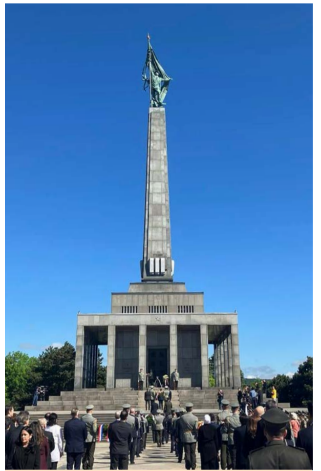
Pohľad na Slavín.

text: Martin Krno, foto: Branislav Balogh a výber zo sociálnych sietí