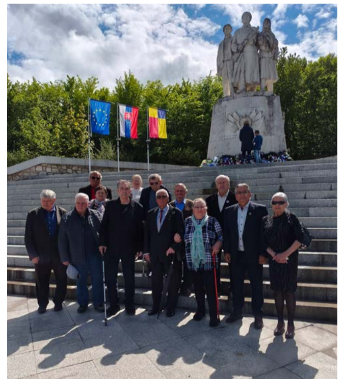
Pred pamätníkom na Dargove