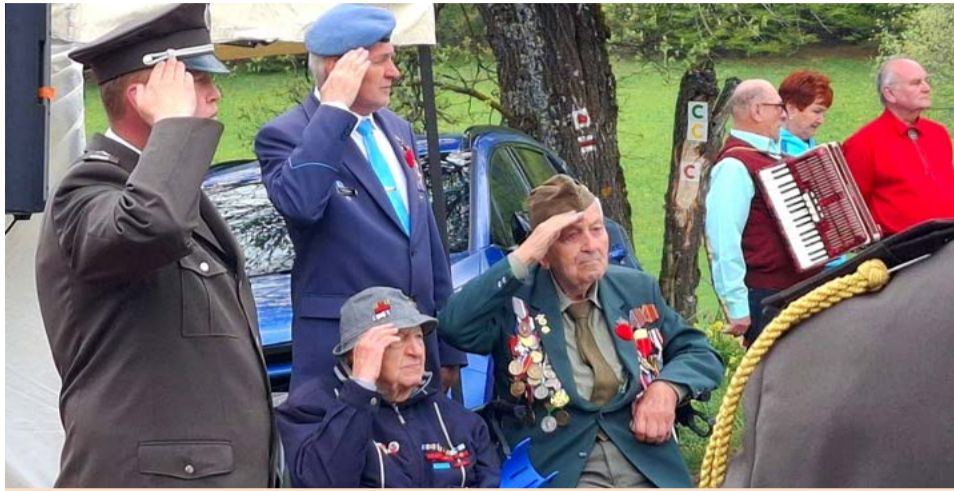
Účastníci pochodu vďaky.