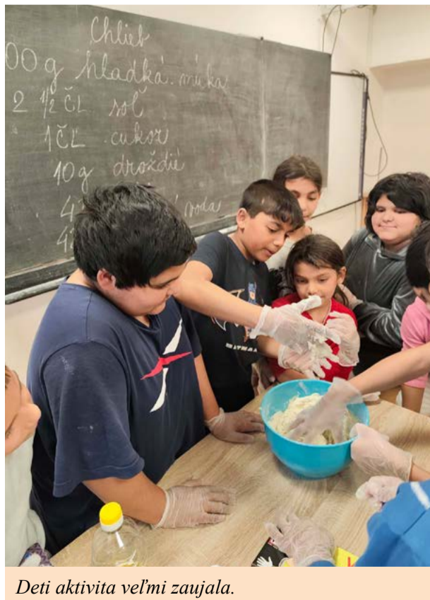
Deti aktivita veľmi zaujala.