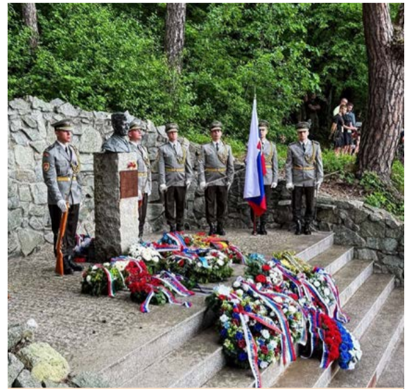
Pamätník Jozefa Gabčíka.

Je dôležité, aby sme si osobnosti, akou bol Jozef Gabčík, nepripomínali iba pri významných výročiach. Ich príbehy a odkaz je potrebné odovzdávať ďalším generáciám, aby nezabudli na cenu slobody a na tých, ktorí sa zaslúžili o porážku nacizmu.