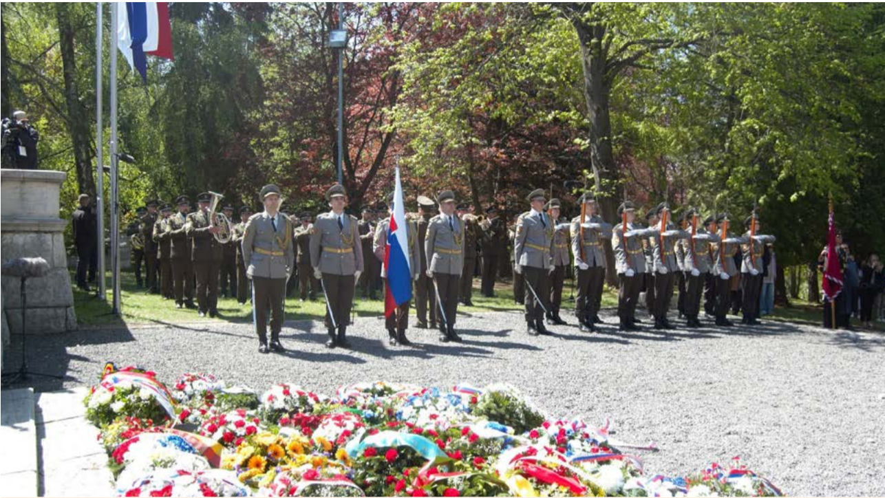
Čestná stráž OS SR po položení vencov.

Práve výzva k mieru, úcta k obeťam druhej svetovej vojny a zachovanie historickej pravdy patrili k hlavným poslanstvám celoslovenských osláv 81. výročia víťazstva nad fašizmom v Liptovskom Mikuláši.