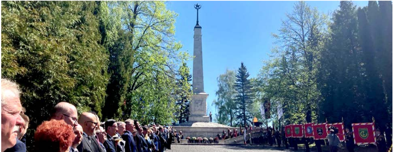
Pamätník Háj Nicovô.