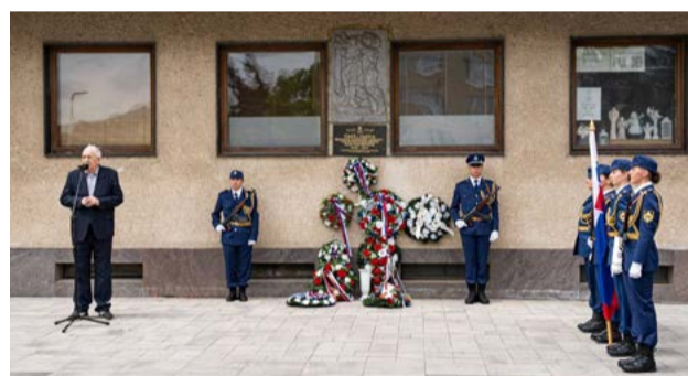
Žiar nad Hronom