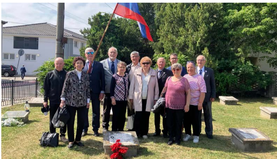
Delegácia Oblv. SZPB Levice na vojenskom cintoríne v Štúrove.