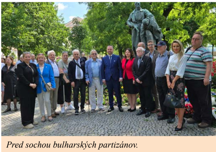
Pred sochou bulharských partizánov.

Súčasťou programu bolo aj vystúpenie žiakov a pedagógov Základnej školy a Gymnázia Hrista Boteva v Bratislave. Táto