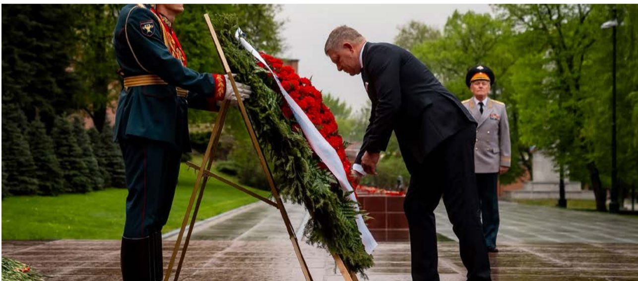
Robert Fico pri hrobe neznámeho vojaka v Moskve.

Predseda vlády SR Robert Fico sa spolu so slovenskou delegáciou zúčastnil 9. mája 2026 na oslavách Dňa víťazstva nad fašizmom v Moskve. V hlavnom meste Ruskej federácie vzdal úctu obeť 2. svetovej vojny, osobitne vojakom Červenej armády padlým pri oslobodzovaní Slovenska. Robert Fico tiež položil veniec k hrobu neznámeho vojaka pri Kremli. „Je nepopierateľné, že sloboda a mier prišli na Slovensko z východu,“ uviedol predseda vlády SR.