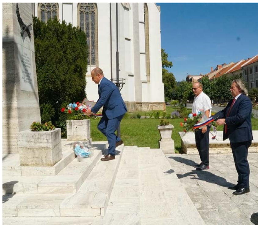
Pietny akt v Levoči.

text a foto: Juraj Faltin, člen výboru ZO SZPB v Levoči