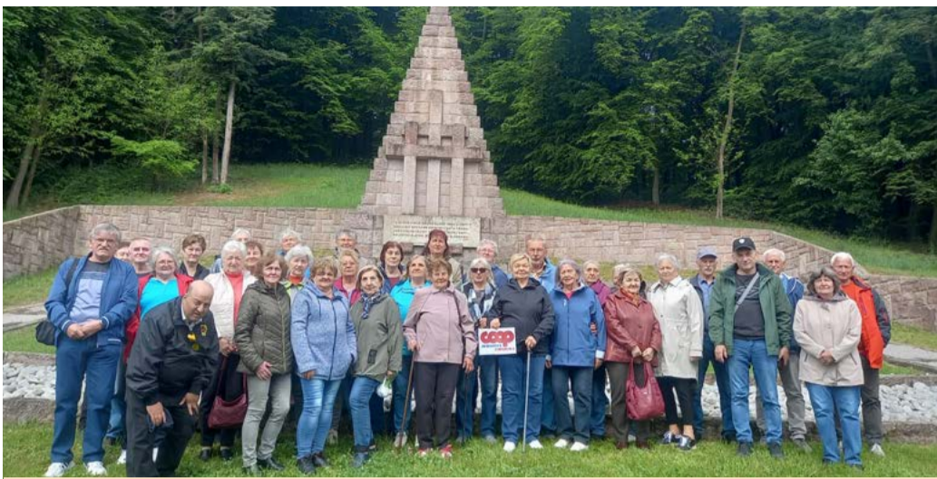
Účastníci exkurzie po stopách minulosti.