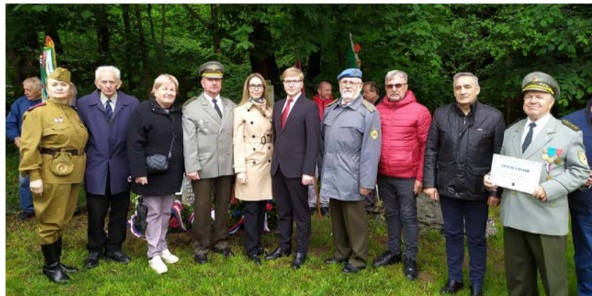
Členovia SZPB pred pamätníkom.

Dňa 17. mája 2026 sa vo Veľkej Lodine pri rieke Sopotnica uskutočnil jubilejný 20. ročník pietneho stretnutia venovaného pamiatke príslušníkov Zboru národnej bezpečnosti, ktorí padli v bojoch proti banderovským skupinám na východnom Slovensku po skončení druhej svetovej vojny.