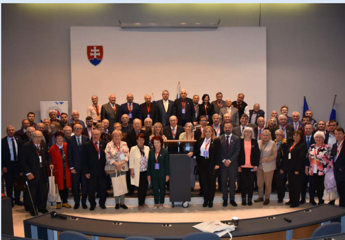
Spoločná fotografia všetkých účastníkov zjazdu SZPB.