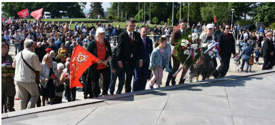
Delegácia SZPB pri kladení vencov.

Hoci sa na Slovensku výročie ukončenia druhej svetovej vojny oficiálne pripomína 8. mája, pre mnohých ľudí zostáva symbolom víťazstva nad fašizmom aj 9. máj. Práve v tento deň totiž nadobudla účinnosť bezpodmienečná kapitulácia nacistického Nemecka a v krajinách bývalého Sovietskeho zväzu sa stal Dňom víťazstva. Tradičné spomienkové zhromaždenie pri tejto príležitosti zorganizovalo na bratislavskom Slavíne Veľvyslanectvo Ruskej federácie v Slovenskej republike. Vysoká účasť verejnosti pritom potvrdila, že spomienka na tento dátum zostáva medzi občanmi Slovenska stále živá.