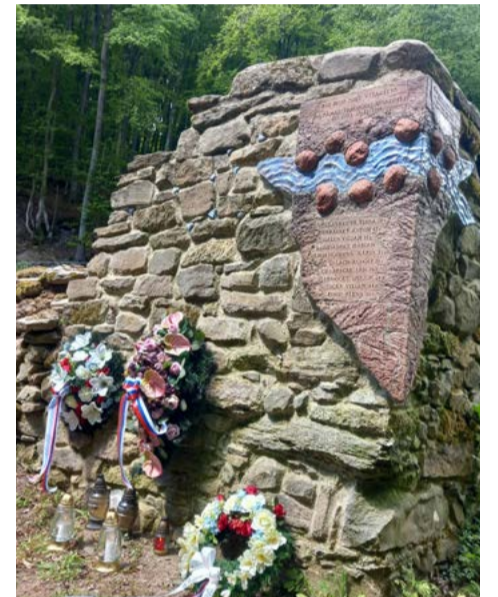
Pamätník v Dobrej Nive.

text a foto: Ján Slosiarik, predseda ZO SZPB Dobrá Niva