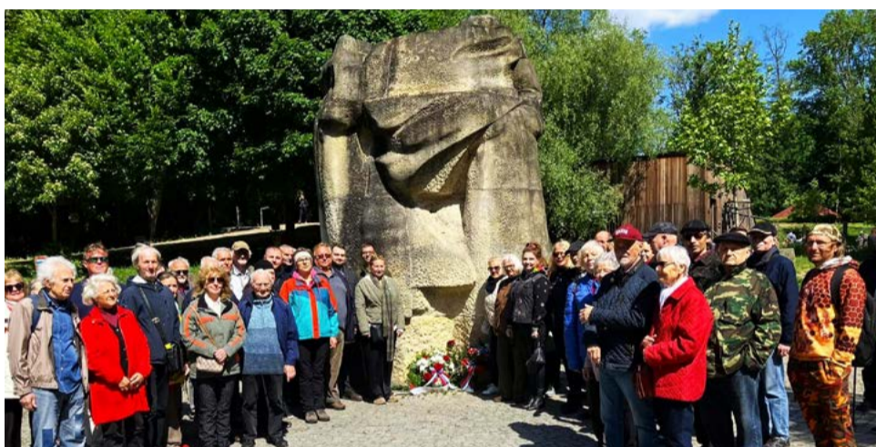
Spoločná fotografia pri pamätníku.

Prečo sa tradičné podujatie nekonalo v lesoch nad Račou, ale na Železnej studničke? Žiaľ, zopakovala sa situácia z minulých rokov, keď organizátori z Klubu Nového slova, Oblastného výboru SZPB Bratislava, miestnej organizácie strany Smer – SSD a hnutia Socialisti.sk nenašli riešenie, ktoré by umožnilo uskutočniť podujatie priamo na Malom Slavíne. Situáciu navyše skomplikovala aj novelizácia environmentálnych predpisov, podľa ktorých si prejazd autobusom v blízkosti chráneného územia vyžaduje osobitné povolenia.