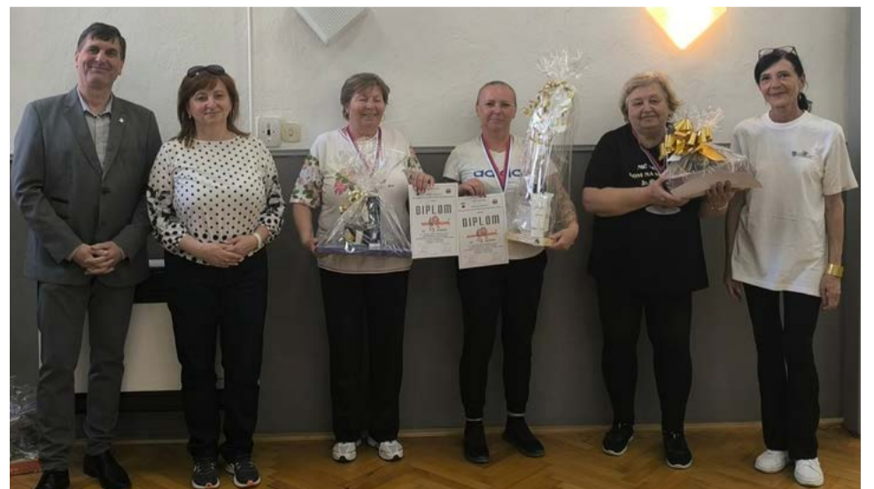
Účastníci stolnotenisového turnaju.