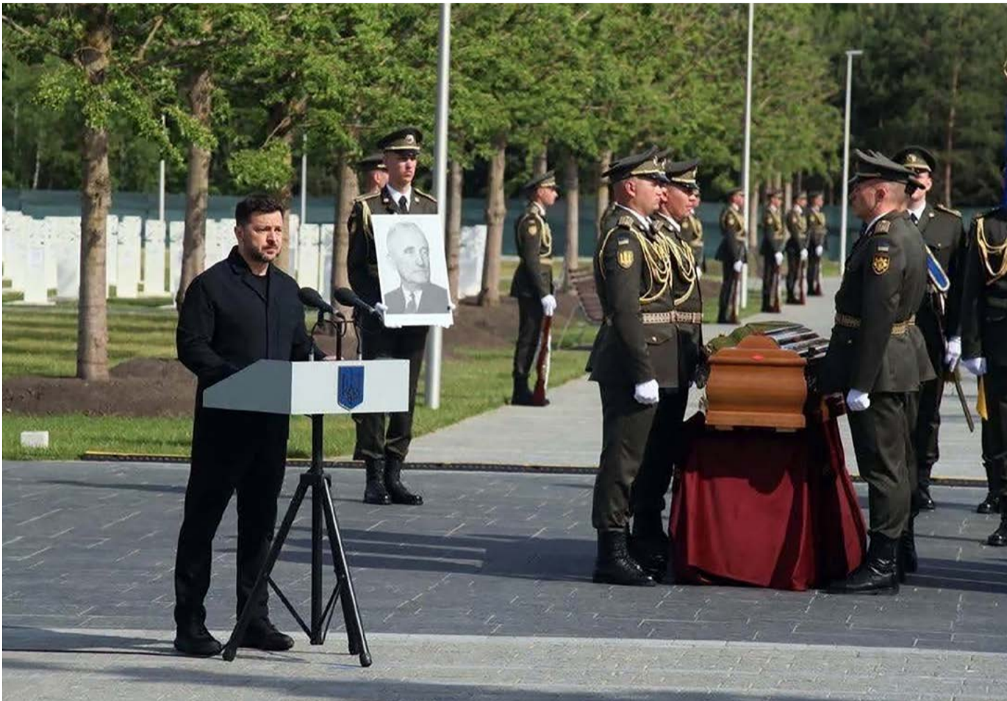
Ukrajinský prezident Volodymyr Zelenskyj predniesol slávnostnú príhovor na počesť Andrija Melnyka.

vojenskú jednotku „Nezávislé centrum špeciálnych operácií Sever“ na „Hrdinovia UPA“. Vraj s cieľom „obnoviť historické tradície národnej armády“. Pomenovať špeciálnu vojenskú jednotku po hrdlozeoch z UPA (banderovcoch), ktorí sú zodpovední za masové etnické čistky a vyhladenie najmä poľského obyvateľstva vo Volyni, je taká bezočivosť, akoby na Slovensku niekto pomenoval špeciálnu jednotku „Hrdinovia Pohotovostných oddielov Hlinkovej gardy“! Svet by vybuchol od hnevu, no Zelenského výčiny západné elity ticho tolerujú.