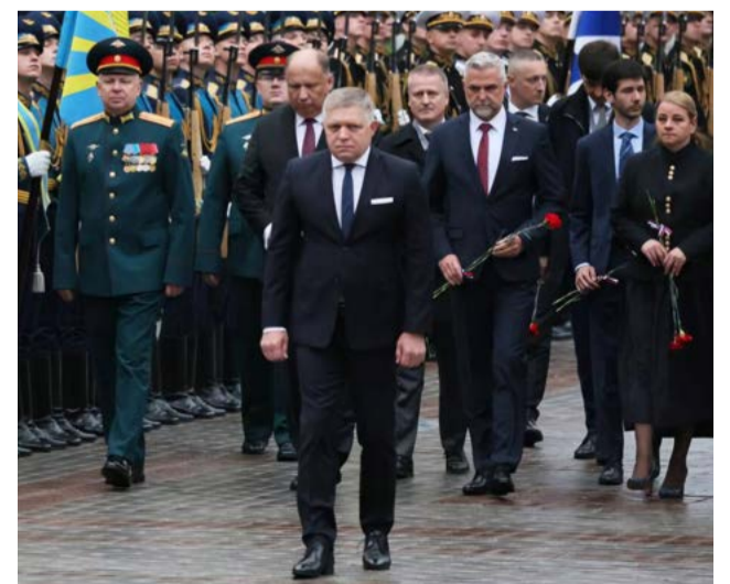
Delegácia SR v Moskve.