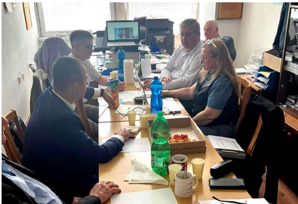
Rokovanie Predsedníctva ÚR SZPB.