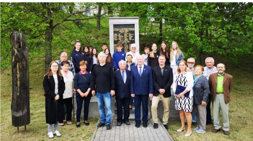
Spoločná fotografia pred pamätníkom.