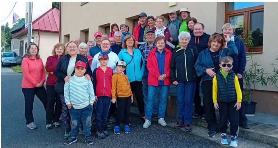
Spoločná fotografia účastníkov.