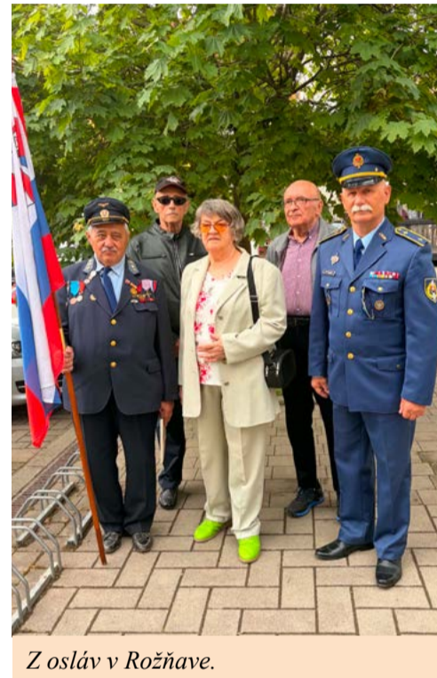
Z osláv v Rožňave.

Dňa 7. mája 2026 si mesto Rožňava v dopoludňajších hodinách pripomenulo 81. výročie ukončenia druhej svetovej vojny v Európe a víťazstva nad fašizmom. Zástupcovia mesta, členovia Slovenského zväzu protifašistických bojovníkov, predstavitelia verejnej a štátnej správy i občania mesta si na Námestí baníkov pri pamätnej tabuli osloboditeľov položením vencov uctili pamiatku všetkých, ktorí priniesli našej vlasti v roku 1945 slobodu.