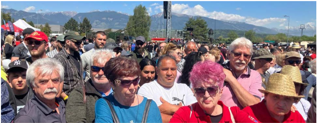
Členovia SZPB z celého Slovenska sa zišli do Liptovského Mikuláša.