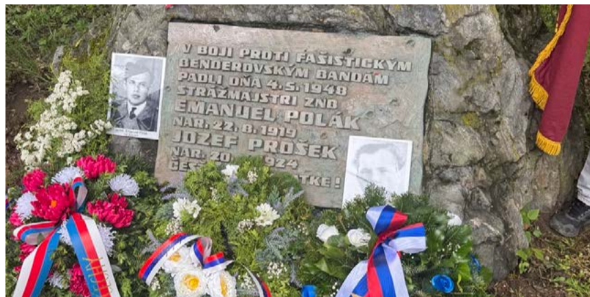
Pamätník obetí banderovcov.

Podujatie sa konalo v rámci osláv 81. výročia víťazstva nad fašizmom. Pietne stretnutie sa uskutočnilo o 11.00 hod. pri pomníku padlých príslušníkov ZNB a bolo venované pamiatke príslušníkov bezpečnostných zložiek, ktorí zahynuli v bojoch s banderovskými skupinami.