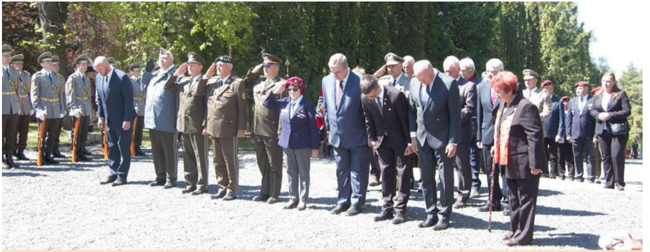
Delegácia SZPB sa poklonila pamiatke hrdinov.