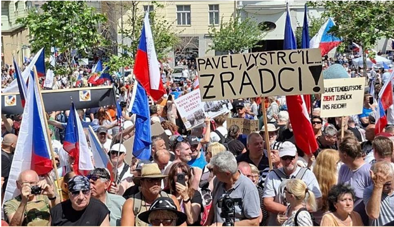
Demonštrácia v Brne

„Máte právo v prezidentských voľbách nevoliť toho, kto dal záštitu sudetonemeckému snemu,“ vyhlásil tretí prezident Českej republiky Miloš Zeman na pódiu demonštrácie v Brne celkom adresne bez toho, aby menoval existujúcu hlavu štátu Petra Pavla.