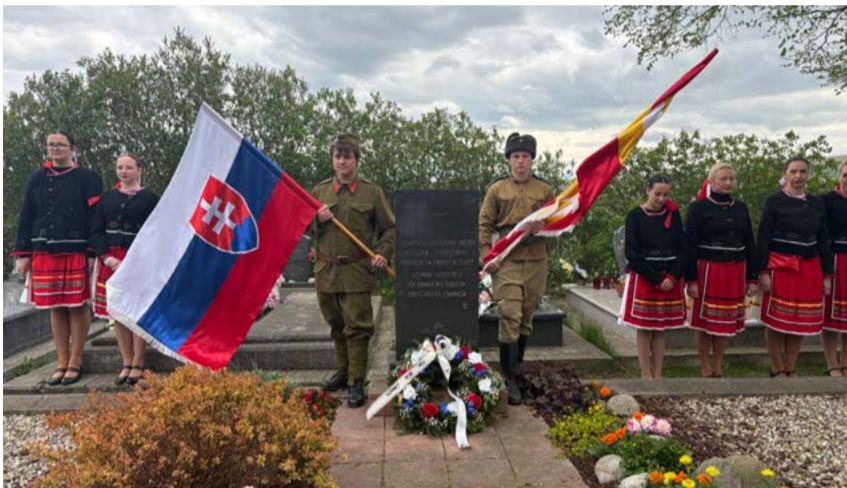
Stráž v dobových uniformách.

Dňa 7. mája 2026 si občania Veľkej Lomnice, žiaci Základnej školy vo Veľkej Lomnici a členovia folklórneho súboru Galganečka pripomenuli 81. výročie ukončenia druhej svetovej vojny pri pomníku padlých partizánov na miestnom cintoríne.