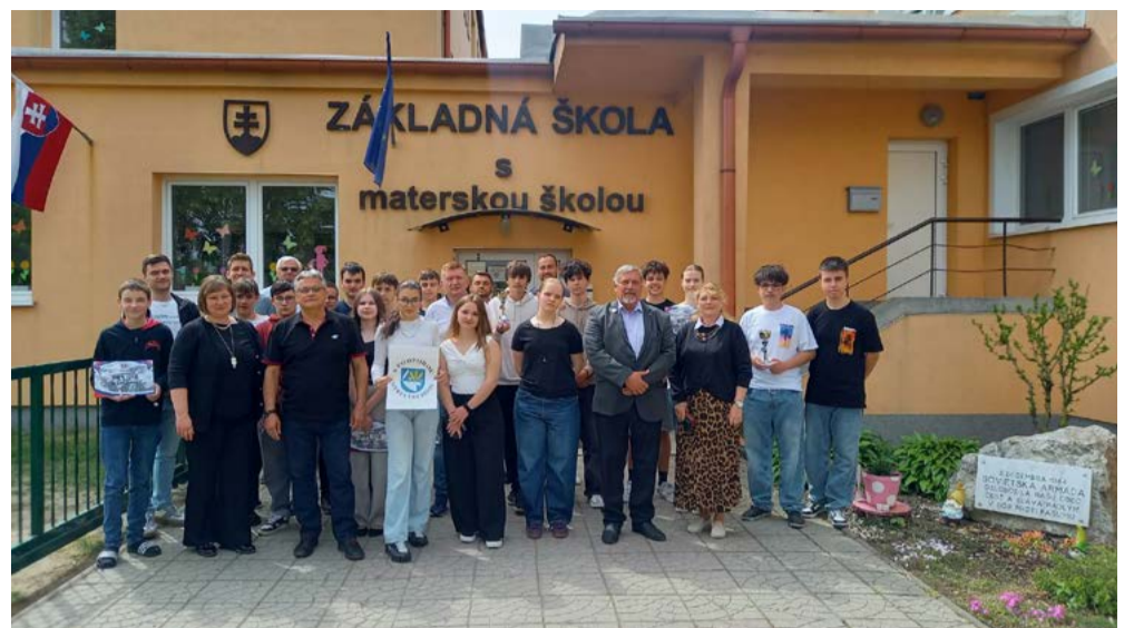
Spoločná snímka účastníkov súťaže v okrese Trebišov.