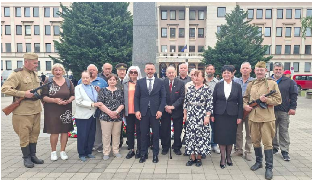
Spoločná fotografia pred pamätníkom v Nitre.

Oblasťná organizácia SZPB Nitra si uctila pamiatku hrdinov pri príležitosti 81. výročia ukončenia 2. svetovej vojny a Dňa víťazstva nad fašizmom položením vencov pri Pamätníku víťazstva pred Okresným úradom v Nitre.