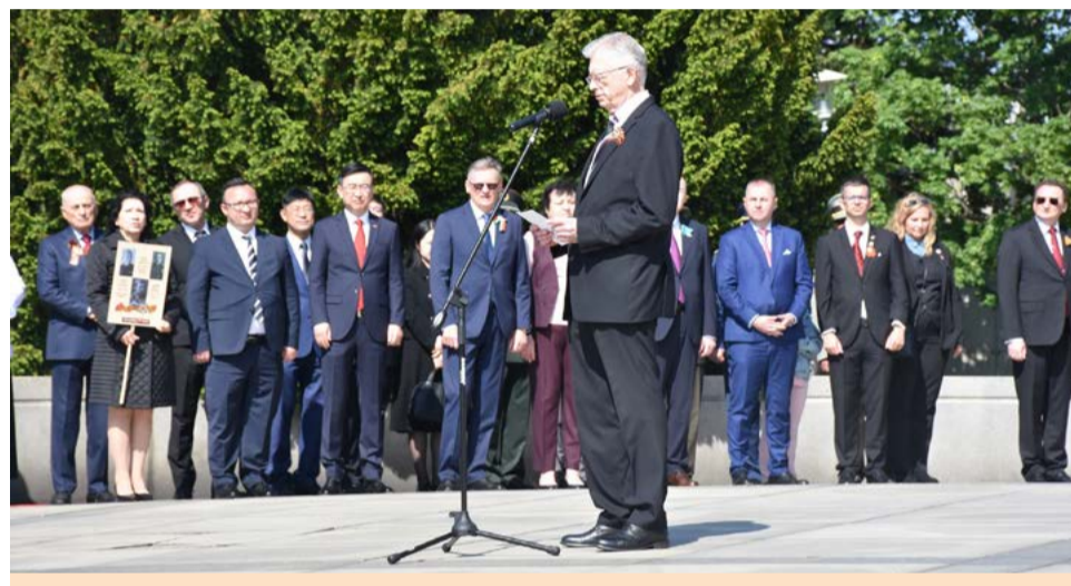
Príhovor ruského veľvyslanca.

Po skončení oficiálneho programu sa účastníci zapojili do tradičného pochodu Nesmrtný pluk, ktorým si pripomenuli svojich príbuzných a predkov bojujúcich počas druhej svetovej vojny. Pochod sa stal symbolickým vyjadrením úcty generácii víťazov a nadviazal na dlhoročnú tradíciu osláv Dňa víťazstva.