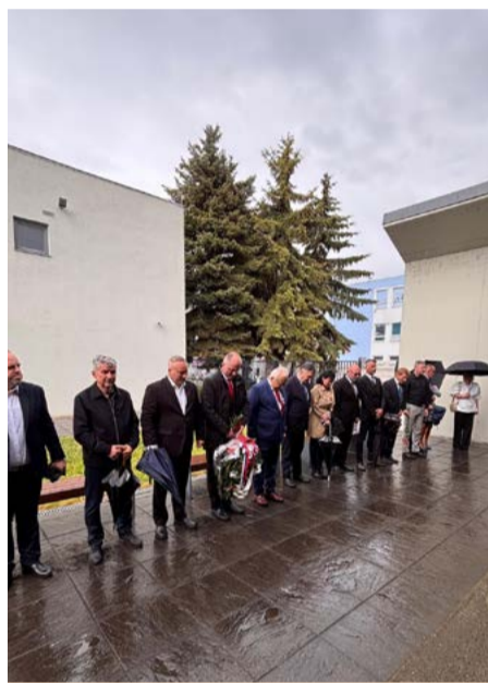
Pietny akt v Bardejove.

Češ' ich pamiatke! text a foto: Jozef Guliga