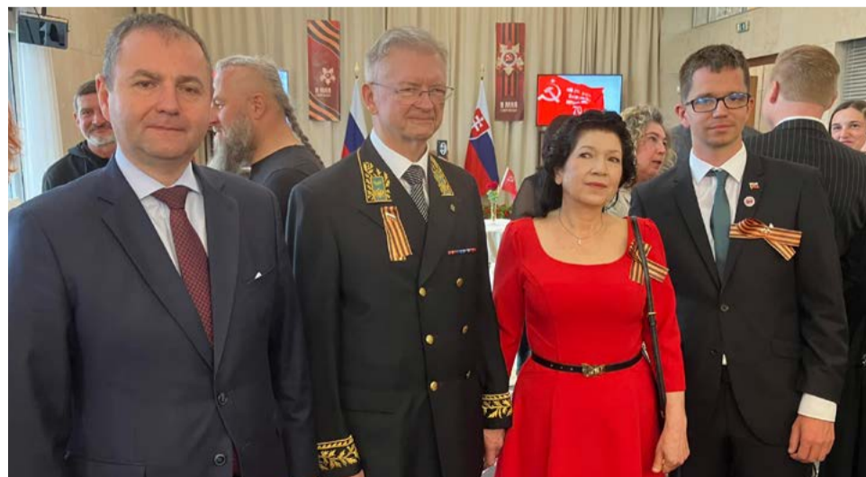
Delegácia SZPB s veľvyslancom RF.