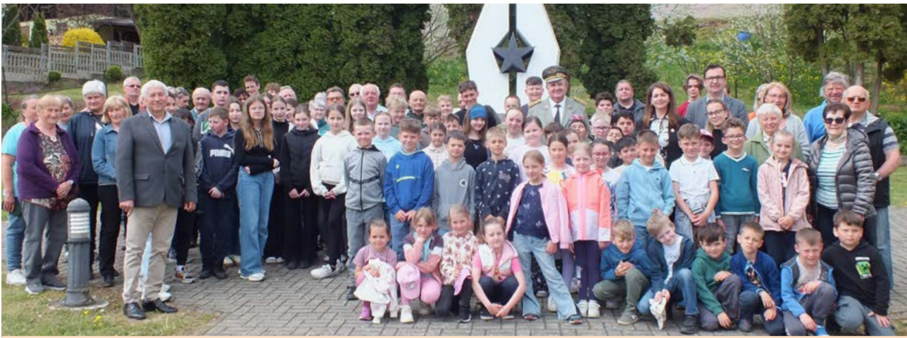
Skupinová snímka účastníkov.