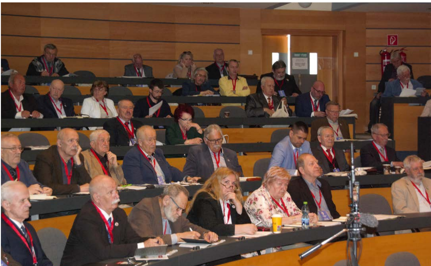
Pohľad na delegátov zjazdu.