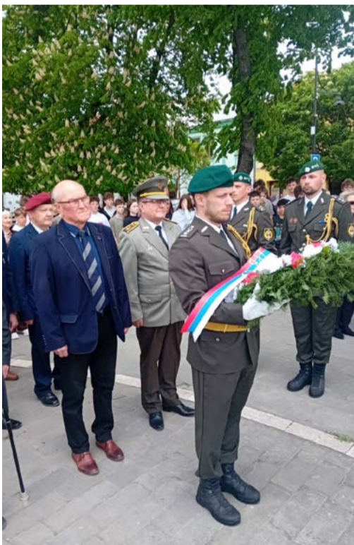
Pietny akt v Sabinove.

Mesiac máj každoročne prináša členom a sympatizantom Slovenského zväzu protifašistických bojovníkov príležitosť dôstojne si pripomenúť ukončenie druhej svetovej vojny, koniec ľudského utrpenia a obrovských materiálnych škôd, ktoré vojna spôsobila.