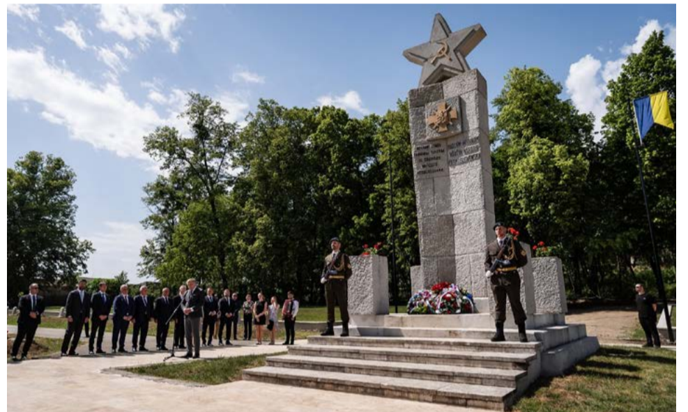
Prejav predsedu vlády SR Roberta Fica

text a foto: Úrad vlády SR a mesto Michalovce