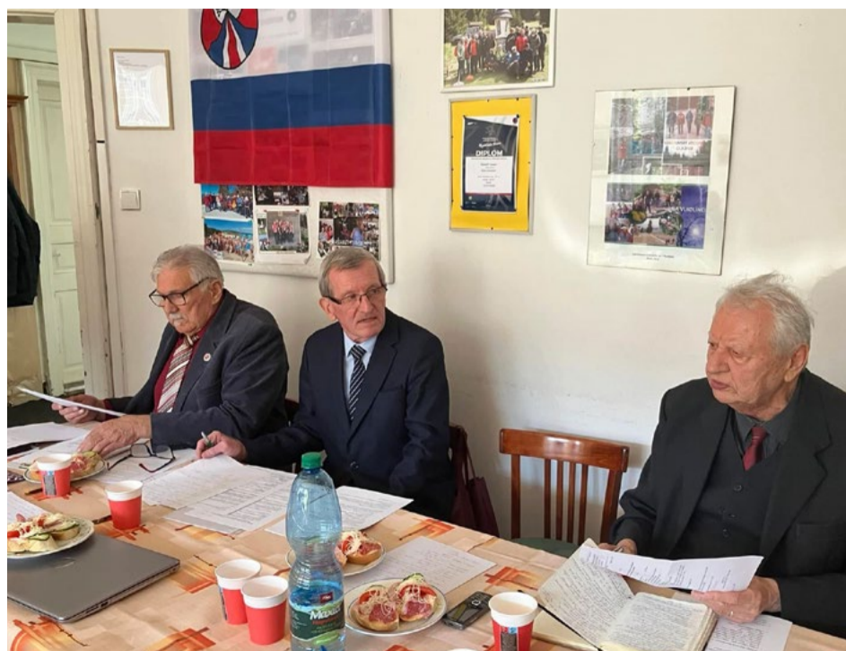
Pohľad na predsednícky stôl.