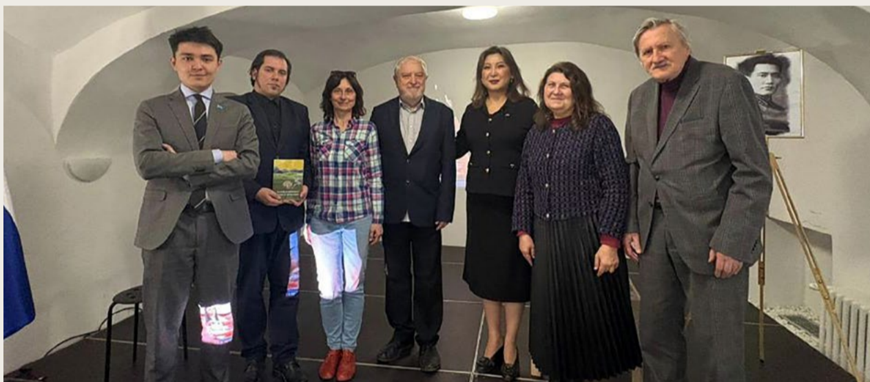
Spoločná fotografia s kazašskou veľvyslankyňou.