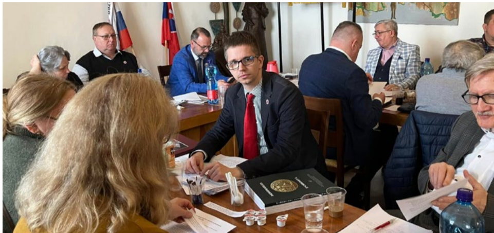
Pohľad na delegátov konferencie.

V Bratislave, v sídle Slovenského zväzu protifašistických bojovníkov, sa 10. marca 2026 konala oblasťná konferencia Slovenského zväzu protifašistických bojovníkov Bratislava. Mimoriadna oblasťná konferencia prebehla, až na drobné technické detaily, riadne, tak, ako bola naplánovaná, dokonca lepšie, ako viacerí kувici predpokladali. Rokovanie sa nieslo v striedmom a vecnom duchu, bez zbytočných fanfár, osláv či umeleckých vložiek.