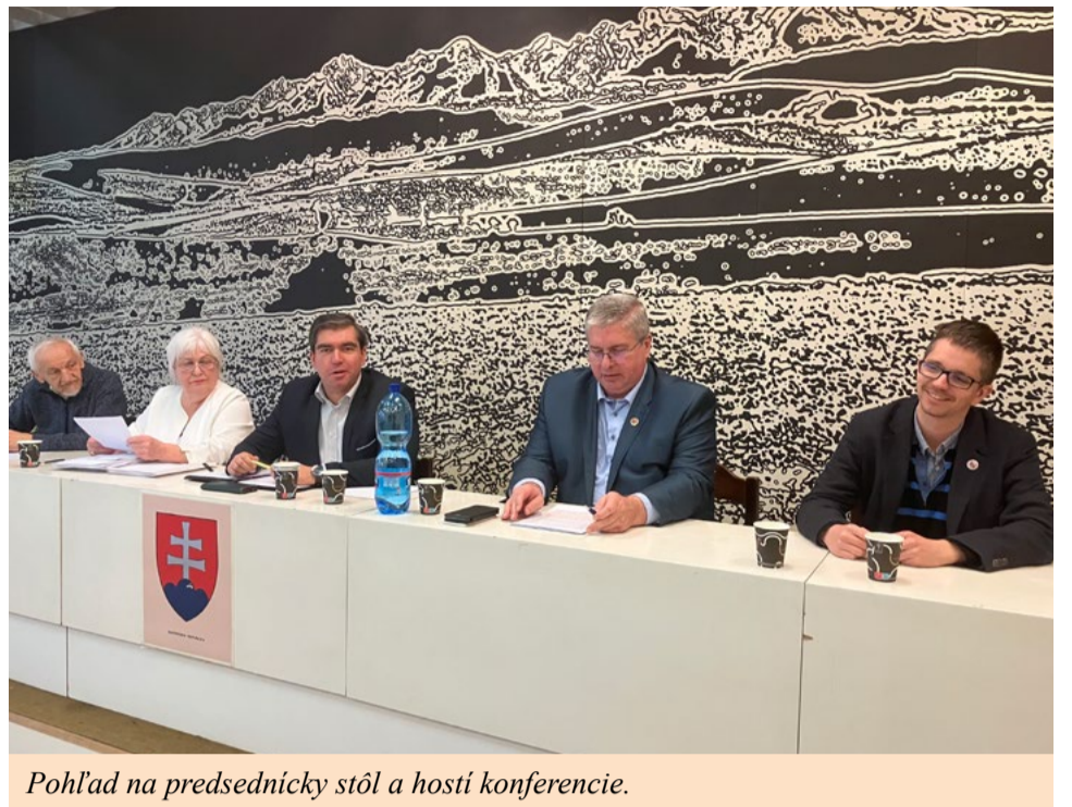
Pohľad na predsednícky stôl a hosti konferencie.