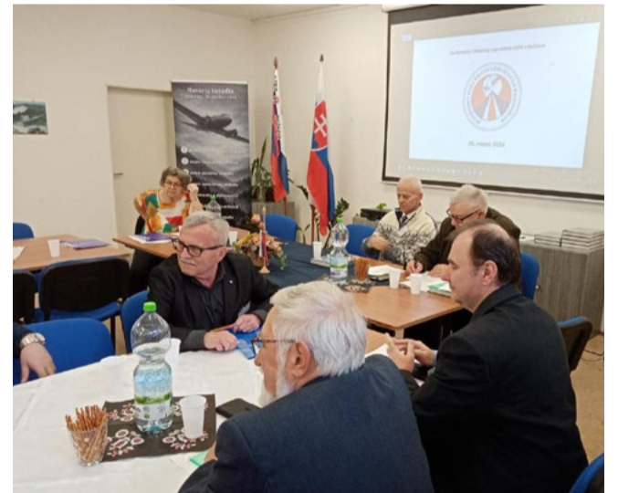
Rokovanie oblasťnej konferencie.