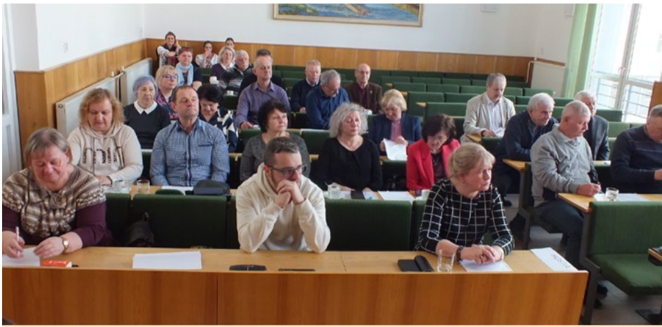
Účastníci oblasťnej konferencie.

V Starej Ľubovni sa vo veľkej zasadačke Okresného úradu zišlo dňa 21. marca 2026 celkovo 86 % delegátov zvolených na výročných členských schôdzach základných organizácií SZPB na oblasťnej konferencii, ktorej hlavným cieľom bolo prerokovať úlohy pred XIX. mimoriadnym zjazdom Slovenského zväzu protifašistických bojovníkov.