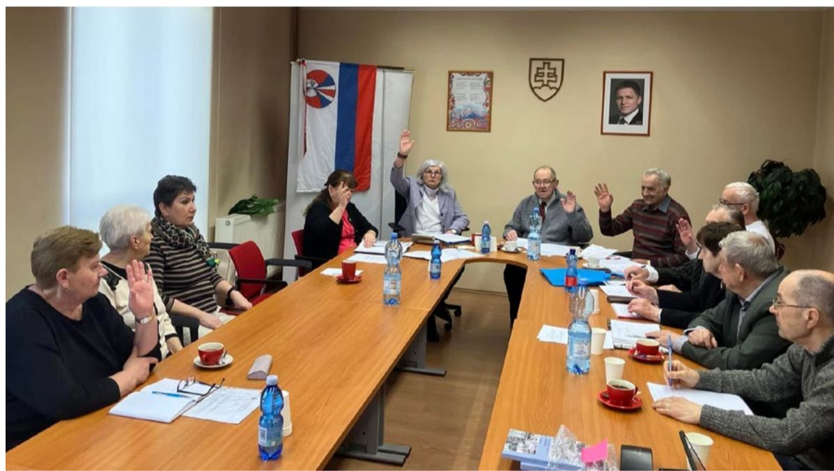
Hlasovanie počas konferencie v Nitre.