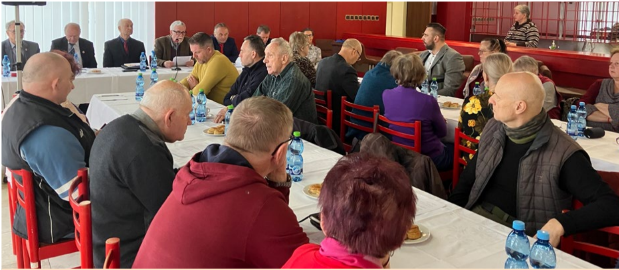
Pohľad na delegátov, v pozadí predsednícky stôl.