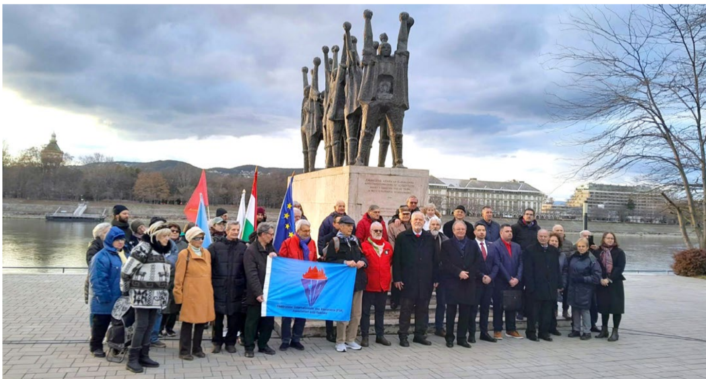
Spoločná fotografia delegácie MEASZ a FIR pri príležitosti 81. výročia oslobodenia Budapešti.