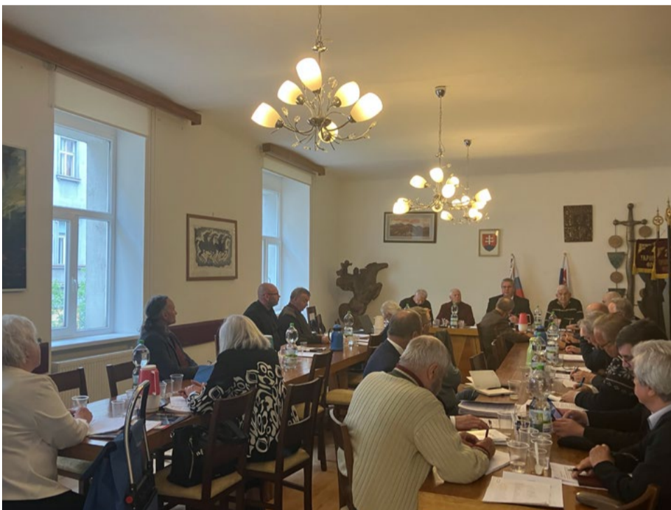
Pohľad na rokovanie Ústrednej rady SZPB oslobodenia Budapešti.