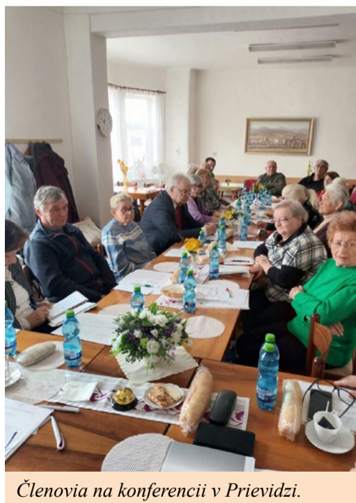
Členovia na konferencii v Prievidzi.