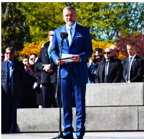
Prezident SR Peter Pellegrini.