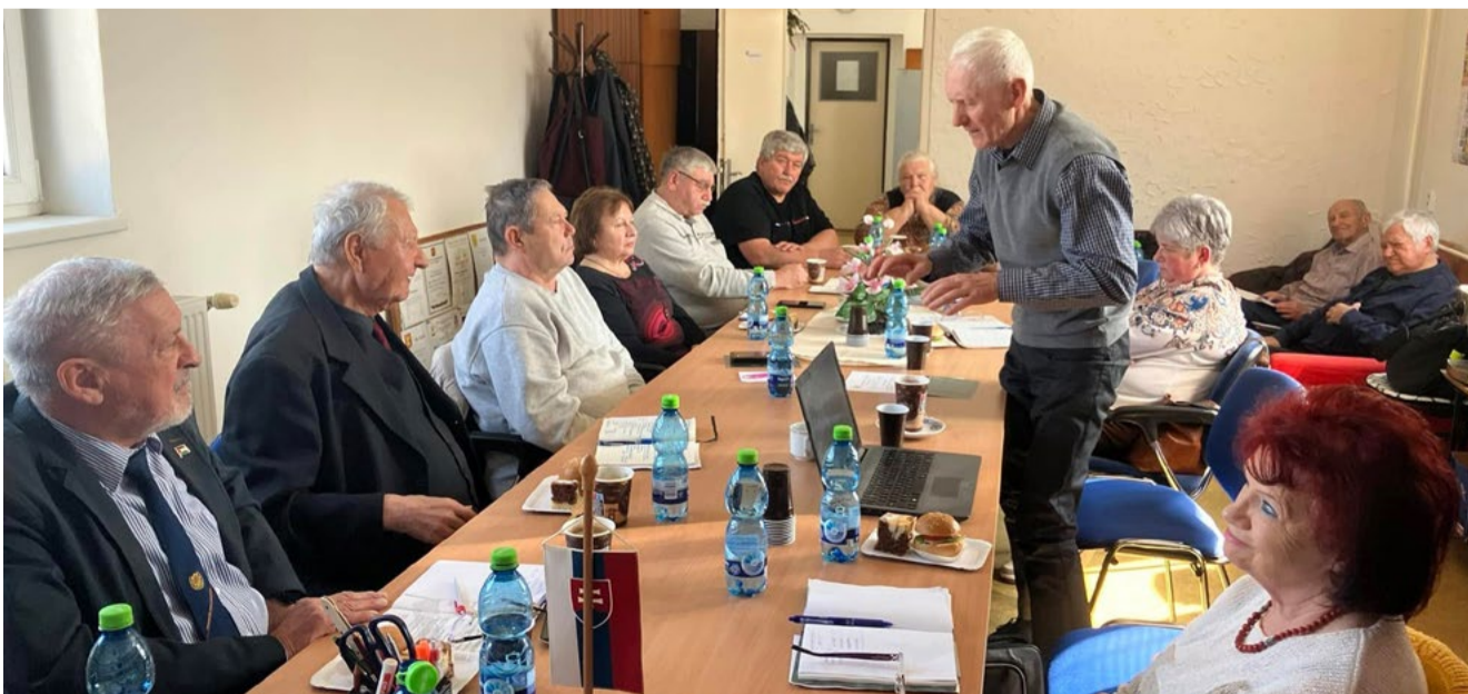
Diskusia delegátov konferencie.