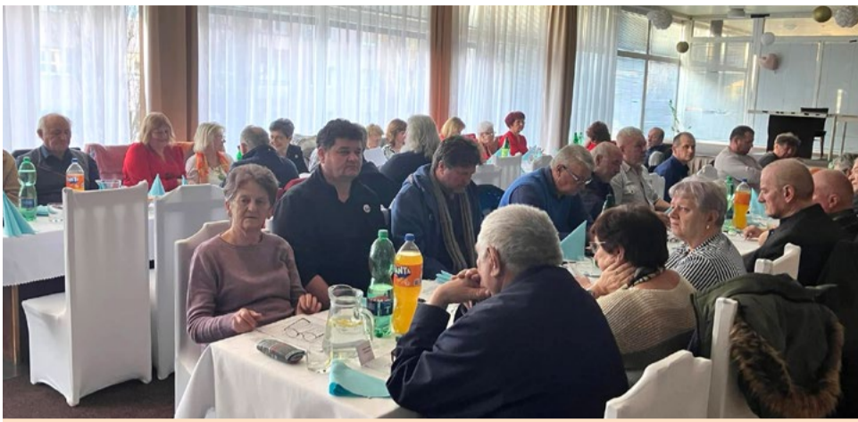
Delegáti oblastnej konferencie v Lučenci.