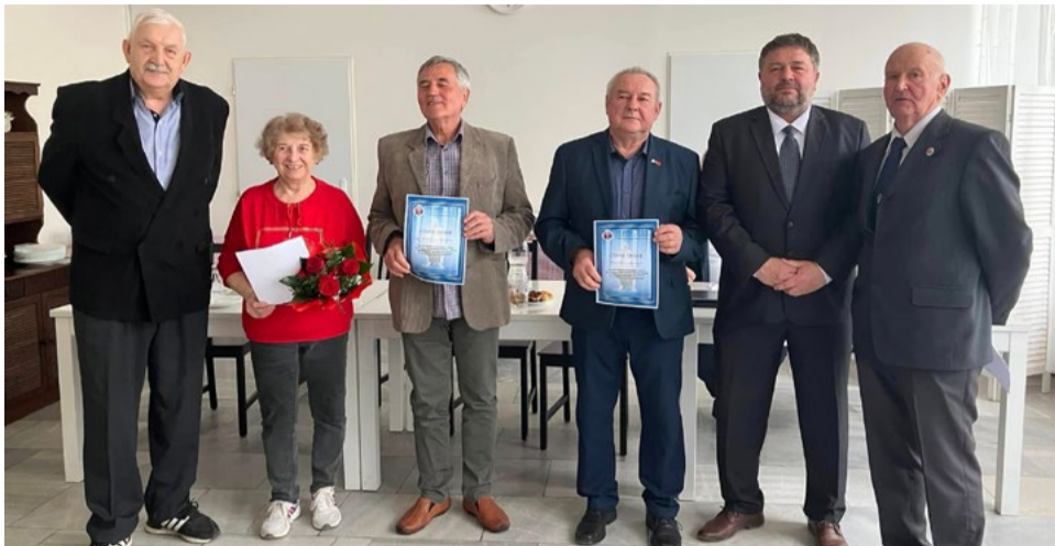
Ocenení zaslúžilí členovia ObIO SZPB Levice.

Dňa 16. marca 2026 sa uskutočnila oblastná konferencia Slovenského zväzu protifašistických bojovníkov v Leviciach. Rokovanie sa nieslo v znamení bilancovania činnosti, otvorenej diskusie o situácii v zväze a prípravy na blížiaci sa mimoriadny zjazd.