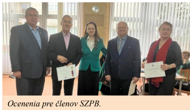
Ocenenia pre členov SZPB.