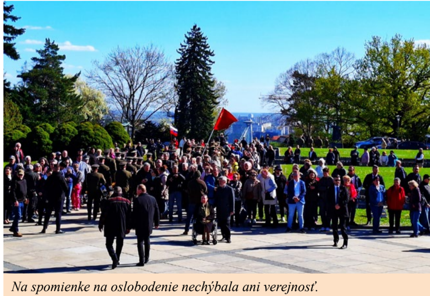
Na spomienke na oslobodenie nechýbala ani verejnosť.