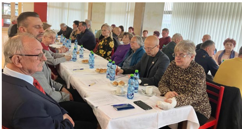
Pohľad na delegátov - členov základných organizácií SZPB v rámci Oblo Trenčín.