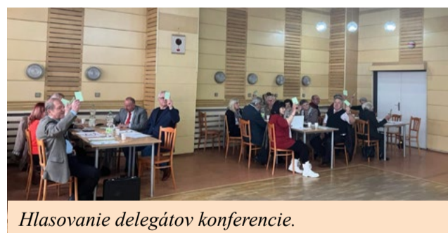
Hlasovanie delegátov konferencie.

Dňa 17. marca 2026 sa v Prešove uskutočnila oblastná konferencia Slovenského zväzu protifašistických bojovníkov, na ktorej delegáti zhodnotili činnosť oblastnej organizácie za uplynulé obdobie a rokovali o jej ďalšom smerovaní.