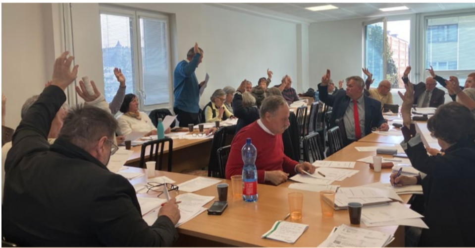
Hlasovanie dopadlo jednoznačne.

Dňa 18. marca 2026 sa v budove Okresného úradu Zvolene konala oblasťná konferencia SZPB vo Zvolene. Tá sa niesla v znamení otvorenej diskusie o stave organizácie, jej činnosti aj problémoch, ktoré vyvrcholili po XVIII. zjazde.