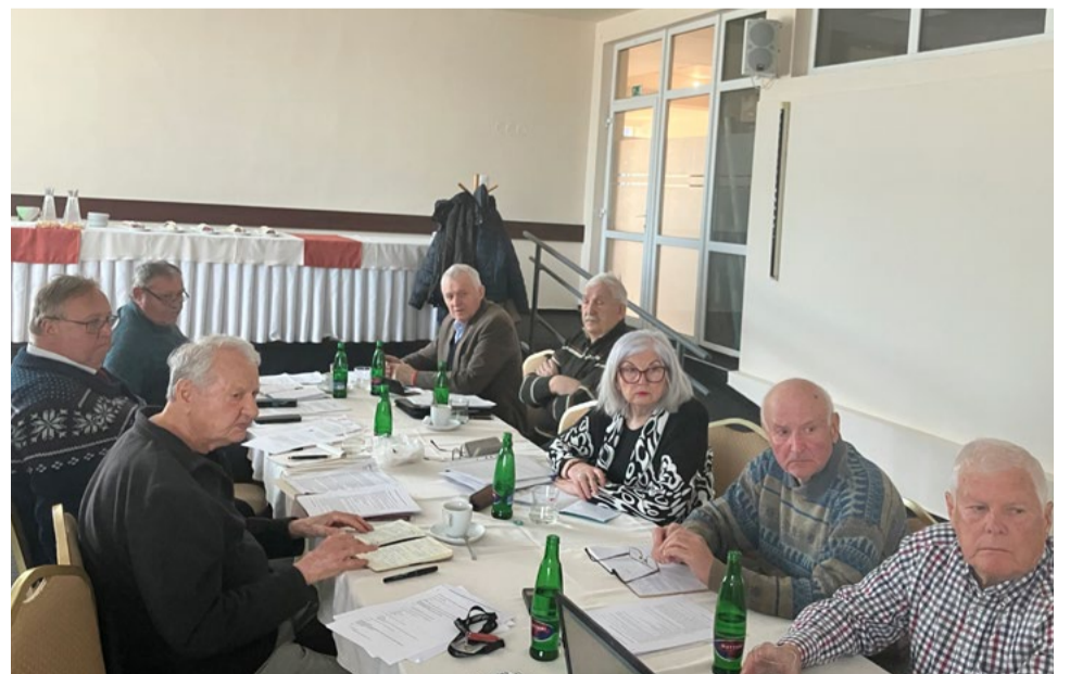
Z rokovania Predsedníctva ÚR SZPB v Banskej Bystrici.