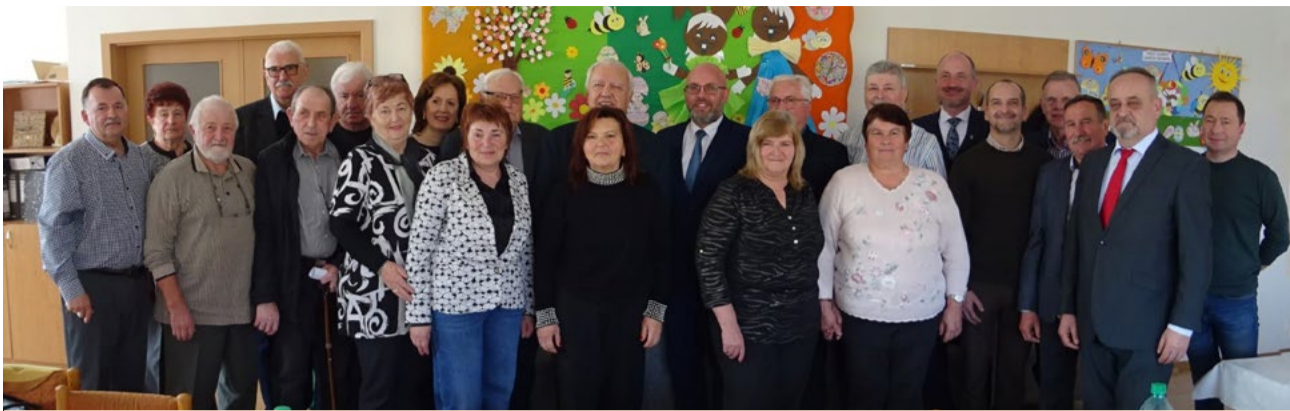
Účastníci konferencie na spoločnej fotografii.