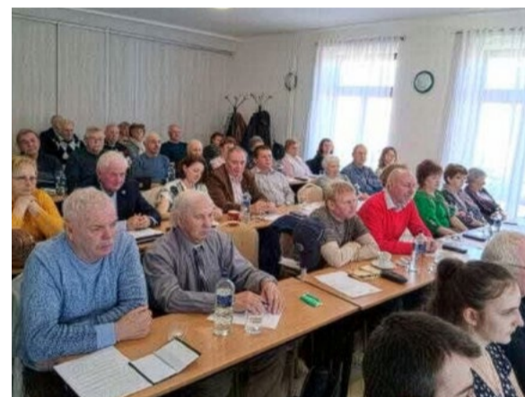
Pohľad na plénum konferencie.