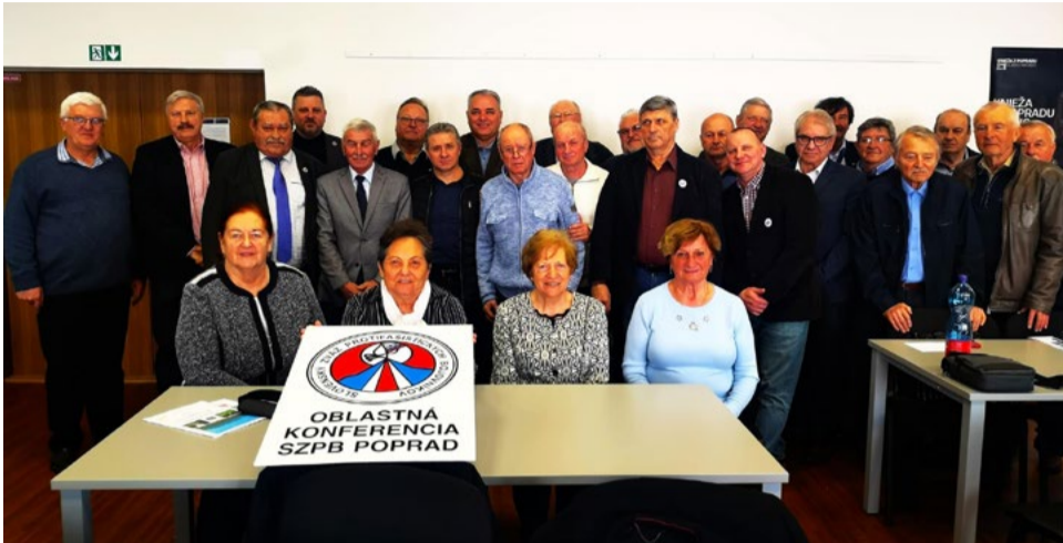
Spoločná fotografia delegátov po skončení konferencie.