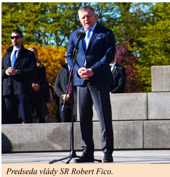
Predseda vlády SR Robert Fico.