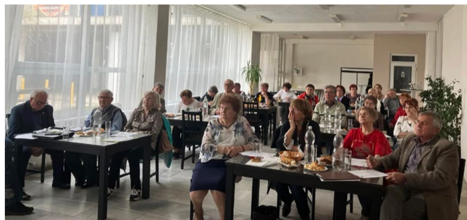
Pohľad na účastníkov konferencie.