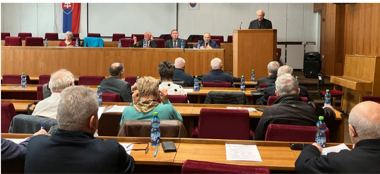
Celkový pohľad na rokovaciu sálu oblasťnej konferencie.