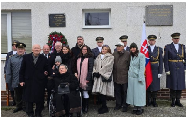
Spoločná fotografia účastníkov akcie.

Čeť jeho pamiatke. text a foto: Richard Zimányi