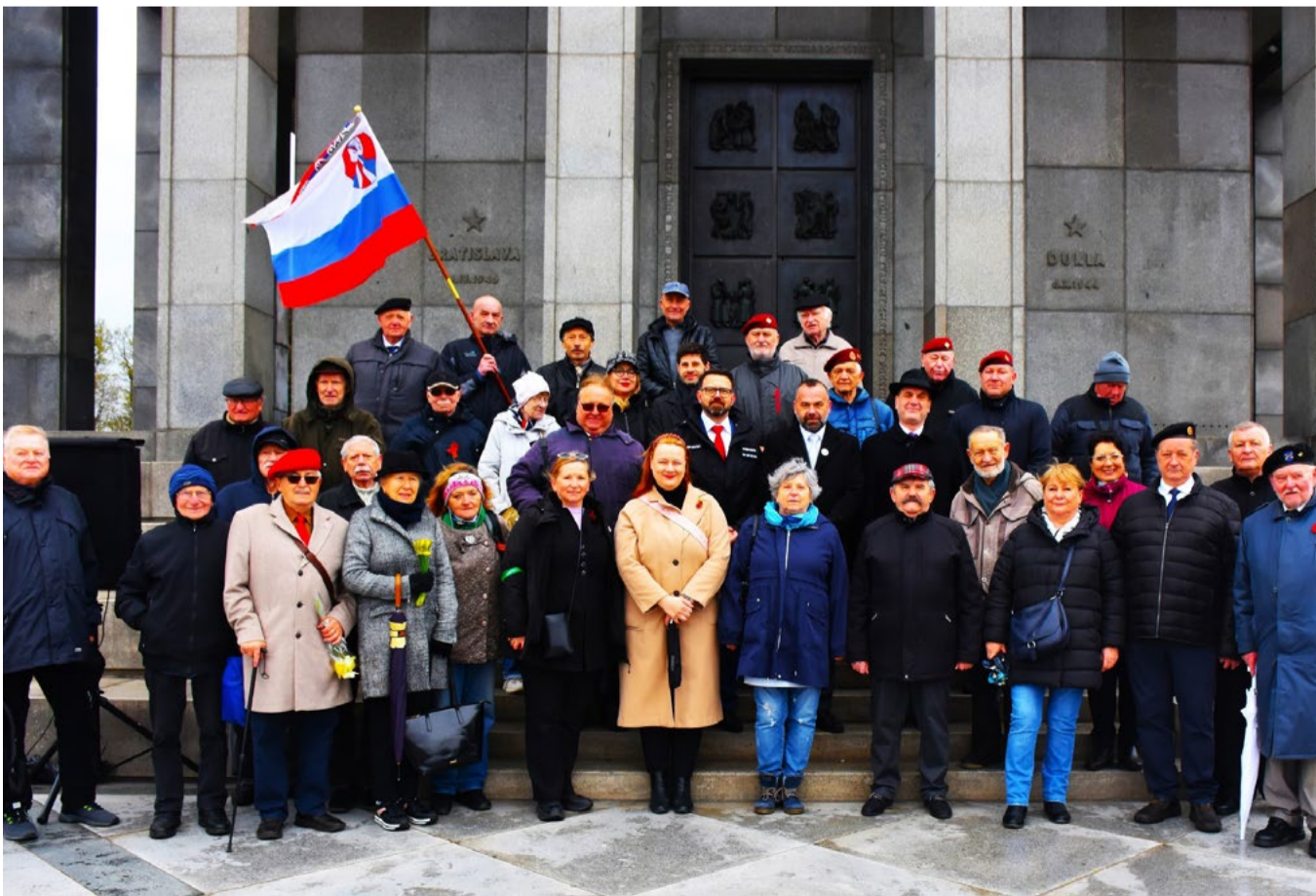
Členovia SZPB pred Slavínom.

Za nepriaznivého počasia sme sa 2. apríla 2026 stretli na Slavíne, aby sme si pripomenuli 81. výročie oslobodenia hlavného mesta Slovenska slávnou Červenou armádou v súčinnosti s Rumunskou kráľovskou armádou.