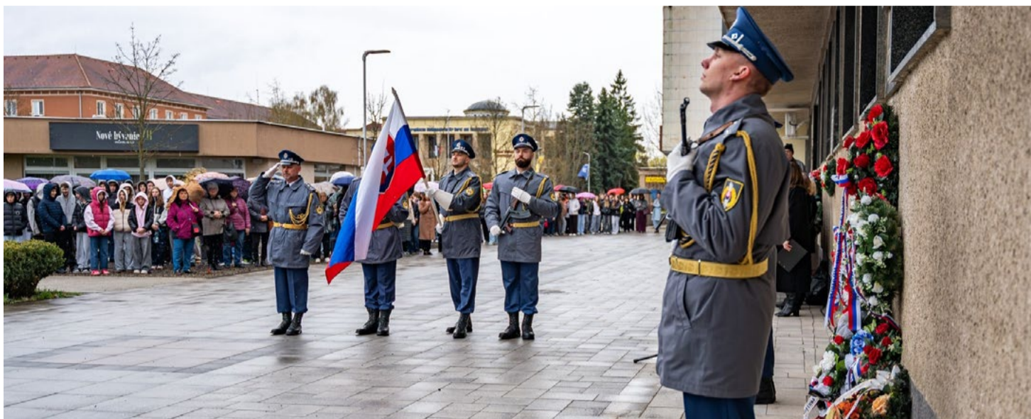
Vysokú účasť na pietnom zhromaždení neodradil ani dážď.

Každá obec, každé mesto má svoje veľké historické medzníky. Pre mesto Žiar nad Hronom v 20. storočí je jedným z nich oslobodenie bývalého mestečka Svätý Kríž nad Hronom od nemeckých okupantov.