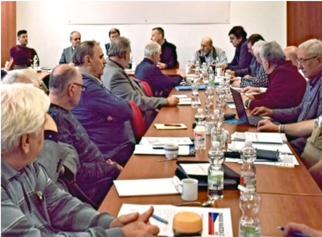
Zo zasadnutia ÚV ČSBS.

Pred Českým zväzom bojovníkov za slobodu v nadchádzajúcom období stoja úlohy nielen dodržiavať historické tradície a pamiatku na protinacistický a protifašistický odboj, ale tiež vysvetľovať aktuálne aspekty národnej a štát-