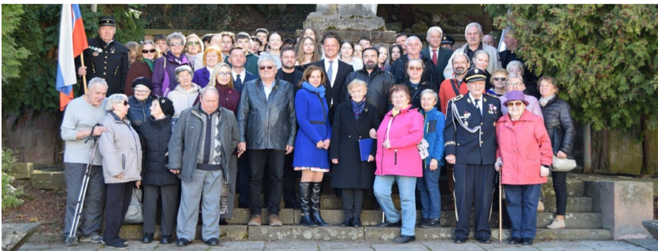
Spoločná fotografia členov SZPB pred pamätníkom v Banskej Štiavnici.

Z archívnych materiálov sa dozvedáme, že boje o mesto Banská Štiavnica sa začali 6. marca 1945 ráno o 4.30 hodine útokom vojakov Červenej armády z 2. ukrajinského frontu maršala Malinovského, zloženého zo 110. gardovej streleckej divízie, 227. samohybnej delostreleckej divízie a 18. motorizovanej divízie. Z juhu, od Ilije a Štefultova, postupovali vojaci Rumunskej kráľovskej armády.