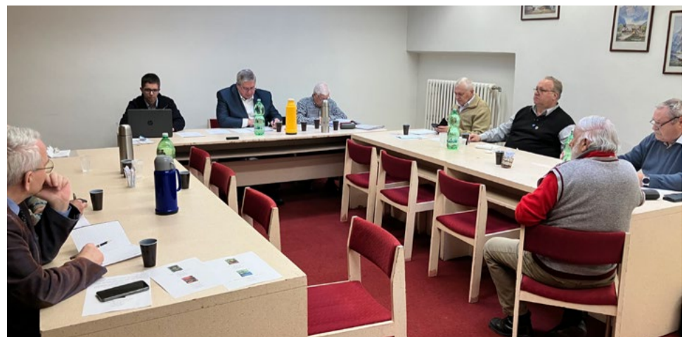
Rokovanie Predsedníctva ÚR SZPB v Poprade.