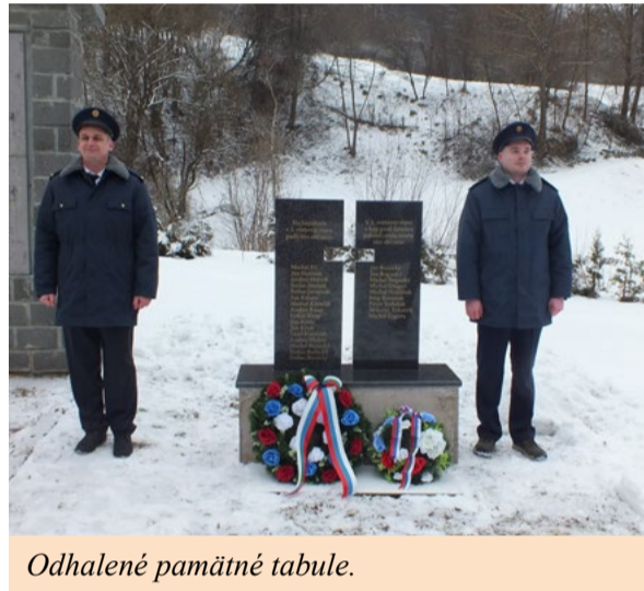
Odhalené pamätné tabule.

text : Václav Homišan