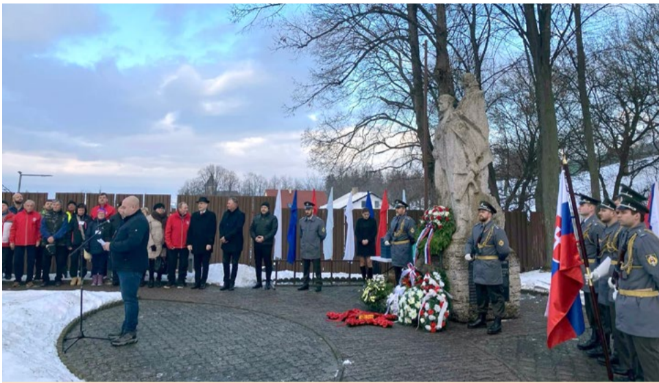
Slávnostné zhromaždenie v Cigeli.

Dňa 17. januára 2026 sa v obciach Cigel a Handlová uskutočnil jubilejný 50. ročník Pochodu vďaka SNP, jedného z najvýznamnejších turisticko-spmienkových podujatí na Slovensku. Podujatie je každoročne venované pamiatke udalostí z januára 1945, keď nemecké trestné jednotky prepadli obec Cigel za pomoc partizánom počas Slovenského národného povstania.