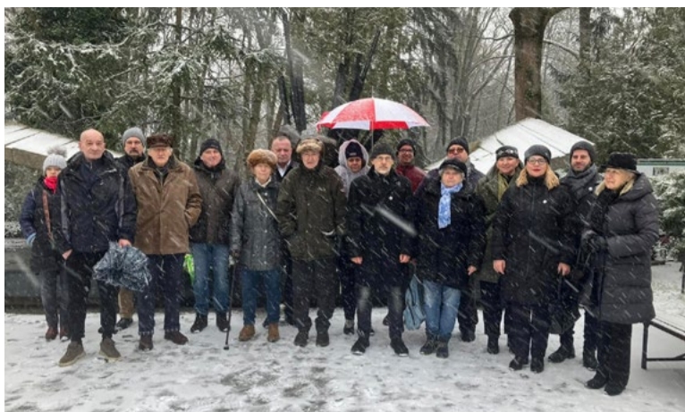
Účastníci spomienky pred pamätníkom.