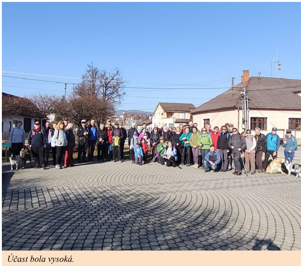
Účast bola vysoká.

Stalo sa už peknoú tradíciou, že nezabúdame na významné medzníky v histórii našej obce. Pre nás Dobronivčanov je ôsmy marec nielen Medzinárodným dňom žien, ale aj Dňom slobody, kedy našu obec v roku 1945 oslobodili vojská Červenej armády a Rumunskej kráľovskej armády.