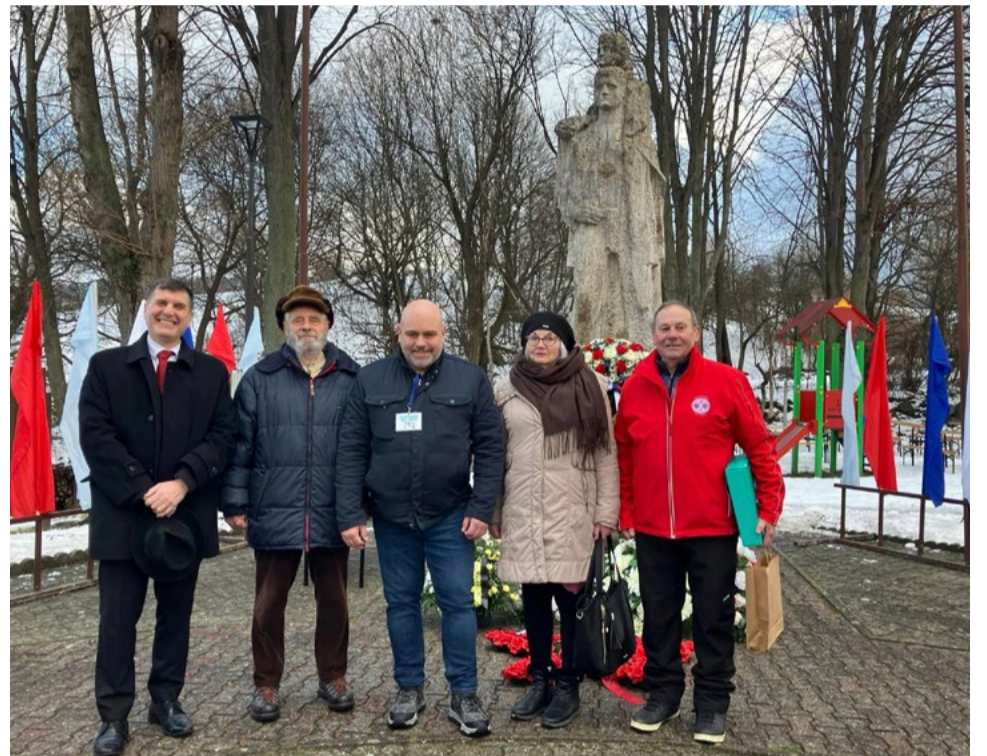
Členovia ÚR SZPB so starostom obce.