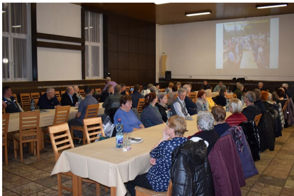
Pohľad na účastníkov schôdze.