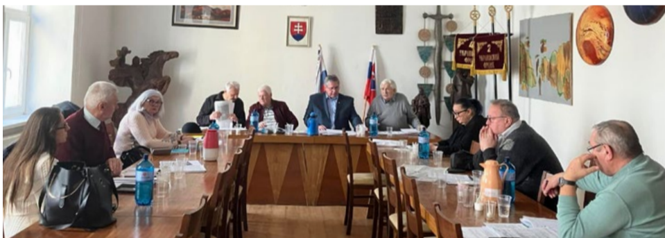
Rokovanie Predsedníctva ÚR SZPB v Bratislave.

Češť pamiatke všetkých hrdinov a osloboditeľov!