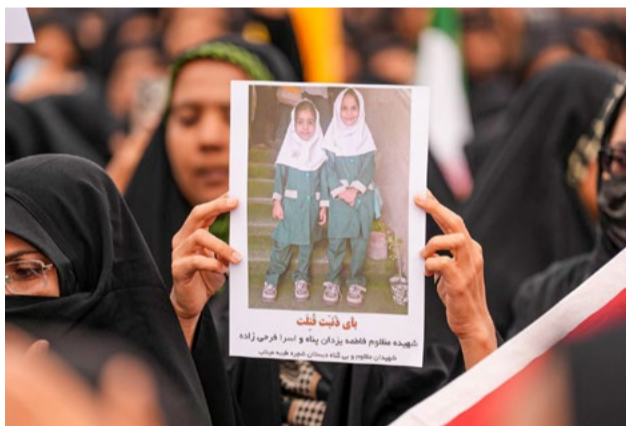
Fotografia dvoch obetí amerického útoku na dievčenskú školu v iránskom Minábe.

Berúc do úvahy porušovanie tzv. Minských dohôd, obmedzovanie ruských menšinových práv na Ukrajine, ale najmä intenzívnu prípravu Ukrajiny na členstvo v NATO, ktorého doktrína označuje Rusko za hlavného nepriateľa, podľa Netanjahuovej a Trumpovej „logiky“