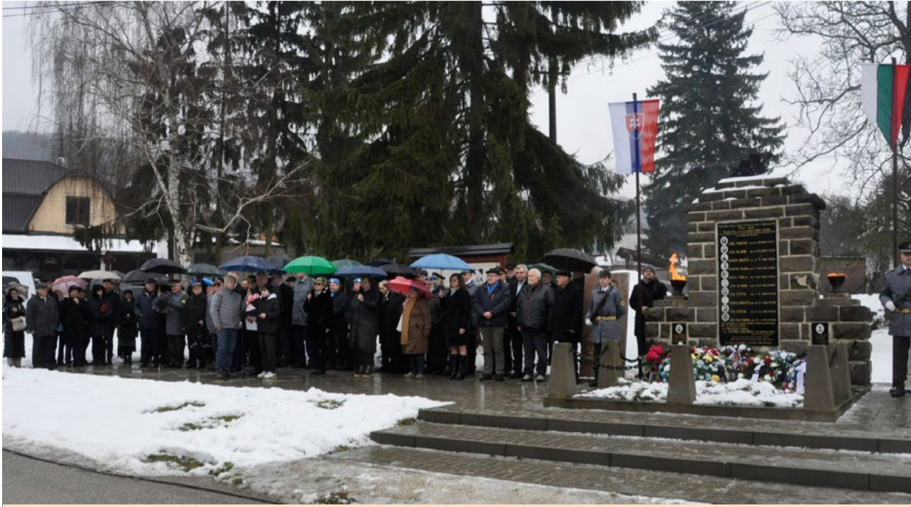
Spomienkové zhromždenie v Cetune.

V Cetuni (obec Bzince pod Javorinou) sme si 22. februára 2026 pripomenuli 81. výročie jedného z najťažších bojov partizánov v kraji pod Javorinou – Cetunského boja z 27. februára 1945. Spomienkové podujatie bolo dôstojným pripomenutím odvahy partizánov oddielu Hurban i utrpenia miestneho obyvateľstva, ktoré sa ocitlo v centre bojových udalostí na sklonku druhej svetovej vojny.