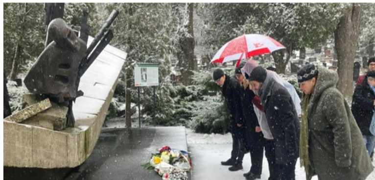
Spomienke nezabránilo ani sneženie.

Devätnásteho februára 1945 spojeneckí letci na stíhačkách v štyroch vlnách rozstrieľali konvoj neoznačených nákladných áut, ktorý vyzeral ako presun jednotiek Wehrmachtu.