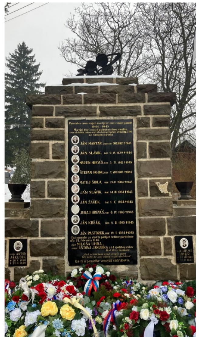
Pamätník v Cetune.

text: Ján Rohár