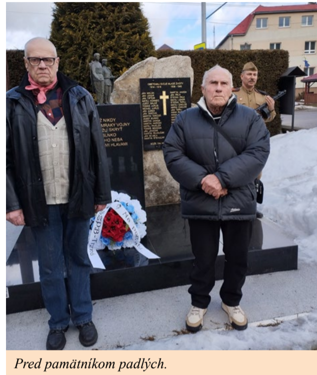
Pred pamätníkom padlých.