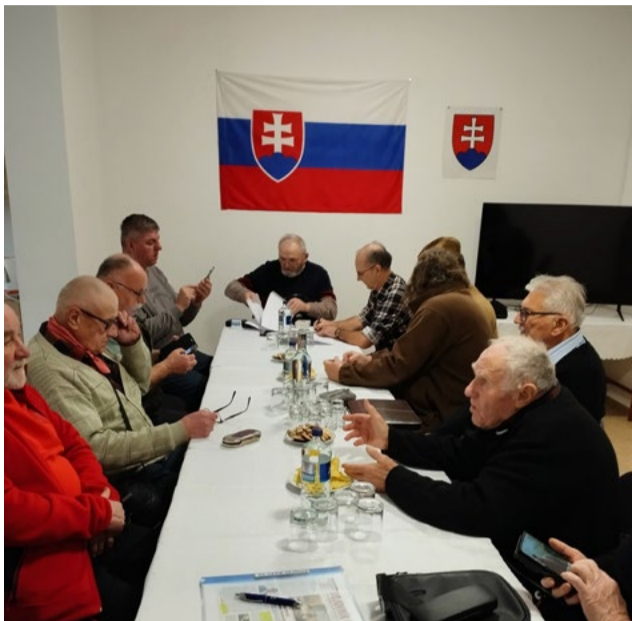
Rokovanie schôdze ZO.

Prešiel takmer mesiac od oslobodenia Vitanovej Červenou armádou, keď 23. februára 1945, v Deň sovietskej armády, zaútočili nemeckí vojaci na obranné postavenia sovietskych jednotiek v obci Vitanová. Červenoarmejci prvotný nápor zachytili, no Nemci napriek tomu vnikli do obce. Prešli cez zamrznutú rieku Oravicu a začalo sa besnenie. Strieľali na všetko, čo sa pohlo, a plameňometmi podpaľovali drevenice, hospodárske budovy, ale aj ľudí a dobytok v nich. Popolom lahla takmer celá obec.