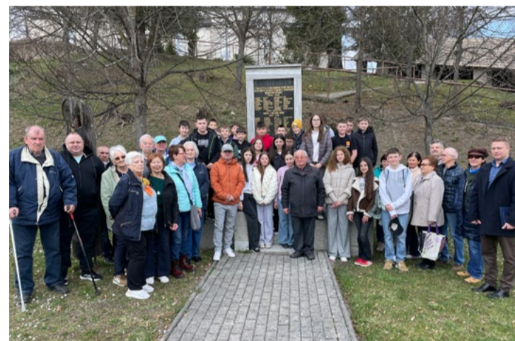
Spoločná fotografia pred pamätníkom.

text a foto: Karol Uhrík, predseda ZO SZPB v Brusne