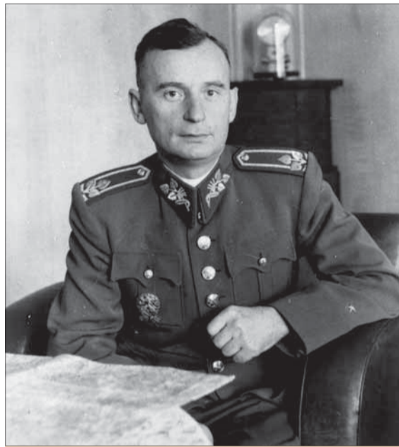
Prvý veliteľ 1. čs. armády brigádny generál Ján Golian.

V Banskej Bystrici, v centre SNP, sa vytvorilo veliteľstvo 1. čs. armády (na konci septembra 1944 bola premenovaná na 1. čs. armádu na Slovensku – pozn. Bojovník). Zámerom jeho velenia bolo brániť