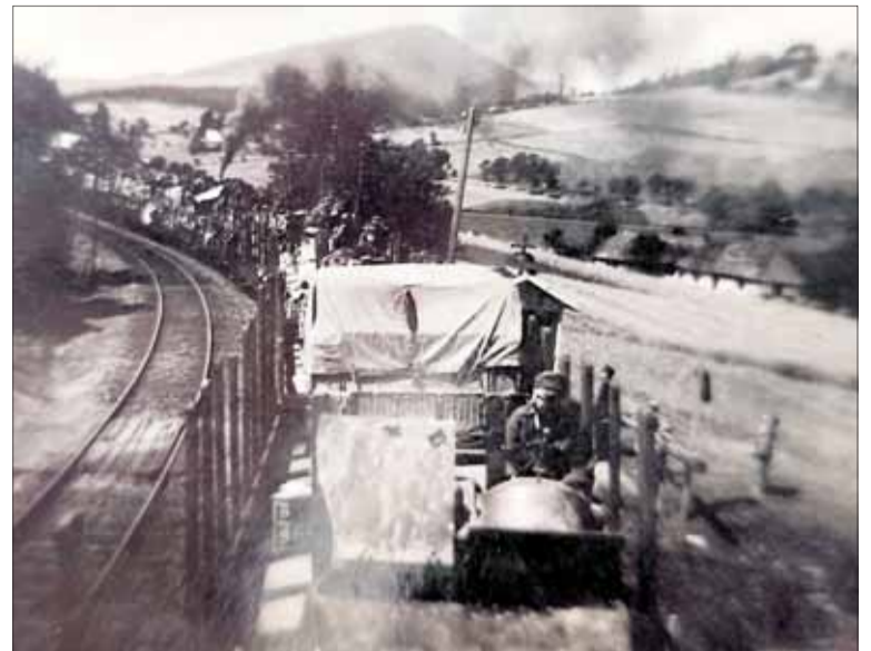
Cesta na východný front. Jún 1941.

Po vypuknutí Povstania sa postavila na odpor nemeckým jednotkám, ktoré prekročili naše hranice a smerovali od Žiliny na Martin cez okolie Strečna. Po ťažkých bojoch, v ktorých sa Nemcom podarilo prebiť cez povstaleckú obranu, veľká časť vojakov sa pridala k partizánskej bojovúcej v horách.