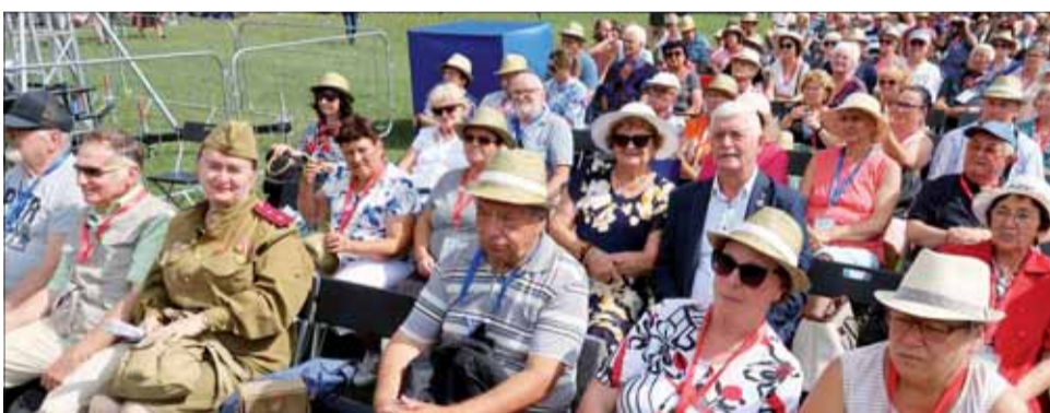
Vidíme členov SZPB z prešovskej a novozámockej oblastnej organizácie.