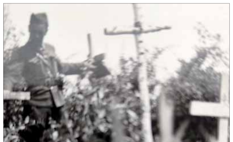
Hroby padlých pri Lipovci.