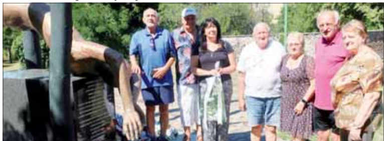
Účastníci pietnej spomienky pri pamätníku.