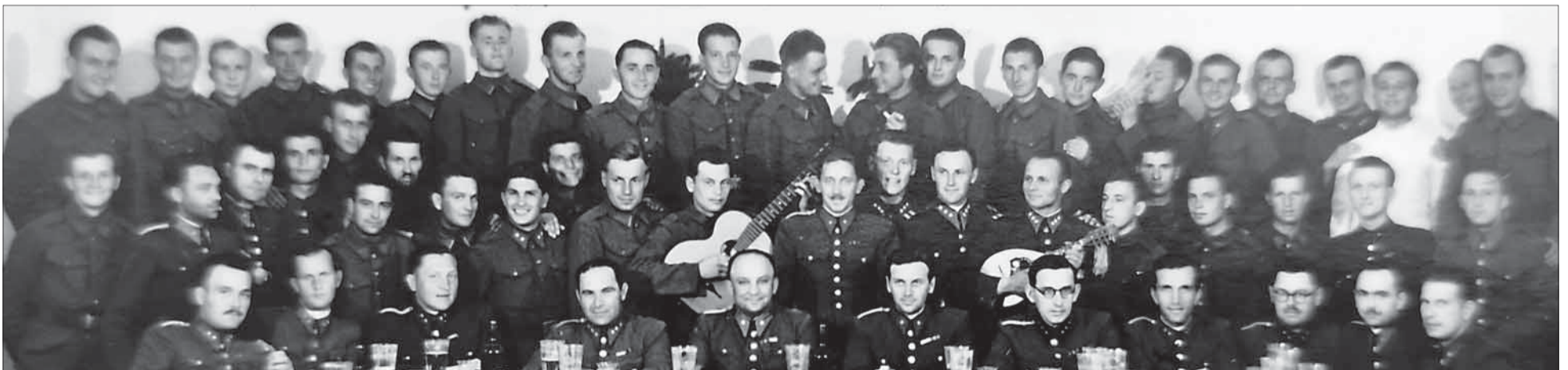
Ukončenie poddôstojníckej školy 1. 7. 1940.