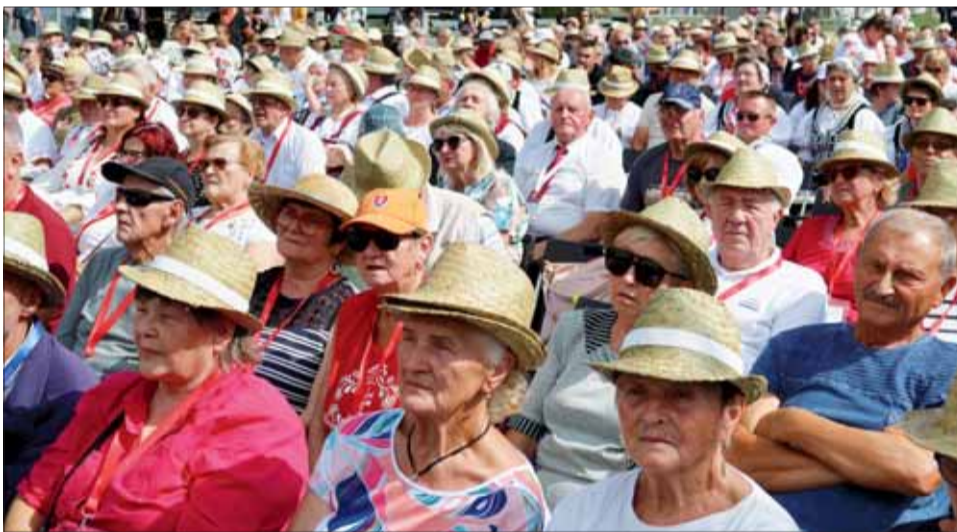
Vidíme členov SZPB zo Španej Doliny.