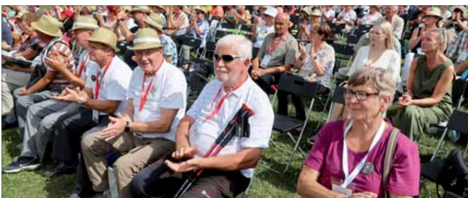
Potlesk od členov SZPB z oblastnej organizácie Brezno.