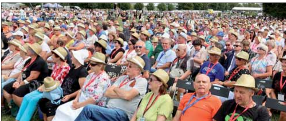
V tejto skupine sú členovia trenčianskej organizácie SZPB.