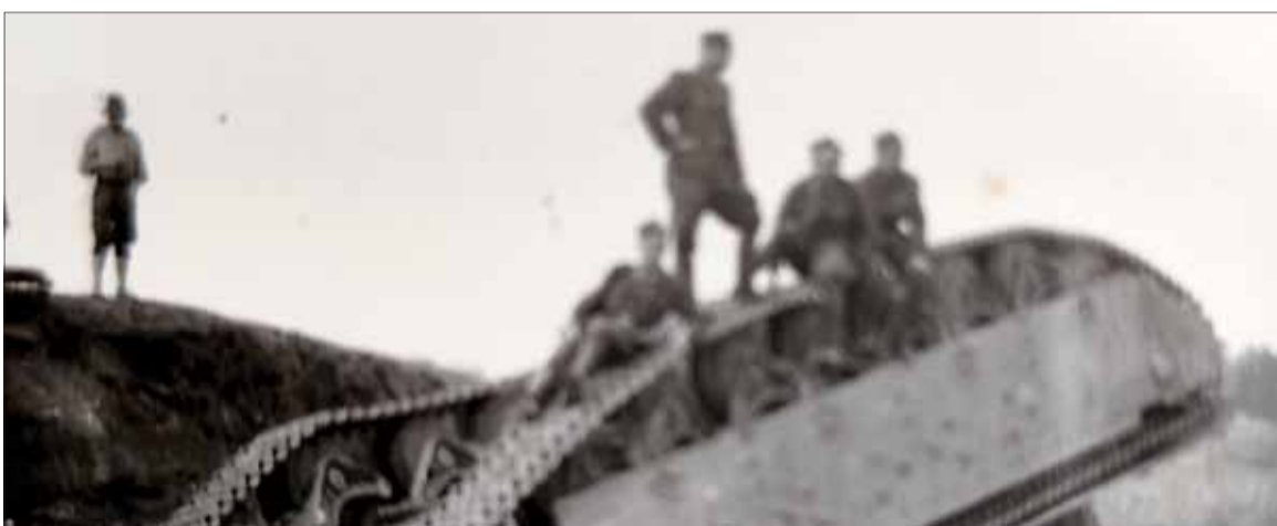
Rok 1941. Sovietsky tank