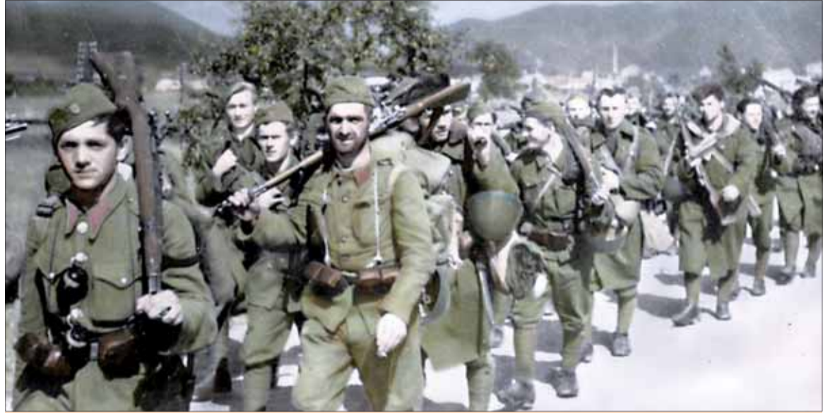
V. taktická skupina Ďumbier. Jej presun na bojisko v Turci.

„Posielam vám a všetkým oddielom, bojujúcim pod vašim vedením, čo najsrdečnejší pozdrav celej československej armády, bojujúcej za hranicami. Tlmočím vám úprimné prianie všetkých, aby vás vo vašom hrdinskom boji sprevádzalo šťastie a aby obeť, ktoré prinesú slovenskí hrdinovia, zaisťovali lepšiu a krajšiu budúcnosť Československej republiky.“