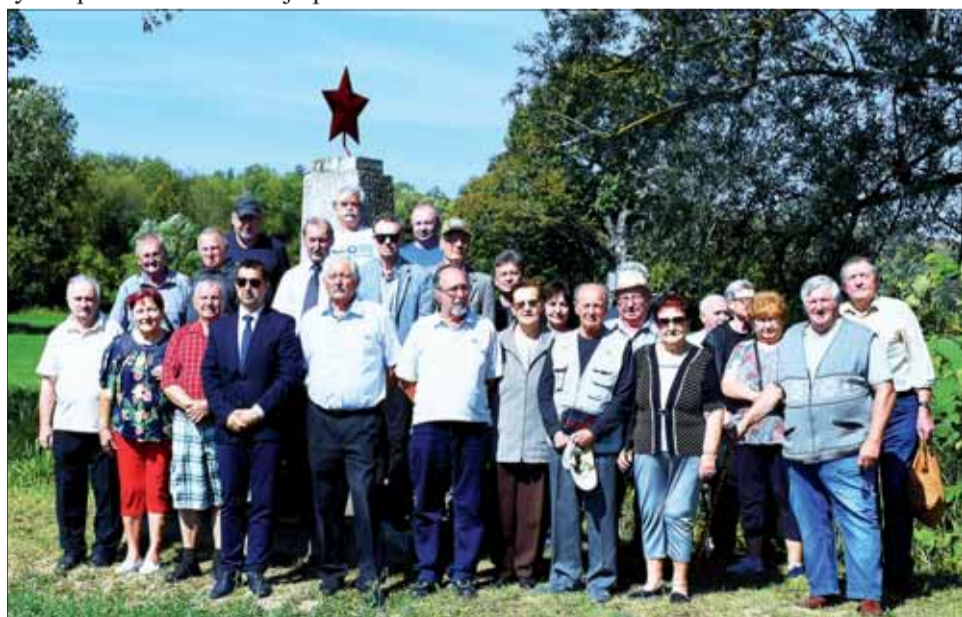
Účastníci osláv na pamätnom mieste zahynutia Ľ. Kukorelliho.