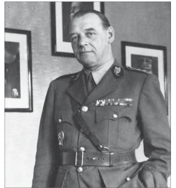
Druhý veliteľ 1. čs. armády a neskôr 1. čs. armády na Slovensku divízny generál Rudolf Viest.

povstalecké územie, na ktorom po vypuknutí povstania žilo cca 1,7 milióna obyvateľov a rozprestieralo sa na ploche 20 000 km 2 , až do príchodu sovietskej Červenej armády.