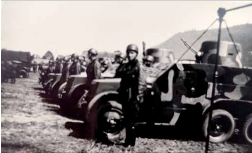
Defilírka v B. Bystrici. Rok 1943.