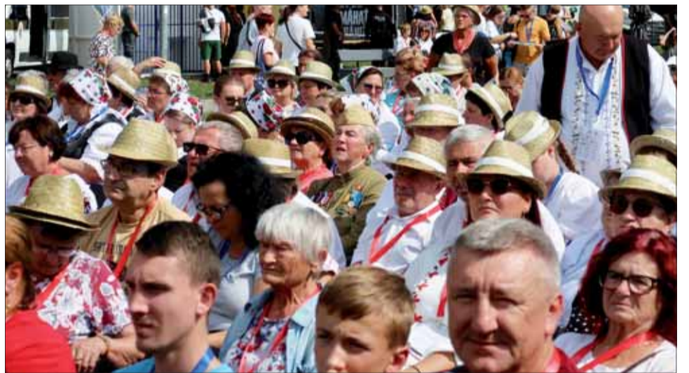
Pohľad na členov lučeneckej oblastnej organizácie SZPB.