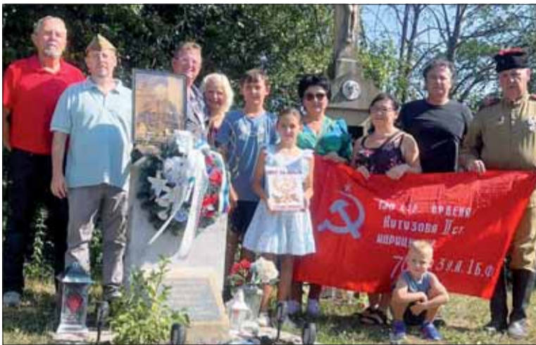
Archívna snímka z minulého leta.