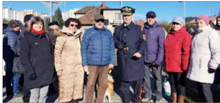
Účastníci pietneho aktu zo SZPB.