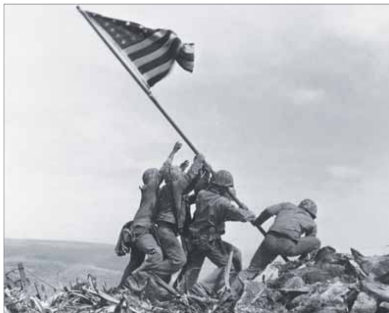
Americkí vojaci vztýčujú vlajku nad Iwodžimou. Jedným z nich je Michael Strank.

Od roku 2023 nesie 65. prieskumný prápor v Prešove čestný názov Prieskumný prápor Michala Stranka. V Starej Ľubovni je zriadená i vojenská expozícia Michala Stranka, ktorá vzdáva pamiatku a hold slávnenému rodákovi zo slovenskej obce Jarabina. Podľa vhu.sk