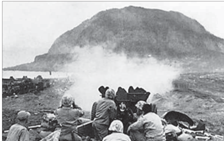
37 mm delo, v pozadí hora Suribači.

va – Suribači – mal za úlohu 28. pluk 5. divízie. Jeho príslušníci 21. februára dosiahli úpäť hory a v priebehu nasledujúceho dňa ju ovládli. 23. februára 1945 sa hliadka z 2. práporu 28. pluku, vedená nadporučikom Haroldom Schrierom, pripravovala na obsadenie vrcholu a vztýčenie zástavy USA. O 10.20 hod. bola zástava vztýčená. Krátko nato pplk. Chandler Johnson, veliteľ 2. práporu