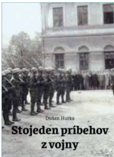
Obal knihy „Stojeden príbehov z vojny“.

Mnohé fotografie či skenované dokumenty sú publikované prvýkrát. Početná je aj obrázková príloha zachytávajúca významné momenty, ktoré sa udiali v Tisovci počas SNP a po ukončení vojny. A to fakty o zničení železničných mostov, viaduktu, zámerné vykoľajenie lokomotívy s vagónmi, ale aj opravy a výstavba tunelov a ciest. Kniha obsahuje veľké množstvo faktografických údajov a tiež zoznamy padlých, popravených, nezvestných a umučených hrdinov.