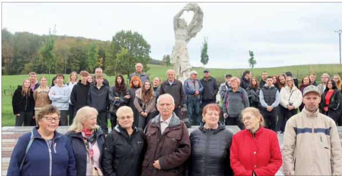
Účastníci zájazdu pri pamätníku.

Tokajík bol vypálený, zhorlo všetkých 27 domov, zostal len gréckokatolícky chrám a zvyšok obyvateľov fašisti vyhnali z obce. Obec bola jednou z dvadsiatich troch, ktoré