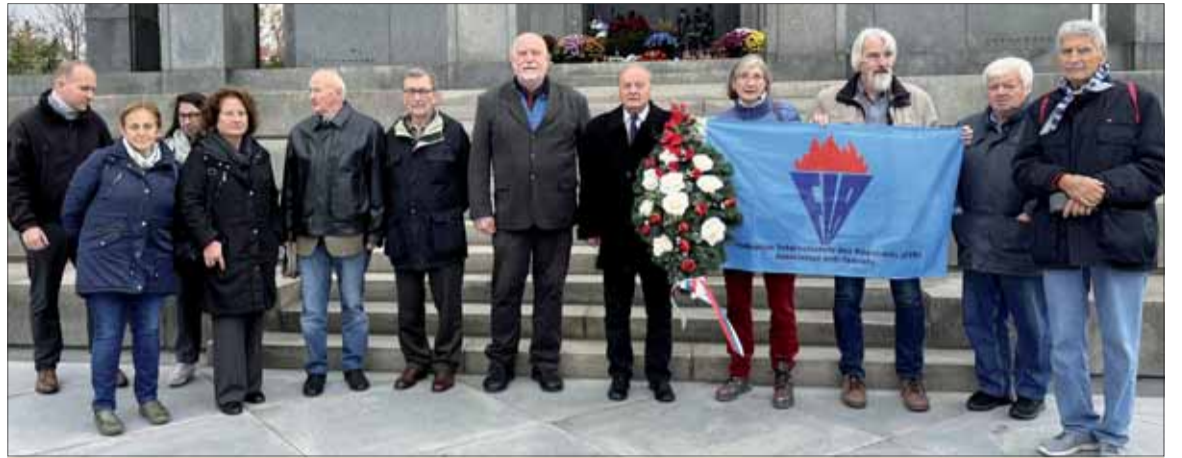
Účastníci 3-dňového stretnutia položili na Slavíne veniec vďačnosti vojakom Červenej armády, ktorí padli pri oslobodzovaní od nemeckého nacizmu a fašizmu.