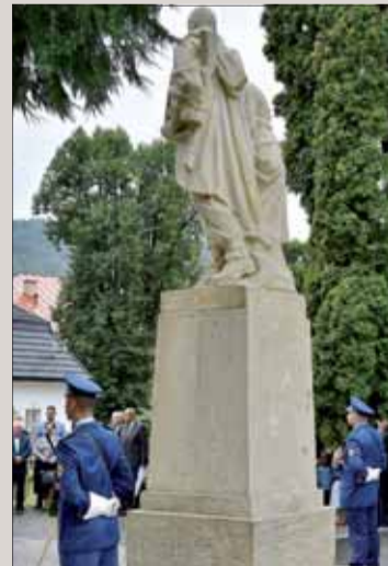
Pietny akt pri pomníku na námestí v Tisovci.

Pojem „Cigáni“ je použitý v historickom kontexte.