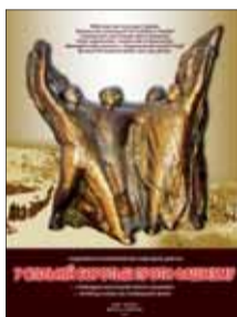
Plagát výstavy slovenského umenia v Múzeu Veľkej vlasteneckej vojny v Kyjeve, 2011.