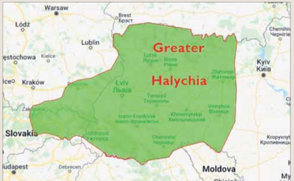
Podľa ruského portálu Pravda.ru by malo Slovensko prísť o celý východ.

Zorić navyše tvrdí, že „Južné Slovensko sa chce zjednotiť s Maďarskom, zatiaľ čo západní Slováci sú nostalgickí po zjednotení s Českom. Riešenie je zjavné.“ Nenávisť väčšiny ruských médií k existencii jednotnej Ukrajiny sa teda na jej hraniciach zjavne zastaviť nemá. Po tom, čo ruská propaganda viedla k vojenskému útoku na Ukrajinu vypúšťajú ruské médiá balóniky, ktoré smerujú aj proti jednote územia Slovenska, ktoré Pravda.ru označila za „najpriemernejšiu krajinu Európy“.