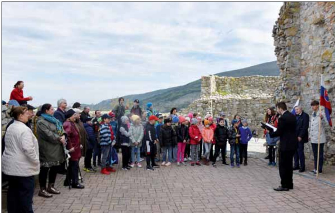
Žiaci ZŠ Dubová preukázali v kvíze o Štúrovcach svoje vedomosti.