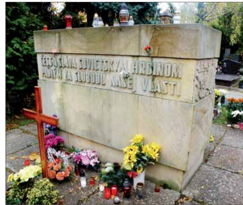
Pomník vojakom Červenej armády, ktorí boli pôvodne pochovaní v Slávičom údolí.

Obe telá neskôr exhumovali a ich mená nájdete na nových tabuliach z čiernej žuly na Slavíne. Súčasný objekt z mohutného balvanu osadili v roku 1984. V 90. rokoch vandali rozbili tabuľu z čiernej žuly na drobné kúsky. Na novej bolo niekoľko chýb, tak ju pracovníci Veľvyslanectva RF reštalovali.