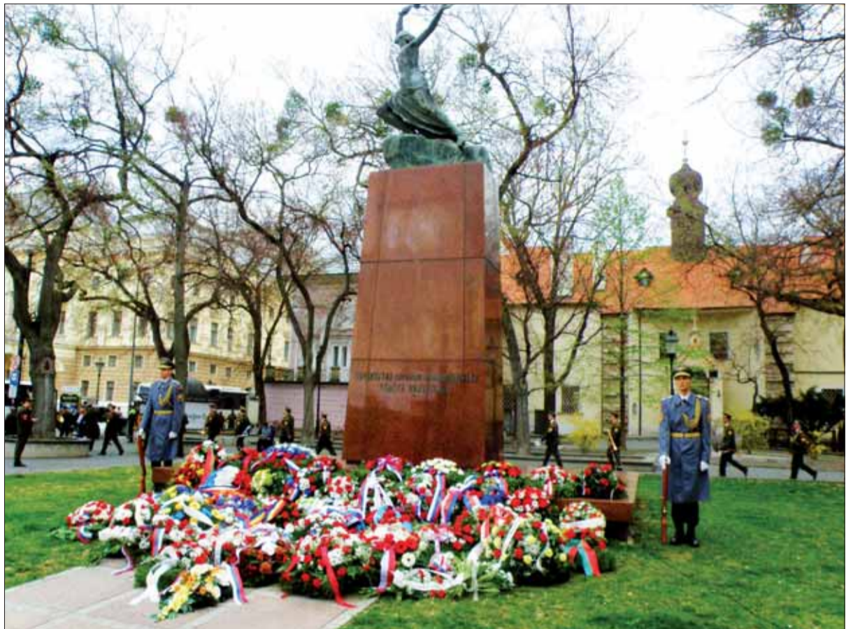
Oslavy oslobodenia Bratislavy 4. apríla 2019 pri Kostkovej soche Víťazstvo.

Z pamätných tabulí pripomínajúcim oslobodenie Červenou armádou treba spomenúť takú skromnú na budove bývalej základnej školy (dnes je súčasťou