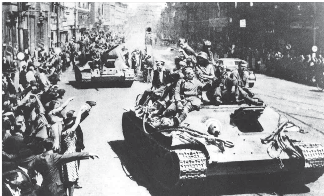
V posledný deň druhej svetovej vojny v Európe Pražania vítajú svojich sovietskych osloboditeľov 9. mája 1945.