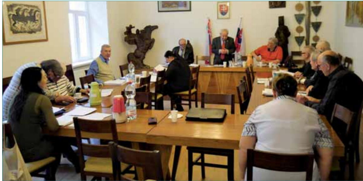
Momentka zo zasadania predsedníctva ÚR SZPB 16. marca. Autor sedí vľavo pri okne.

Rozsiahlejšie znenie tohto článku priniesie Ročenka odbojára 2023.