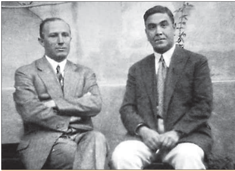
Ivan Mihajlov (vľavo) s vodcom chorvátskych nacistov Ante Paveličom.

Vo fašistickom Bulharsku Mihajlov dostával oficiálnu podporu