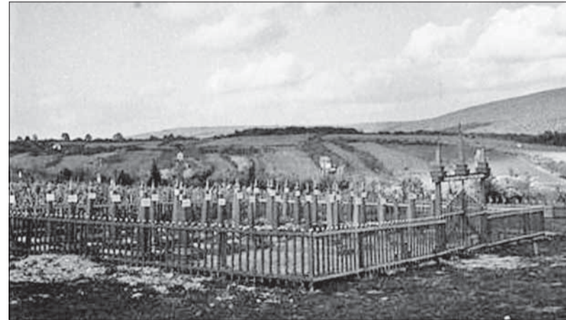
Polný cintorín príslušníkov Červenej armády v Slávičom údolí.

Veľa sovietskych vojakov, ktorí padli v bojoch alebo zomreli v nemocniciach na následky ťažkých poranení, dočasne pochovali aj na cintoríne v Slávičom údolí. Naľavo od vchodu, v tzv. VIP-zóne,