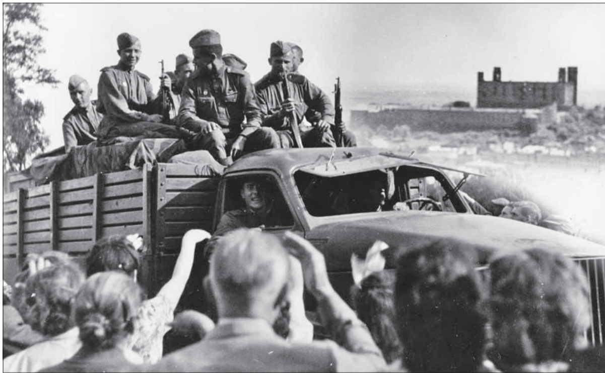
Červenoarmejci začiatkom apríla 1945 v Bratislave, niekde pri dnešnom Slavíne.

Na okraji parčíka na Vajanskom nábřeží v susedstve Osob-