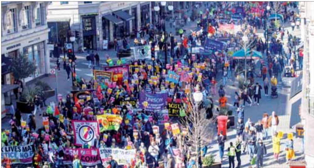
Odborársky protest proti rasizmu v Londýne.