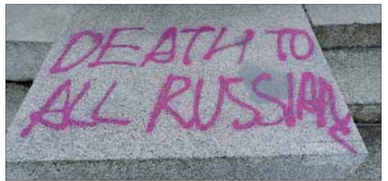
Smrť všetkým Rusom, hlása hanobiaci nápis na pamätníku v berlínskom Treptowe.

Vyzývame nemecké úrady, aby v tomto čase ochránili pamätníky sovietskych vojakov. Apelujeme na antifasistov, aby pozdvihli svoj hlas proti takémuto znesväteniu.