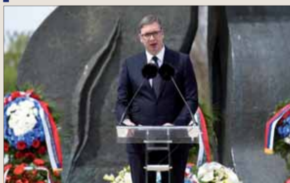
Prezident Vučić počas slávnostného príhovoru.

„Nejestvuje normálne prebudenie sa z tejto nočnej mori, pretože tá je našou pamäťou“ zdôraznil podľa portálu rtrs.tv Vučić. Pripomenul, že miesto, cez ktoré predvojnové výdobytky techniky prichádzali