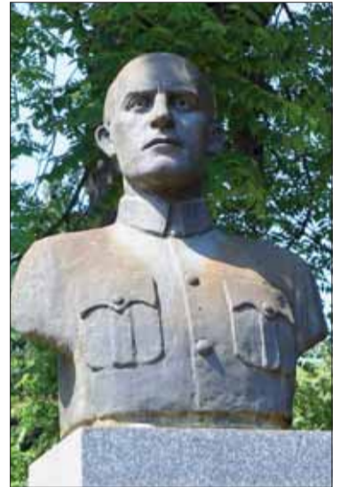
Nacista Mihajlov má v Sofii aj pamätnú bustu.

bude návrat k fašistickej a nacistickej histórii vojnového Bulharska, ktorej sa balkánsky štát pod vedením komunistov usilovne zbavoval. Petkov sa tak zaradil medzi „jastrabov“ bulharskej politiky, ktorých hlavnou hodnotou je bezhraničný nacionalizmus namierený najmä proti Macedóncom. V Sofii možno onedlho, ako to každoročne vidíme v pobaltských metropolách, budú hrdo pochodovať obdivovatelia niekdajších nacistických spoluvojníkov.