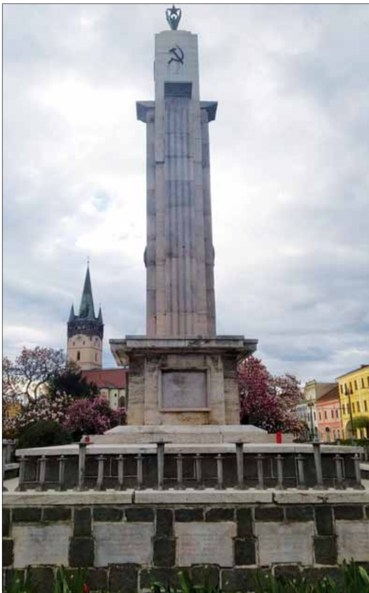
Pamätník osloboditeľom Prešova – vojakom Červenej armády.

My, ako členovia SZPB, tak aj ako občania SR sme proti akejkolvek vojne a usilujeme sa svojou činnosťou a životmi o mier. Je nám ľúto nevinných obetí všetkých vojen a sme za ich okamžité ukončenie a spravodlivé potrestanie vinníkov.