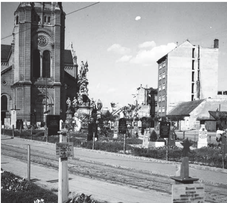
Hroby červenoarmejcov po oboch stranách elektičkovej linky pred Blumentálskym kostolom.

Areálu na bývalom po prešpurácky Hymelperti, Nebeskej hore, s najväčším pamätníkom červenoarmejcov v strednej Európe, ktorý je sám osebe súborom diel najvýznamnejších povojnových výtvarných umelcov Slovenska, sme v Bojovníku venovali pred rokom dva rozsiahle články.