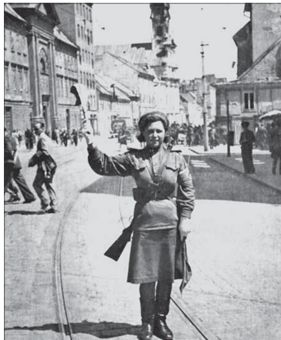
Sovietska regul'ovčička na jar 1945 na začiatku Ulice Čs. armády (dnes Špitálska) – živý dôkaz oslobodenia.

Predseda Matice Slovenskej pri pripomenutí výročí viacerých osobností nevynechal ani Alexandra Dubčeka. Ideovo nadväzoval na štúrovskú generáciu, ktorá namiesto finančného kapitálu rozvíjala vzdelanostný, boj o svojbytnosť národa a nutnosť vážiť si osobnosti.