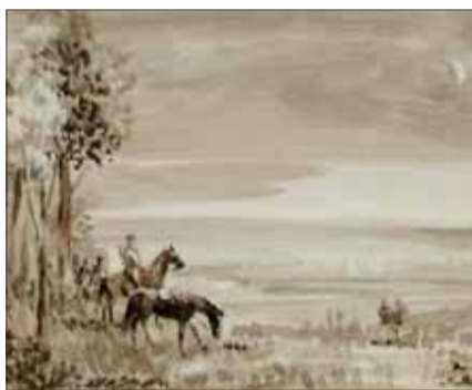
Július Nemčík: Ilustrácia ku knihe Miloša Krnu Vrátim sa živý .