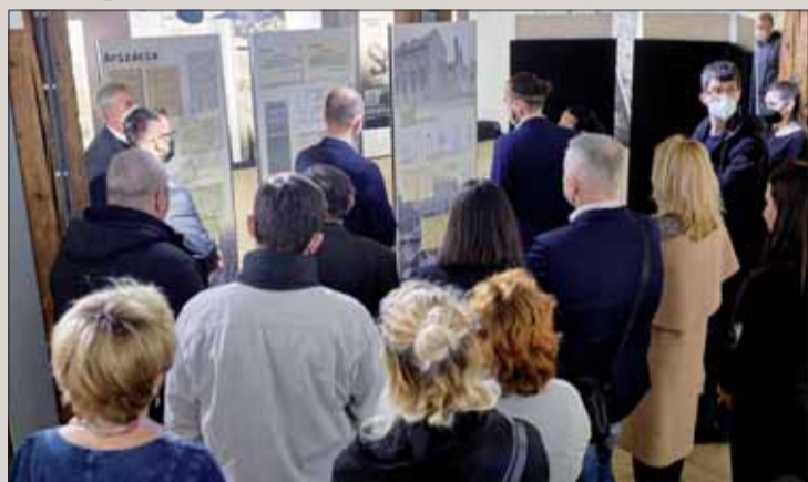
Momentka z vernisáže v Múzeu holokaustu.

Židovský kódex prijala slovenská vláda 9. septembra 1941. Išlo o vládne nariadenie, ktoré obsahovalo súbor protizidovských predpisov. Práve vystavené exponáty majú za cieľ priblížiť návštevníkom jedno z najtragickejších období histórie Slovenska prostredníctvom zachovaných archívnych dokumentov.