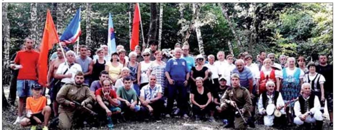
Obyvatelia Ruskej Poruby a Závady v humenskom okrese si na vrchu Lipovica každoročne pripomínajú hrdinský boj partizánskej brigády Čapajev.

Ďalšou úlohou, ktorú si predsavzali, je starostlivosť o pamätníky postavené na miestach pripomínajúcich hrdinské činy Čapajevovcov.