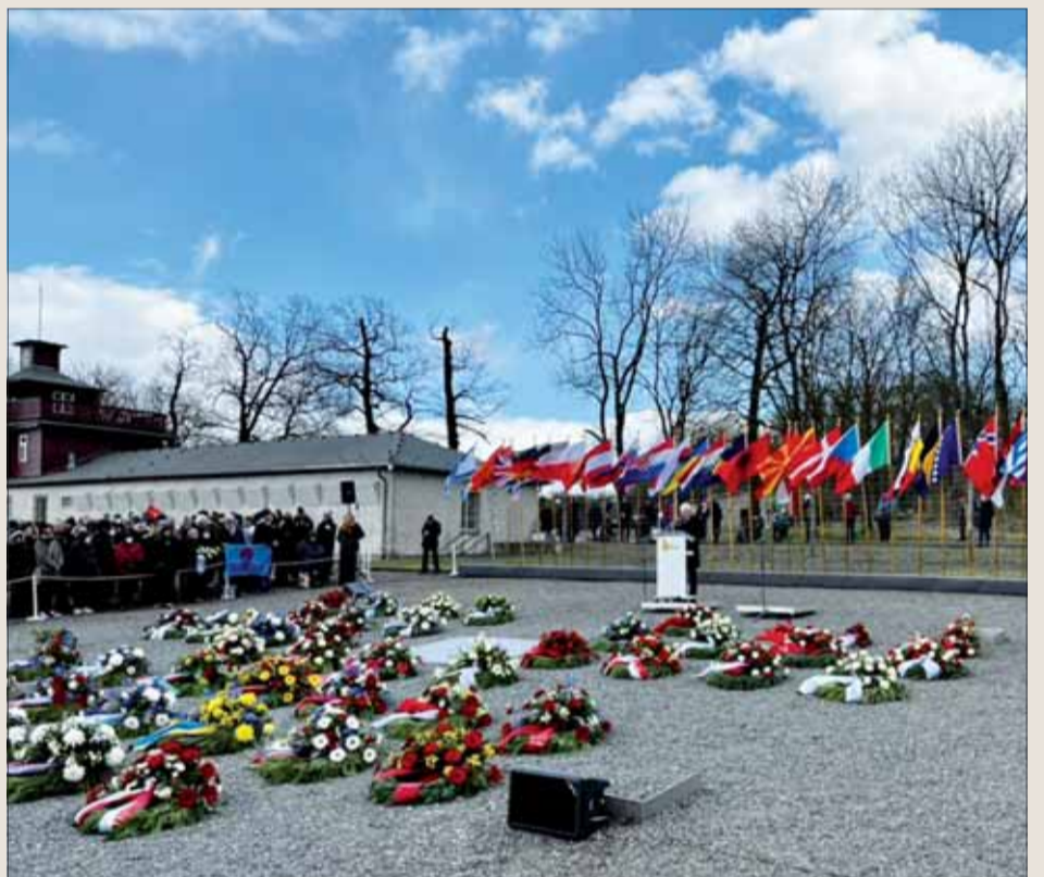
Záver zo slávnostného podujatia v Buchenwalde.