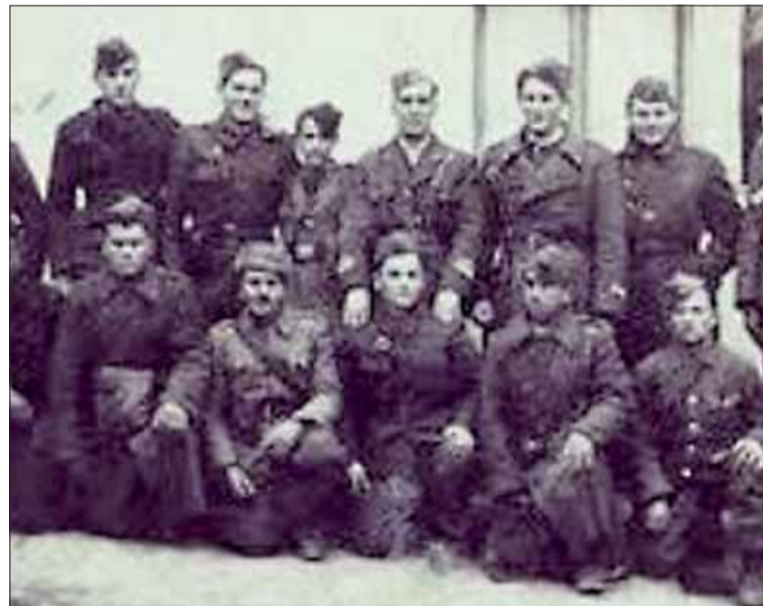
Partizáni zo skupiny Čapajev odstrelili 19. augusta 1944 železničný most na trati Kysak – Margecany.

Do povetria 6. augusta vyhodili železničné koľaje na hlavnej trati Košice – Kysak, čo spôsobilo vykoľajenie transportu naloženého materiálom smerujúcim na východný front,