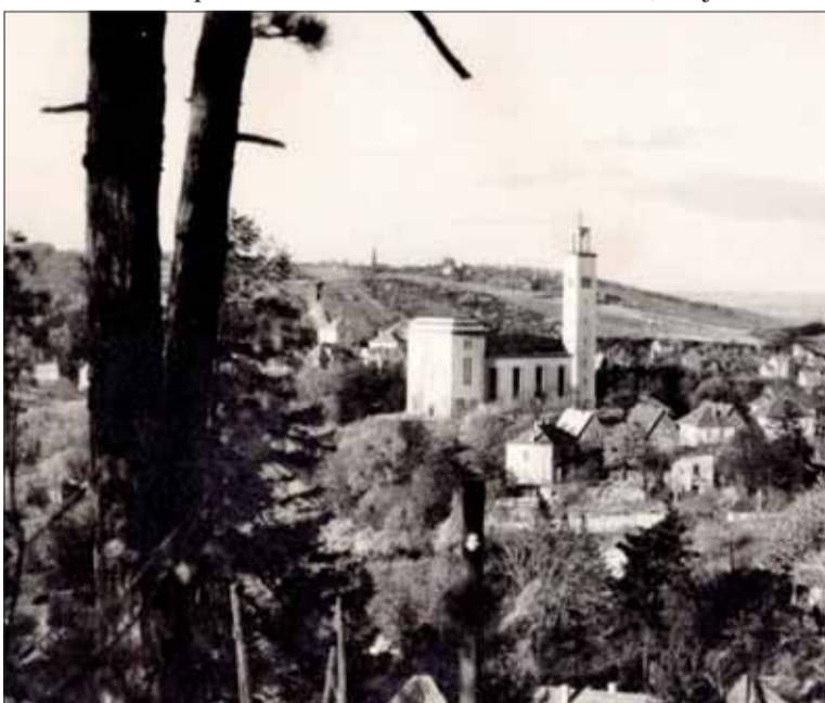
Kostol Panny Márie Snežnej s vežou. Pohľad niekde z Horského parku.

Do konca vojny sa podarilo hrubú stavbu preklenúť a zastrešiť. V roku 1947 sa napriek finančným suchotám na prácach pokračovalo a 3. októbra 1948