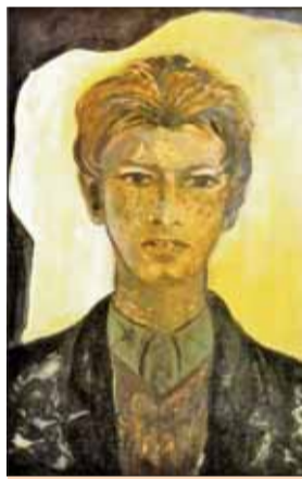
Janko Šuška, olej 1978.