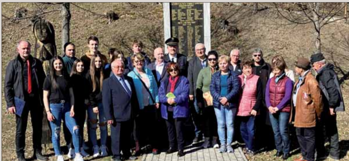
V Brusne si vážia osloboditeľov a odsudzujú agresiu proti Ukrajine.

ho zväzu prestane a že polícia nájde vinníkov, ktorí budú potrestaní. V súlade s humanistickým poslanstvom SZPB dúfame v čo najskoršie ukončenie barskej vojny na Ukrajine mierovou cestou.