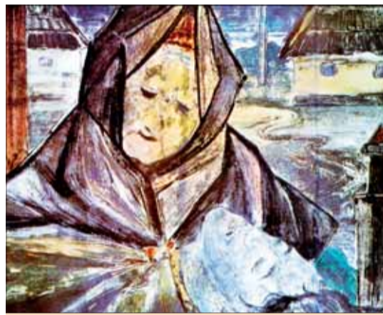
Matka partizánov Maková, monotypia 1964.