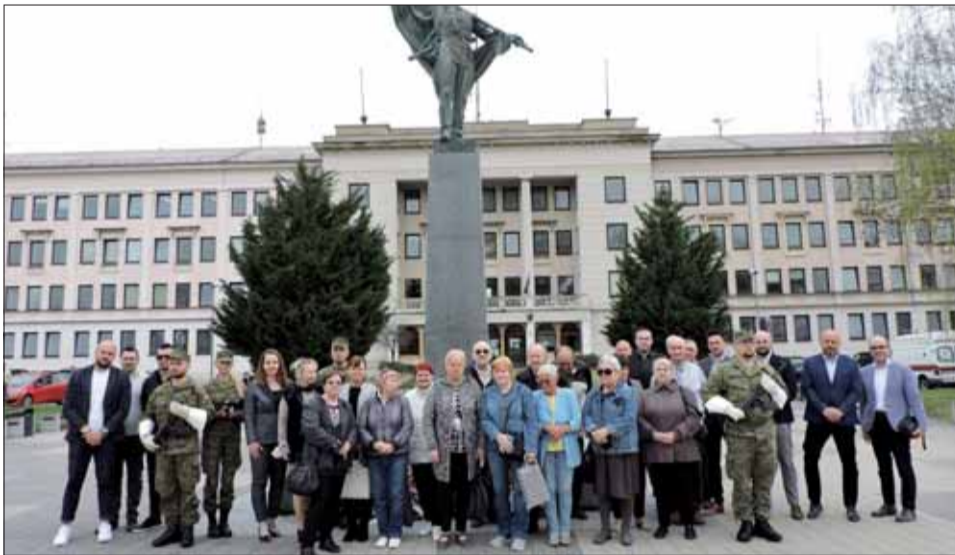
Slávnostné podujatie na pamiatku oslobodenia Nitry pred budovou okresného úradu.