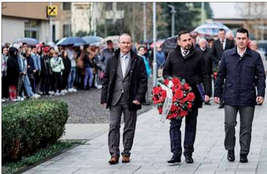
Hoci v daždi, obyvatelia Žiaru nad Hronom ani tento rok nezabudli na pamiatku osloboditeľov.

Každá vojna je nezmyselná a žiadna sa nekončí víťazstvom, pretože jej výsledkom sú smrť, bolesť, ničenie a najviac na ňu doplatia nevinní ľudia, ktorí by chceli a vedeli žiť spoločne v mieri.