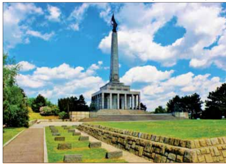
Slavín v apríli 2020.