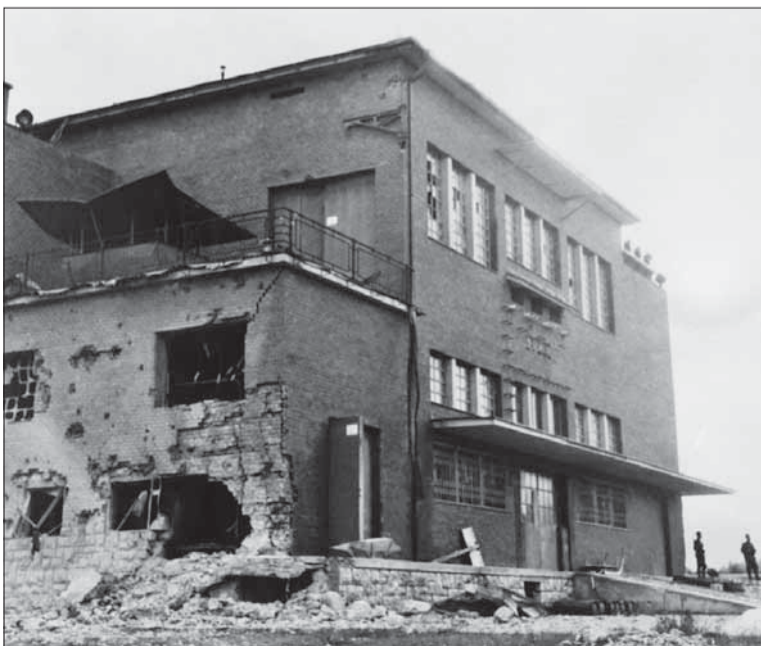
Vysielateľ v Banskej Bystrici po prvom nálete.

Kúpeľné mestečko bolo v tej chvíli najzápadnejším cípom oslobodeného povstaleckého územia. Žiaľ, za cenu prvých obetí medzi nadšenými dobrovoľníkmi.