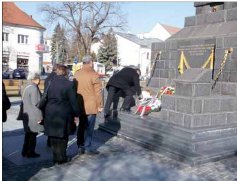
ZO Zlatý potok a Oblasťný výbor SZPB pri kladení vencov k 77. výročiu oslobodenia mesta Zvolen.

Našťastie na vojenských cintorínoch a mohyle na námestí SNP sa v našom meste neprejavili negatívne emócie, ako na Slavíne a ďalších pietnych miestach na Slovensku. Veď v radoch Červenej armády boli