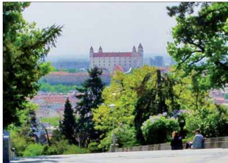
Výhľad zo Slavína na Bratislavský hrad.