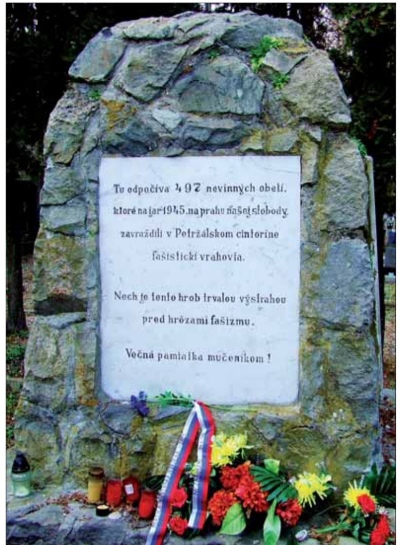
Pomník obetiam krvavej Veľkej noci z roku 1944 na petržalskom cintoríne.

My, matičiari a ostatní priatelia petržalskej histórie, si pravidelne pripomíname nielen oslo-