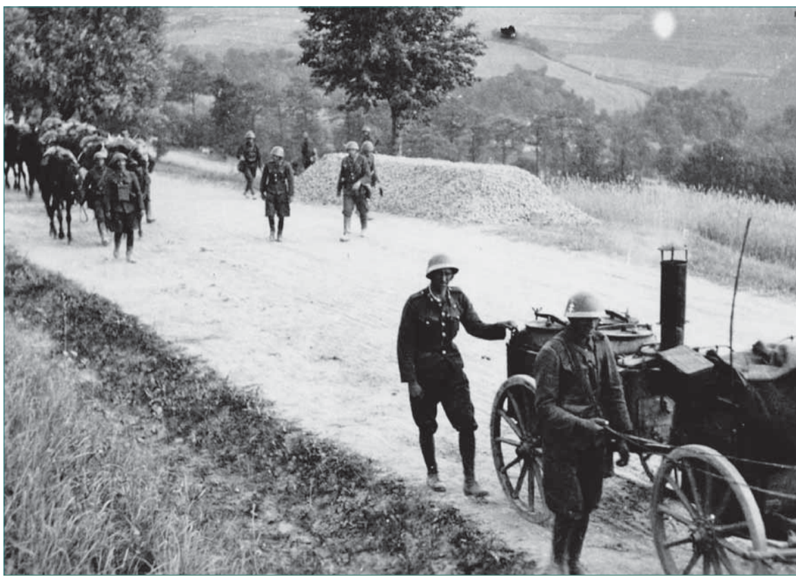
Presun trnavskej posádky na stredné Slovensko koncom augusta 1944.

„Keď Nemci zbombardovali bansko-bystrický rozhlasový vysielateľ, ja som musel na štáb 1. ukrajinského frontu poslať správy, čo nové sa tu stalo. Boli to celkovo radostné hlásenia, pretože front úspešne napredoval, ale nebolo ich čím poslať domov. A tak som sa vydal na potulky po Slovensku. Reku, spoznám krajinu i ľudí. Osud ma zavial do terajšieho mesteč-