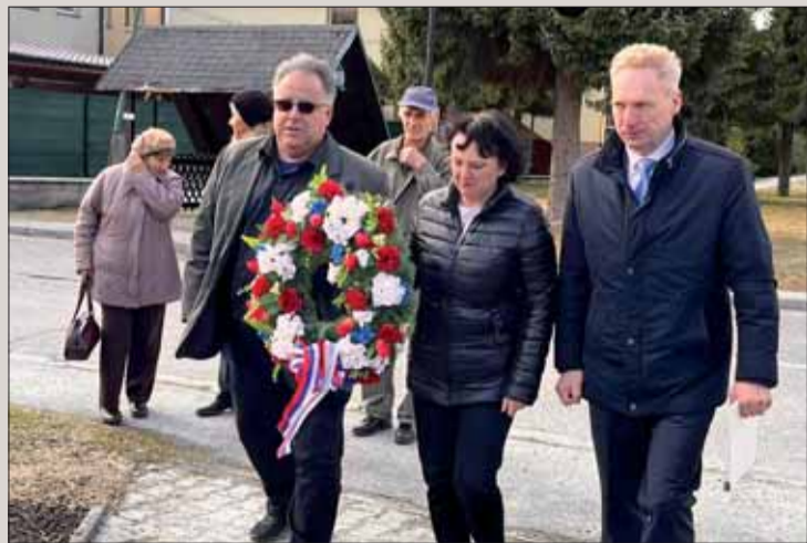
Časť účastníkov spomienky v Liptovskej Osade.

Žiaci pripravili krátky kultúrny program a pán starosta predniesol slávnostný prejav. Celá slávnosť sa niesla v duchu vďačnosti za našu slobodu, v ktorej môžeme žiť a ktorú si musíme nesmierne vážiť, pretože situácia vo svete nie je všade taká, ako by sme si priaľi. Prebiehajúca vojna na Ukrajine nás núti k tomu, aby sme si mier vážili oveľa viac ako kedykoľvek predtým. V týchto dňoch cítime, aký je veľmi krehký a každý deň by sme sa všetci mali usilovať o to, aby bol navždy zachovaný.