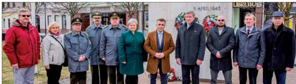
Skromné, ale o to úprimnejšie. Spomienkové podujatie v Dolnom Kubíne.

venej armády a rumunskej armády spolu s príslušníkmi domáceho odboja – partizánmi. Na znak úcty a vďaka našim osloboditeľom, účastníci pietneho aktu položili vence a kytice kvetov k Pamätníku oslobodenia na námestí P.O. Hviezdoslava a poklonili sa pamiatke hrdinom boja proti fašizmu a nacizmu.