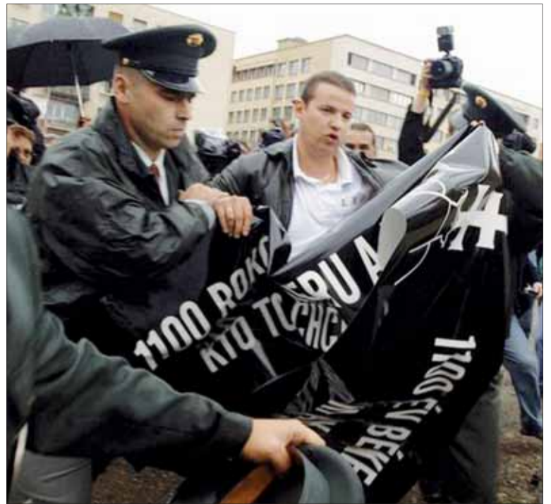
Slovenskí policajti eskortujú Lászlóa Toroczkaia.

Sám Toroczkai bol organizátor protislovenskej demonštrácie v Budapešti, na ktorej boli pálené slovenské zástavy. Neskôr 16. septembra 2006 sa pokúsil o nelegálny protest pred slovenským ministerstvom vnútra v Bratislave, začo bol zatknutý a vyhostený zo Slovenska na päť rokov. V súčasnosti čerstvo zvolený poslanec Toroczkai je aj starostom mesta Assothalom a zakladateľom polovojenskej organizácie Národná légia, ktorá sa prezentuje ako ideový nástupca zakázanej Maďarskej gardy. Toroczkaiove hnutie Naša vlasť obsadí v maďarskom parlamente 7 kresiel z celkových 199.