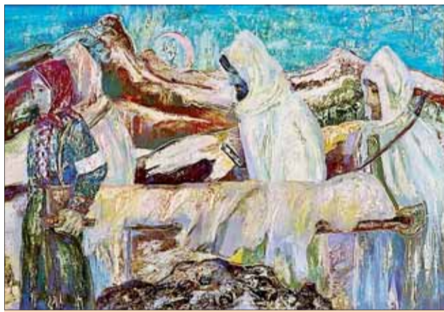
Odnos Švermu, olej 1971, SNG.