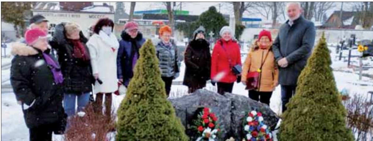
Pri hrobe neznámeho sovietskeho vojaka v Spišskej Belej.

Pripomínanie si dôležitých momentov 2. svetovej vojny by nemalo byť len tradíciou, ale najmä aktom upozornenia, ktoré je adresované všetkým, že fašizmus a jeho nové podoby treba zastaviť.