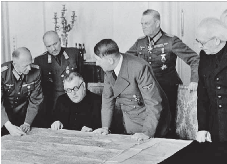
Tiso a Tuka s Hitlerom na rokovaní v Salzburgu.

Do leta 1941 vyšlo ešte niekoľko desiatok protizidovských nariadení a zákonov. Pronacisticky orientovaným ľudakom sa však videlo riešenie pomalé a nedôsledné. Bolo jasné, že sa onedlho skončí ročná platnosť splnomocňovacieho zákona. Radikáli z HSLS stupňovali protizidovskú kampaň najmä prostredníctvom tlače. Umiernení sa od nich líšili iba tým, že chceli postupovať pomalšie, no s rovnakým výsledkom.