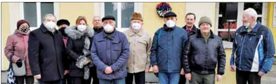
Účastníci osláv oslobodenia v Smižanoch pri budove Domu kultúry.

ným priblížil spomienky, priebeh bojov a ich význam. Nasledovalo polozenie venca k tabuli. Pre stále pretrvávajúce protipandemické opatrenia sa časť slávnosti realizovala prostredníctvom obecného rozhlasu, kde zaznela báseň a príhovor starostky obce. Na záver sa obcou niesli tóny piesne Kto za pravdu horí.