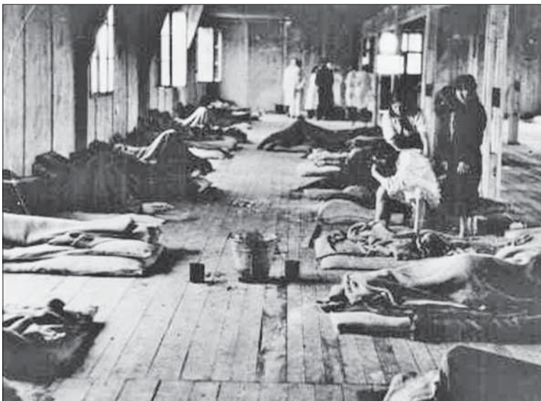
Život v terezínskom ženskom tábore.

Podľa Lustiga „Primo Levi je Albert Einstein v pozorovaní koncentračného tábora.“