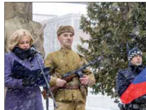
Čestná stráž počas príhovoru primátorky Svitú.

V rámci pietneho aktu vystúpila dychovka Sviťanka, Podtatranskí Alexandrovci a zazneli i básnické slová. Členovia historického vojenského klubu Tiger držali spolu s policajtmí čestnú stráž.