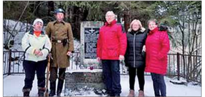
Presne po 77 rokoch si členovia ZO SZPB z Likavky 26. januára zapálením sviečky pripomenuli popravu 11 antifašistov z ružomberskej väznice Sondrekomandom 7A na Kramariskách v katastri Likavky.