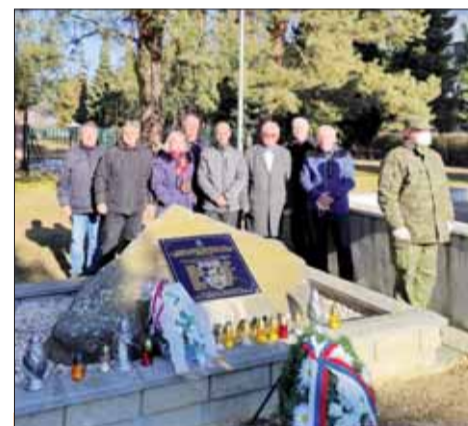
Účastníci pietneho aktu pri pomníku v Trebišove.

Aj členovia SZPB z trebišovskej oblasti si uctili pamiatku 42 slovenských vojakov, ktorí nešťastne zahynuli počas návratu z Kosova. Desiatich z nich boli príslušníkmi 21. mechanizovaného práporu v Trebišove. Pietny akt sa konal 19. januára pri mramorovej doske s menami zosnulých trebišovčanov, vlozenej do kamenného monolitu.