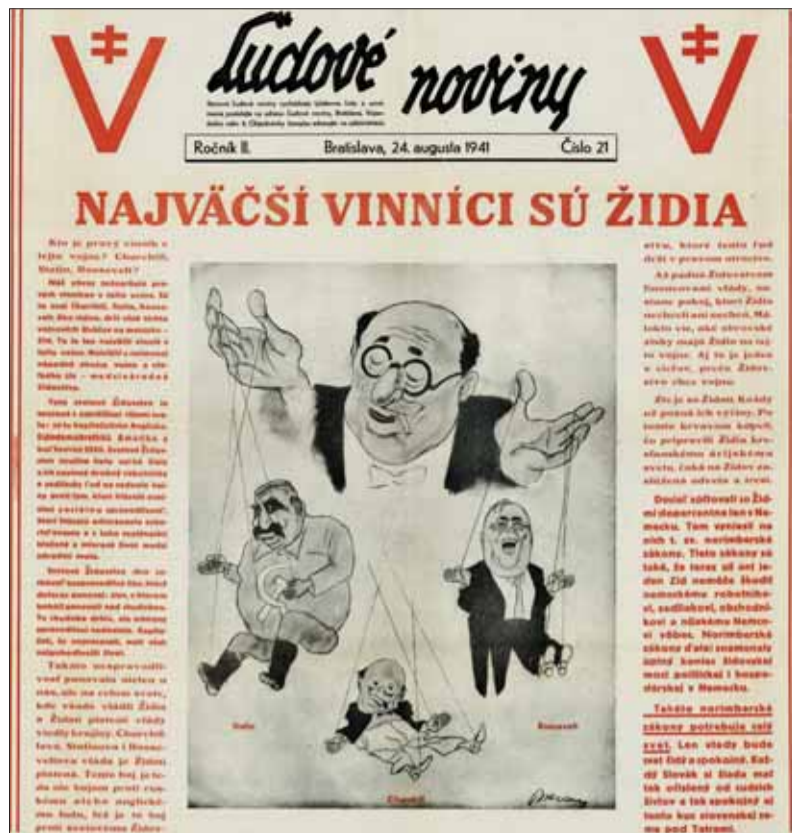
Ludové noviny proti Židom, 24. august 1941.

Na druhý deň vypravili prvý vlak, v ktorom bolo tisíc židovských dievčat a mladých žien. Územie republiky opustili nadržanom 26. marca, aby o niekoľko hodín vstúpili do pekla Nemcami nazvanom Auschwitz. Tak sa odštartovala akcia David.