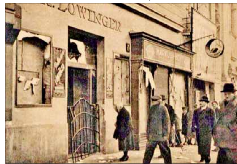
Výsledok jednej z protizidovských demonštrácií v Bratislave na začiatku roka 1939.

Na tajnej konferencii vo Wannsee 20. januára 1942 (bližšie v Bojovníku č. 2/2022) mohol Reinhardt Heydrich konštatovať, že sa na Slovensku problémy s deportáciami Židov neočakávajú.