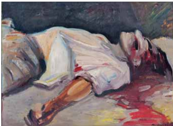
Zavraždený básnik, olej 1939, SNG.