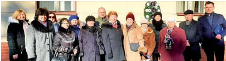
Účastníci spomienkového aktu v Hnúšti.