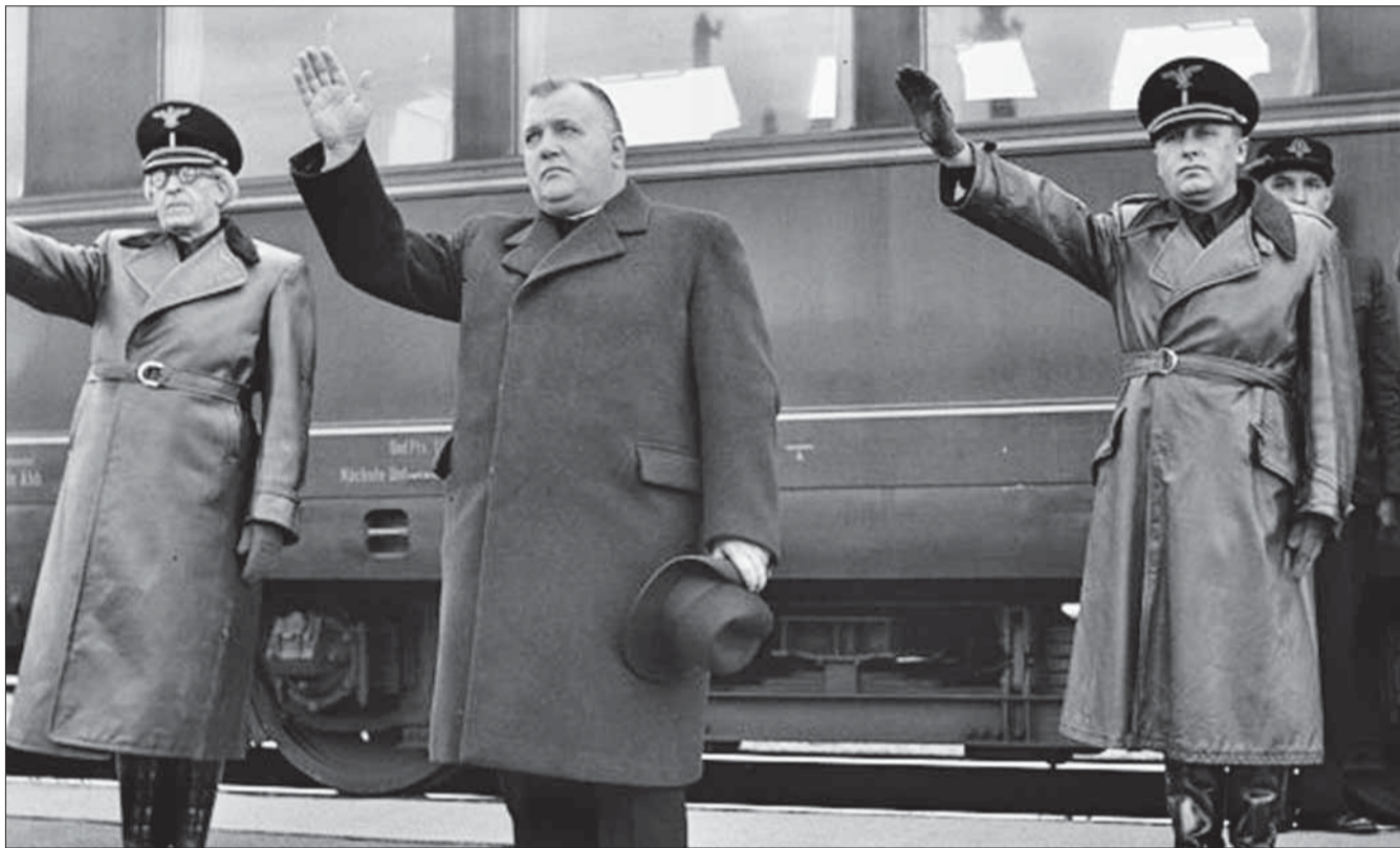
Hajlujúci zľava Tuka Béla, Jozef Tiso a Šaňo Mach.

Za pomoc a spoluprácu pri udržiavaní pamiatky osloboditeľov sa chcem poďakovať Oblastnej organizácii SZPB. Osobitne som rád, že tento rok sa na aktivitách k výročiu oslobodenia zúčastnili aj členovia Bardejovského mládežníckeho parlamentu. Naplníme tým spoločnú dlhodobú ambíciu, aby sme sa o zachovanie odkazu hrdinov boja za naše oslobodenie do budúcnosti nemuseli obávať.