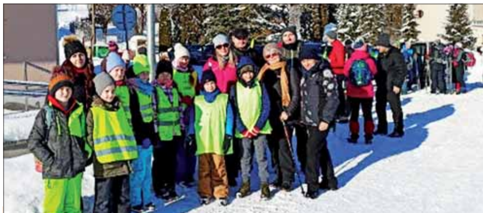
Účastníci turistického pochodu.

ľahké chvíle vojakov 1. gardovej armády generála Grečka pri oslobodzovaní obcí 24. januára 1945. Na pochode sa zišli všetky žijúce generácie. Spoločne si zaspomínali na žijúcich aj nežijúcich hrdinov tohto obdobia. Všetci sa zhodli na tom, že mier je v živote človeka neoceniteľný.