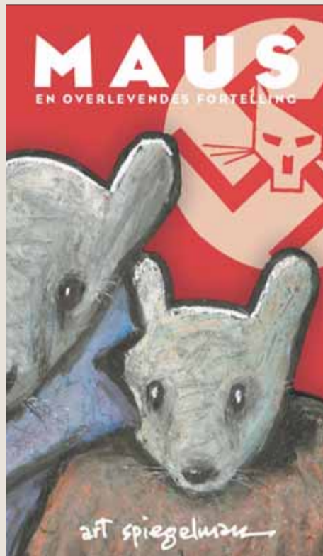
Obal knihy Maus – príbeh toho, ktorý prežil.

Prípád si všimli aj britské noviny The Times. Múzeum Holokaustu v USA zdôraznilo význam celej knihy práve pre jej detailné a osobné zobrazenie udalostí, obetí a preživších. Podľa tlačovej agentúry Reuters vyjadril 73-ročný autor nad rozhodnutím „totalný údiv“. Vyzval ju, aby nebola zaslepená rigidnosťou.