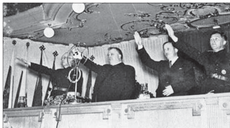
Predseda vlády V. Tuka, prezident J. Tiso, predseda snemu M. Sokol a minister vnútra A. Mach na zjazde verejných pracovníkov v roku 1942.

Je pre mňa otrasné a nepochopiteľné, že pri všetkých tých zverstvách, ktoré s Tisovým súhlasom páchali na nevinných matkách a deťoch, na nevinných starenkách a starcoch ste hrdá a obhajujete pomenovanie ulice vo vašej obci po tejto neľudskej kreatúre.