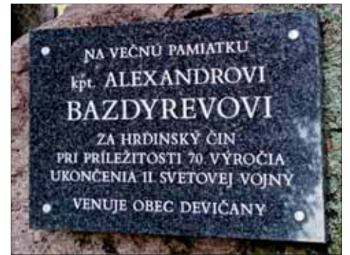
Pamätná tabuľa v parčíku obce Devičany.