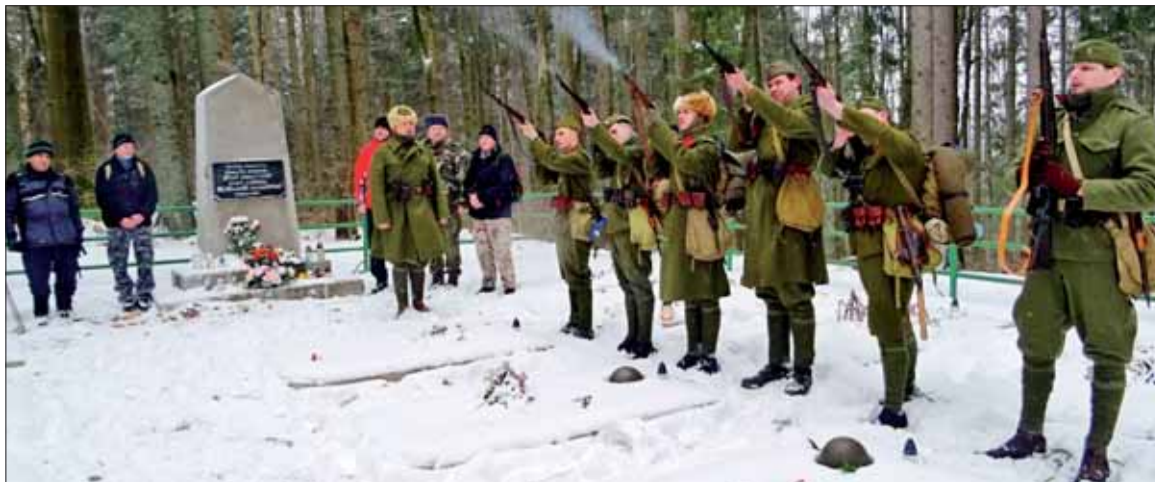
Čestné salvy na partizánskom cintoríne, kde sa pochod začal.

Na cintoríne pod hlavnou cestou, kde je pochovaných 23 partizánov, sa uskutočnil prvý pietny akt so salvami príslušníkov Klubu vojenskej histórie. Po jeho skončení sme sa spoločne horami a dlhou dolinou Brôtovo peši presunuli 12 kilometrov k Čier-