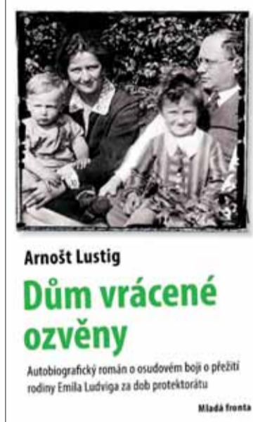
Titul knihy Arnošta Lustiga Dom vrátenej ozveny.

Čítal som, že žijeme v časoch protikladov. Máme vyššie domy, ale menšiu trpezlivosť, ako sa zabývať. Širšie cesty, ale užšie obzory. Môžeme si viac kúpiť, ale menej užiť. Máme viac pohodlia, ale menej času. Väčšie vzdelanie, menej rozumu. Lepších doktorov, horšie nemocnice. Viac majetku, menej hodnôt. Vyššie príjmy, nižšiu morálku. Obsiahli sme už všetky biele miesta na mape, ale nevidíme ani na susedov ani do svojej duše.