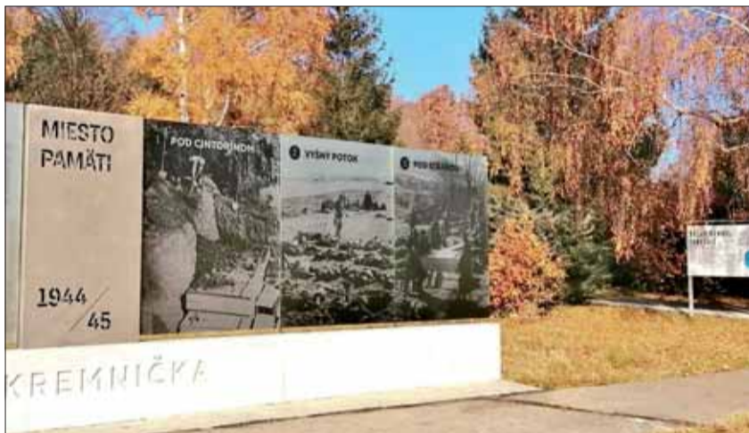
Kremnička, v pietnom areáli vlani samospráva osadila informačný systém.

Iste, viaceré časti pamätných miest ešte čakajú na opravu či oživenie. Napríklad samotné miesto popráv v Kremničke, či protitankový zákop. Nateraz však v tomto neľahkom období musíme pozbierať sily a energiu nielen na ďalšie opravy, ale aj na využívanie týchto pamiatkových objektov pri výchove mladej generácie.