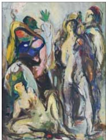
Nešťastie, olej 1941, SNG.