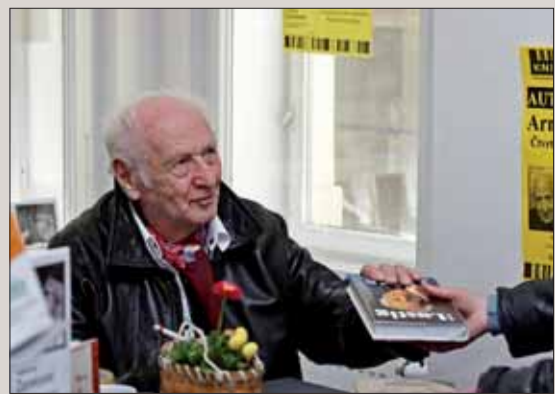
Arnošt Lustig na autogramiáde v Brne v apríli 2009.