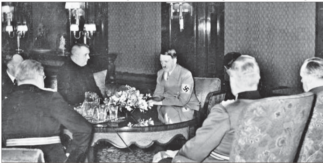
Jozef Tiso a Ferdinand Ďurčanský počas rokovania s ríšskym kancelárom Adolfom Hitlerom, 13. marca 1939 v Berlíne.

K „aktívnemu bráneniu“ premenovania ulice, k „aktívnemu vyjadreniu sympatií“ Dr. Tisovi nemožno konštatovať iné, len, slovami špeciálneho prokurátora (Daniela Lipšica,