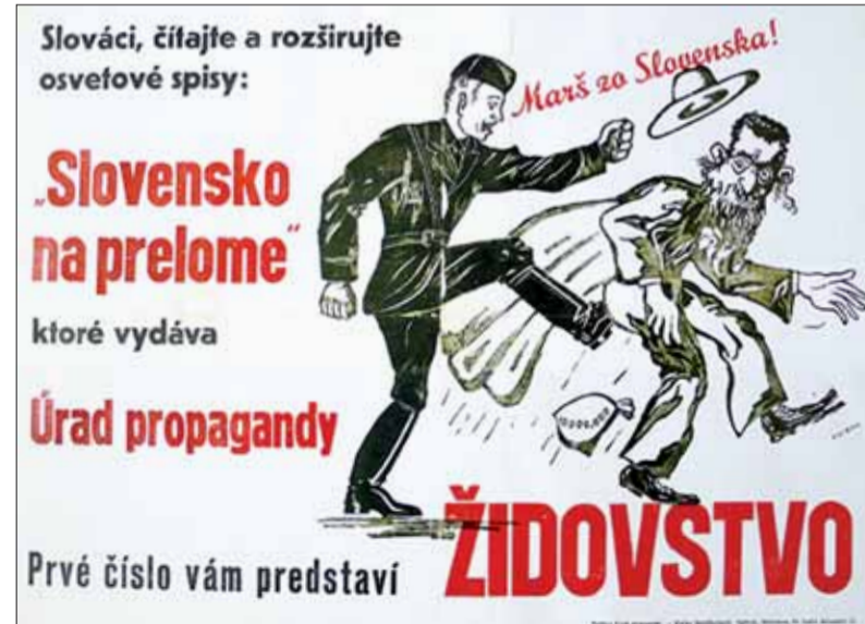
Plagát proti Židom – Úrad propagandy.