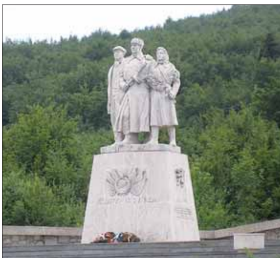
Pamätník na Dargove.

Neľahké boje medzi vojskami Wehrmachtu a Červenou armádou prebiehali v oblasti Dargovského priesmyku od 9. decembra do 18. januára 1945, kedy nemecké vojská v dôsledku mohutnej sovietskej ofenzívy začali ustupovať. O deň neskôr, 19. januára 1945, oslobodili zväzky 18. armády Košice.