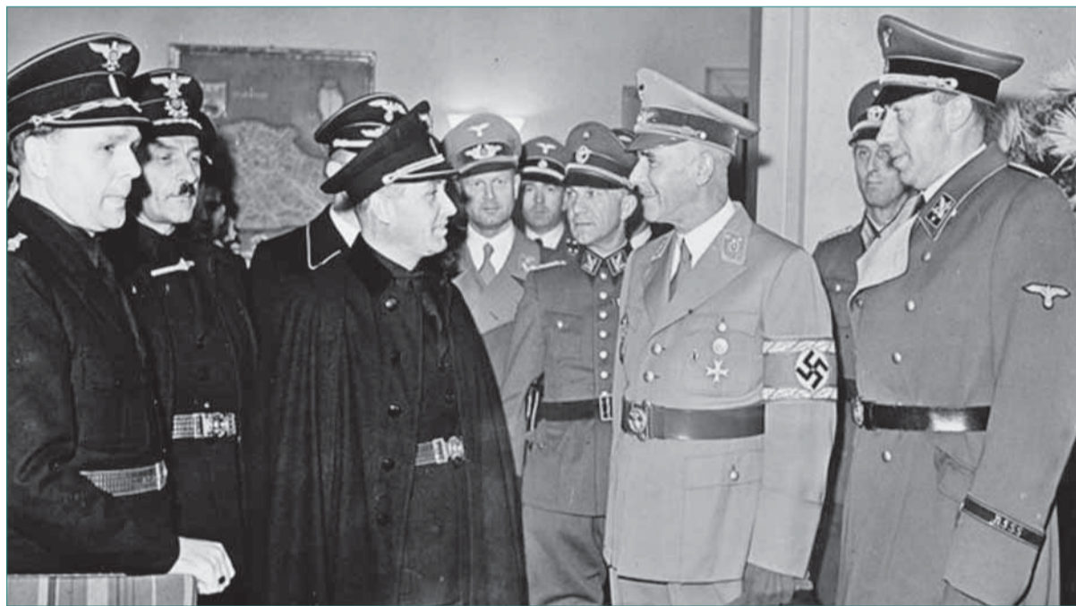
Alexander Mach s nemeckým ministrom vnútra Wilhelmom Frickom na prijatí v Berlíne.

židovskej otázky. Tisov zmierlivý postoj voči požiadavkám Berlína prekvapil samotného Adolfa Hitlera: „Je zaujímavé, ako nám ten katolícky farár Tiso posielal Židov.“