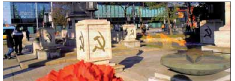
Jeden z košických pomníkov osloboditeľom.

Najviac ľudí prišlo na Námestie osloboditeľov. Pri pomníku generála I. J. Petrova v mestskom parku všetci prítomní jedomyseľne odsúhlasili protestné memorandum proti podpísaniu Zmluvy o vojenskej spolupráci medzi USA a Slovenskom adresovanú v mene OblV SZPB vláde a prezidentskej kancelárii.