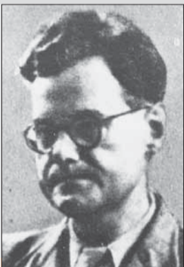
SS obersturmbannführer Dieter Wisliceny, nemecký poradca slovenskej vlády pre riešenie židovskej otázky

Ako šéf Referátu pre židovské záležitosti sa podieľal na vykynožení Židov v Nemecku, Grécku, Maďarsku a v ďalších okupovaných alebo satelitných štátoch Berlína. Hneď po príchode do Bratislavy