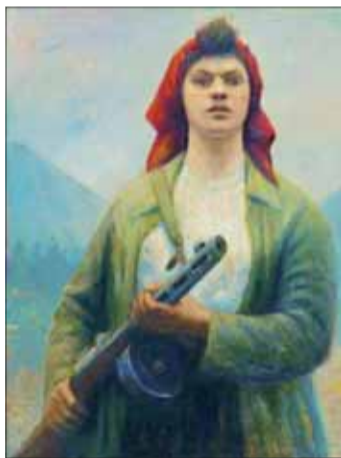
Partizánka na strážii pod Rozsutcom, olej 1954, SNG.