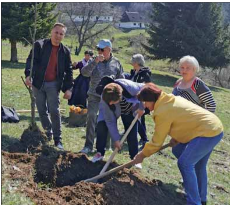
Členovia ZO SZPB v Lubeli prispeli k obnove symbolu obce v sade vypálených obcí v Kališti.

Druhým protivníkom boli zložky okupačnej nemeckej