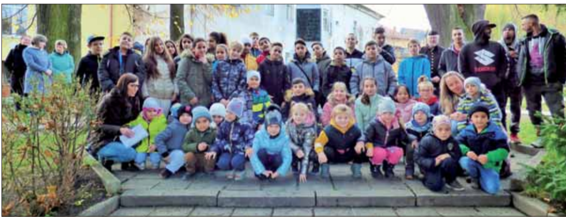
V Dobšinej si na obeť I. sv. vojny spomenuli všetky generácie.

Ďakujem všetkým, ktorí sa týchto spomienkových osláv zúčastnili, zástupcom Mesta Dobšiná a najmä žiakom materských, základných a stredných škôl, ktorých sme radi uvítali.