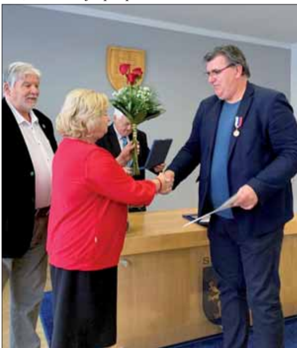
Primátor Senca si preberá vysoké vzäzové ocenenie.