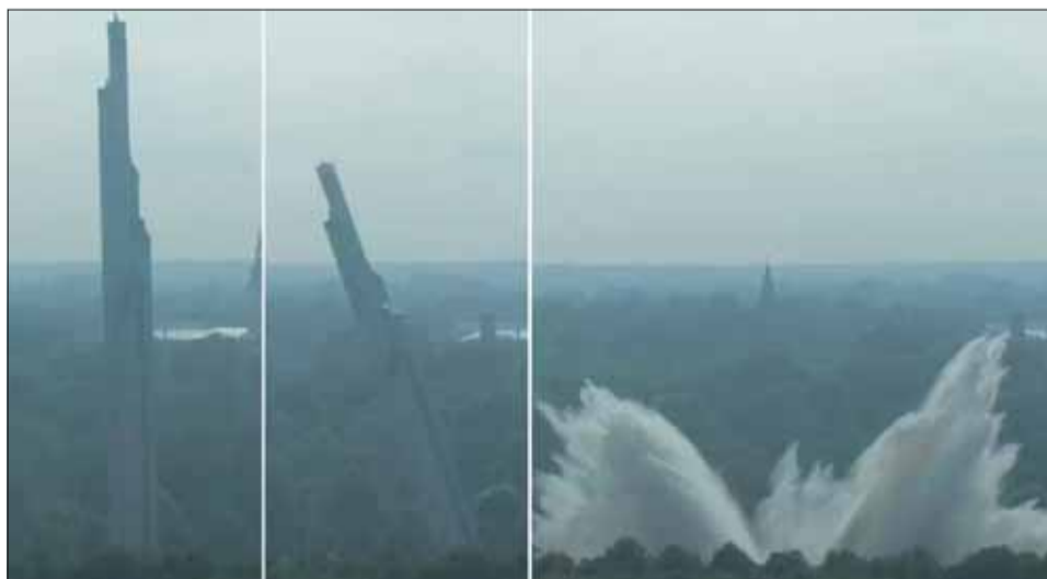
Lotyšská vláda oslavuje tamojších esesákov a ničí pamiatky víťazstva nad fašizmom.

Symbolom kultúrneho barbarstva sa stalo odpálenie 79 metrov vysokého pamätníka v hlavnom meste Riga, ktorý pripomínal víťazstvo nad fašizmom. Každoročne sa pri tomto pamätníku konali veľkolepé oslavy Dňa víťazstva. Tento rok boli akékoľvek oslavy na tomto mieste zakázané. Napriek zákazu si tisíce ľudí na tomto mieste pripomenuli pamiatku svojich predkov. Nasledoval zásah polície a od-