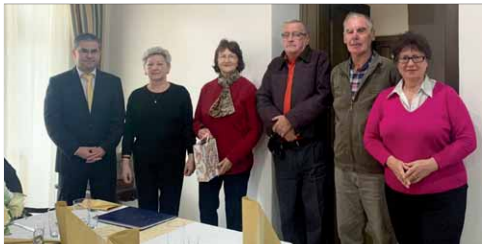
Jubilanti ZO SZPB v Hanušovciach nad Topľou odišli zo slávnostného stretnutia s gratuláciou a darčekom.

Zo strany vedenia mesta sa miestna ZO SZPB teší naozaj výnimočnej podpore. Dotácia, ktorú ZO SZPB Senec každoročne dostáva patrí suverénne medzi najvyššie v rámci celého Slovenska. Mesto podporuje aktivity SZPB trva-