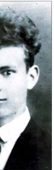
udent učiteľské- j Novej Vsi.

Vo všeobec- koslovenskej ar- ovenskej armá- me čosi z menej