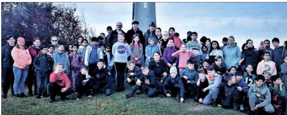
Účastníci na Minčole pred hraničným obeliskom medzi okresmi Sabinov, Bardejov a Stará Ľubovňa.

Túra pokračovala krásnou jesennou krajinou až na vrch, kde