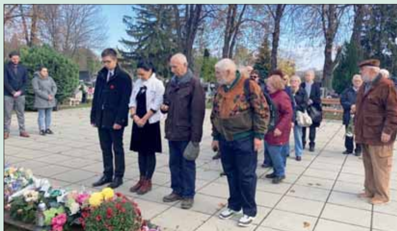
Delegácia SZPB na podujatí v Košiciach.

Odmietam dehonestovať červenoarmejcov, ktorých pamiatku sme si aj v našom meste spoločne pripomenuli. Preto 9. mája by sme každý rok mali zorganizovať pietnu slávnosť víťazstva nad fašizmom. Vzdávajme hold našim osloboditeľom. Vzdávajme hold svetovému mieru!