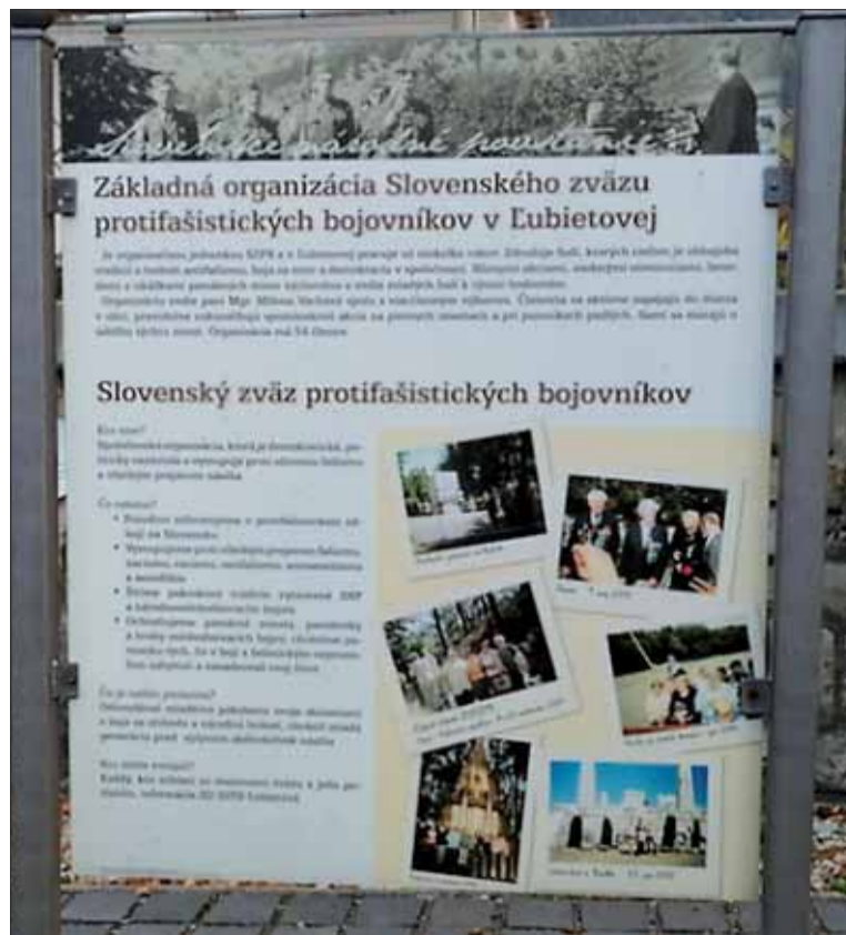
Informačná tabuľa ZO SZPB v Lubietovej na centrálnom námestí obce.

Takáto vizuálne nápaditá tabuľa predstavuje skvelý nástroj, aby si nás všimli aj ľudia – najmä mladí – ktorí sa o nás a naše historické úsilie sami od seba – akosi automaticky – zaujímať nebudú.