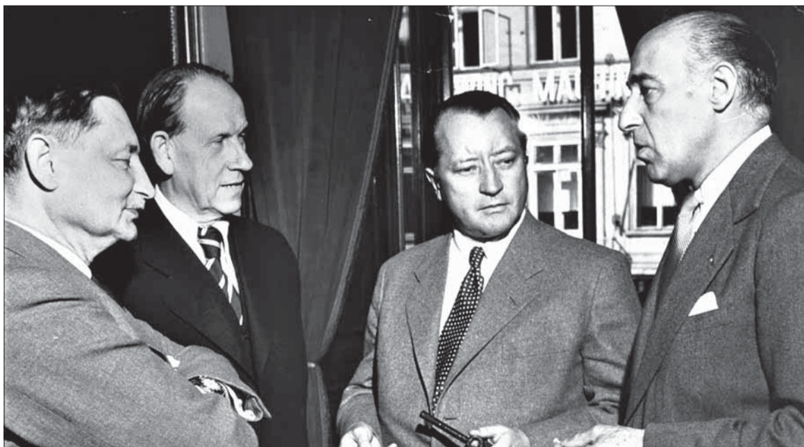
Vladimír Clementis (zľava) s predsedom prvej povojnovej vlády ČSR Zdeňkom Fierlingrom a predsedom Ústavodarného Národného zhromaždenia Antonínom Zápotockým, vpravo veľvyslanec USA v Prahe Laurence A. Steinhardt.