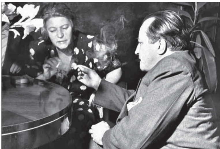
Clementis s Anou Paukerovou z Rumunska, prvou ženou na svete na poste ministerky zahraničných vecí, od roku 1950 tiež perzekvovaná komunistickým režimom.

Radikálne totalitu ako princíp vládnutia v oprávnenom hneve odsudzoval v rozhlasových prejavoch, v novinových článkoch, v úvahách akéhokoľvek druhu. Preto však hovorím o zjednodušení? Jeho podstatou bolo totiž nerozlišovanie medzi druhmi a typmi totality. Nepochopenie faktu, že rovnako nebezpečná ako čierna či hnedá je aj červená totalita, ba zo širšieho pohľadu aj žltá alebo zelená. Pravda, ako vždy v konkrétnych historických chvíľach, ľudia citlivo vnímajú spravidla iba tú aktuálnu.