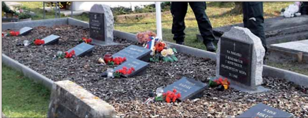
Pamätnica v boji padlých, popravených, umučených a pri výkone služby usmrtených príslušníkov zboru NB.

Nezradili – vydržali. Statočne hrdinsky až do smrti. Dvadsaťo pr-