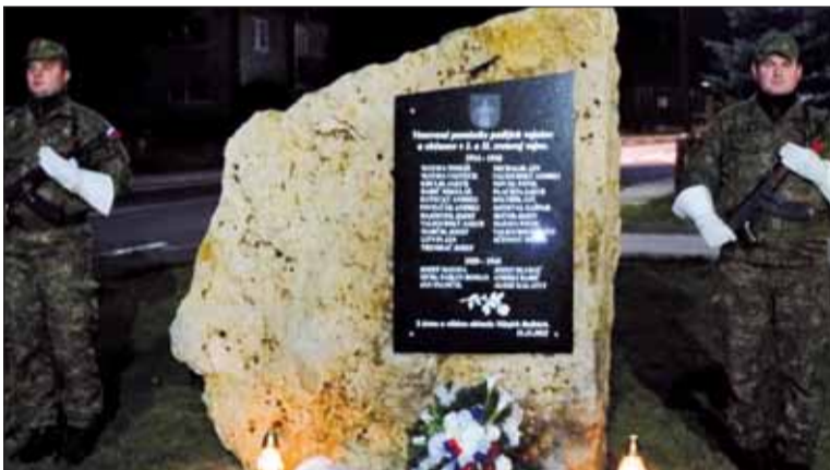
Nočný pohľad na pomník obetiam I. a II. sv. vojny v Nižných Ružbachoch.

Pri príležitosti 104. výročia skončenia 1. svetovej vojny boli 11. novembra v obciach Hniezdne, Forbasy a Nižné Ružbachy odhalené pomníky obetiam 1. a 2. svetovej vojny. Pri každom z nich znela hymna Slovenskej republiky.