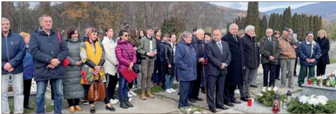
Pohľad na účastníkov pietnej spomienky v Revúcej.

Presne vo výročný deň, hodinu i minútu rozozvučali v našom meste zvony na počesť vojakov, ktorí padli v bojoch za našu slo-