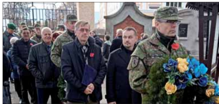
Na úspešnom pietnom podujatí v Rožňave sa podieľali aj ozbrojené sily SR.