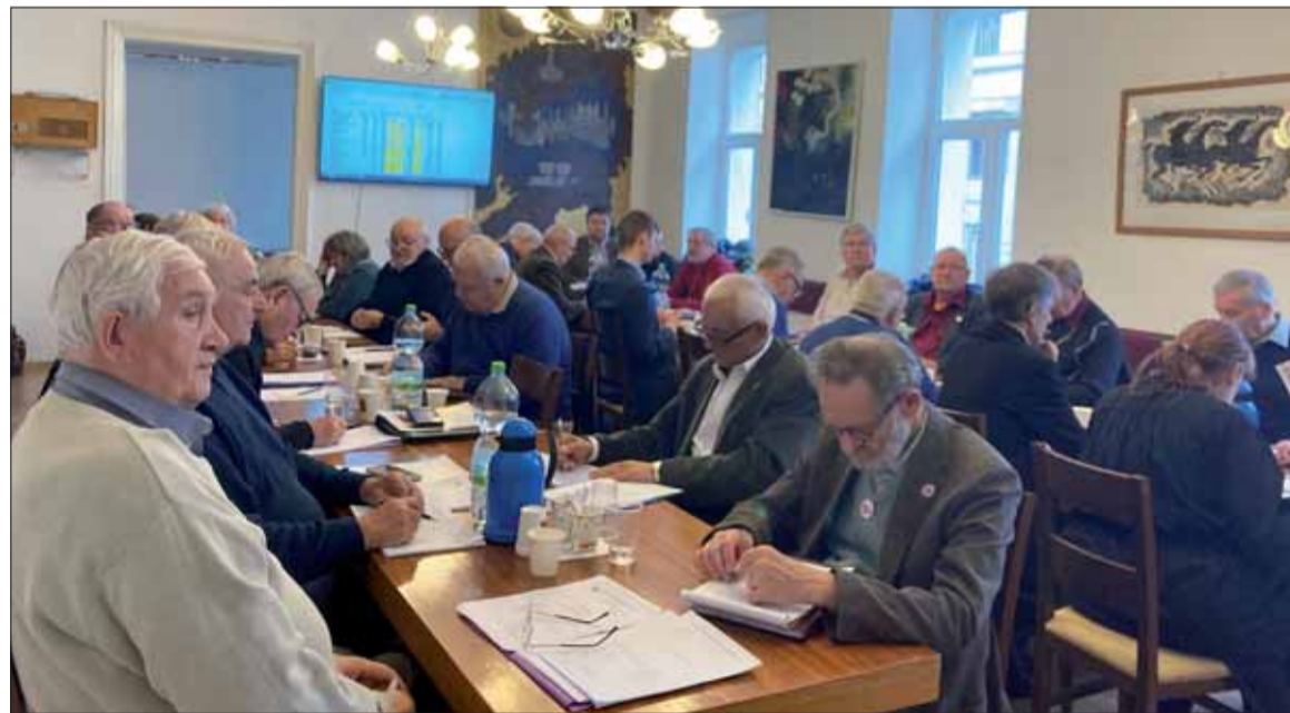
Momentka zo zasadania ÚR SZPB.