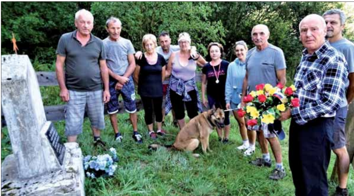
Turisti na pietnom akte pri pomníku na začiatku doliny Šaling.

Turistický oddiel Čierny Balog v spolupráci s obecným úradom usporiadal poslednú augustovú sobotu 49. ročník pochodu vďaka Po stopách SNP. Aktívnym pohybom v peknej prírode v rozľahlom chotári obce, ktorého dominantou je mohutný Klenovský Vepor sa usilujeme mladých motivovať k udržiavaniu tradície Povstania.