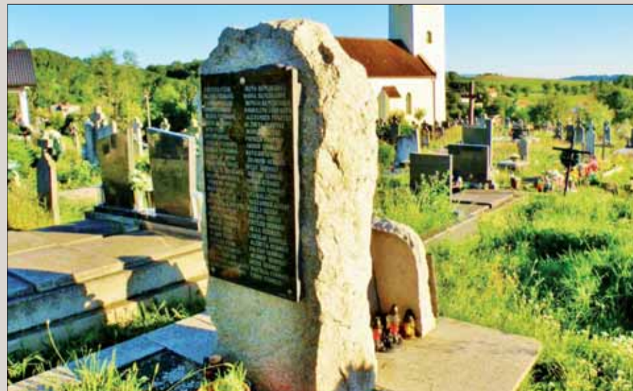
Pomník rómskeho holokaustu na cintoríne v Slatine.