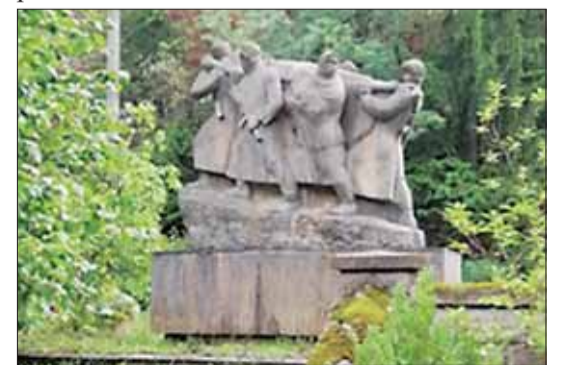
O pamätník na mieste významnom pre SNP sa začali starať Socialisti.sk.

Je na nás, aby sme zabudnuté miesta nielen obnovovali, ale vracali sa na ne opätovne, aby sme si pripomínali, čo sa za nimi ukrýva. Príbehy skutočné a desivé, príbehy o odvahe bojovať proti fašizmu.