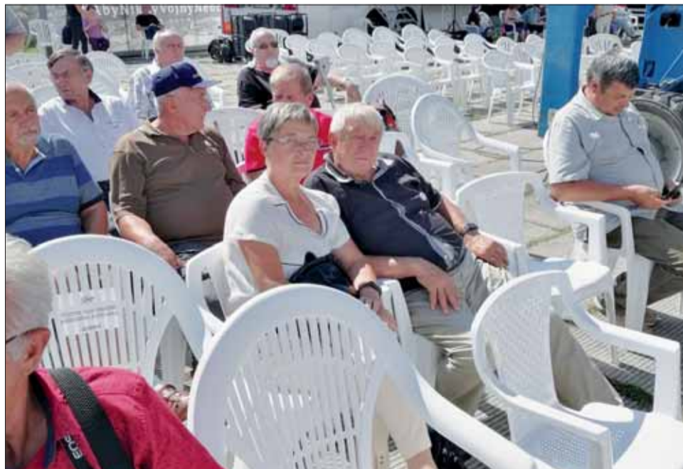
Členovia SZPB z michalovskej oblasti si horko-ťažko vybojovali účasť na ústredných oslavách SNP.

Je nedôstojné, aby pod hlavňami ostrelovačov, kontrolovaní po mene a prechádzajúc cez detektory kovov mohli sa členovia SZPB zúčastniť osláv SNP. Svojou vytrvalosťou sme sa nakoniec dostali do priestoru pamätníka SNP, ktorého návšteva bola zakázaná až do skončenia hlavného programu. Ten bol iba pre vyvolených. Aj tak vďaka MsZ Michalovce za finančnú pomoc na cestu do Bystrice.