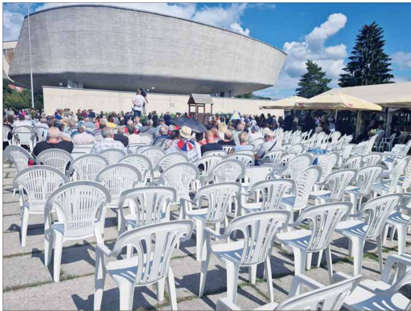
Takto si vláda a vedenie Múzea SNP predstavujú celonárodné ústredné oslavy, ktoré majú posilňovať pozitívny vzťah verejnosti k hodnotám Povstania...