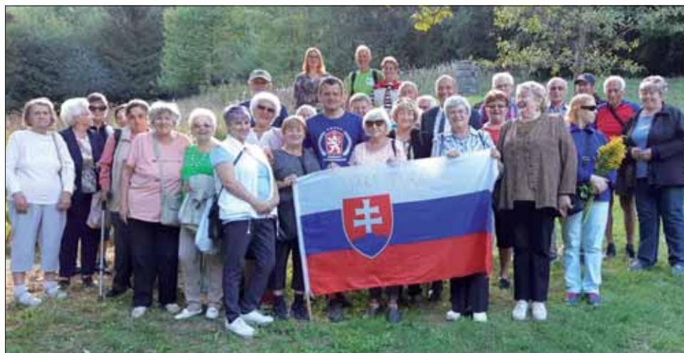
Delegácia zo Starej Turej sa zúčastnila i na krajských oslavách SNP na vrchu Roh pri Lubine.