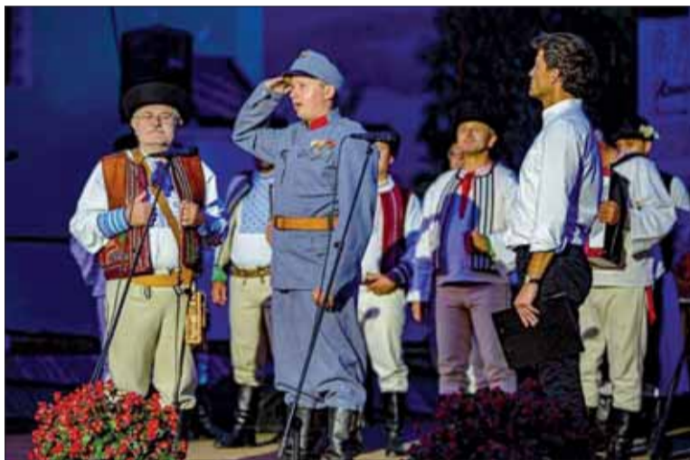
Momentka z programu Piesne vojnou písané.

Bol som 25 rokov riaditeľom Štátneho archívu v Rožňave a folklóru sa venujem vyše 50 rokov, či už ako tanečník, spevák a dnes najmä ako choreograf a režisér. Prameňov, z ktorých sa dá čerpať pri tvorbe programu s vojenskou tematikou som nazbieral neúrekom, z archívnych dokumentov i z rozprávania starého otca a otca, účastníkov oboch svetových vojen a členov SZPB.