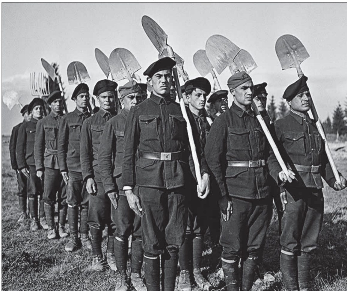
Nastúpená čata rómskeho pracovného útvaru, 1941.

Nie, Rómovia neboli zo Slovenskej republiky deportovaní, aj keď tábor v Dubnici nad Váhom sa na takýto transport pripravoval. Z územia južného Slovenska okupovanom Maďarskom však deportovaní boli. Najprv ich sústredili Komárne a odtiaľ ich deportovali do Dachau. Odtiaľ ich odviezli do ďalších táborov – mužov do Buchenwaldu, ženy do Rawensbrücku. Napriek tomu, že išlo o tisícky ľudí, dodnes nemáme presné čísla. Jediným riešením je štúdium zoznamov z koncentračných táborov a porovnanie s prameňmi z obcí, odkiaľ boli deportovaní.