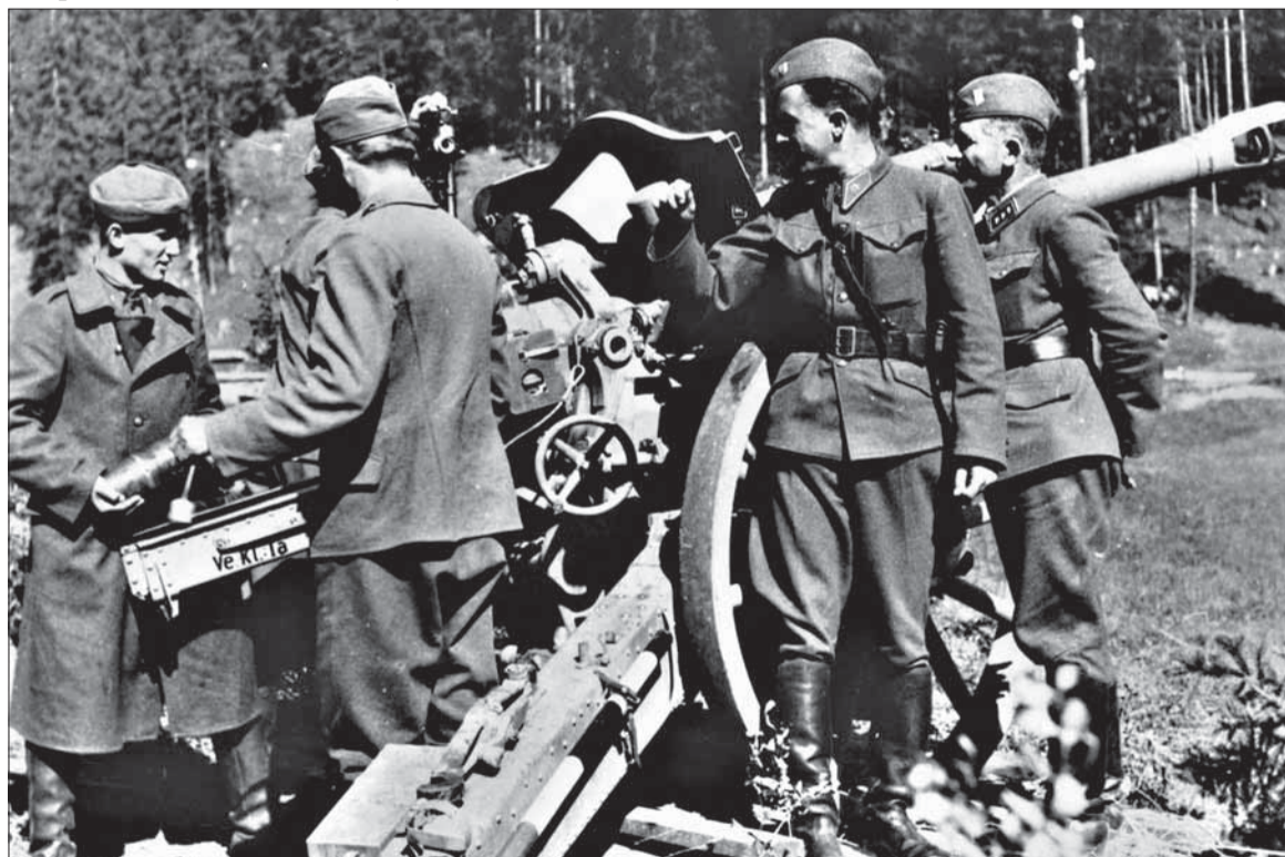
Delostrelecký oddiel skupiny Jánošík pri Červenej Skale, september 1944.