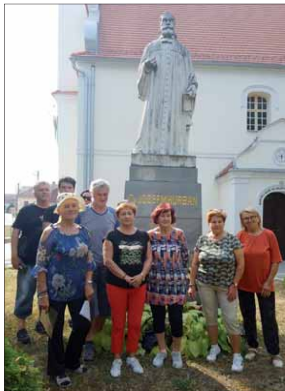
Pri soche J. M. Hurbana.

Členovia ZO SZPB v Šelpiciach s rodinnými príslušníkmi navštívili 13. augusta navštívili Záhorie. Prvá zastávka bola v Brezovej pod Bradlom na cintoríne pri Dejinnom pamätníku hrdinských bojov v rokoch 1848–1849, ale aj v 1. a 2. svetovej vojne a padlých v SNP.