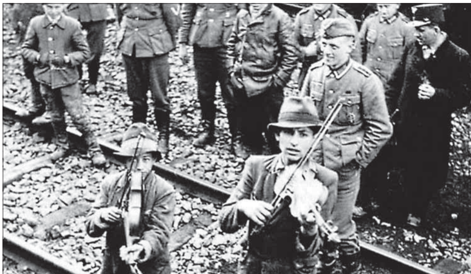
Pri transportoch do koncentračných a vyhľadzovacích táborov si nemeckí trýznitelia vynútili, aby im odvlčení Rómovia zahrali.