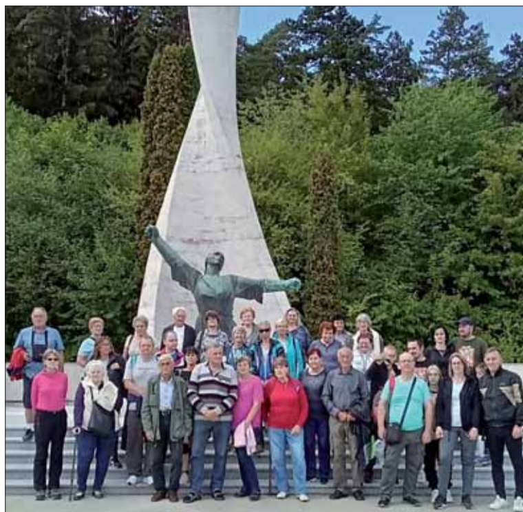
Účastníci spomienkového zájazdu na jednom z najznámejších miest Slovenska – v Nemeckej.

Na spomienkovom zájazde sa zúčastnili členovia ZO SZPB Prievidza, Malinová, Zemianske Kostolany, Dolné Vestenice, Pažiť, Žabokreky nad Nitrou a Partizánske.