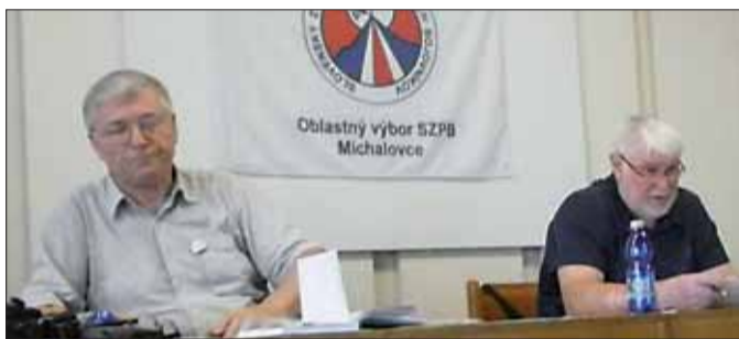
Zo zasadania ObIV SZPB v Michalovciach.

Teraz sa musíme dobre pripraviť na výročné členské schôdze, oblastnú konferenciu a XVIII. zjazd zväzu v budúcom roku. Je potrebné venovať zvýšenú starostlivosť o všetky pamätníky a hroby našich občanov a osloboditeľov z vďačnosti za slobodu,