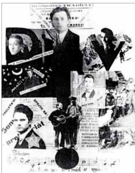
Jedna z koláží Vladimíra Clementisa, DAV 1925.