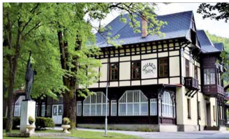
Socha pred Kollárovým domom v Lubochni, kde sa roku 1921 konal zjazd marxistickej ľavice Slovenska a Podkarpatskej Rusi.