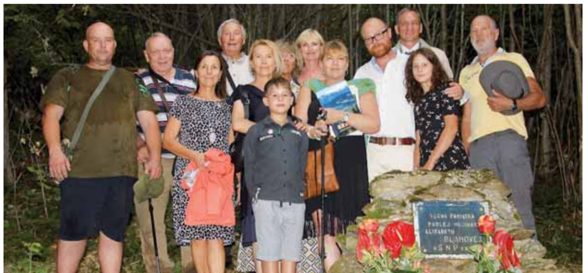
Pri pomníku na konci doliny Zúbra.