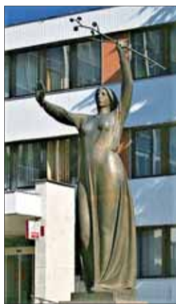
Bronzová plastika Zelená životu, Vranov nad Topľou, detail.