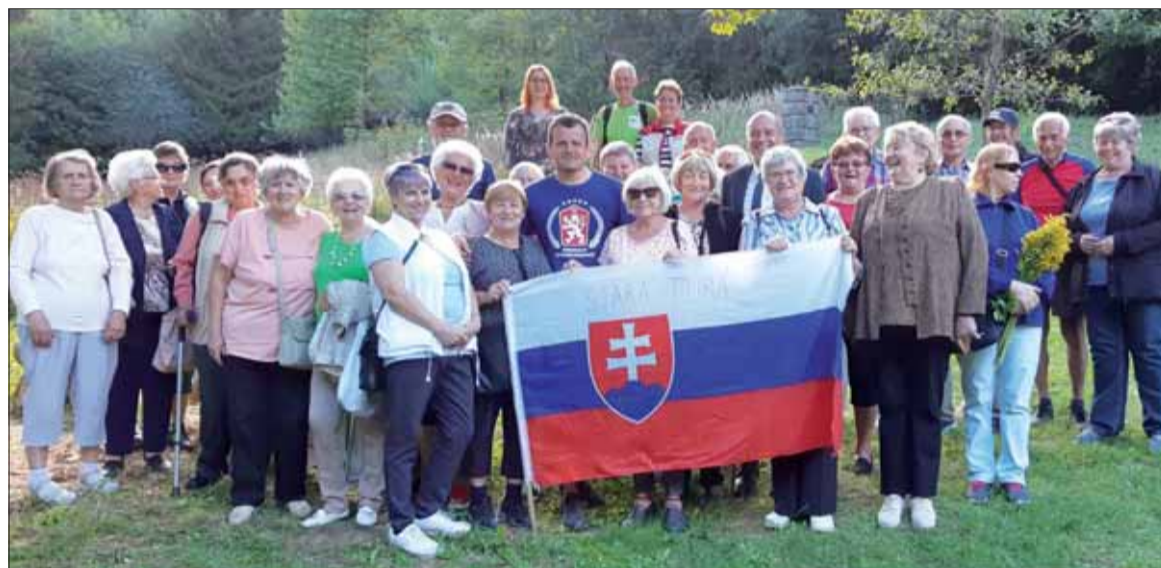
Členovia ZO SZPB zo Starej Turej na oslavách výročia SNP.