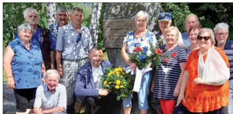
Časť členov ZO SZPB v Liptovskej Kokave.

Na záver osláv sme položili na rázcestí Tichej a Kôprovej doliny spomienkovú kyticu všetkým padlým hrdinom v SNP. Poďakovanie patrí všetkým, ktorí svojou účasťou podporili zachovanie odkazu SNP.