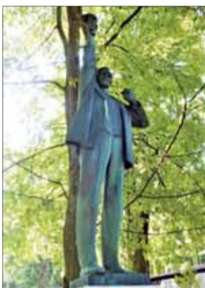
Pomník k 50. výročiu zjazdu ľavicovej časti sociálnej demokracie v Lubochni, detail 1971.