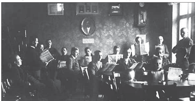
Slovenská čítareň v Starej Pazove v 20. rokoch minulého storočia.