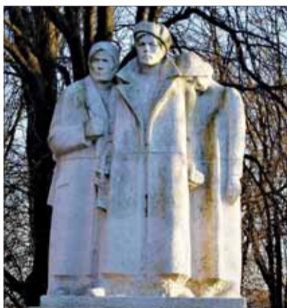
Pamätník bojovníkom proti fašizmu a za slobodu našich národov vo Vranove nad Topľou, detail.