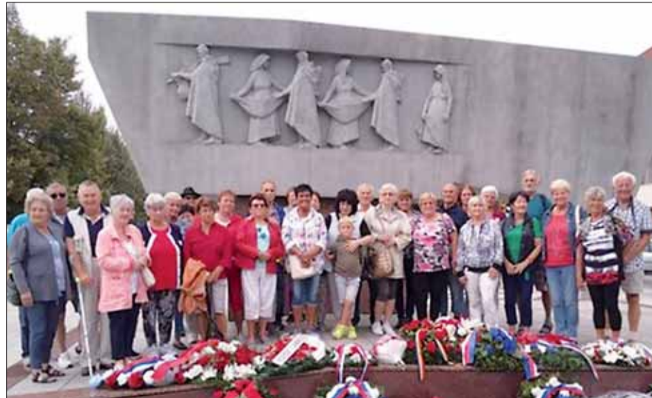
Členovia SZPB z novozámockej oblasti pri pamätníku vo Zvolene.