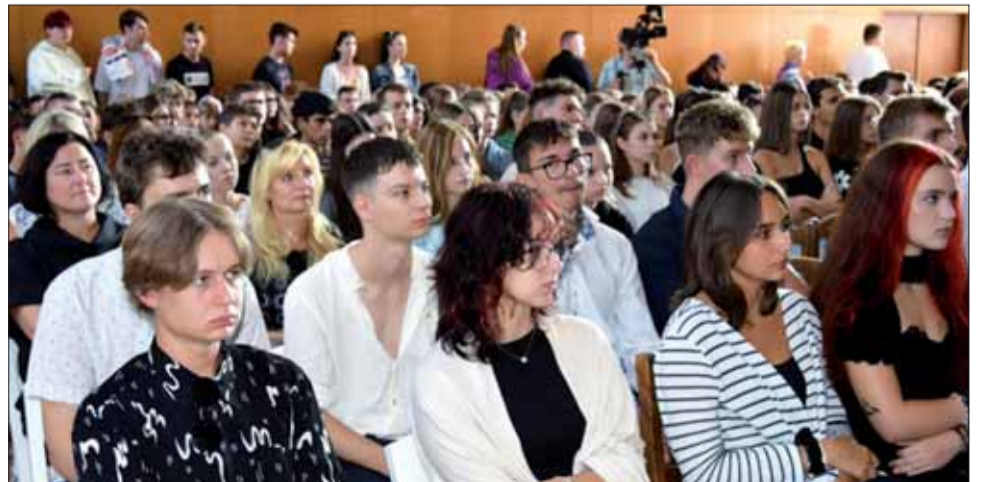
V Humennom sa spomienkové podujatie Nezabudnutí susedia uskutočnilo v centre voľného času už 8. 9. 2022 za účasti až 400 žiakov a študentov.