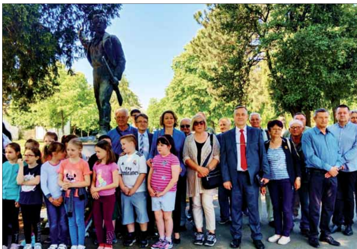
Učiteľia a žiaci Základnej školy národného hrdinu Janka Čmelíka v Starej Pazove pred jeho pomníkom.

Osobne viedol skupinu partizánov pri demontáži časti strategickú železničnej trate Záhreb – Belehrad. Obyvatelia Starej Pazovy a okolitých obcí ocenili aj dobre zorganizovanú akciu vypálenia slnečnicového