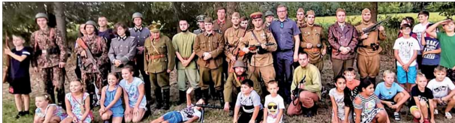
Po divadelnom predstavení na futbalovom ihrisku v Ruskej Porube sa miestne deti chceli odfotografovať s hercami.

Takéto osobné stretnutia vo väčšom alebo menšom množstve účastníkov sú kľúčové pre vývoj hnutia v MS a osobitne v Mladej Matici. Bolo to vidieť i v reakciách účastníkov zrazu, keďže mnohí sa spolu stretli po dlhšom čase a mali si čo povedať. Pevne veríme, že situácia z posledných dvoch rokov sa už opakovať nebude a že aj mladí ľudia znovu obnovia svoj návyk na podobné akcie.