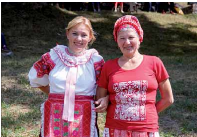
Stretnutie generácií charakterizuje i zachovávanie tradícií. V ich najkrajšej podobe.