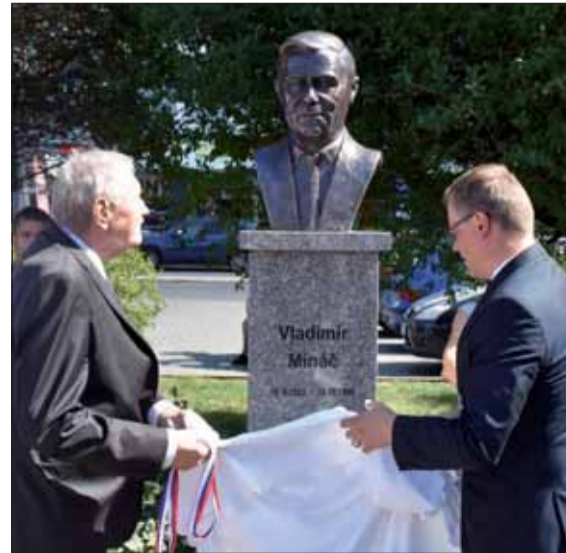
V rimavskosobotskej Aleji dejateľov pribudla busta Vladimíra Mináča.

SZPB si pripomenie význam a odkaz tejto nezabudnuteľnej a trvale prítomnej osobnosti v našom národnom, kultúrnom, historickom a politickom dianí na protokolárnom podujatí začiatkom septembra v Bratislave spolu s oceňovaním ďalších jubilujúcich osobností post mortem, ako aj žijúcich predstaviteľov nášho umeleckého a spoločenského života.