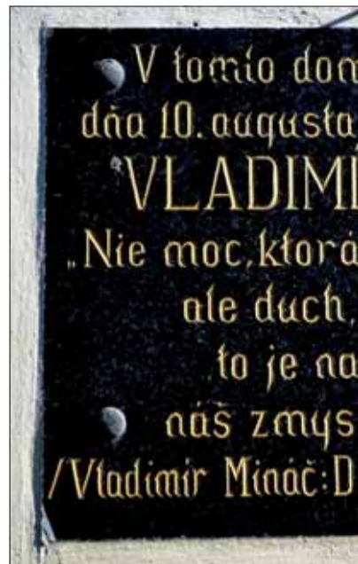
Pamätná tabuľa na rodnom dome

Uniknúť sa nedalo a tých, čo sa o to pokúsili, zastreli. Nemci ženy nahnali do kostola, chlapcov do krčmy (tak, ako to robili vždy a všade), a tam ich začali (podľa