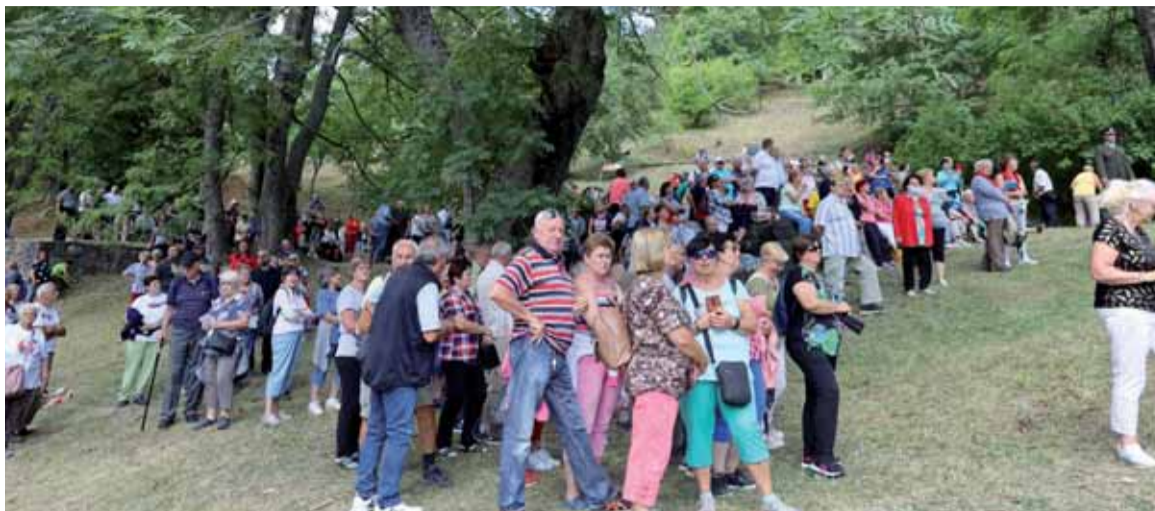
Aj tento rok prišli na Stretnutie generácií vzdať hold hrdinom SNP davy ľudí zo všetkých kútov Slovenska.

Bezchybnú organizáciu osláv podobne ako po minulé roky mala na starosti spolu s Múzeom SNP oblastná organizácia SZPB Banská Bystrica. Žiaľ, ani to neprimälo verejnoprávnu RTVS, aby vo večernom spravodajstve spomenula náš zväz čo len jediným slovom.