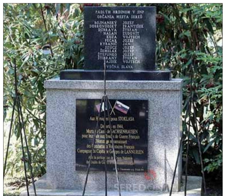
Pomník SNP v parku v Šintave.