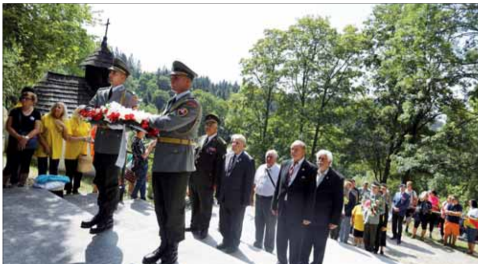
Delegácia SZPB kladie veniec úcty obetiam nacistického besnenia na Kališti.