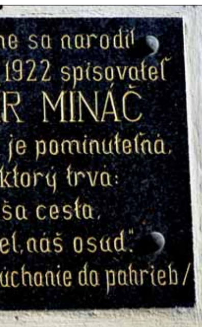
Vladimír Mináč v Klenovci.