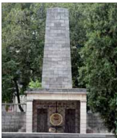
Hrob neznámeho ľudového protifašistického bojovníka v Košiciach – základný kameň – august 1948.