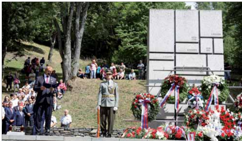
Predseda parlamentu Boris Kollár počas prejavu.