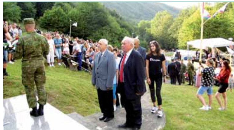
Stovky ľudí sledovali v Lehote pod Vtáčnikom aj pietny akt.