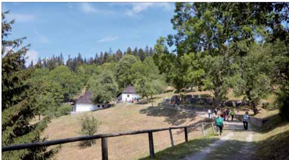
Pred takmer 78 rokmi prišla týmto chodníčkom do osady Kalište smrť. Dnes tadiaľto chodia tisíce, ktoré pamätajú, čo znamená fašizmus a nacizmus.