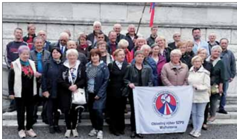
Účastníci zájazdu zo Zemplína v Háji Nicovô.