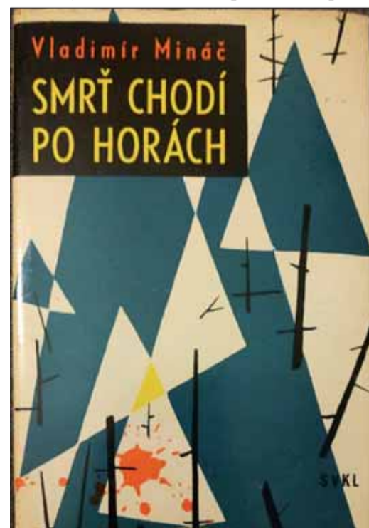
Titulná strana Mináčovej knihy Smrť chodí po horách, Slovenské vydavateľstvo krásnej literatúry 1961.

O tom, že tú cestu vôbec prežil, hovoril ako o obrovskom šťastí. Na každom kroku číhala smrť. Keď ich viezli z Bystrice do Nitry, zastali v Kremničke. Ale pec bola vtedy plná. „V ten deň si už odstrieli svoje,“ povedal s úľavou. O tom,