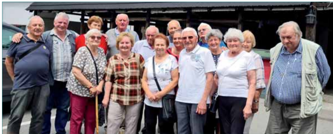
Na stretnutí v Španej doline vládla priateľská atmosféra.

Okrem pracovnej agendy členskej schôdze bol venovaný dostatočný priestor na diskusiu medzi zástupcami partnerských ZO SZPB s cieľom udržať dobrú spoluprácu aj do budúcnosti.