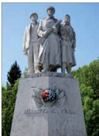
Víťazstvo, Pamätník Červenej armády na Dargove, travertín 1955.