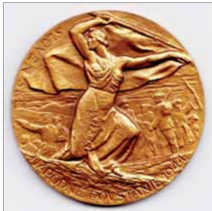
Medaila SNP 1944, bronz, 1946.