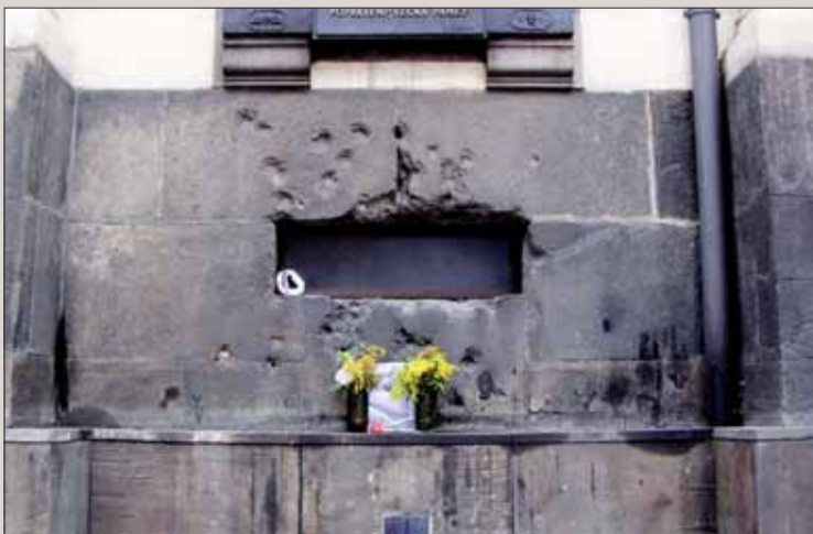
Okno do krypty Kostola sv. Cyrila a Metoda, ktorým púšťali dnu prúd vody a dusivý plyn.

Ulice pomenované po Gabčíkovi a Kubišovi možno o.i. nájsť v Prahe blízko pomníka operácie Anthropoid, ktorý odhalili v roku 2009. Od roku 2010 existuje v krypte Kostola svätých Cyrila a Metoda v pražskom Novom Meste verejne prístupný Národný pamätník venovaný všetkým hrdinom heydrichiády.