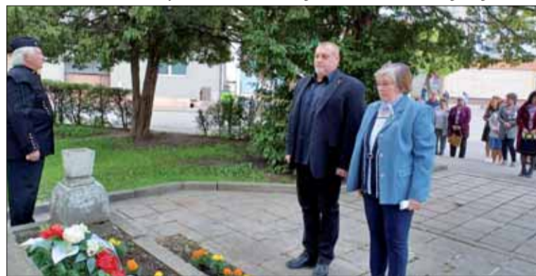
V Dobšinej si uctili obeť 2. svetovej vojny pri pomníku osloboditeľov.

Na záver spomienkovej slávnosti primátor mesta poďakoval prítomným za účasť a uctenie si pamiatky bojujúcich i padlých vojakov v 2. svetovej vojne.