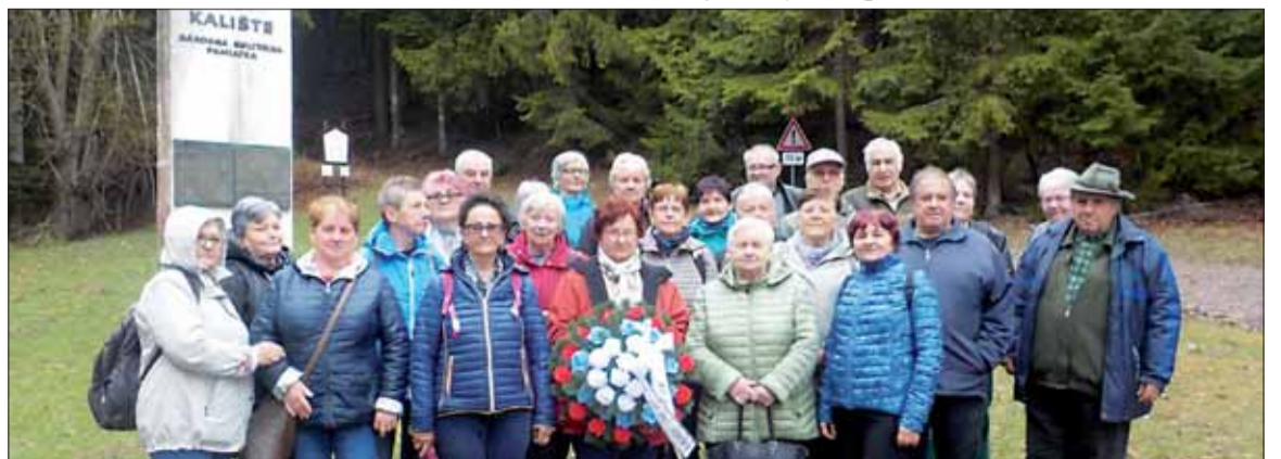
Účastníci zájazdu z Prašníka na Kalište.

Na to, čo sme videli a počuli nechceme zabudnúť, aby naše deti a vnúčatá nikdy nezasiahla takáto otrasná tragédia. Stále sú aktuálne slová generála Ludvíka Svobodu: „Nikdy nesmieme zabudnúť, ako ľahko sme slobodu stratili a ako ťažko, za cenu akého veľkého úsilia a veľkých obetí sme ju dobývali späť.“