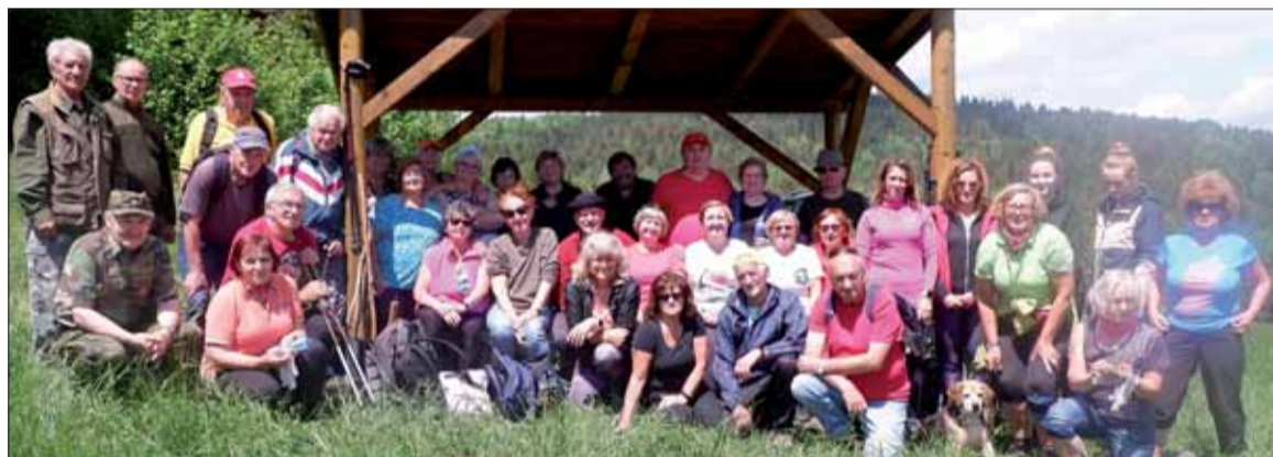
Účastníci výstupu na Marmon.