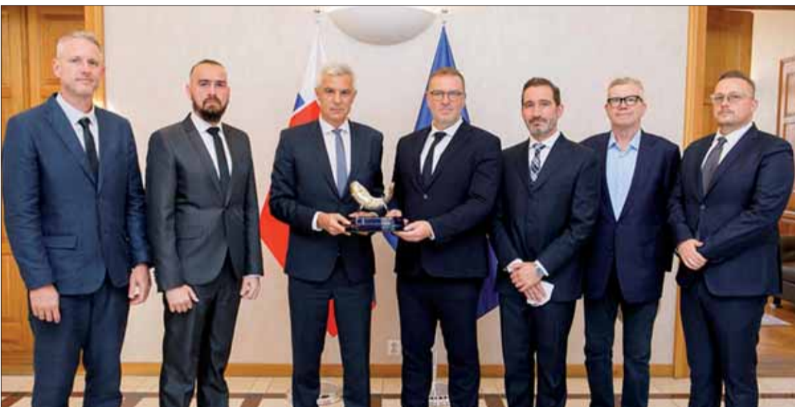
V predvečer Pamätného dňa obetí holokaustu v roku 2021 prijal minister zahraničných vecí Ivan Korčok predstaviteľov ÚŽŽNO, ŽNO Bratislava, Múzea židovskej kultúry a jeho Múzea holokaustu v Seredi.

nou. V súčasnosti sú tieto pamiatky vo veľmi špecifickej situácii. Iným menšinám, či už etnickým alebo náboženským, sa nestalo, aby prakticky z roka na rok zanikli, ako sa to stalo židovskej komunite. Inými slovami, zrazu nemal kto chodiť do synagóg, zrazu sa nemal kto starať o hroby. Cintoríny i synagógy si vyžadujú opateru, údržbu. Dnes nemáme ambície prevádzkovať synagógy na pôvodný účel, pretože jednoducho niet pre koho. Preto sa snažíme uzatvárať dohody so štátom, samosprávami i súkromnými subjektmi a sme veľmi radi, keď sa nám podarí dosiahnuť náš cieľ – nájsť nové využitie synagóg na kultúrne účely alebo iné všeobecne prospešné účely. Židia na Slovensku takmer zanikli pričinením štátnej moci a im zhabaný majetok prešiel do rúk štátu či arizáciou jeho prísluhovačom, radi by sme dnes našli systémové riešenie situácie – spolu s predstaviteľmi súčasného Slovenska sa pokúšame nájsť spôsob, ako zabrániť úpl-