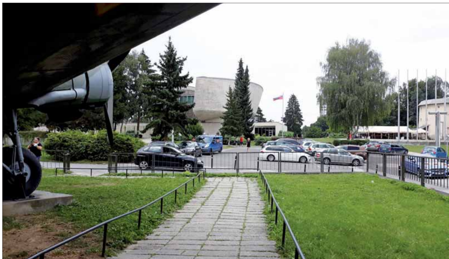
Postoj SZPB k likvidácii Múzea SNP ako civilnej celonárodnej inštitúcie je pre ministra Naďa dôvodom na likvidáciu zväzu.

Ak v takejto situácii chce minister obrany zlikvidovať najväčšiu protifašistickú organizáciu na Slovensku, ktorá jediná združuje aj priamych účastníkov odboja a SNP, je to mimoriadne vážny dôkaz pokusu o likvidáciu ústavných demokratických princípov Slovenskej republiky. A zároveň opodstatnenosť existencie SZPB a potreby jeho posilnenia v záujme zachovania antifašistického a demokratického princípu nášho štátu.