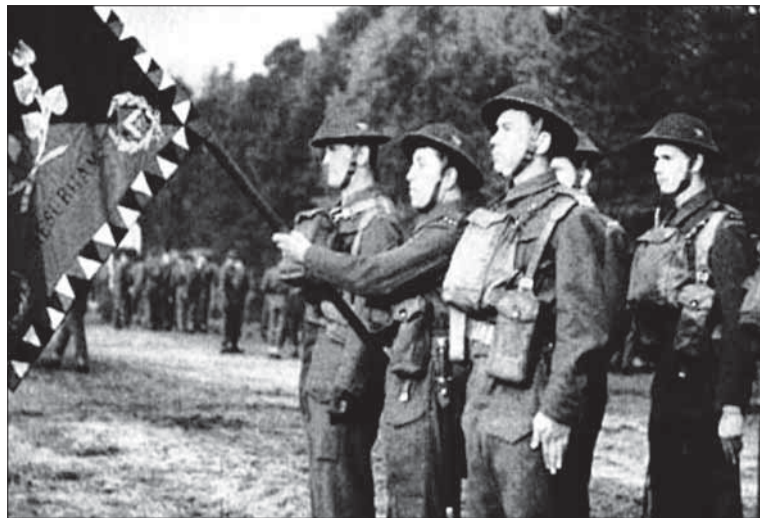
Československí vojaci vo Veľkej Británii.

Ak sa vysloví v českom a vari aj v slovenskom prostre-