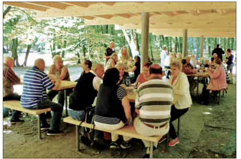
Účastníci podujatia si vyskúšali nové zariadenia v lokalite Malý Slavín.