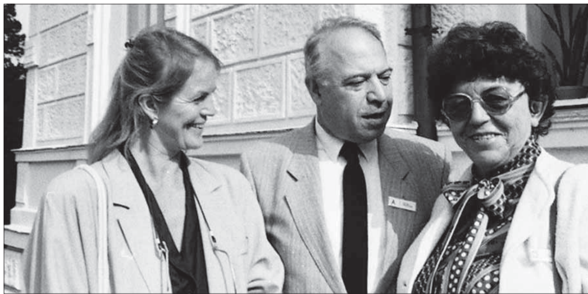
Klára Jarunková rada tvorila aj v Dome spisovateľov v budmerickom kaštieli. Na snímke so spisovateľmi Astrid Saetherou z Nórska a Gyorgyom Sebestyenom z Rakúska.

Jarunková nenapísala heroický vojnový román, ale ako žena spracovala udalosti tak, ako sa premietali do života jednoduchej rodiny, matky a jej troch dcér. Sugestívne vykreslenie atmosféry ťažko skúšaného mes-