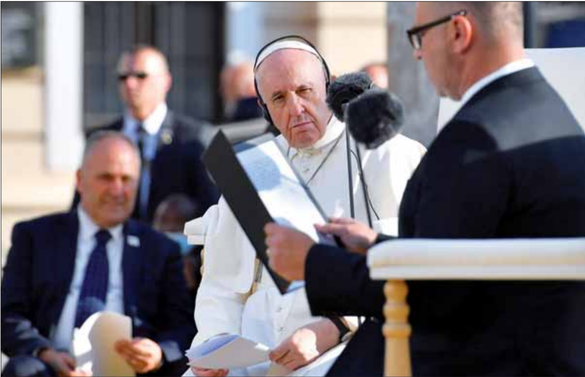
Suverén mestského štátu Vatikán pápež František sa počas svojej návštevy Slovenska stretol 13. 9. 2021 na Rybnom námestí v Bratislave s predstaviteľmi Židovskej komunity.