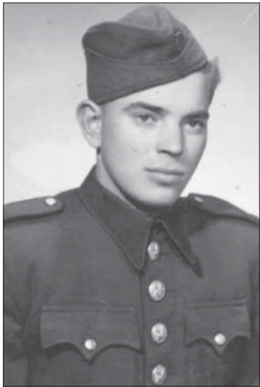
Vojak Ján Štefánik.

ruku k dielu. Ján Štefánik vyše dvoch týždňov pod velením kapitána Šišku čistil staršie zbrane pred bojovým nasadením a do-