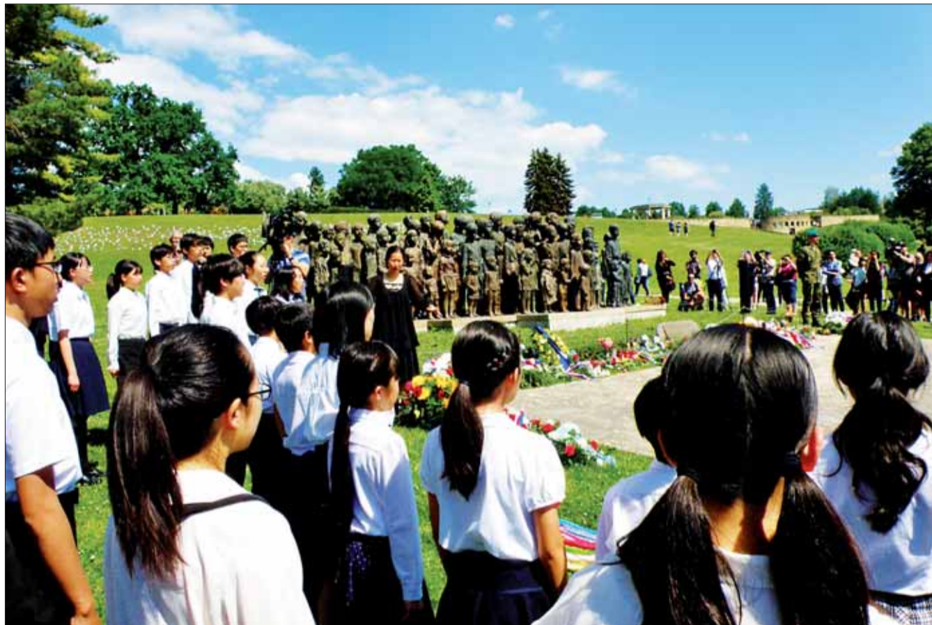
Počas spomienkového podujatia k 80. výročia brutálneho zničenia Lidíc nemeckými nacistami pri Pomníku detí zavraždených 88) zaspieval zbor Japonskej školy v Prahe dojímavú pesničku o lietajúcom žeriavovi. Na oficiálnych oslavách 12. júna sa zúčastnila celá česká politická elita. Prezident Miloš Zeman poslal veľký veniec. Nechýbali ani predstavitelia našich partnerských združení – ČSBS a Čs. obce legionárskej.

Ak chcú byť dnešné politické strany skutočne antifašistické, musia si uvedomiť, že je nevyhnutné vyhraničiť sa práve voči tomuto prúdu. Nie prázdne reči o demokracii, západnej orientácii či o všetko ospravedlňujúcom boji proti Ficovi, ale práve ostré protipostavenie sa tejto konzervatívno-fašistickej aliancii je kľúčovou, ba osudovou výzvou pre Slovensko.