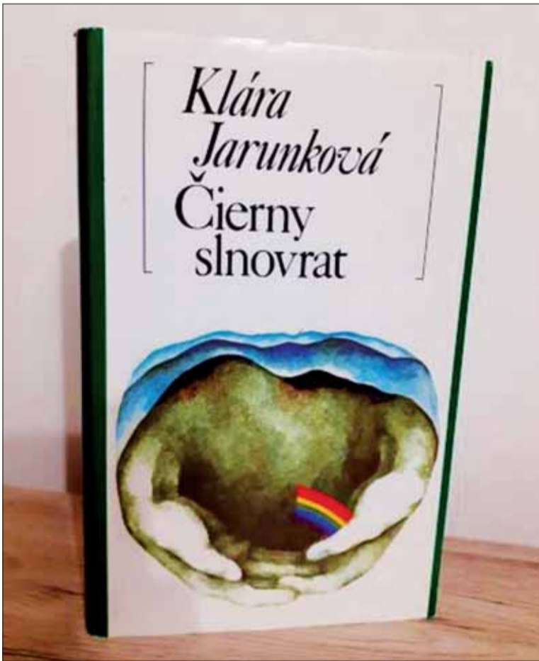
Román Čierny slnovrat vyšiel v roku 1979 vo vydavateľstve Slovenský spisovateľ.

la, takmer celý pracovný život strávila ako redaktorka v satirickom časopise Roháč.