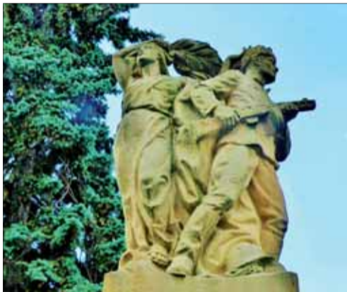
Pomník Červenej armády v Krupine, 1950.