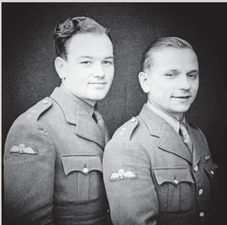
Najlepší kamaráti Jan Kubiš (vľavo) a Jozef Gabčík.