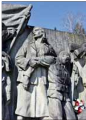
Legenda o práci a boji, 1951–53, detail.