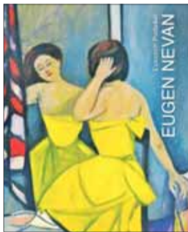
Obálka publikácie E. Podušela Eugen Nevan, SNM MŽK 2020.