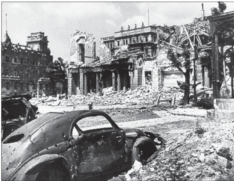
Budapešť bola ťažko zasiahnutá bojmi – fotka kráľovského paláca.

Našiel som babku a šiel som k nej. Otec sa našťoval, došiel som k nemu totiž v sprievode mamy a otec ma nespoznal, pretože som bol v uniforme. Spýtal sa: Čo to máš za Rusa?! Čo chce? Potom sme sa zvitáli, mama si aj poplakala. Aj ostat-