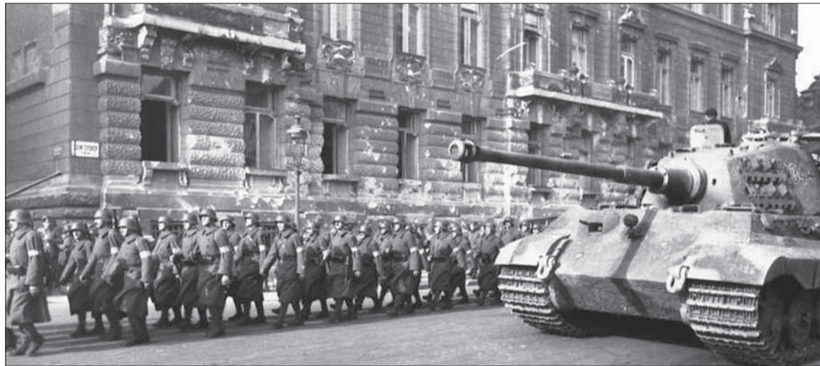
Nemecký Tiger II v Budapešti 1944.

Horthy nemusel odstúpiť, Horthyho ukradli tak, ako v Taliansku ukradli Mussoliniho. Horthy padol a k moci sa dostala ešte horšia a nebezpečnejšia vláda.