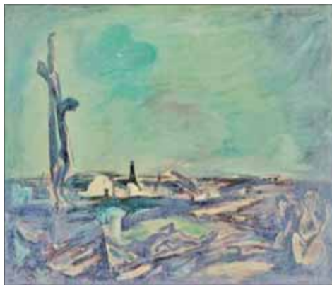
Lidice, olej 1943 SNG.