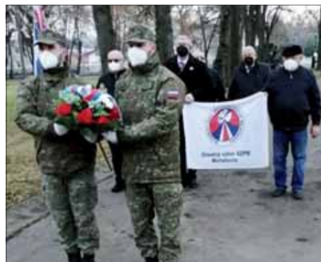
Účastníci pietneho aktu v Michalovciach.

V priebehu novembra uskutočnil náš ObIV niekoľko podujatí k 77. výročiu oslobodenia miest okresov Michalovce a Sobrance. Hoci kvôli pandémie v tichom režime bez príhovorov, v Michalovciach na ústrednom cintoríne pad-