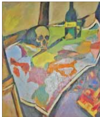
Mapa sveta 1944.