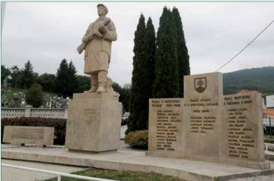
Obnovený pomník SNP.