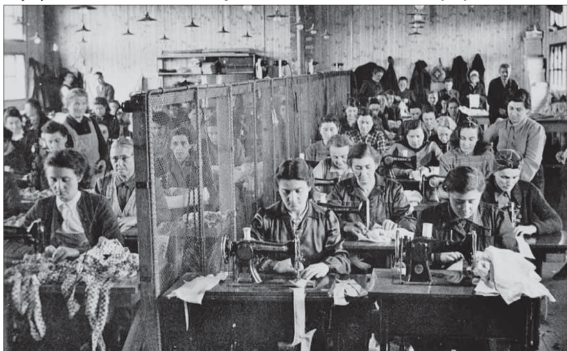
Pracovný tábor v Novákoch, krajčírka dielňa.

(Úprava a medzititulky redakcia Bojovník.)