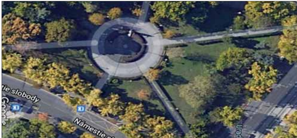
Hrob neznámeho vojaka chceli pôvodne umiestniť do tichého parku vedľa úradu vlády.

terstva financií SR, Pamiatkového úradu SR, Kancelárie Národnej rady SR, Kancelárie prezidenta SR, troch zástupcov hlavného mesta SR Bratislava a troch zástupcov mestskej časti Bratislava-Staré Mesto.“