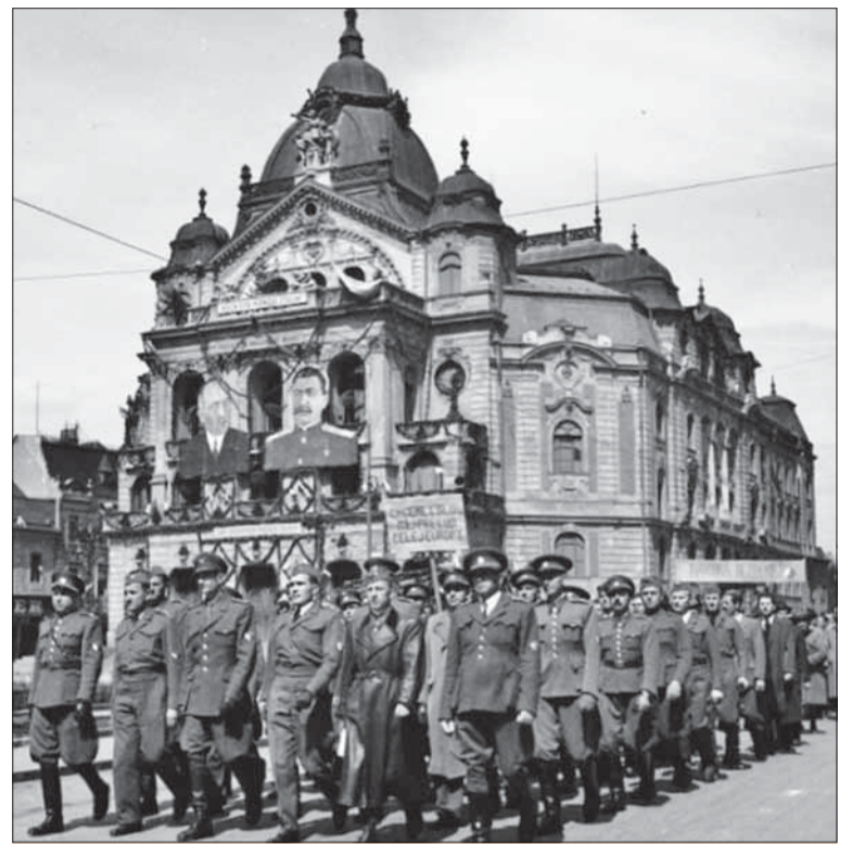
Prvý máj 1945 v oslobodených Košiciach.

Keď ma zaviedol k reštaurácii Peking na Majakovkého ná-