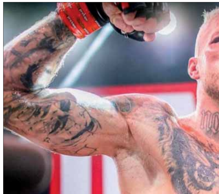
Radek Roušal s Hitlerom na zdvihutej ruke.