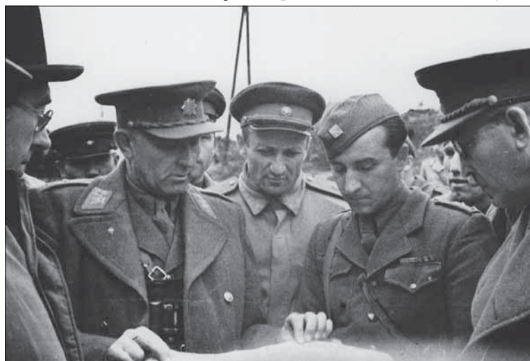
Ludvík Svoboda počas druhej svetovej vojny.

Nový sovietsky líder na zjazde generála demonštratívne objal a celú rodinu pozval na dovolenku do vládneho zariadenia na Kryme, kde sa Svoboda stretol aj s maršalmi. Moskva ho takýmto spôsobom rehabilitovala. Môže sa niekto čudovať, že pani Zoe ostro protes-