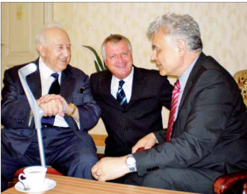
Tomáš Švec s hrdinom západného odboja generálmajorom Ivanom O. Schwarzom (vľavo) na ÚR SZPB v júni 2009. V strede Petr Švanda.