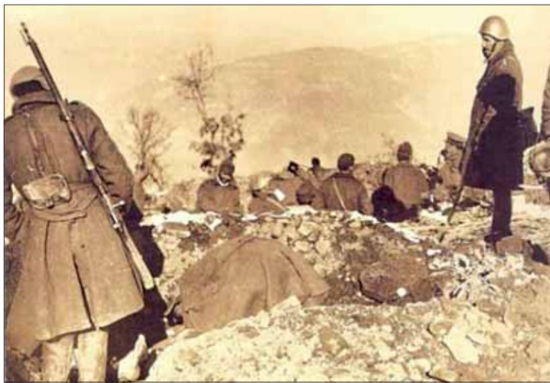
Talianska invázia do Grécka narazila na odhodlanú armádu.

Joseph Goebbels, šéf nacistickej propagandy: „Pohybujeme sa pomaly v Grécku ... Gréci sú statoční bojovníci... Obsadené zákopy sú plné mŕtvov a náš Führer obdivuje najmä odvahu Grékov.“