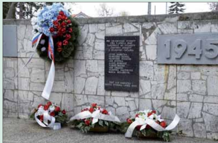
Pamätník Oslobodenia Stupavy.

Prostredníctvom rozhlasu mesta Stupava bola táto významná udalosť pripomenutá všetkým obyvateľom nášho mesta, ktorí sa nemohli zúčastniť na kladení vencov z dôvodu obmedzení vyhláškou hlavného hygienika SR.