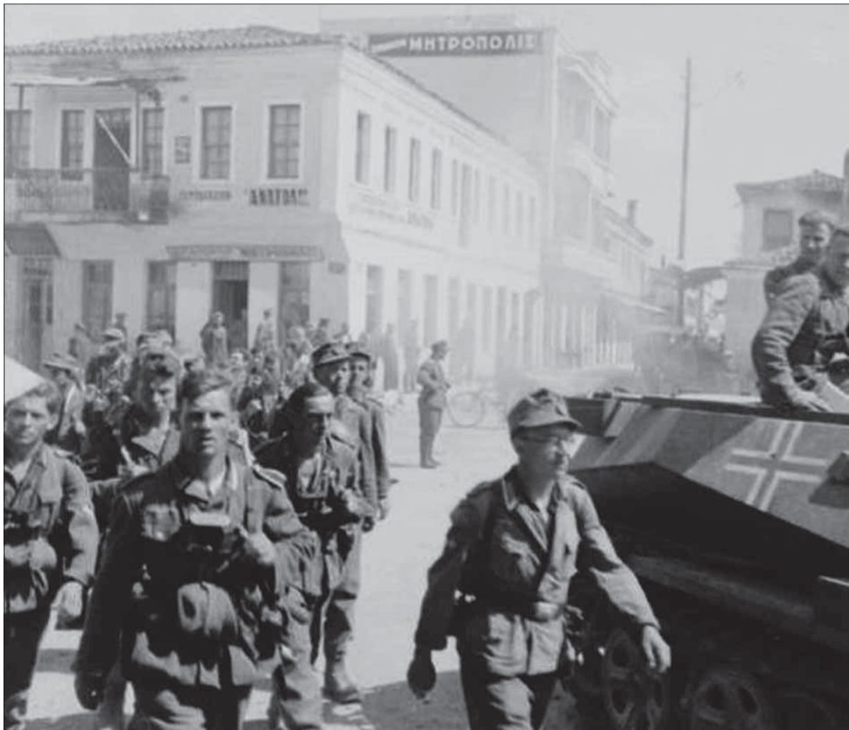
Nemecké jednotky pochádzajúce ulicami Atén.

V oblasti sa nenachádzali väčšie grécke sily, zatiaľ čo britská obrnená brigáda dislokovaná medzi mestom Veria a Vardarom sledovala posuny nacistov bez toho, aby niečo podnikla. Vojen-