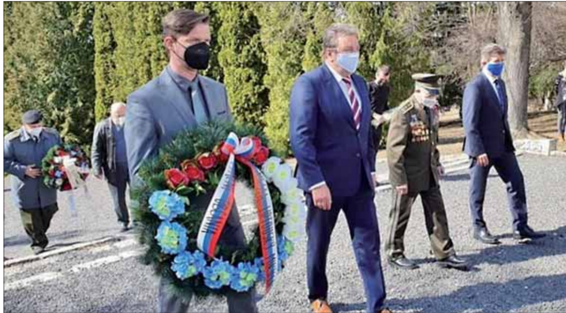
Pietny akt pred pamätníkom padlým vojakom 1. čs. armádneho zboru Háji Nicovô.

Boje, ktoré predchádzali oslobodeniu centra Liptova, sa považujú po Karpatsko-duklianskej operácii za najťažšie na území Slovenska. Vyžiadali si