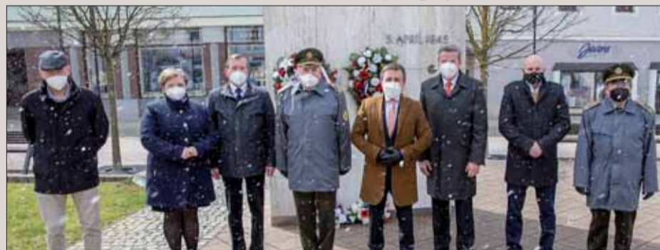
Skromná, ale srdečná oslava oslobodenia Dolného Kubína.

Piateho apríla uplynulo 76 rokov, odkedy dolnooravské mesto Dolný Kubín privítalo osloboditeľov – Červenú armádu a rumunských vojakov, ktorí im priniesli vytúženú slobodu. Na ich počesť, ako prejav vďaka a úcty tým, ktorí sa už nemohli radosť z víťazstva nad nemeckými okupantmi, mesto Dolný Kubín vybudovalo na Námestí P.O. Hviezdoslava pamätník osloboditeľom.