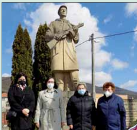
ZO SZPB v Dolných Vesteniciach nezabúda na osloboditeľov.

Aj my sme si pripomenuli hrdinov, ktorí nám 4. 4. 1945 v ťažkých bojových podmienkach priniesli vytúženú slobodu. Tak, ako inde na Slovensku, aj na Hornej Nitre túto chvíľu ľudia túžobne očakávali. Priniesli nám ju vojská 2. ukrajinského frontu: 53. sovietskej a 1. rumunskej armády.