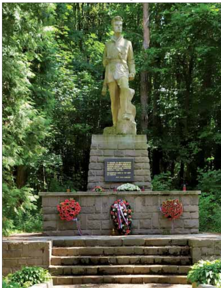
Pamätník obetiam hromadného vraždenia v lesoparku Bôr.

bohatší mešťania z Uhorska, v dvadsiatych rokoch tu pár týždňov strávil aj Pavol Országh Hviezdoslav. Okrem