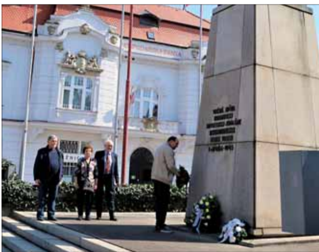
Pietna spomienka v Trnave.