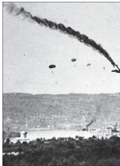
Výsadosk príslušníkov leteckých síl.