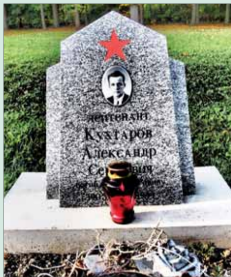
Náhrobný kameň Aleksandra S. Kuchtarova v Michalovciach.

predkov. Miestny Klub vojenskej histórie sa na základe žiadostí venuje pátraniu po padlých sovietskych vojakoch.