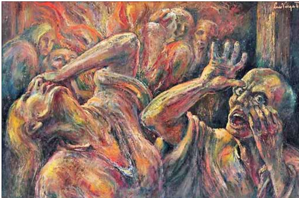
Výjav z koncentráka, olej 1944, SNG.