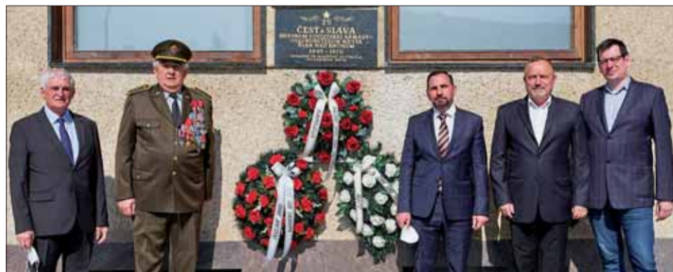
Účastníci pietneho podujatia.

va. Po prebrodení Hronu sa začali pouličné boje. Najtuhšie boli v okolí biskupského kaštieľa. Na Veľkonočnú nedeľu 1. apríla 1945 nadranom oddiely 133. divízie 2. ukrajinského frontu Červenej armády a s ním aj vojaci 53. divízie Rumunskej kráľovskej armády vyhnali okupantov z mesta.