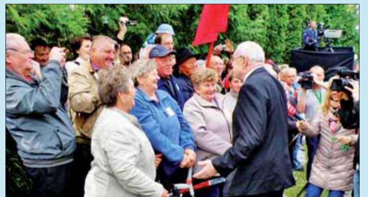
Ivan Gašparovič v družnom rozhovore s členkami SZPB z Košíc, 8. máj 2015 Háji Nicovô.

Pri okrúhlym, 70. výročí oslobodenia a porážky fašistických vojsk v Európe sa ústredné oslavy konali 8. mája 2015 v Liptovskom Mikuláši, presnejšie pri Pamätníku a vojenskom cintoríne príslušníkov 1. čs. armádneho zboru v Háji Nicovô. Iste si mnohí pamätáte na ten jasný jarný deň, desiatky autobusov a tisíce ľudí zo všetkých kútov Slovenska.