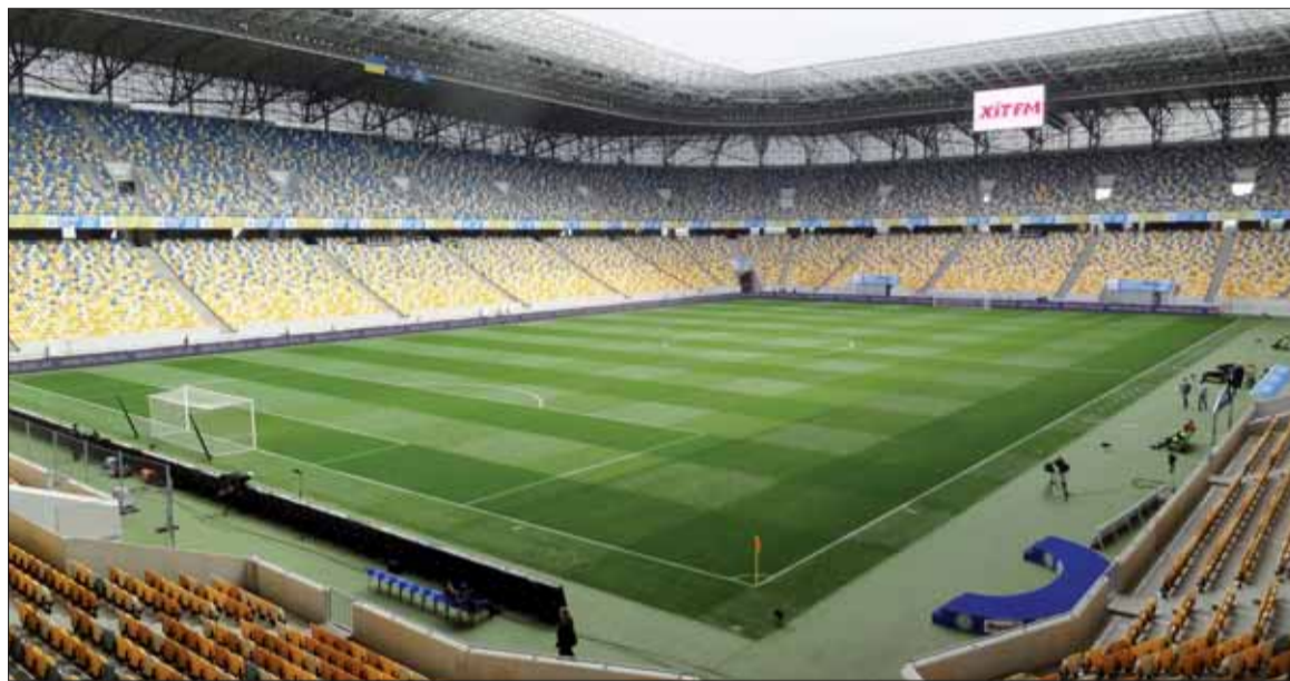
Tento štadión sa má volať po Stepanovi Banderovi.

Po vojne prešiel Šuchevič aj s torzom ukrajinských nacionalistov do ilegality a viedol ozbrojené akcie proti sovietskej vláde. Zomrel v marci 1950 počas prestrelky s jednotkami sovietskeho ministerstva vnútra.