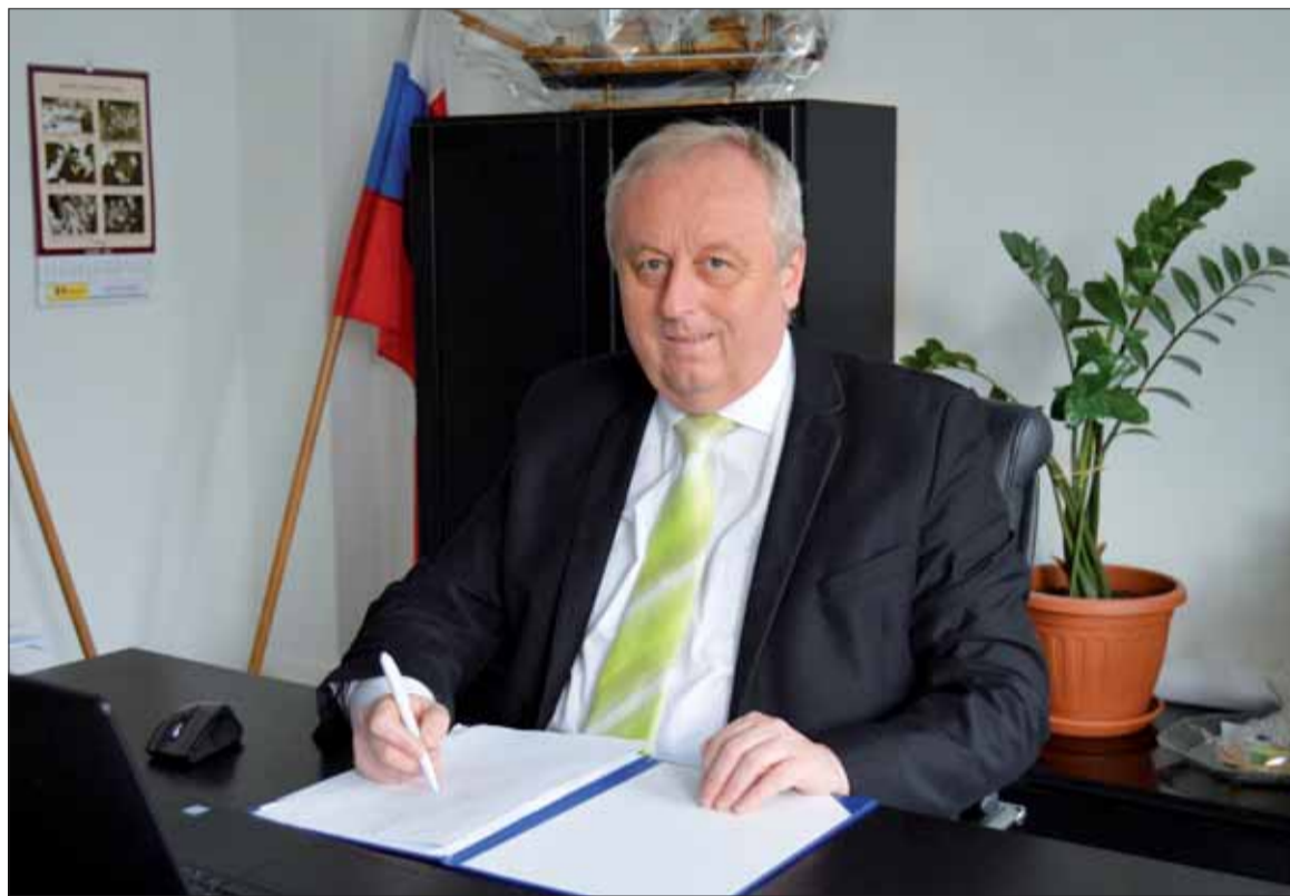
Primátor Turčianskych Teplíc Igor Hus.