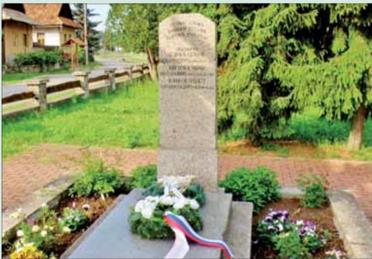
Pri pomníku osloboditeľom v Lišove sa v spolupráci so SZPB každoročne koná pietny akt kladenia vencov.