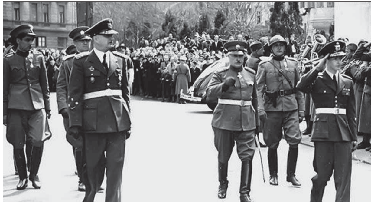
Kráľ Peter II. zdraví vojenské jednotky pred katedrálou v Belehrade na jar 1941.

Napriek pokusom Simovićovej vlády o zmiernenie vzťahov s Nemeckom, nacistický vojnový mechanizmus rozkrútil