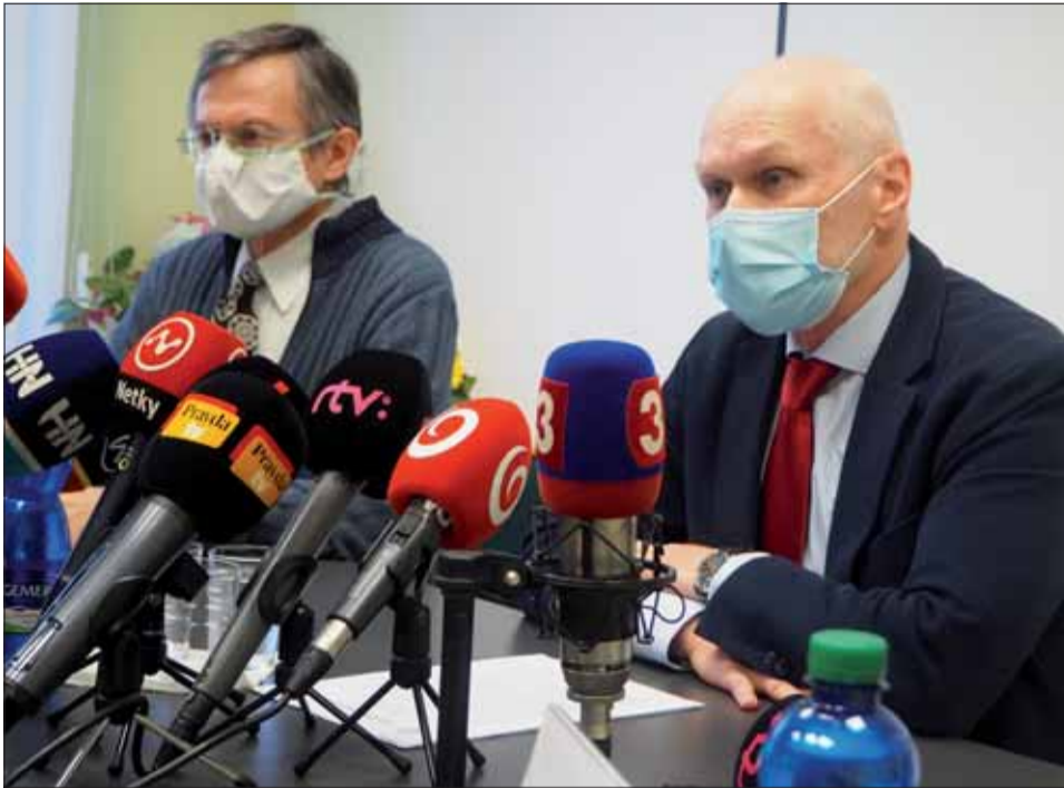
Tlačová konferencia k aktuálnej situácii 2. marca.

károv, presun kompetencií na nich nemá šancu uspieť, bude ťažko v širšom meradle realizovateľný. A tie počty sa musia zvýšiť rapídne, to zdôrazňujem, rapídne.