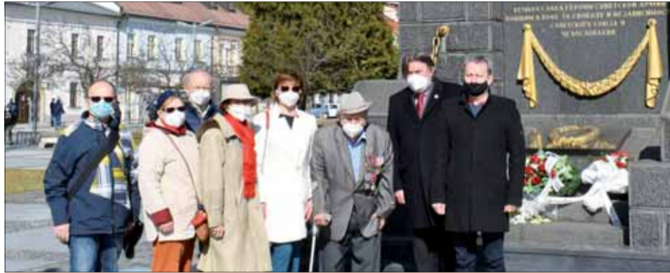
Účastníci spomienky na 76. výročie oslobodenia Zvolena.

Nech všetci naši občania prežijú toto nešťastné obdobie v zdraví a neklesajú na duchu. Aj naše staré príslovie hovorí, že po každej búrke vyjde slniečko. Hoci zamračené je už dlho, rysuje sa svetlo na konci tunela.