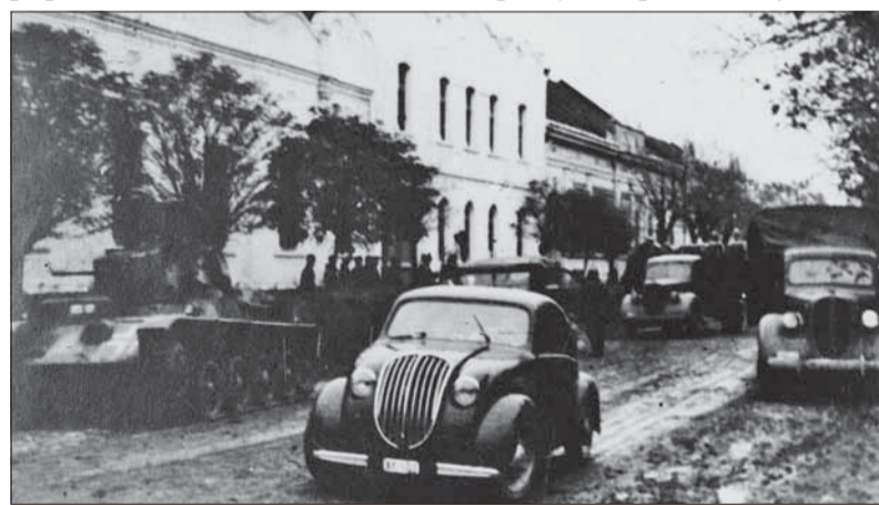
Pred vojenským úradom v Subotici sa začiatkom apríla 1941 sústredili nákladné autá, tanky a iná vojenská technika.

Na základe správy, že sa v Belehrade uskutočnil štátny prevrat, Hitler okamžite zvolal vojnovú radu, na ktorej sa dohodli, že okrem plánovanej operácie Marita proti Grécku zaútočia i na Juhoosláviu. Tým sa malo zabrániť prípadnému nasadeniu kráľo-