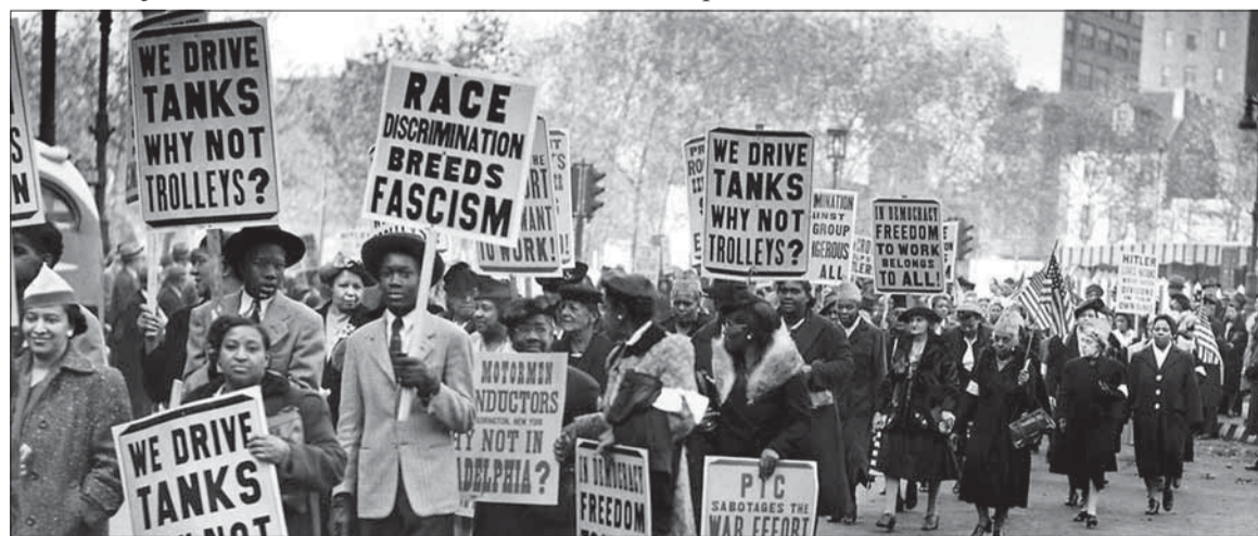
Rasová diskriminácia plodí fašizmus, varovali utláčani americkí černoši.

Aj nemecká propaganda sa usilovala zužitkovať rasovo segregovanú americkú spoločnosť a vyrábala letáky zamerané na černošských vojakov. Nabádala ich na dezerciu a vytvárala falošné zdanie, že by sa im páčilo lepšie zaobchádzanie v nemeckej armáde.