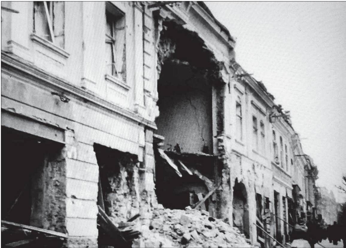
Pri kobercovom nálete na Prešov 20. decembra 1944 sovietske bomby zasiahli aj domy na Hlavnej ulici.

hitlerovskej koalície sa dostala až v súvislosti s blížiacim sa frontom na začiatku leta 1944.