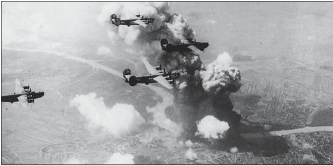
Prvé masové bombardovanie bratislavskej Apolky americkými vzdušnými silami sa odohralo 16. júna 1944. Dym videli až vo Viedni.

Hoci ľudácka Slovenská republika vyhlásila vojnu Veľkej Británii a Spojeným štátom v septembri 1939 a koncom júna 1941 Sovietskemu zväzu, „do pozornosti“ proti-