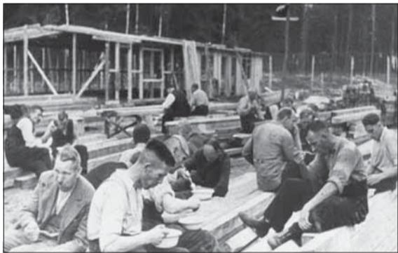
Biedny obed väzňov budujúcich koncentrák Stutthof v septembri 1939.

Muž mal podľa obžaloby pôsobiť od júna 1944