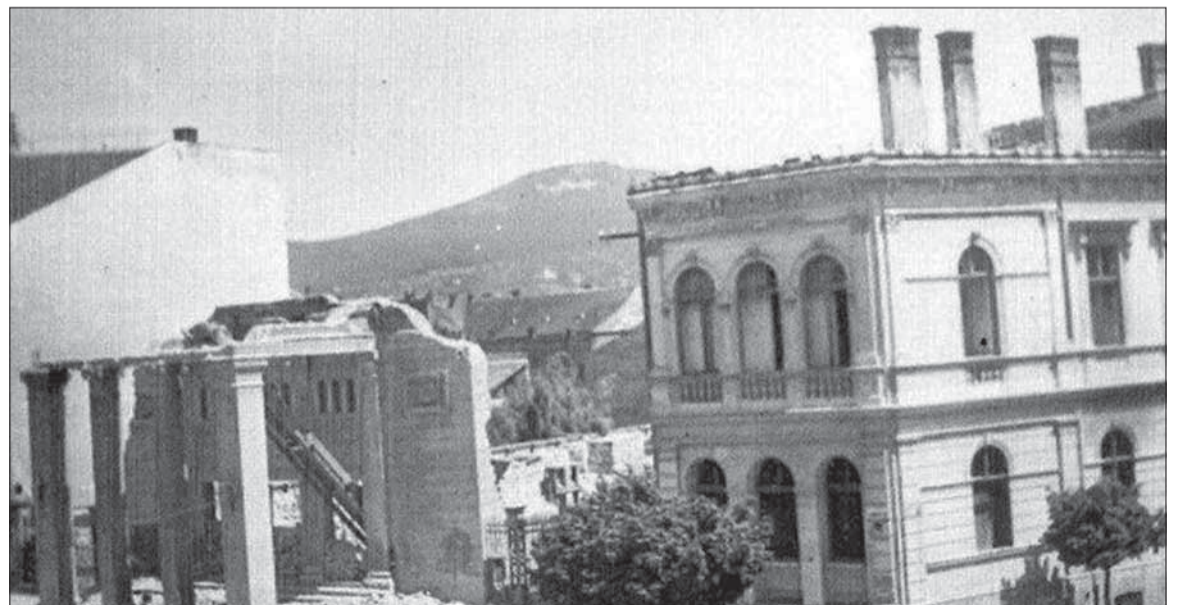
Po zbombardovaní Nitry 26. marca 1945 zostala z divadla iba predná stena a štyri stĺpy.

Nemci nasadzovali proti povstalcovi vojenské lietadlá. Po spíške 25 tisíc kusov ľahkých triestivých bômb od 111 amerických bombardérov tu zo-