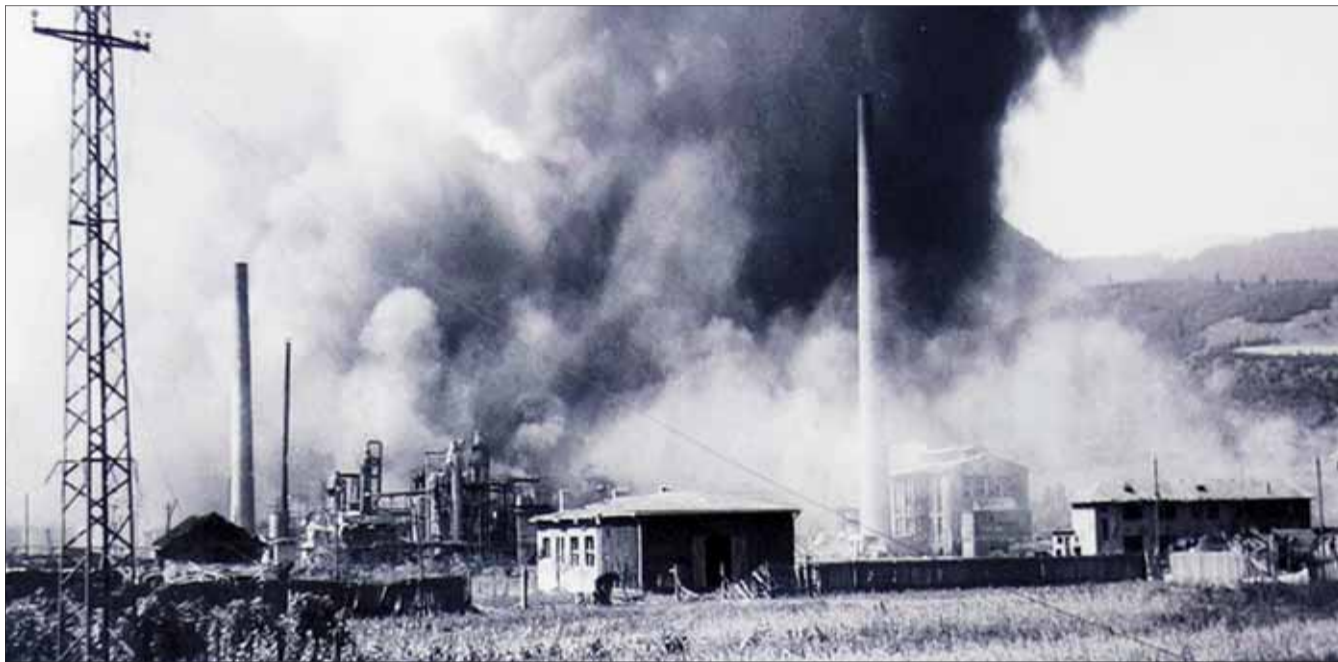
Spojenci si za svoj cieľ 20. augusta 1944 nešťastne vybrali aj menšiu rafinériu v Dubovej, kde povstalci počítali s pohonnými hmotami.