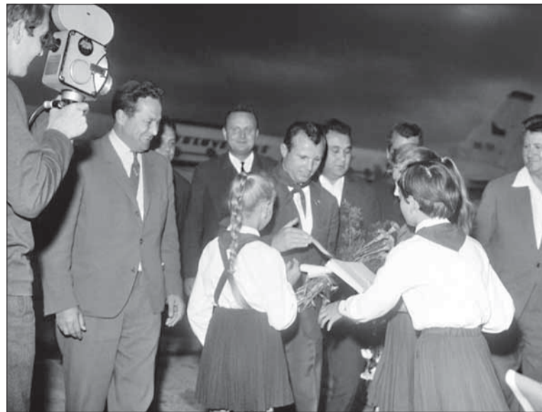
Jurij Gagarin v Košiciach 13. júla 1966. Prvý kozmonaut sveta bol na dovolenke v ČSSR, v utorok 12. júla zavítal vo večerných hodinách do východoslovenskej metropoly.

aj ukrajinské piesne, tak sme mu spievali také i také a, samozrejme, aj naše, slovenské. Gagarin bol celý uveličený, priam nadšený a za odmenu nás vyzval: Давайме ваие вопросы. Nuž, na čo by sme sa pýtali, ak nie na jeho slávny let do vesmíru? Detailne