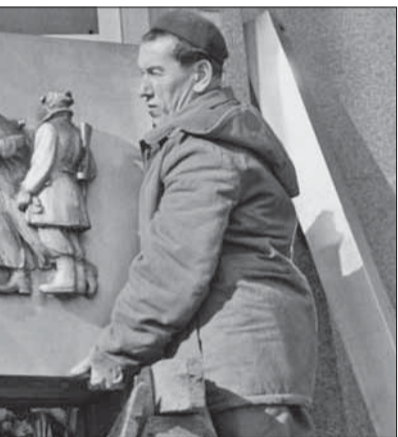
meleckej kovovýroby upevňujú re-