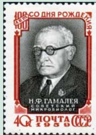
Poštová známka s portrétom akademika F. M. Gamaleju z roku 1959.

Po návrate do vlasti založil s Il'jom Mečnikovom podľa Pasteurovho modelu Odeskú bakteriologickú stanicu pre vakcinačné štúdie a výskum v oblasti moru, choleary a tuberkulózy. Išlo vôbec o prvú inštitúciu svojho druhu v Rusku. Neskôr sa zaslú-