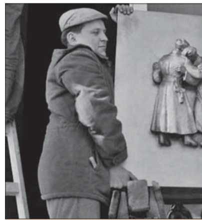
Pracovníci pražských Závodov umelky na vstupné dvere pamätníka