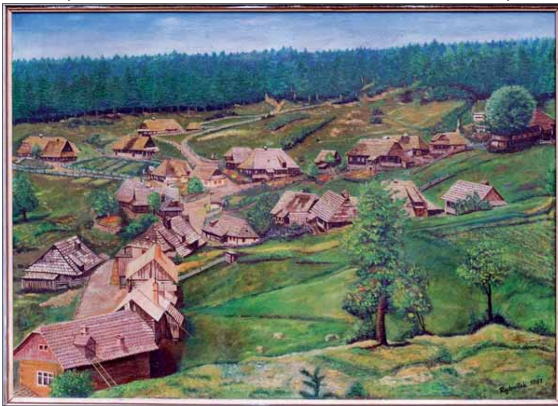
V depozitári Múzea SNP sa nachádza aj umelecký pohľad na kedysi malebnú horskú osadu.

pine, aby sa nebáli a navzájom si mohli pomôcť. Ocot si doma vyrábali z nedozretých sliviek. V okolí zbierali i hríby.