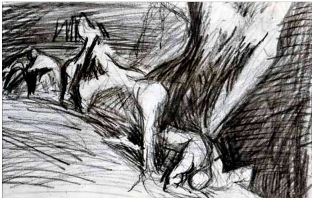
Smrť I., kresba ceruzkou, SNG.