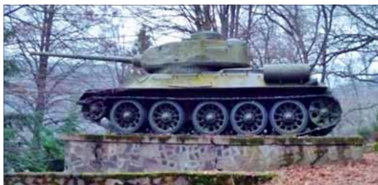
Pamätník v Skároši – tank T-34.

Medzi zaujímavé spomienky patria aj tie na správanie sa sovietskych vojakov. „Skároš a okolité obce boli na jeseň 1938 pričlenené na základe Viedenskej arbitráže k hortoyovskému Maďarsku,“