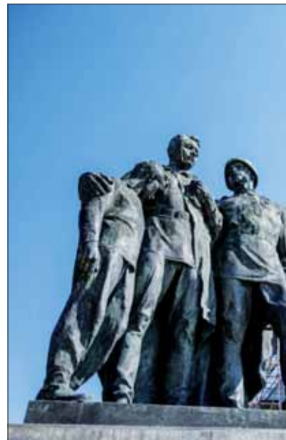
Nad hrobom spolubojovníka, súpílon ešte v lešení.

duchosti, v jasných líniiach stavby a v ľudskejšej proporčnosti prislúchajúcej Bratislave. Maketu definitívneho projektu prezentovali samotnému Nikitovi S. Chruščovovi, keď v júli 1957