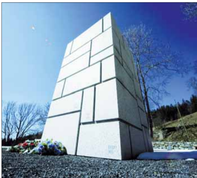
Pamätník na Kališti.

Kalište sa napokon stalo symbolom vojnových útrap a tragických udalostí po potlačení SNP. Múzeum SNP ako správca Národnej kultúrnej pamiatky Kalište v roku 2007 slávnostne odhalilo Pamätník obeť. Múzeum vytvára priestor na spomienkové podujatia pre všetky generácie, usiluje sa priblížiť históriu týchto tragických udalostí a života na Kališti pred jeho vypálením a činnosť tzv. Partizánskej republiky. Slúžia na to dve expozície v zachovaných domčekoch a Náučný chodník. Počas posledných rokov postupne areál dotvorili replikami partizánskej nemocnice a miliera, v ktorom sa páli drevné uhlie a sprístupnili pôvodné partizánske bunkre. V roku 2008 boli v priestore pod pamätníkom vysadené ovocné stromčeky na pamiatku všetkých vypálených obcí.