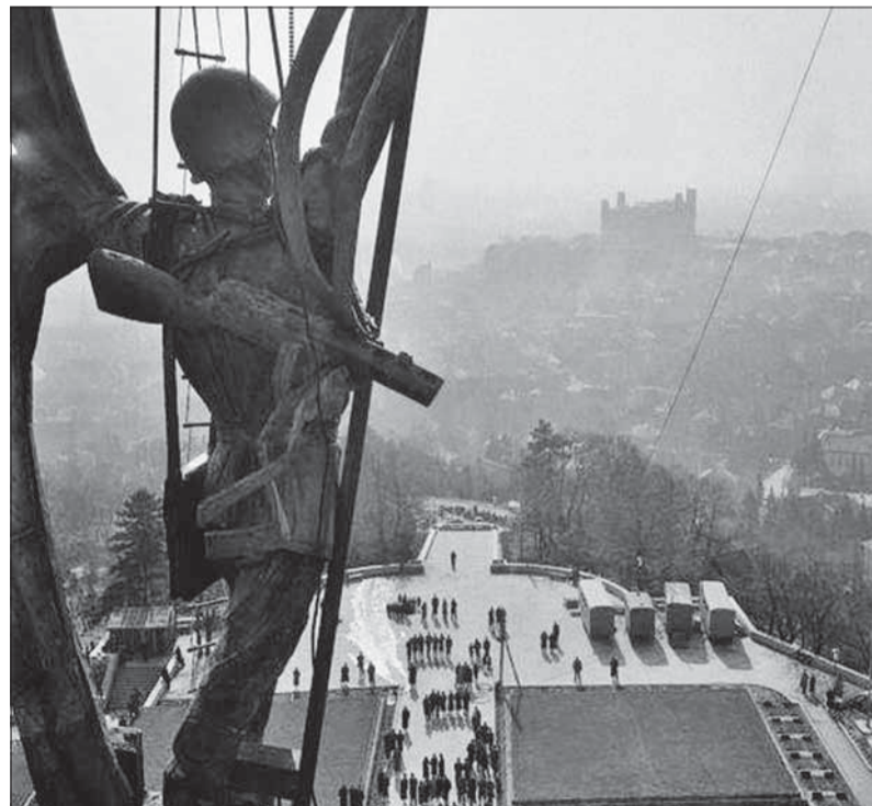
Bratislava, stavba Slavína.