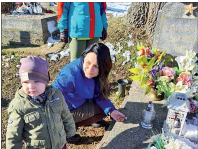
S deťmi pri hrobe neznámeho sovietskeho vojaka.