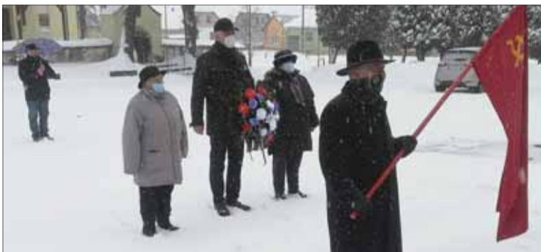
Spomienkové podujatie v Kamienke.

Hoci v obmedzených a skromných podmienkach vyjadrili Kamienčania presvedčenie a odhodlanie, že takéto a podobné zverstva páchané na ľuďoch sa u nás už nikdy nebudú opakovať. Nezaбудneme na hrdinstvo, nesmernú túžbu po slobode a živote v mieri, ktoré neopakovane prejavili naši hrdinovia. Hlboká úcta a naša vďaka im patrí za ich hrdinstvo a obetavosť.