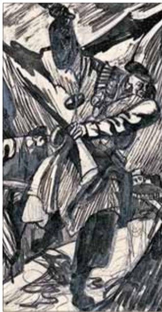
Povstanie, kresba ceruzkou, štetcom, tušom 1944, SNG.