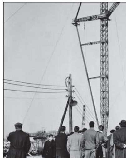
Takto sa staval Slavín, niekedy v

Na jar roku 1945 telá vojakov napochytr pochovávali na rozličných miestach západného Slovenska, kde akurát padli. V Bratislave napríklad i na Hodžovom a Floriánskom námestí, na niekdajších cintorínoch pri Trnavskom mýte, v Rači a Slávičom údolí. Postupne ich exhumovali a prevážali na Slavín.