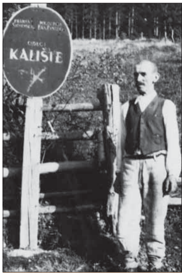
Tabula na zaciatku obce.

Po okupácii Banskej Bystrice jednotkami nemeckej armády sa začala časť nemeckých síl sústreďovať práve na juhozápadných výbežkoch Nízkych Tatier. Nemecké vojenské jednotky a aj narýchlo sa formujúce protipartizánske skupiny robili časté výpady do okolitých dedín v horských dolinách. Partizáni ubránili túto oblasť až do marca 1945. Nemeckí vojaci sa stiahli do Moštenice a sľubovali pomstu.