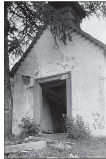
Kaplnka nemý svedok.