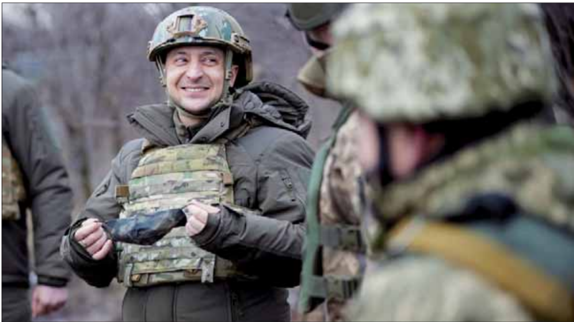
Prezident Zelenskij je vo vojne.

Ukrajinský zväz novinárov označil rozhodnutie za útok na slobodu prejavu. Spravodajský kanál Hlas Ameriky dal toto konanie do súvisu s pripravovaným zákonom o médiách, ktorý „predstavuje hrozbu pre slobodu slova a nezávislé spravodajstvo v tejto východoeurópskej krajine“. Zelenského otvoreným podporovateľom je pritom miliardár Igor Kolomojskyj, ktorí vlastní najväčší mediálny konglomerát na Ukrajine.