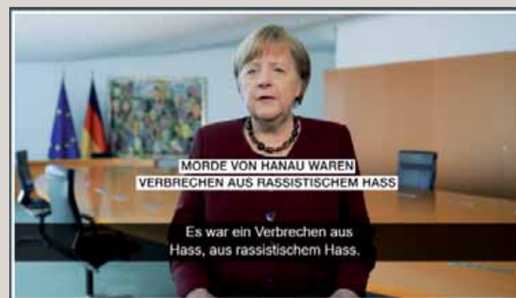
Videoposolstvo Angely Merkelovej.

Kancelárka Angela Merkelová pripomenula vlnajúcu vraždu v Hanau. Neonacista tam zabil 9 ľudí, potom vlastnú matku a napokon spáchal samovraždu. „Bol to zločin z nenávisťi, z rasistickej nenávisťi. Vrah svoje obete nepoznal,“ povedala vo video posolstve. Pripomenula posilnenie štátnych orgánov pre boj s pravicovým extrémizmom a rasizmom. „Rasizmus je jed. Nenávisť je jed,“ dala do nadpisu svojho vystúpenia.