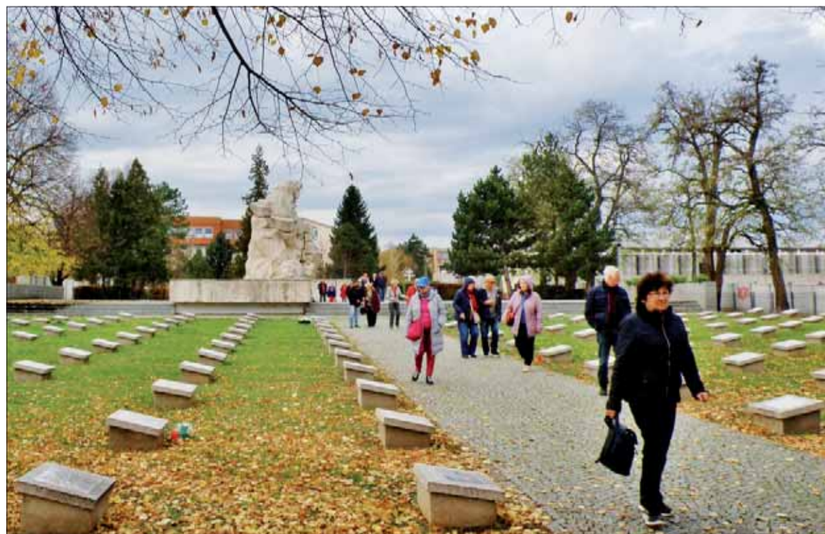
Zrekonštruovaný cintorín 5 247 padlých vojakov Červenej armády v Štúrove, november 2019.

Fašistické vojská dosiahli určitý, no draho vykúpený úspech. Padlo tam vyše 4500 Nemcov, bolo zničených 104 tankov, 85 samohybných diel a ďalšia bojová technika. No najdôležitejšie bolo, že sa im nepodarilo preniknúť na ľavý breh Hrona a popri Dunaji ani k obklúčenému zoskupeniu v Budapešti.