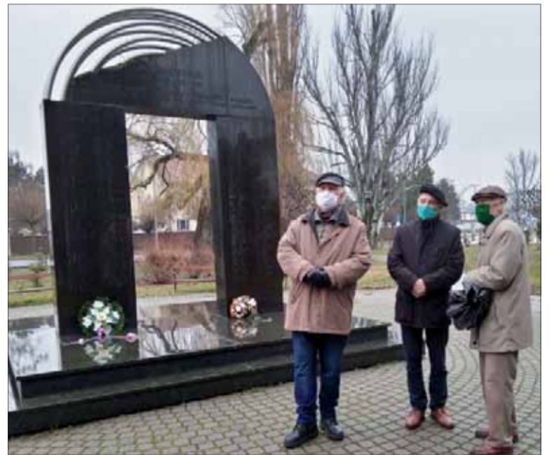
Účastníci kladdenia vencov.