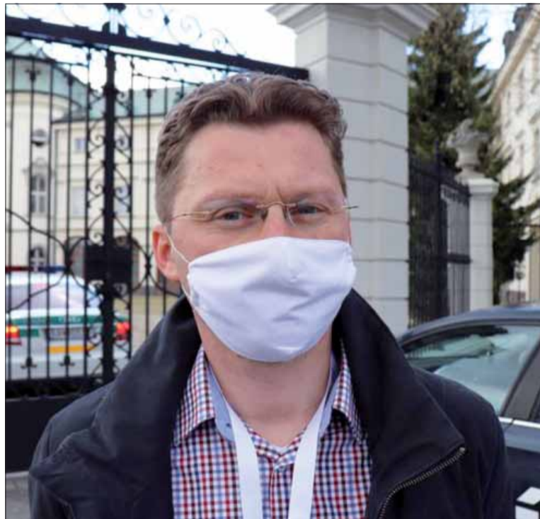
O rady a skúsenosti sa delí aj s vládnymi politikmi (v pozadí Úrad vlády SR).

Najškodlivejším rozmerom boli „pripustky na slobodu“. Po prvé preto, lebo ľudia získali potvrdenia, že sú týždeň negatívni, čo nie je vôbec prav-