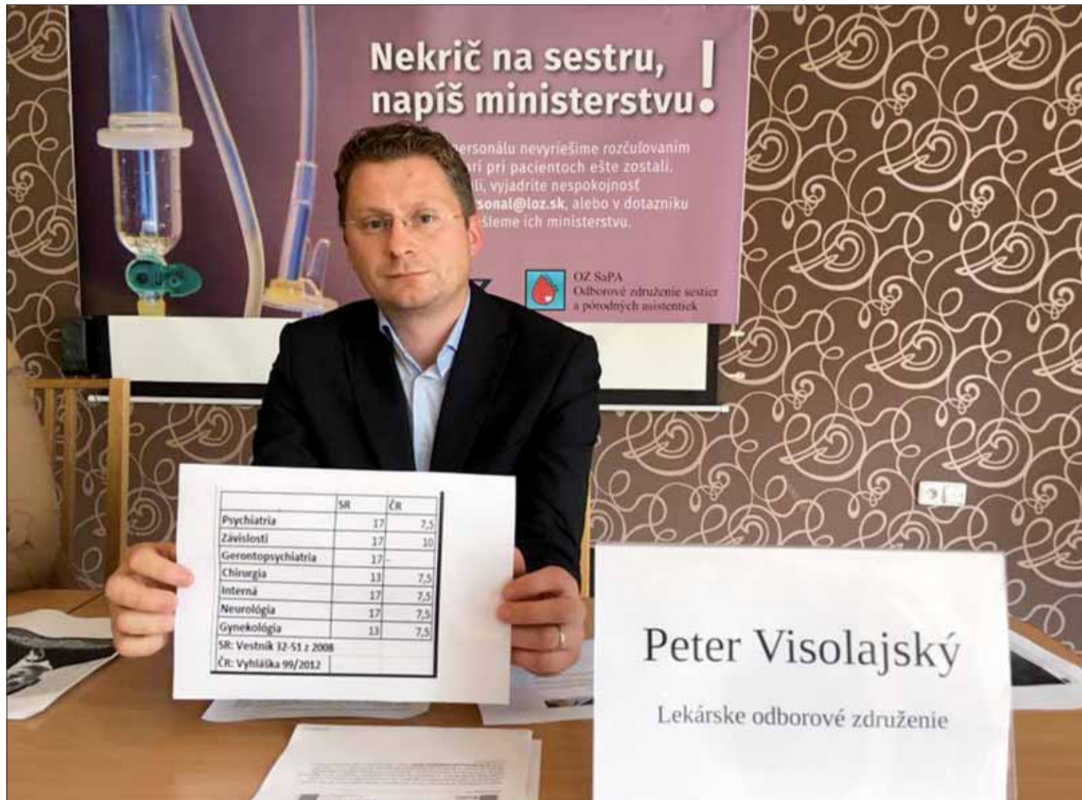
Predseda LOZ nebojuje len za lekárov, ale aj za zdravotné sestry.

stalo, toto nefunguje a ľudia zľavujú z vlastnej zodpovednosti, lebo informáciám, ktoré im politici poskytujú, neveria.