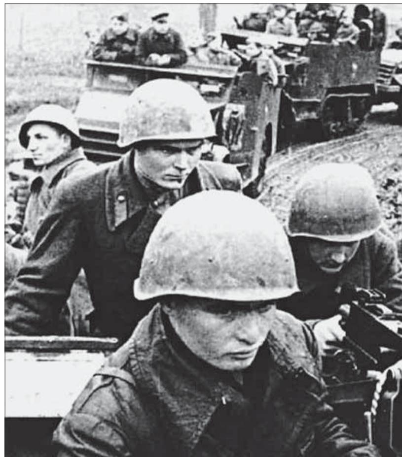
Sovietski motostrelci v boji pri Hrone začiatkom roka 1945.

Pod tlakom tankových vojsk SS a ich úderných klinov v sile 60 až 80 tankov s podporou pechoty gardové jednotky dostali rozkaz organizovane prejsť cez dve predmostia a na proti-