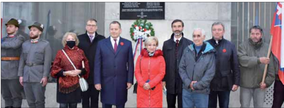
Čestní hostia slávnostného odhalenia pamätnej tabule slovenským legionárom.