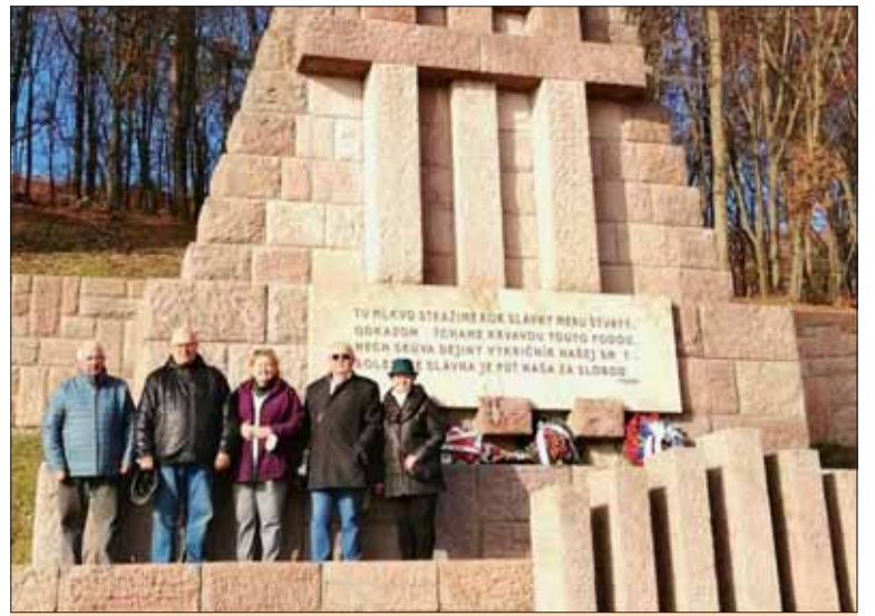
Delegácia ObIV Banská Bystrica pri obnovenom Pamätníku obetiam fašizmu v Kremničke 10. novembra.