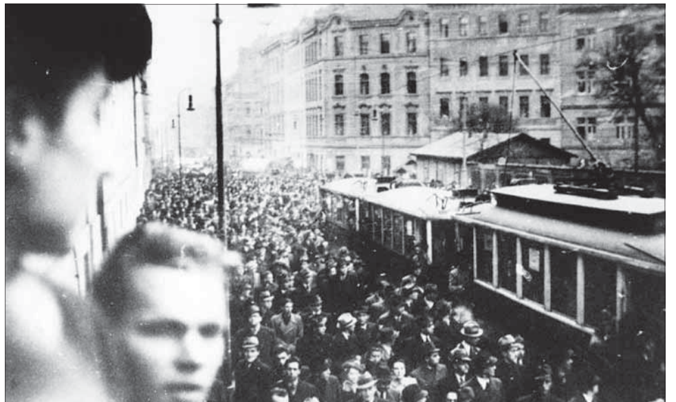
Demonštrácia v Prahe 28. októbra 1939.

V strojárскеj továrni Walter v pražskej štvrti Jinonice robotníctvo prejavovalo „značnou nechuť k práci“. Stroje bežali, ale pracovala iba malá časť zmeny. Preto došlo k presvedčovacej akcii, do kto-