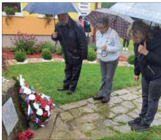
V Lenartove vzdali úctu hrdinom SNP.