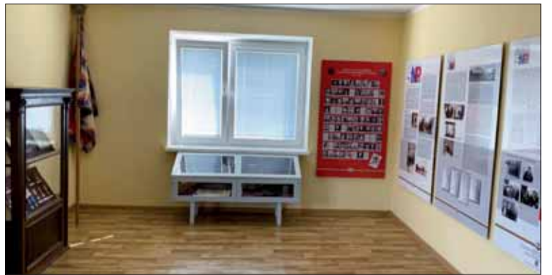
V obci Miezgovce zrekonštruovali pamätnú izbu SNP.

Po skončení pietneho aktu ocenili pretekárov behu SNP a následne sa na dvore kultúrneho domu rozohrala symbolická vatra. Spomienkový večer ukončil ohňostroj a hudob-