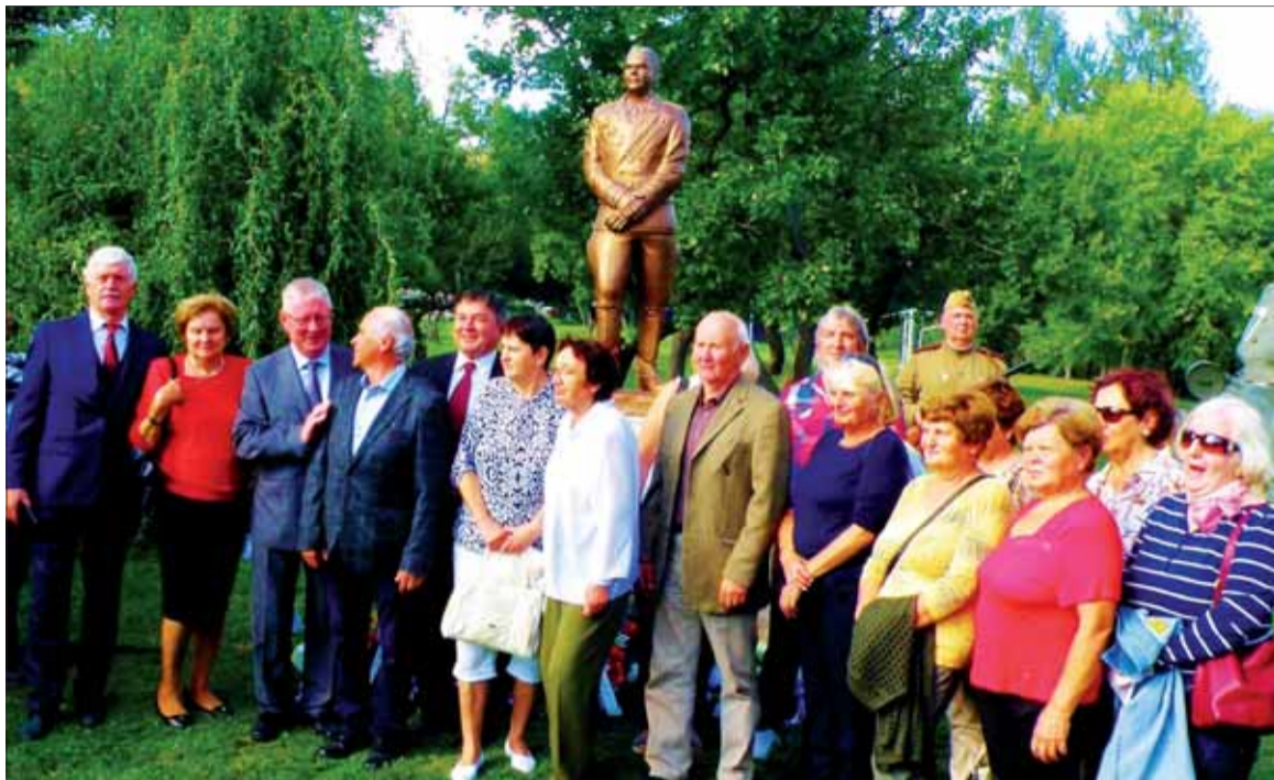
Členovia SZPB z Levického okresu s ruským veľvyslancom (tretí zľava) pred sochou maršala.

Práve nový pomník v Starom Tekove má slúžiť, aby sa v tomto príjemnom areáli pripravovaného múzea zameraného na priebeh druhej svetovej vojny a výzbroj Červenej armády najmä mladí ľudia zoznámali s oslobodzovaním našich miest a obcí pred 77 rokmi, ako aj s veľkou osobnosťou maršala Malinovského a vzdávali mu patričnú úctu.