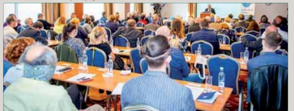
Účastníci fóra zaplnili konferenčnú halu do posledného miesta.

Združenie Zjednotení za mier aj preto iniciovalo petíciu, ktorou chce dosiahnuť legislatívny zákaz čo i len dočasného rozmiestnenia akýchkoľvek cudzích vojsk na území Slovenska, zakotvenie práva občanov SR na mier o. i. v podobe znižovania výdavkov na zbrojenie a vyzvať NR SR, aby súhlasila so Zmluvou OSN o zákaze jadrových zbraní z roku 2017 a vyzvala prezidentku SR, aby zmluvu ratifikovala.