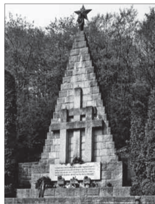
Pamätník SNP v Kremničke pred obnovou.