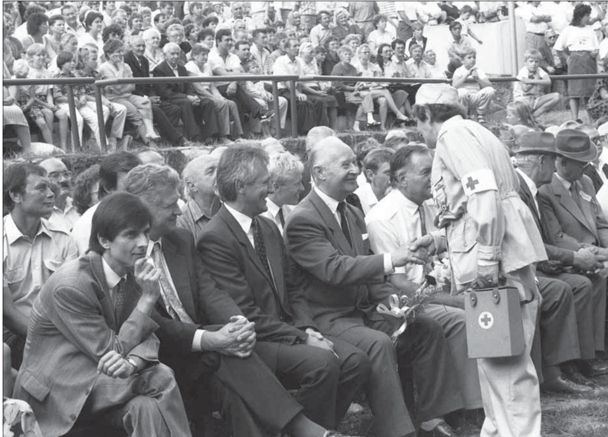
Alexander Dubček ako predseda federálneho parlamentu na oslavách SNP nikdy nechýbal. A ľudia ho milovali...

„Mnohé odhalenia o metódach represii boli naozaj šokujúce. Napríklad som sa dozvedel, že obeť boli podrobené fyzickému aj psychickému týraniu... Vedúci straníckej funkcionári vrátane Novotného si rozdeľovali medzi sebou cennejšie osobné veci svo-