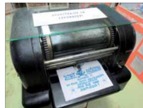
V boji proti fašizmu bola mobilizácia odporu rovnako dôležitá, ako boj so zbraňou v ruke.

získalo náhodou. Po prehliadke sme aj my, oveľa skôr narodení, než autori expozície, museli jednoznačne skonštatovať, že o histórii ZDA a nášho mesta majú dvaja gymnazisti v istých záležitostiach viac znalostí, než my. Aj preto sa touto cestou pripájame k predsedom vyslovenému uznaniu a poďakovaniu za ich ojedinelé úsilie.