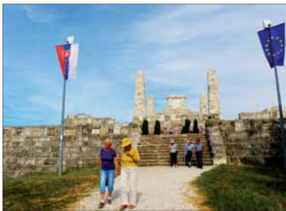
Mohyla M. R. Štefánika na Bradle z roku 1929, súčasný stav.