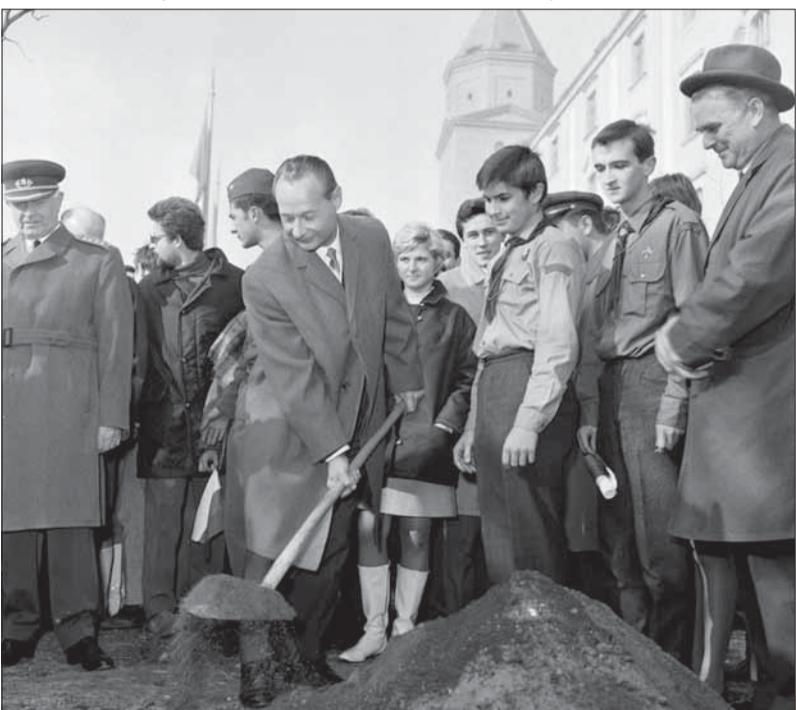
Dubček pri sadení troch líp na Bratislavskom hrade v októbri 1968, vľavo prezident Svoboda.

Uvoľnenie akumulovanej energie inteligencie, ktorá získala vzdelanie v čase po odhalení Stalinových zločinov, prinieslo explóziu skvelých tvorivých činov v umení, architektúre, historiografii i v ďalších odvetviach. Die-