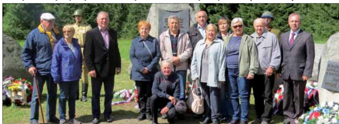
Na Podbansku si členovia SZPB pripomenuli odkaz SNP.

O partizánskom odboji v oblasti Vysoké Tatry napísal aj publikáciu pod názvom Tatry v boji a odkaz SNP s mottom: „Na slávu Vám, ktorí ste daň krvi platili za zmysel života.“