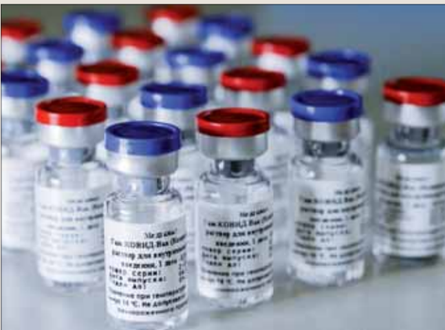
Vakcína Sputnik V.