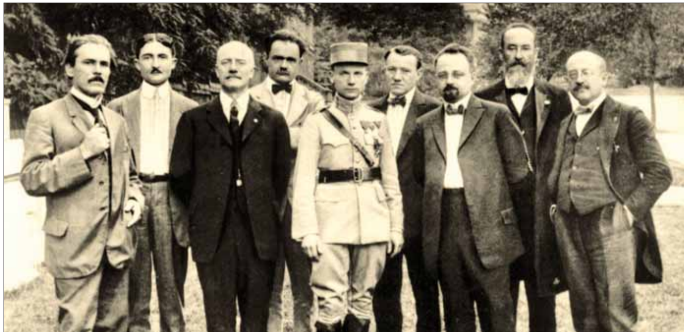
Milan Rastislav Štefánik sa o vznik Československa zaslúžil ako jediný z vedúcich činiteľov aj na vojnovom bojisku, ale za Masarykom a Benešom nezaostával ani na poli diplomacie. Na fotografii je s predstaviteľmi českých a slovenských krajských organizácií vo Washingtone v r. 1917.

Preto všetkým členom ČSBS prajem do budúcnosti – slávnostných či bežných dní – pokoj v práci na zveľaďovaní krajiny, v ktorej sa cítite ako doma. Prijmite našu podporu vášmu mierovému úsiliu. Prajme si spoločné úspechy v zápase so zlom, ktoré dnešný fašizmus v rôznych podobách a formách predstavuje.