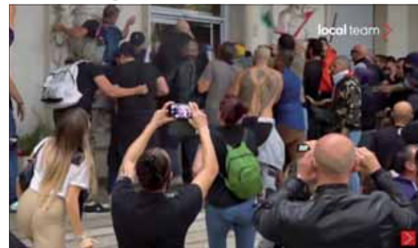
Neonacisti sa násilím dobýjali do budovy odborov.

Zhruba 80 % všetkých Talianov, starších ako 12 rokov, je v súčasnosti úplne očkovaných a zdá sa, že veľká väčšina ľudí podporuje očkovanie a používanie zeleného pasu.