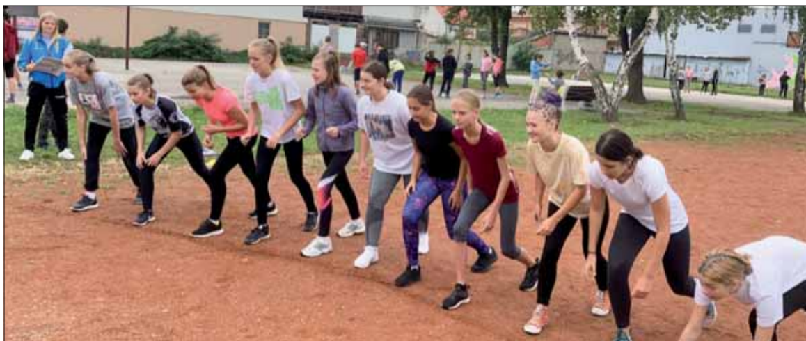
Senecké školáčky na štarte behu na počesť oslobodenia.

Po úspešnom absolvovaní behu každý účastník dostal od výboru ZO chutnú odmenu a prví traja výhercovia z každého družstva aj diplom a medailu. Veríme, že budúci rok sa opäť ako v minulosti budú môcť zapojiť aj ďalšie senecké školy.