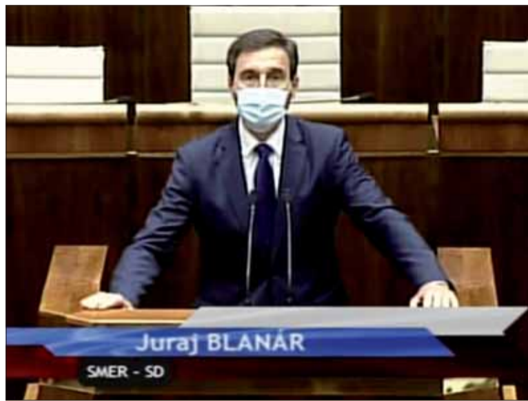
Vystúpenie podpredsedu NR SR na zábere tv NR SR.