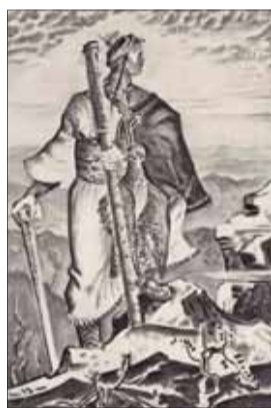
Martin Benka, ilustrácia k dielu A. Sládkoviča Detvan, uhľokresba 1943.