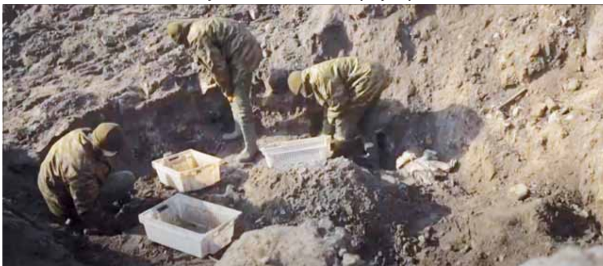
Bieloruskí vojaci odkrývajú masový hrob Židov v Breste.

Brestská pevnosť je dodnes symbol hrdinského odporu sovietskych občanov – a nielen vojakov – proti nacistickým okupantom. V roku 1941 tvoril Brest dôležitý obranný uzol Sovietskeho zväzu. Vtedy tvorili tamjší Židia asi polovicu obyvateľov takmer 50-tisícového mesta. Dnes ich tam žije zhruba 500.