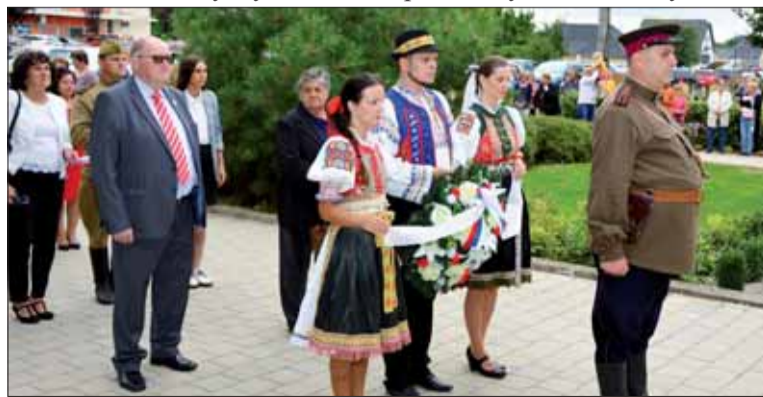
Slávnostný úvod osláv SNP v Šoporni.

Na pódiu sa vystriedali Važina, Važinka, Važinár, Šopornanská Lipka aj Šikesovci. Nechýbala tradičná vatra. Krásny slávnostný deň uzavreli Čarovné ostrohy, ktoré boli zážitkom pre všetkých zúčastnených.