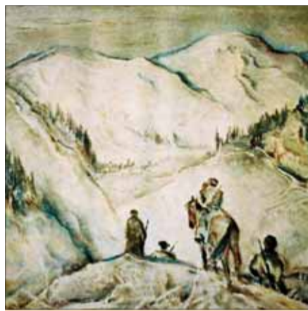
Martin Benka, Hliadka pod Prašivou, olej 1946.