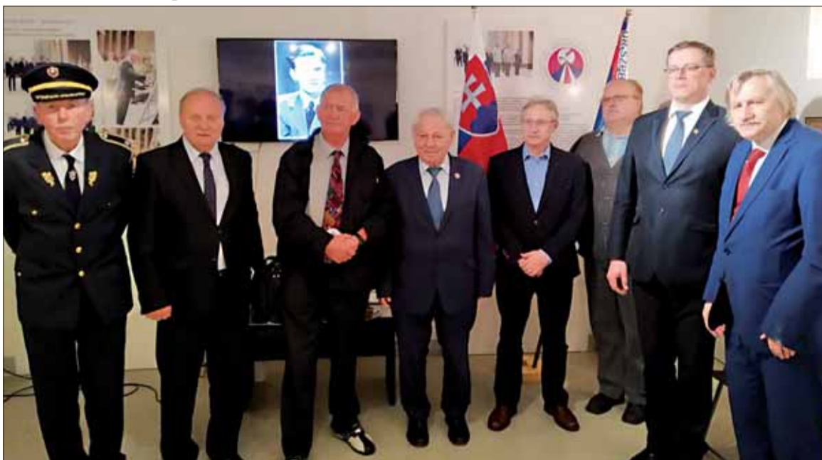
Predsedu Matice Slovenskej (druhý sprava) v priestoroch stálej expozície v sídle SZPB.

ky je jej najprirodzenejšia demokratická a slobodná slovenská štátnosť, pre ktorú matičiari toľko obetovali. Súčasná doba je však, bohužiaľ, rovnako rozporuplná a nebezpečná ako minulé. Preto udržanie zvrchovanej a demokratickej Slovenskej republiky si vyžaduje rovnakú vytrvalosť, ako jej dosiahnutie v roku 1993. Úlohou MS je dnes, ako aj v minulosti, udržať a rozvíjať slovenské kultúrne dedičstvo, pozdvihovať kultúrnu a vzdelanostnú úlohu Slovákov a Sloveniek, udržiavať kolektívnu historickú pamäť ná-