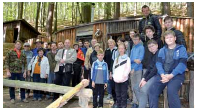
Účastníci stretnutia pri bývalom partizánskom bunkri.

mieste jeho skonu, hoci bol partizánmi pochovaný v osade Španie na bošáckych kopaničiach. Po oslobodení telo preniesli do jeho rodnej Alexandrie na Ukrajinu.