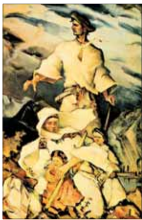
Martin Benka, Rodina v Povstaní, olej 1946.