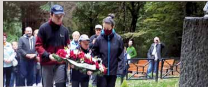
Položenie venca k pamätníku v Remetských Hámroch sa zhostili mladí.

Cesta účastníkov pokračovala smerom na Morské oko, kde si v krásnej prírode oddýchli a načerpali nové sily. Jazero vrátane okolitých lesov je vyhlásené za národnú prírodnú rezerváciu a patrí do Svetového prírodného dedičstva UNESCO.