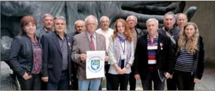
Účastníci pri položení venca.

Členovia predsedníctva ObIV SZPB v Trebišove si 24. septembra uctili pamiatku hrdinov Povstania položením venca k pamätníku SNP v Banskej Bystrici.