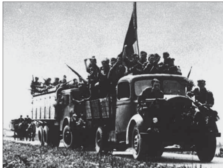
Nástup do Povstania.

Padol aj prvý smrteľný výstrel. Jeden zo žilinských Nemcov namieril pištoľou na práve zmobilizovaného vojaka, neďaleko stojaci sovietsky výsadkár však vystrelil prvý... Situáciu tu okrem výraznej ne-