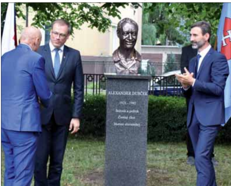
Matica Slovenská vyhlásila rok 2021 za rok Alexandra Dubčeka.

li sa kontroverzným témam, ale naopak témam, ktoré slovenskú spoločnosť spájajú. Vyhlí sme sa straníckej politike, zacielení sme na spoluprácu s krajanmi organizáciami a rozvoj matičných miestnych odborov a folklórnych a umeleckých kolektívov. Bohužiaľ, pandémia dostihla aj Maticu slovenskú s následnou finančnou krízou. Činnosť, ktorú sme nemohli realizovať počas obmedzení, chceme posunúť do ďalšieho obdobia. Podceňiť nemôžeme ani generáčnu kontinuitu Matice, preto budeme pokračovať v omladzovaní matičných štruktúr, čo sa nám doteraz darilo. Plány Matice sú však podobne ako v minulosti strategické a zamerané na desaťročia dopredu. Prispôbime sa požiadavkám moderných foriem práce hodných 21. storočia, ale od principiálnych vecí týkajúcich sa obrany slovenskej národnej a občianskej spoločnosti ustupovať nemôžeme. Budeme posilňovať dobrovoľnícku činnosť miestnych odborov a rozvíjať matičnú vedu, ktorá je dnes veľmi potrebná.