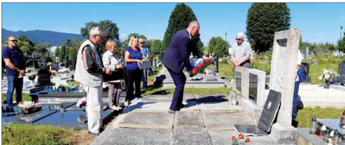
V Starej Kremničke si uctili padlých hrdinov položením vencov na ich hroby.

Za posledných 6 rokov si členovia SZPB po dohovore s príbuznými splnili svoju vlastneckú a občiansku povinnosť