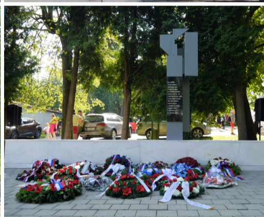
Členovia a sympatizanti SZPB opäť po celom Slovensku ozdobili vencami pomníky na počesť hrdinov Slovenského národného povstania.