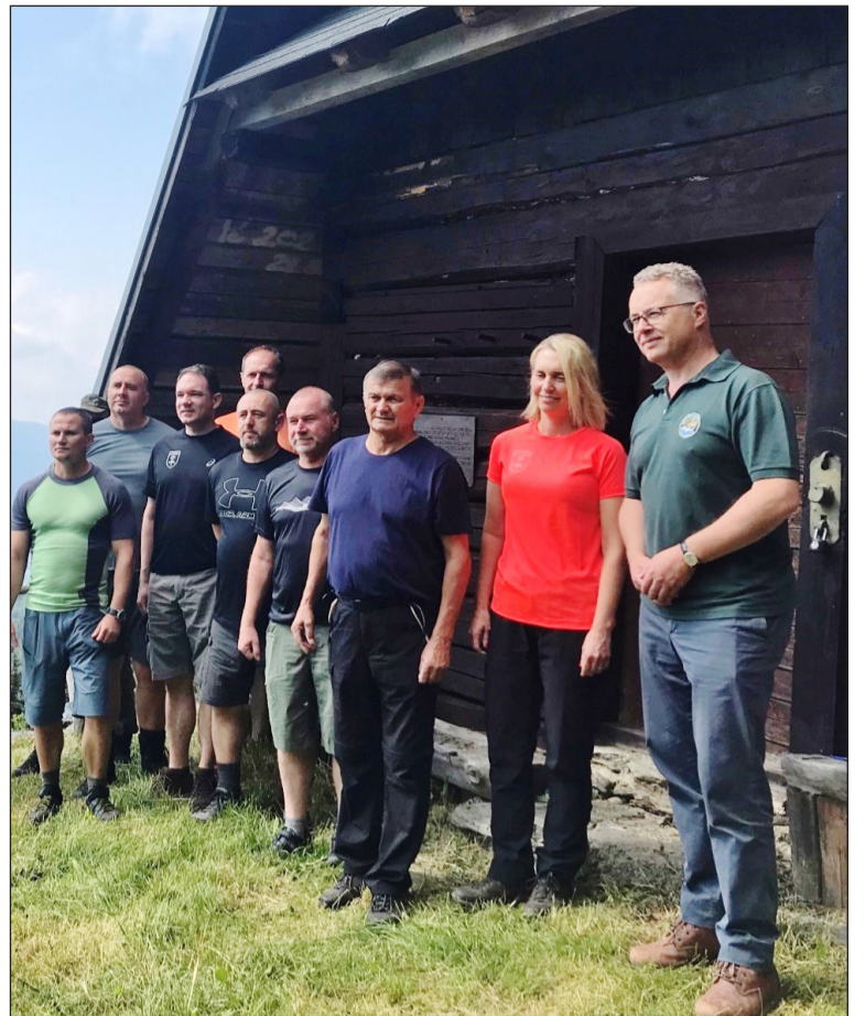
Britský veľvyslanec pred pamätnou chatou nad Polomkou v júli 2021.

Išlo o kritický moment moderných dejín Slovenska.