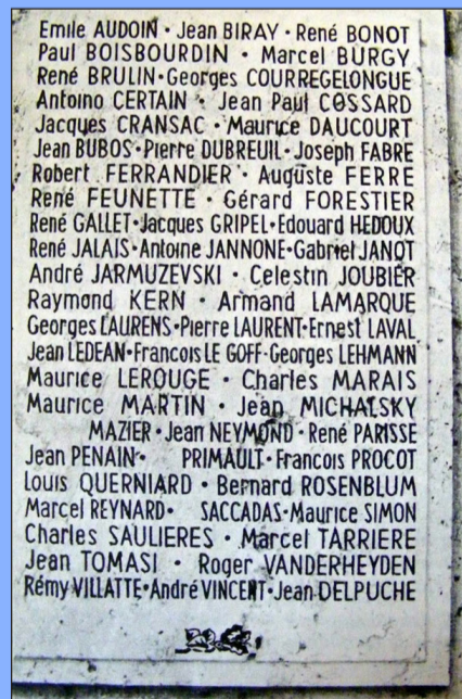
Zoznam padlých Francúzov na mohyle pod Strečnom.