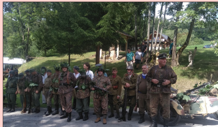
Pripomienka SNP v Dolnom Kubíne bola atraktívnym podujatím.

ným, ale podľa reakcií účastníkov aj atraktívnym spôsobom prejavu úcty a vďaka všetkým hrdinom Povstania.