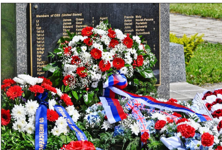
Pomník príslušníkom americkej a britskej misie v Polomke.

Ide o veľmi znepokojivý fenomén v celej Európe. Nevyneme sa mu ani u nás, ale menej ho zažívame v národnej politike, keďže systém volebných obvodov mu nedáva priestor. Extrémistické strany používajú dezinformácie a prekrúcanie faktov na to, aby prilákali voličov. Ťažia najmä zo sklamaní občanov. Tí, čo veria v demokraciu, by mali presadzovať hodnoty, ktoré zabezpečia, že naše štátne inštitúcie budú pracovať pre ľudí a dokazovať to v duchu, ako to povedal Churchill: „Hovorí sa, že demokracia je najhorší spôsob vlády... Okrem všetkých ostatných, ktoré ľudstvo z času na čas skúša.“