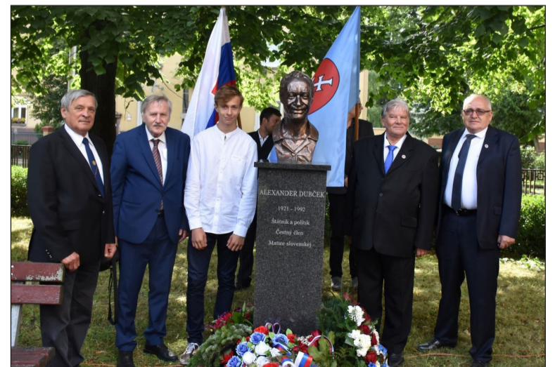
Delegácia SZPB pri novej buste A. Dubčeka.

Možno sme odštartovali úspešnú spoluprácu s ďalšou generáciou Dubčekovcov, ktorá je silno spätá s protifašistickým odbojom a SNP. Osobnosti Alexandra Dubčeka, ktorý sa aktívne zúčastnil SNP a jeho brat v ňom dokonca tragicky zahynul sa budeme bližšie venovať aj v ďalších číslach Bojovníka.