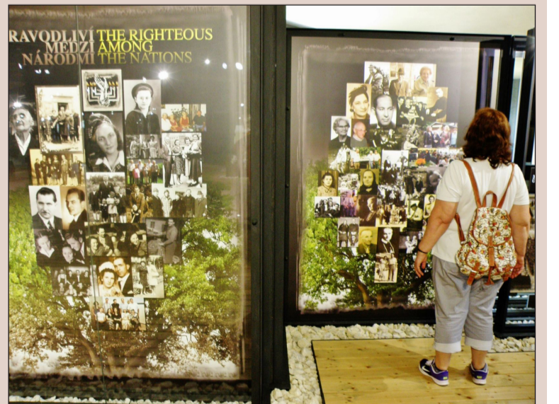
V počte Spravodlivých medzi národmi na obyvateľa patria Slováci medzi prvé národy sveta.

pracovných povinnostiach s nedostatočným zázemím pre seba i hostí. Prajeme ministerstvu obrany, aby našlo pre svoje dve vojenské múzeá viac peňazí.