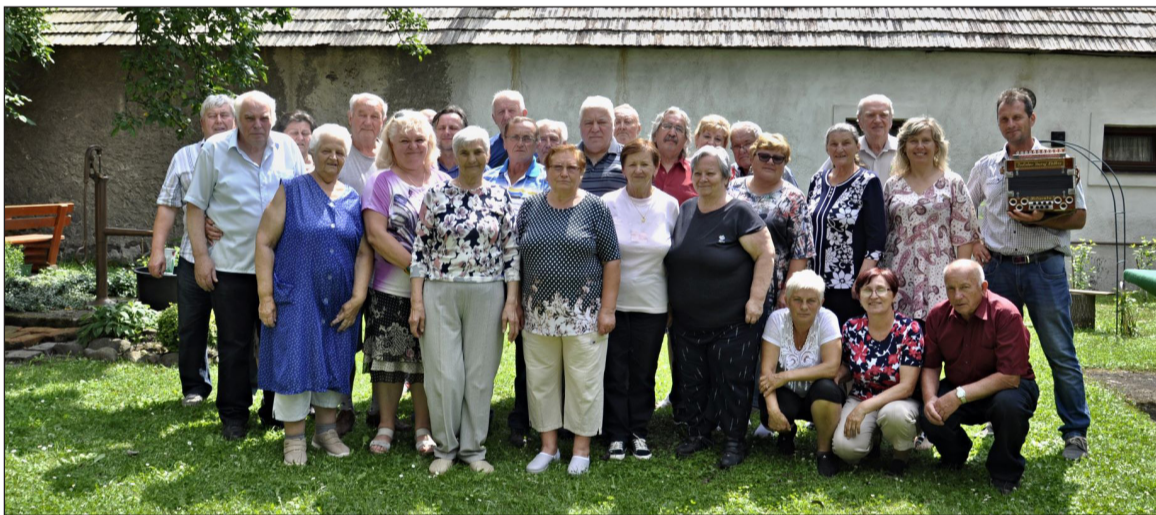
Vlajajší jubilanti ZO SZPB v Detve.

dila neformálna diskusia o zlepšení našej činnosti. Za sprievodu harmoniky si jubilanti schuti zapievali ľudovky, takže sa nikomu ani nechcelo ísť domov.