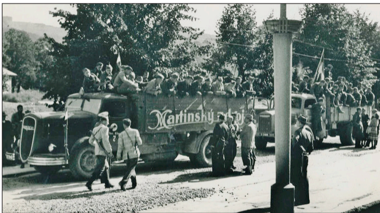
Jednotka francúzskych dobrovoľníkov v Martine.