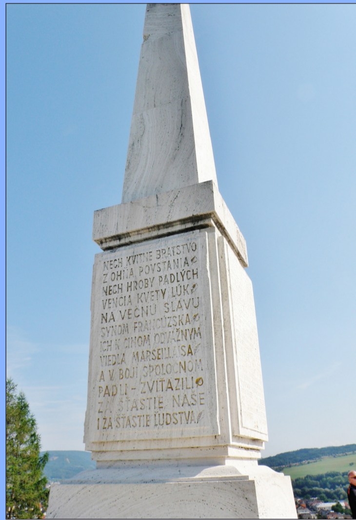
Obelisk zo slovenského mramoru - spišského travertínu na vršku Zvonica.