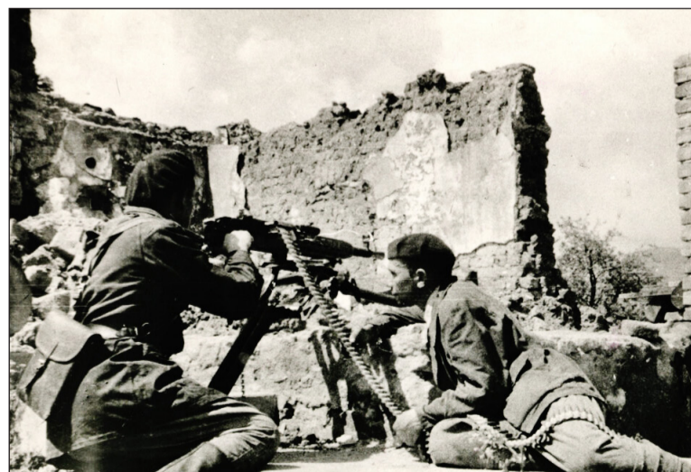
Francúzski partizáni na Strečne.