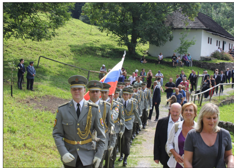
K pamätníku prúdili aj tento rok dlhé zástupy ľudí.

Pohľad na stromy, symbolizujúce život v obnovených obciach, pripomína, akú skazu a bolesť zanechali fašisti s jed-