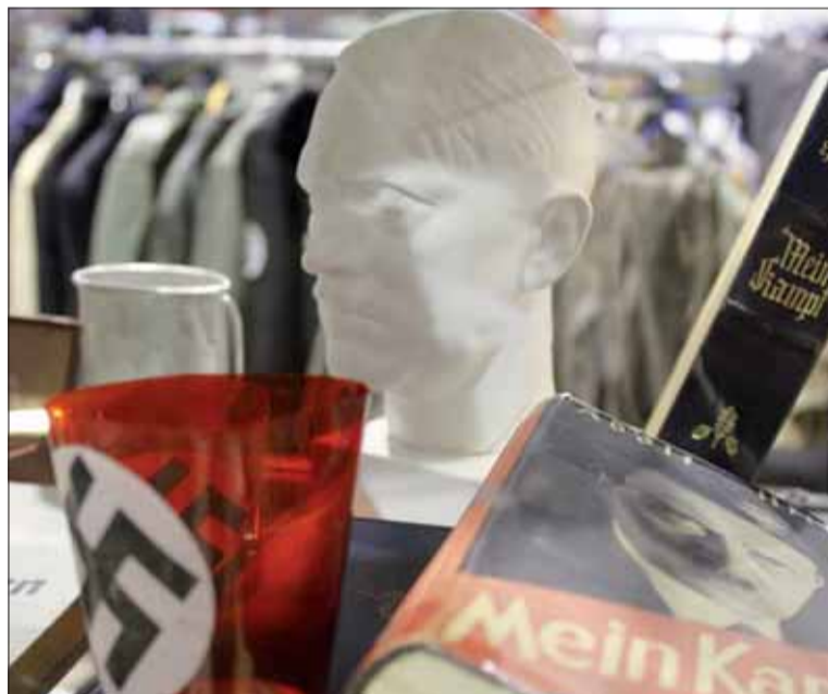
Je šokujúce, čo všetko si môžu Hitlerovi pohrobkovia kúpiť takmer 80 rokov po vojne.