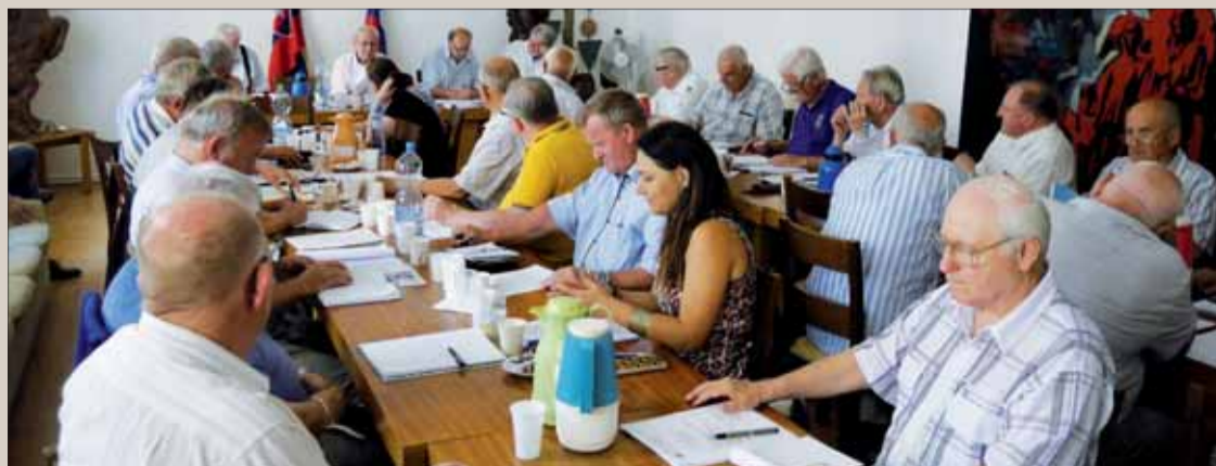
Momentka zo zasadania ÚR SZPB.