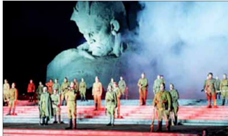
Pôsobivá spomienka na hrdinov pevnosti Brest.

obraných bojov i pietnych podujatiach na pamätníkoch v Chatyňi, Minsku a na Kurgane Slávy. Navyše sa im dostalo možnosti prezrieť si novozrekonštruovaný historicko-muzeálny komplex Línia Stalina.