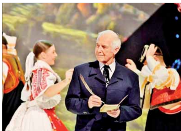
S folklórnym súborom Podpolanec v populárnej televíznej relácii Zem speieva 3. 12. 2020.