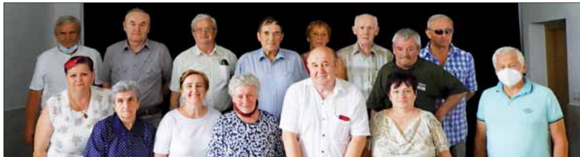
Účastníci rokovania ObIV SZPB Stará Ľubovňa.

Na rokovaní sme hovorili aj o návrhoch na riešenie súčasnej nepriaznivej situácie. Predsedovia ZO k tomu chcú využiť ešte nedokončené výročné členské schôdze.