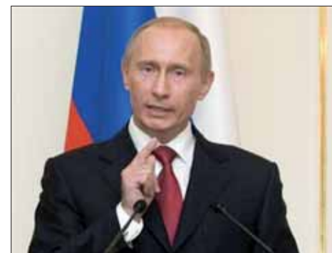
Prezident Ruskej federácie Vladimir Putin.

čiť bremenom minulých nedorozumení, krívd, konfliktov a chýb. Všetci musíme uznať svoje chyby a opraviť ich. Naším spoločným a nespochybniteľným cieľom je zaručiť kontinentálnu bezpečnosť bez deliacich čiar, priestor spolupráce a univerzálneho rozvoja pre prosperitu Európy a sveta.