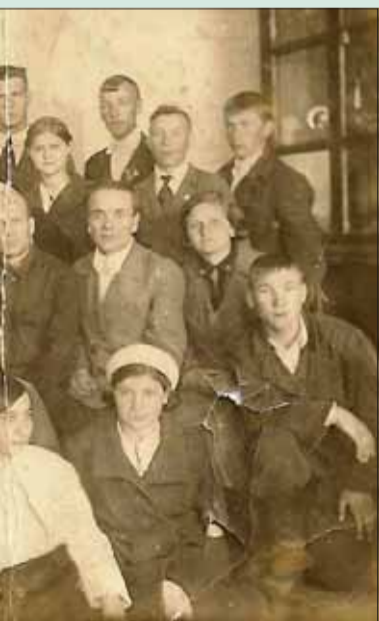
užia 21. júna 1941.

omov poslednú pohľadnicu pred neprišla nijaká správa. Jeho ses- vala po celý život. Práve preto sa rozdávali maturitné vysvedčenia