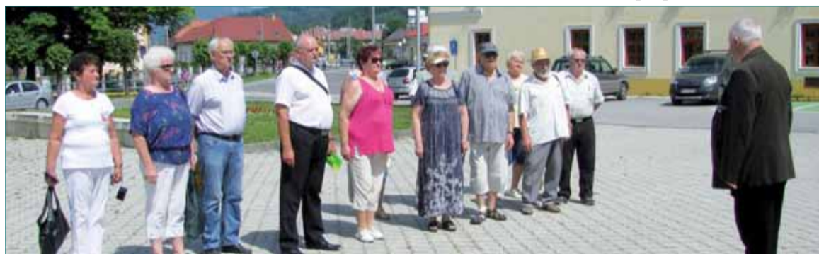
Pohľad na účastníkov podujatia v Revúcej.

So želaním, aby sa takáto tragédia už nikdy neopakovala, účastníci podujatia na jeho záver zapálili na pamiatku tejto udalosti pri pamätníku kahance.