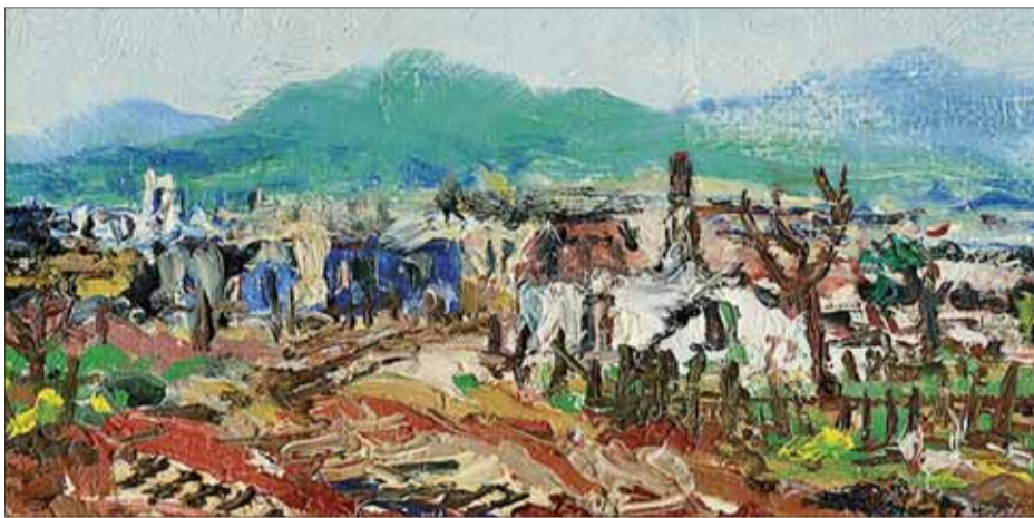
Hitlerovci opustili našu dedinu, olej, 1954, SNG.