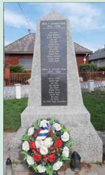
Zrekonštruovaný pomník obetiam I. a II. svetovej vojny.

76. výročie oslobodenia obce sa z dôvodu celospoločenskej situácie uskutočnilo len cestou obecného rozhlasu a zapálením sviečok pri pamätníku.