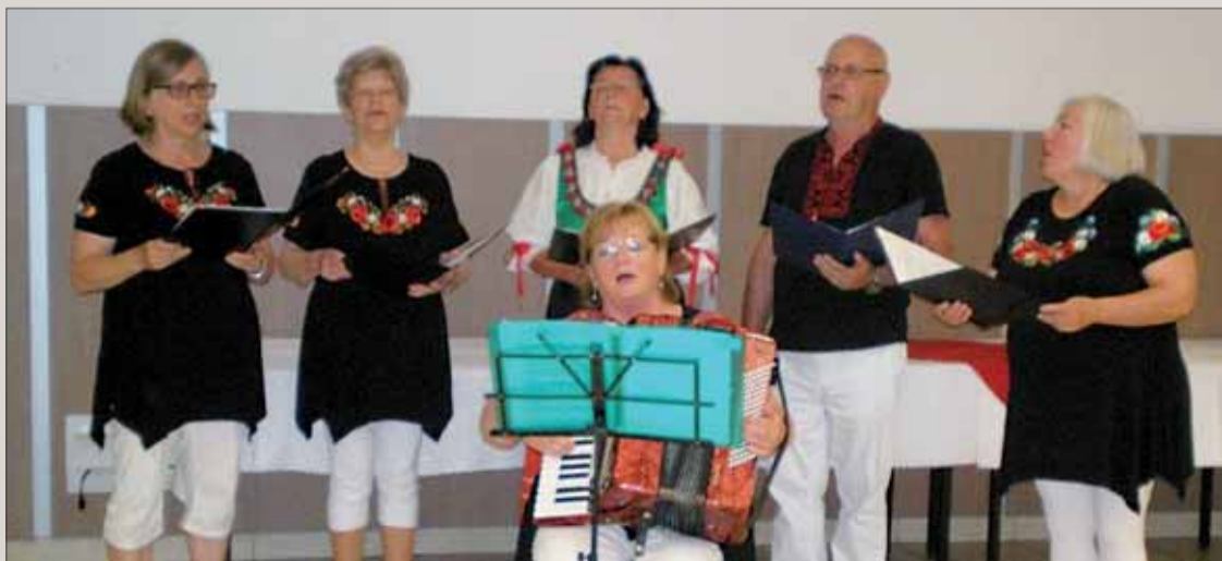
O spštenie programu sa postaral spevácky súbor Lúč.