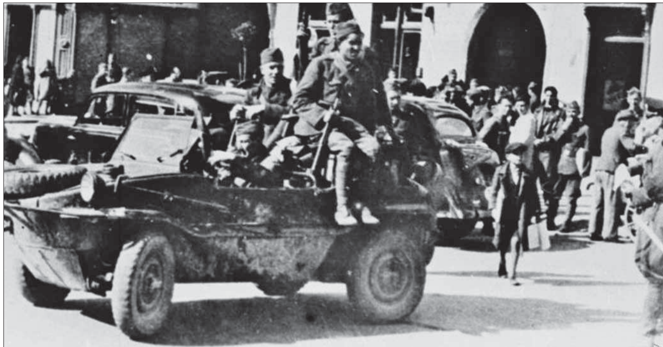
Ten malý kolportér povstaleckých novín v pravej časti fotografie je Juraj Sarvaš.