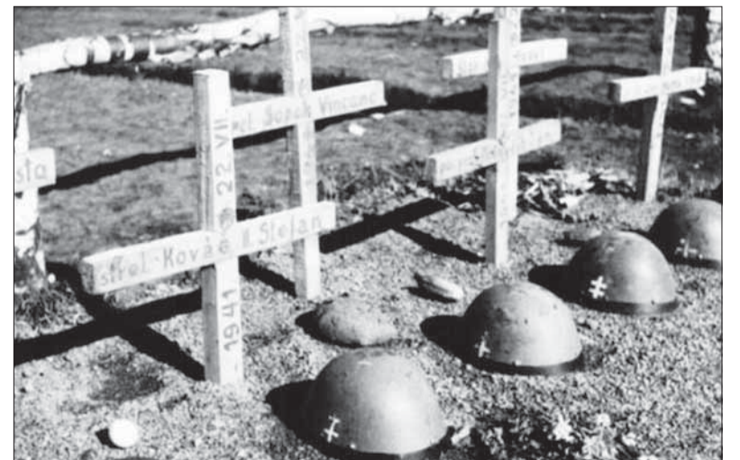
Hroby slovenských vojakov na východnom fronte.

(Historyweb, skrátené a medzititulky redakcia Bojovník)