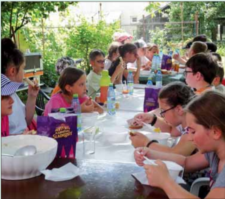
Po športových výkonoch si deti obed naozaj zaslúžili.

Vítaním blahozeláme a všetkým ďakujeme za účasť a spoluprácu.