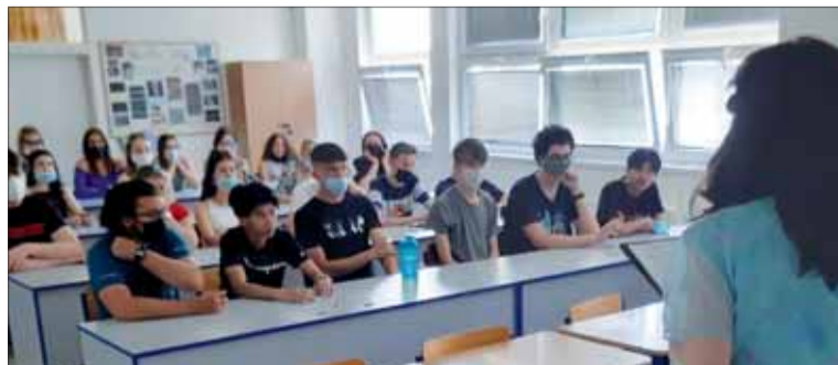
Žiakov v Dunajskej Strede prednáška o holokauste zaujala.