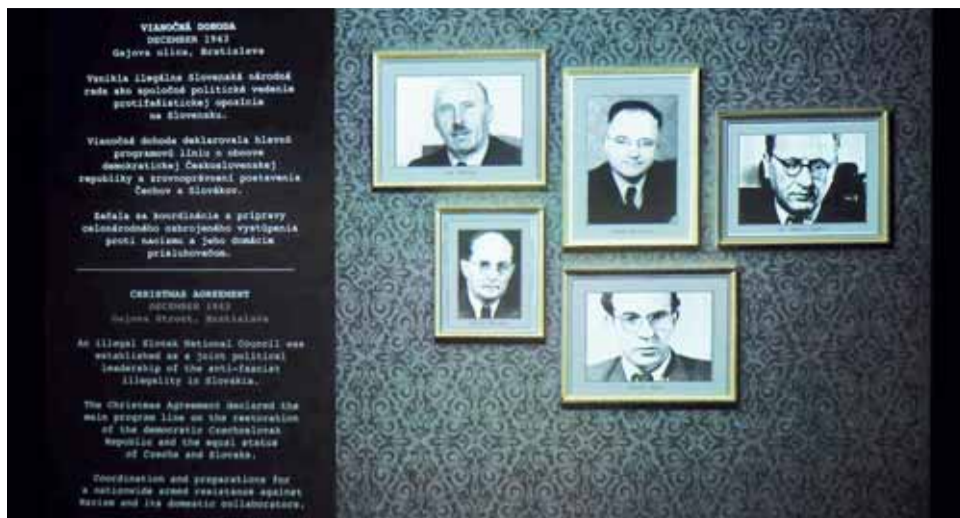
Boli to politici, kto Vianočnou dohodou rozhodol o príprave Povstania.

Za dlhú dobu spolupráce Pamätníku Terezín s Muzeem SNP jsem se spo-