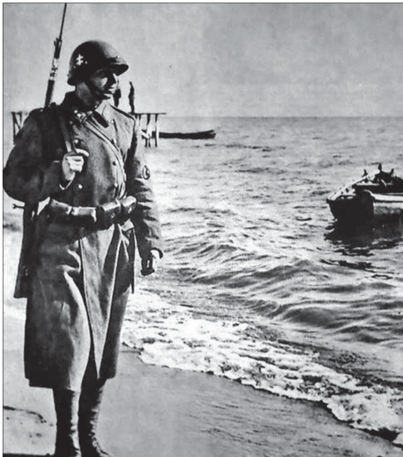
Slovenský vojak na strážii pri Čiernom mori.

Druhá svetová vojna napokon poznačila celý slovenský dôstojnícky zbor a armádu. Bolo tomu tak najmä počas poľného ťaženia proti Sovietskemu zväzu. Vojaci a dôstojníci na vlastné oči videli