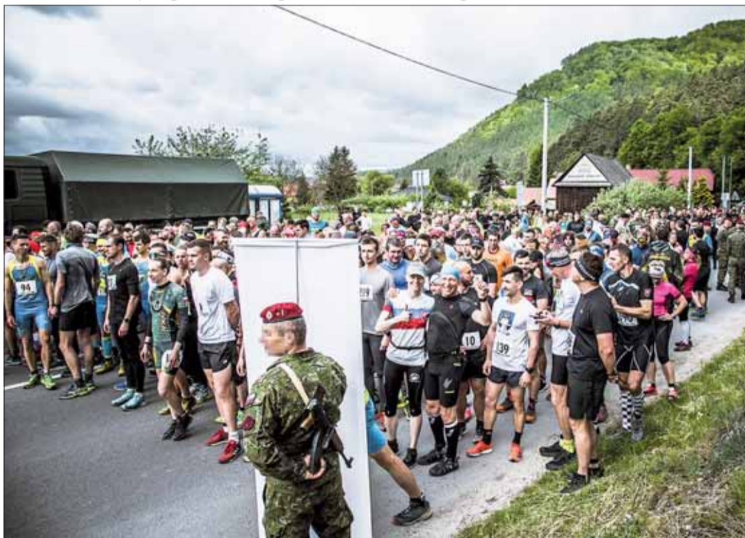
Účastníci behu vďaka.