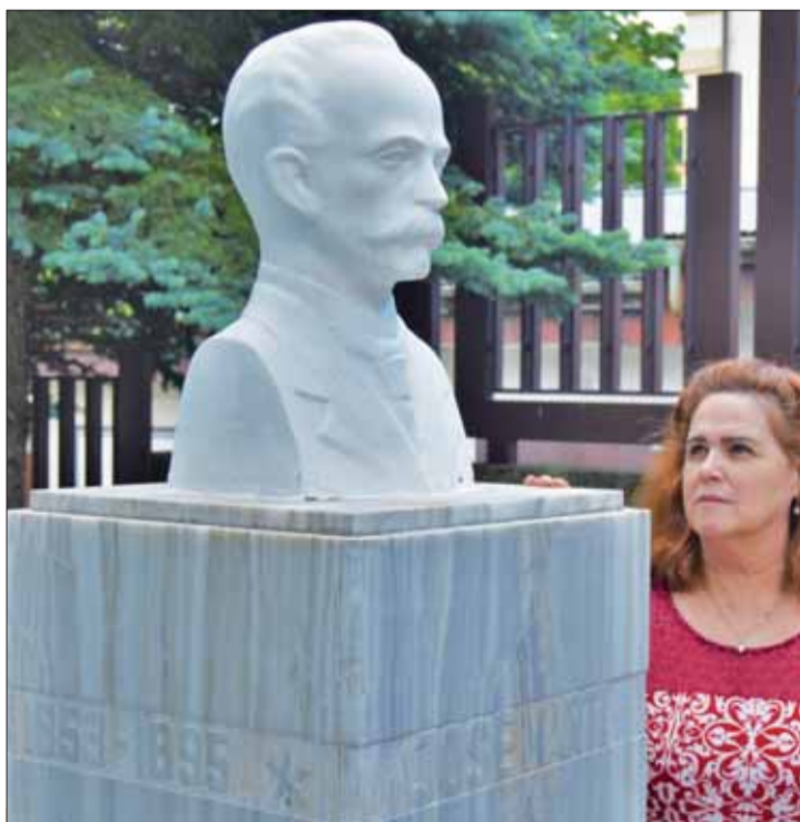
José Martí je pre Kubáncov viac než symbolom.