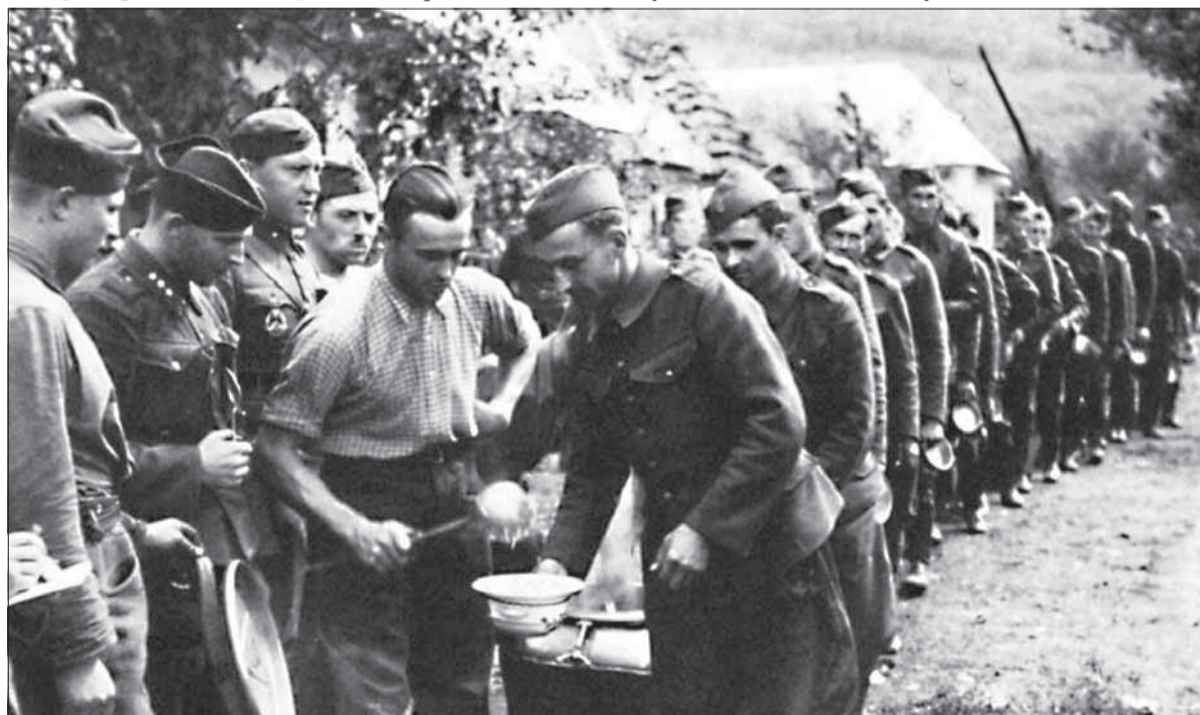
Propagandistické snímky vojakov Slovenského štátu v rade na výdaj stravy poľnej kuchyne.