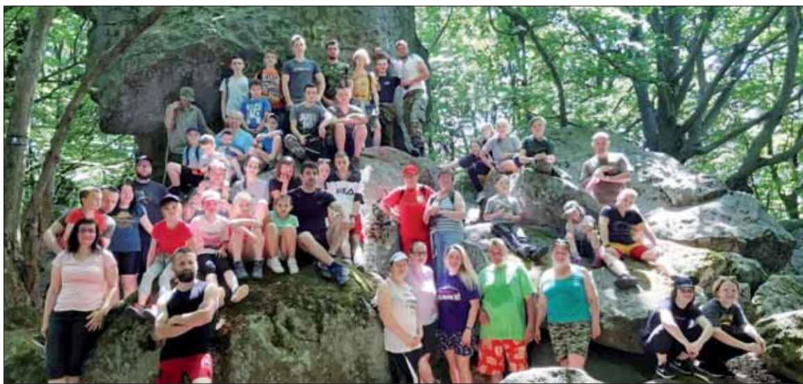
Medzi účastníkmi na Oblíku dominovali mladi.

Stretli sme sa pri miestnom pohostinstve „Kamienka“ neďaleko pamätníka partizánskeho letiska. Pokračovali náučným chodníkom „Herlica“ s informačnými tabuľkami o pôsobení zväzku Čapajev. „Za Harbom“ sme si prezreli rekonštruovaný partizánsky bunker sprístupnený verejnosti. Okolo chaty za Oblíkom sa prírodovedným náučným chodníkom dostali na jeho vrchol, kde sme spolu so staros-