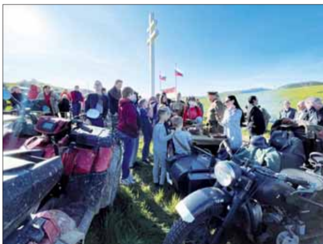
Historická vojenská technika na oslavách Dňa Víťazstva v Pavlovciach.

Využili sme túto príležitosť a prerokovali sme ďalšiu možnú koordináciu činnosti s krajskou organizáciou strany. Dohodli sme sa na spolupráci pri starostlivosti o pamätníky v Novozámockom a Komárňanskom okrese, organizovaní spoločných podujatí a zapájaní mladých členov Hlasu SD do aktivít nášho Zväzu na regionálnej i miestnej úrovni. Príklad hodný nasledovania aj v ostatných oblastiach Slovenska.