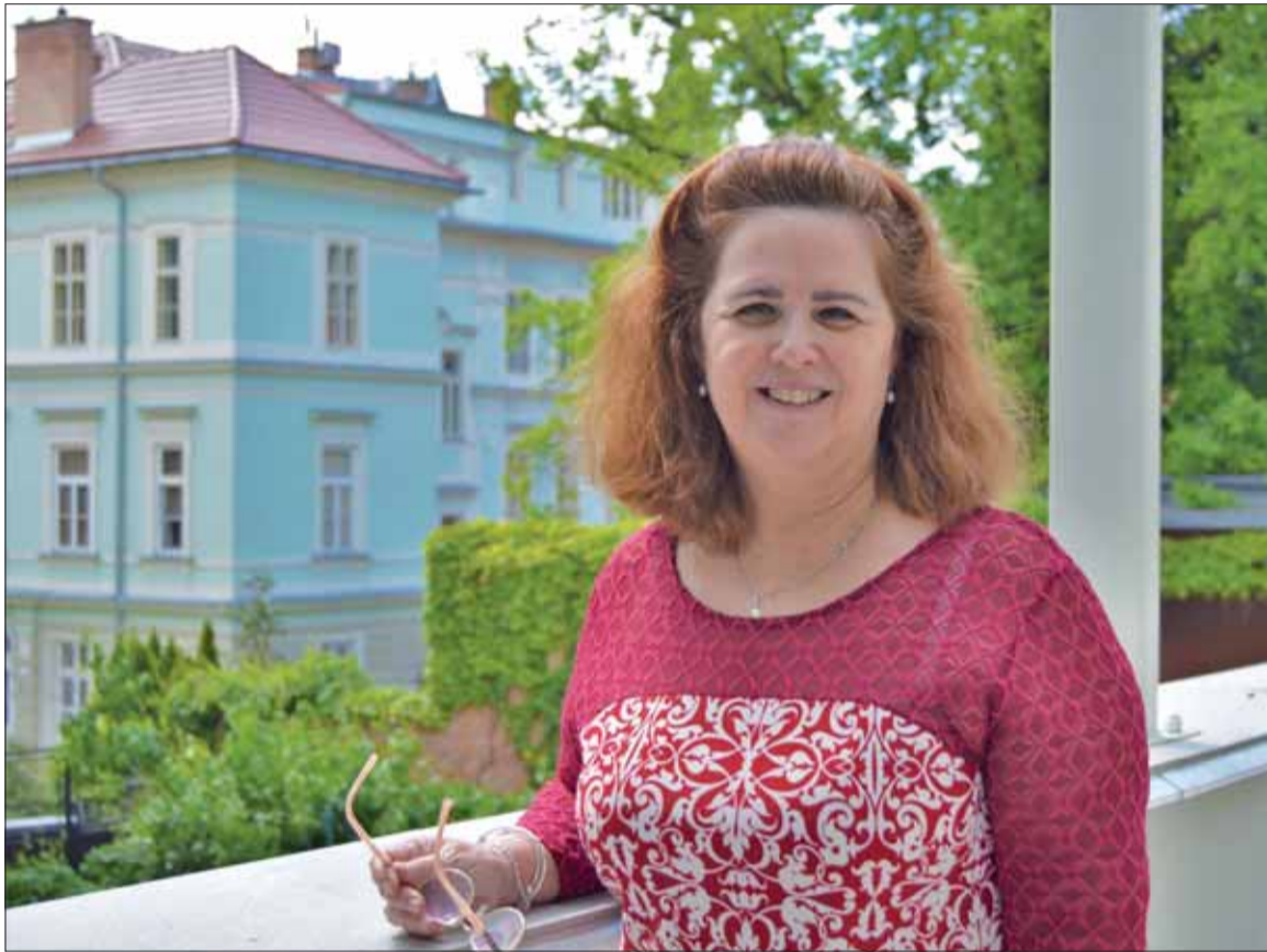
Veľvyslankyňa Kuby na Slovensku Yamila Pita Montesová.

Vnímame to veľmi citlivo a tento postoj si veľmi vážime. Fakt, že celá EÚ na pôde OSN hlasuje proti embargu vníma veľmi pozitívne a má pre nás veľký význam.