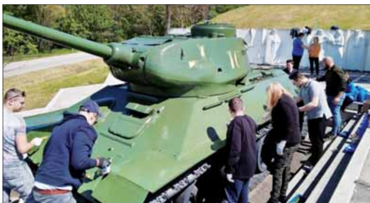
Mladi z Hlasu-SD v akcii v Kameníne.

vytlačenie 380-stranovej publikácie celkovo 4500 €, zbiera ich malými príspevkami od budúcich majiteľov pútavej knihy. Ak si ju chcete už vopred kúpiť a podporiť užitočný projekt protifašistickej výchovy, navštívte internetovú adresu https://www.startlab.sk/projekty/2130-draho-vykupena-sloboda/