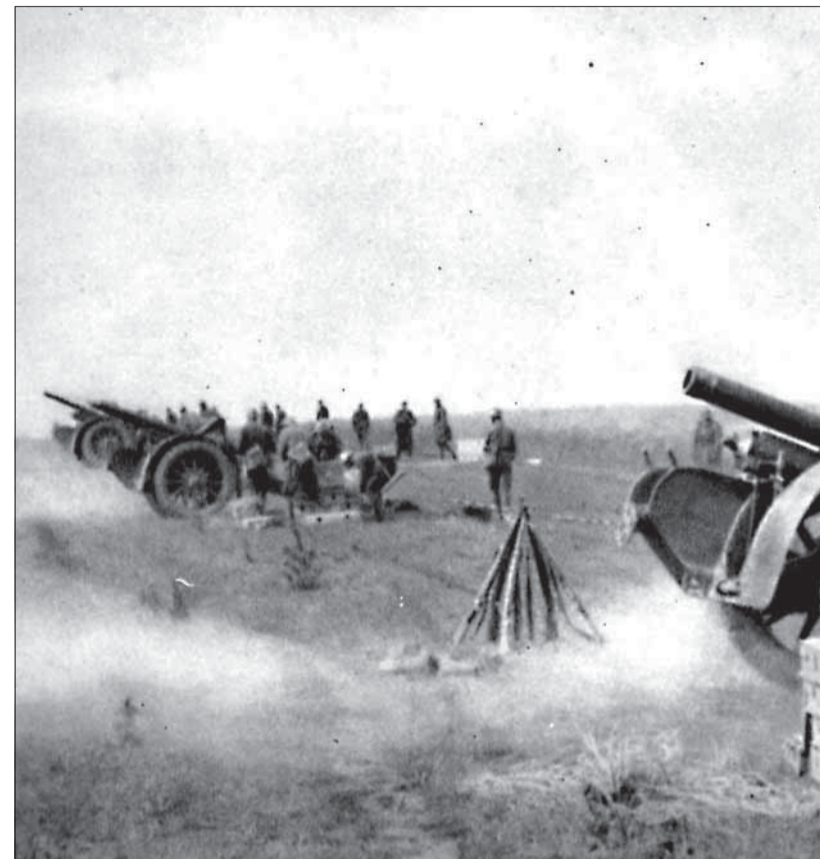
Delostrelci Rýchlej brigády ostreľujú nepriateľské postavenie pri Lyp-

vyššími dôstojníkmi prevzatými z československej armády neprevažovali katolíci. Dôstojnícku špičku tvorilo viacero legionárov a pomerne mnoho protestantov. Aj minister obrany Ferdinand Čatloš bol ako jediný člen vlády evanjelik.