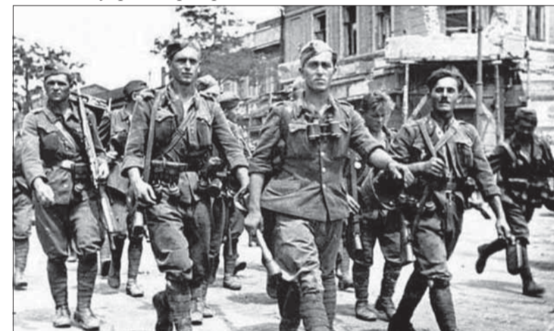
Slovenskí vojaci v uliciach Rostova, júl 1942.

Prehlbujúce sa britsko-americké zblížovanie v otázkach možnej vzájomnej vojenskej spolupráce potvrdila ďalšia skutočnosť. Na krížiaku Augusta a bojovej lodi Prince of Wales sa 9. až 12. au-