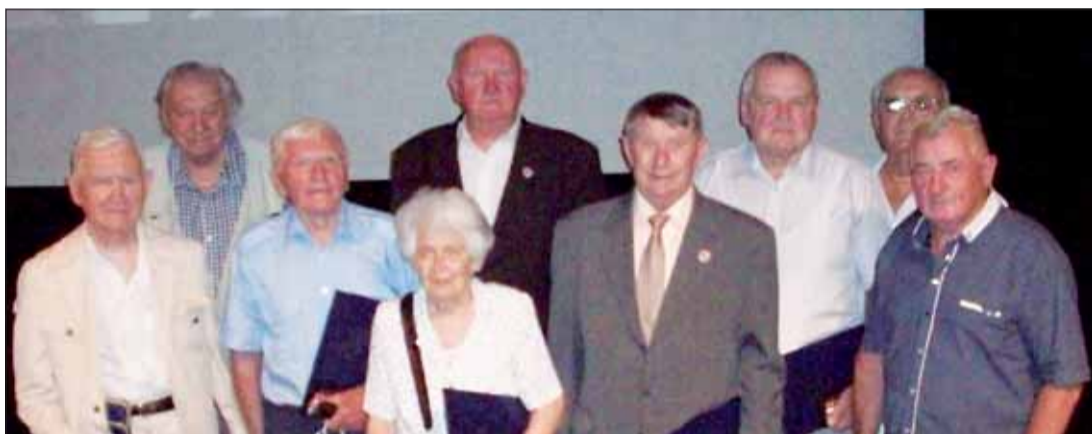
Ocenení členovia Zväzu v B. Bystrici.

tického klubu „Krokus“. Na vrchole Oblíka každý dostal pamätnú vlajočku a po zostupe k chate za Oblíkom občerstvenie. Vďaka patrí obci Petrovce za finančnú podporu podujatia.