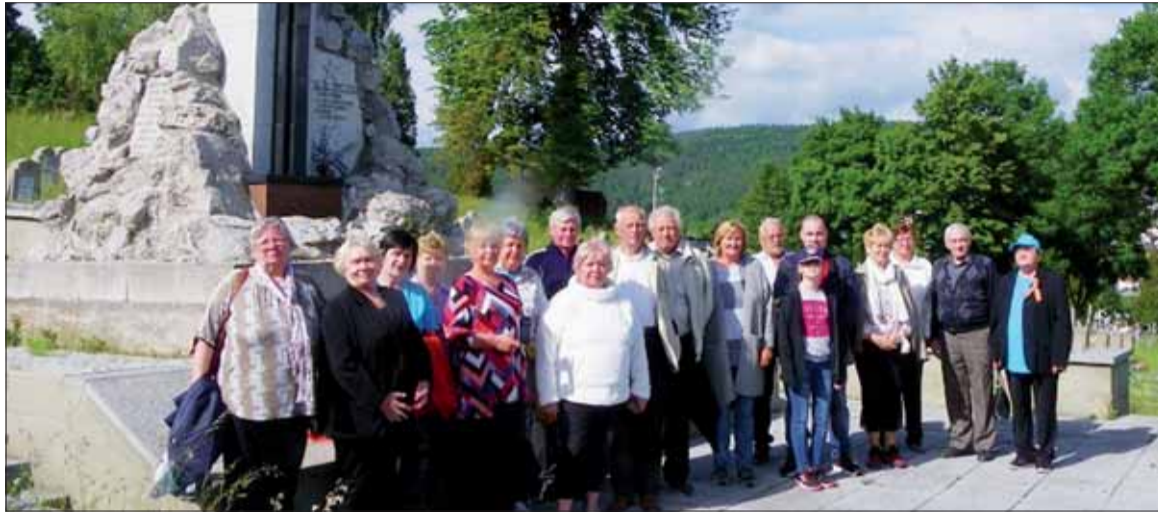
Účastníci spomienkového výletu zo Stropkova.

Členovia Jednoty dôchodcov Slovenka v Stropkove, inšpirovaní členmi SZPB a Klubu Arbat navštívili pamätné miesta bojov za našu slobodu, aby si pripomenuli 80. výročie vypuknutia veľkej vlasteneckej vojny. V nedelu 13. júna sme začali pri Pamätníku Sovietskej armády vo Svidníku, kde leží vyše 9000 červenoarmejcov. Vypočuli sme si informácie o Karpatko-duklianskej operácii a výstavbe pamätníka.