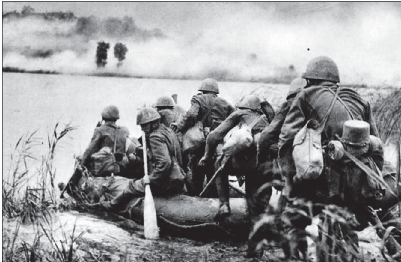
Slovenskí vojaci sa chystajú preplaviť Dneper počas útoku na Kyjev.