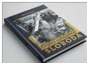
Publikácia Draho vykúpená sloboda je už pripravená do tlače.