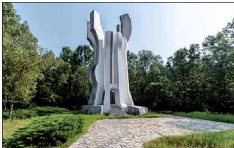
Pomník Sisakovského národno-oslobodzovacieho partizánskeho oddielu

Federácia protifašistických bojovníkov Chorvátska, Sisakovskej a Sisakovsko-Moslavinskej župy v rámci Dňa boja proti fašizmu každoročne organizuje pokladanie ven-cov v pamätnom parku v Brezovici.