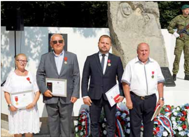
Ocenení v Michalovciach.

V okresoch Michalovce a Sobrance sme si 80. výročie SNP pripomenuli v Porube pod Vihorlatom, Nacinej Vsi, Remetských Hámroch, Rakovci nad Ondavou, Trhovištiach, Zalužiciach, Strážskom a v Michalovciach na Bielej Hore.