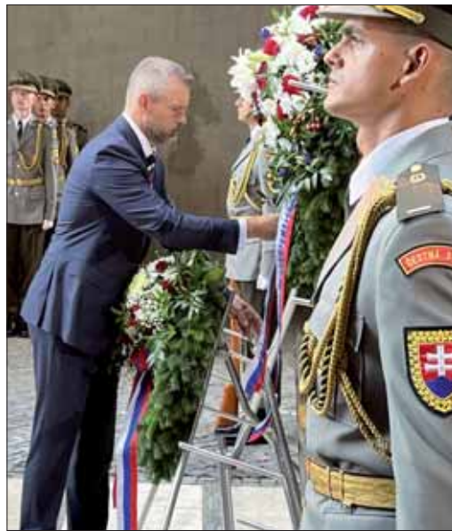
Prezident SR Peter Pellegrini vyjadril svojím vencom úctu všetkým bojovníkom SNP.