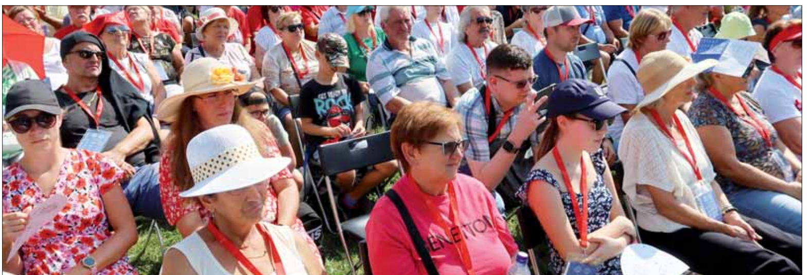
Aj týmto ľudom boli minuloročné ústredné oslavy Výročia SNP znemožnené.