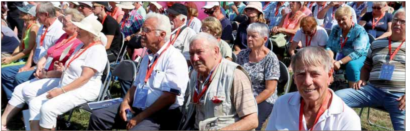
Pohľad na členov SZPB zo Spiša.