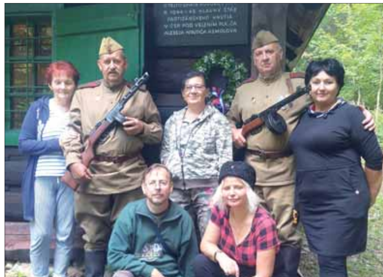
Členovia ZO SZPB Nitra-kraj pod pamätnou tabuľkou na Asmolovovej chate.

ný chodník s informačnými tabuľkami a za zrekonštruované bunkre, si naozaj zaslúžia uznanie a veľkú vďaka. -SF-