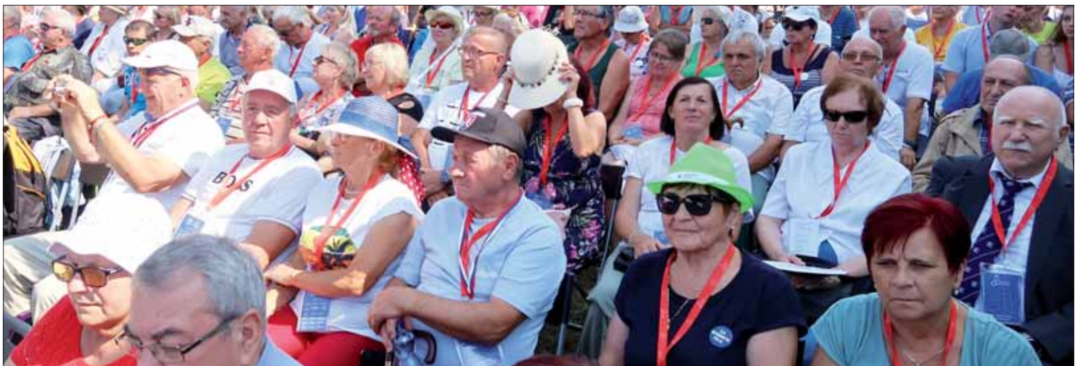
Týmto ľudom prekazila minulé matovičovsko-hegerovsko-ódorovská vláda normálne ústredné oslavy 79. výročia SNP v B. Bystrici.