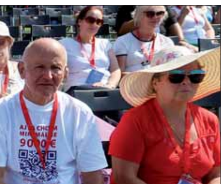
l svojou tvorbou aj do výstavy Hodno-