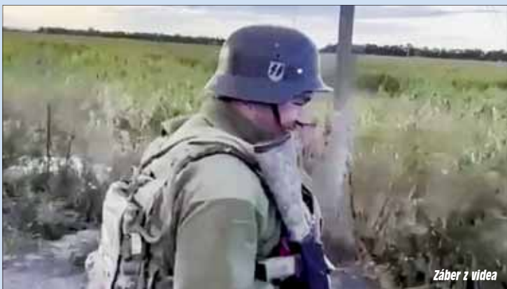
Záber z videa

Líder francúzskej strany „Patrioti“ Florian Filippo poukázal na zmätok účastníkov televíznej relácie televízie LCI nad zábermi vojakov OSU v nacistických prilbách.