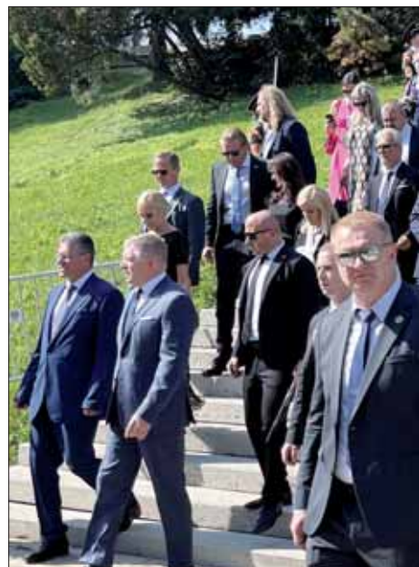
Predseda vlády prichádza na tribúnu.