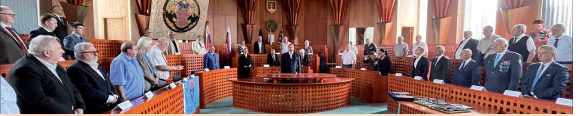
Hymnu si prítomní vypočuli postojacky.

Postrehy zo slávnostného zasadnutia ÚR SZPB, uskutočneného 28. augusta vo veľkej zasadačke Mestského úradu v Banskej Bystrici