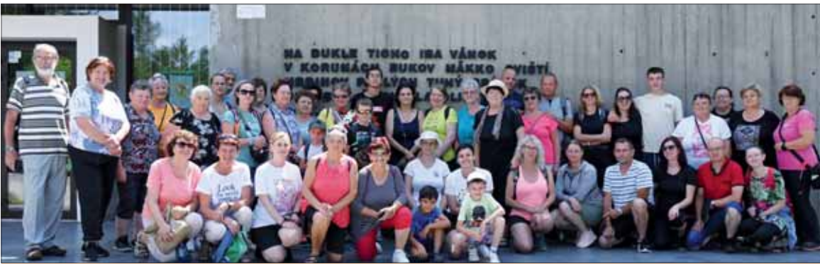
Vďaka finančnému príspevku v projekte participatívneho rozpočtu obce Helpa, Zachovávanie odkazu SNP a histórie, uskutočnila naša ZO SZPB 20. júla 2024 zájazd na Duklu, do Údolia smrti a do vojenského múzea vo Svidníku. Výbor ZO SZPB Helpa