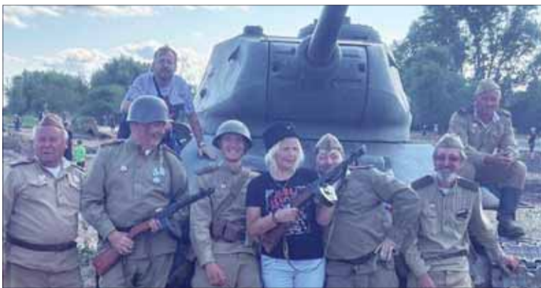
Prelomenie Hrona – Členovia ZO SZPB Nitra-kraj.