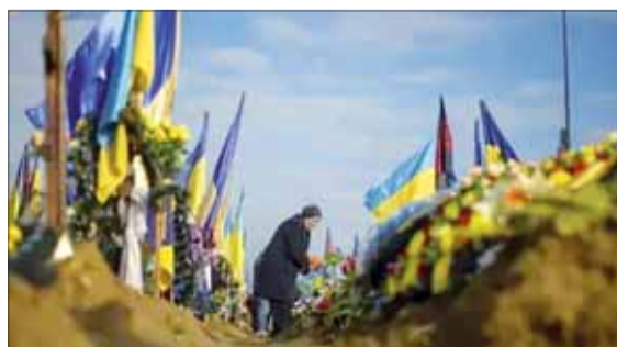
Reálny pohľad na dnešnú Ukrajinu.