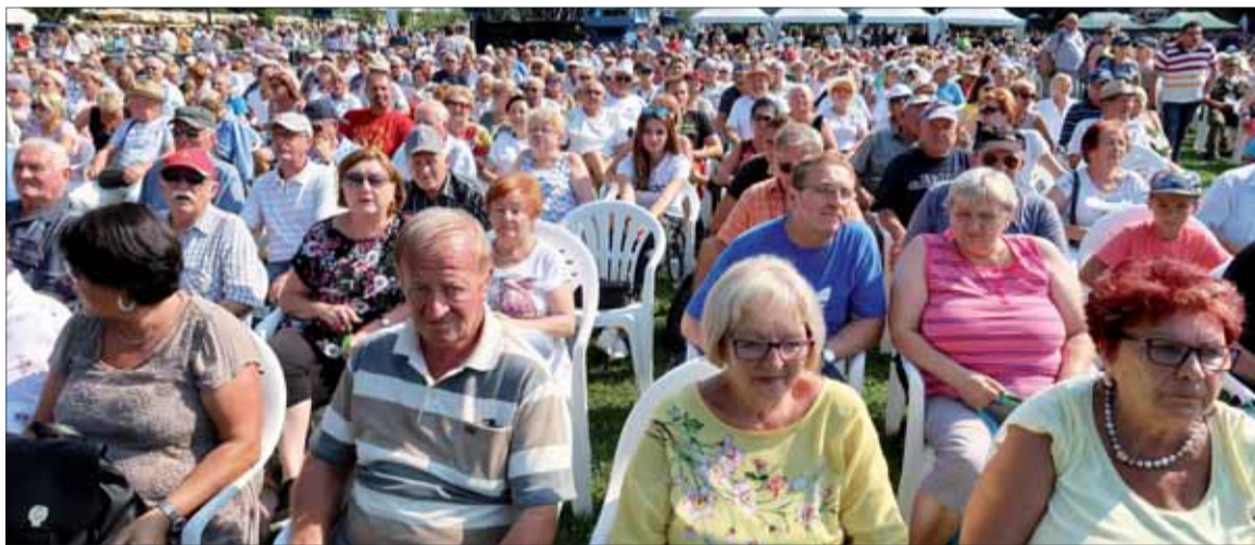
B. Bystrica 2019, podpora naprieč celým Slovenskom.