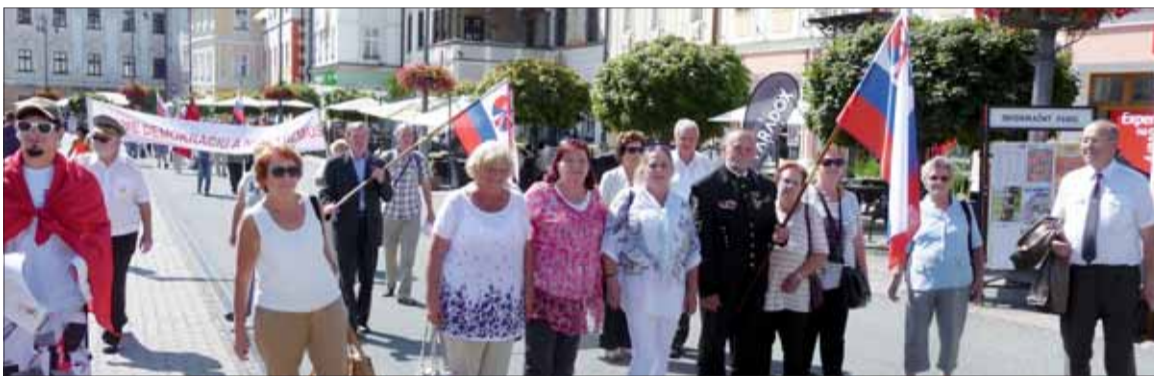
SNP B. Bystrica 2017, protest.