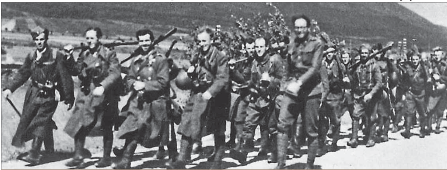
Slovenskí karpatskí Nemci v SNP.

1944: 31. august (až 4. september 1944). Začiatok bojov o Strečniansku tiesňavu, ktoré trvali 5 dní. Vďaka tomu bol získaný čas na sformovanie povstaleckých frontov a zaujatie obranných postavení.