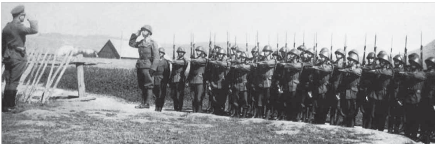
Francúzi v SNP.

1944: 21. august. Skladište: prvá obec na Slovensku, v ktorej bola vztýčená československá zástava (na dome Sam-