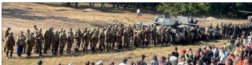
Prelomenie Hrona – Vyhodnotenie.