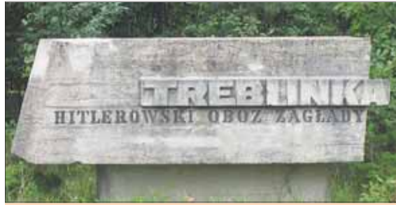
Pamätník vo vyhľadzovacom tábore Treblinka.

Ravensbruck: Prví väzni sem prišli 15. 5. 1939. Najskôr sem prišli Nemky a Rakúšanky, po