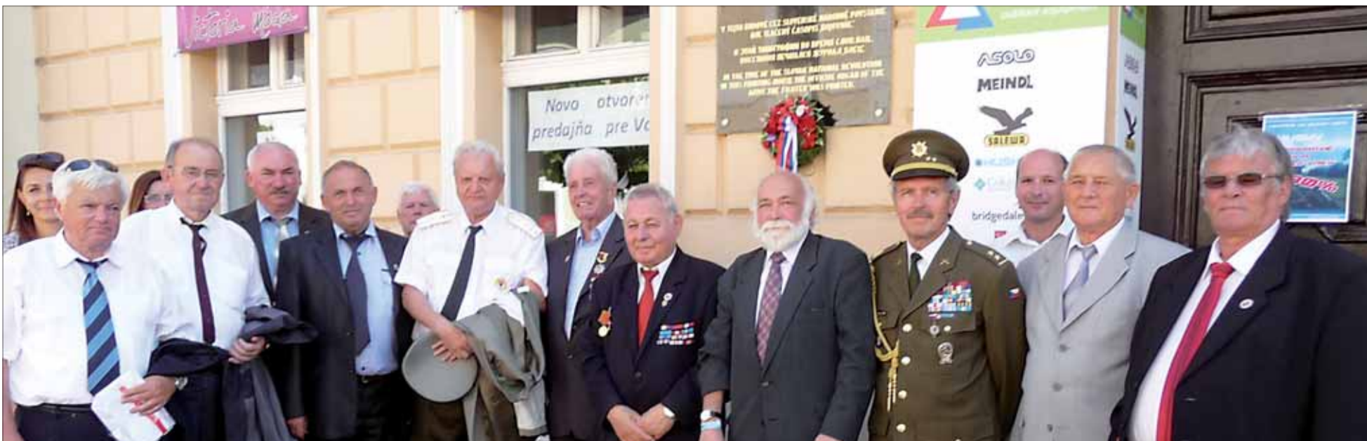
V tejto budove vychádzal Bojovník.