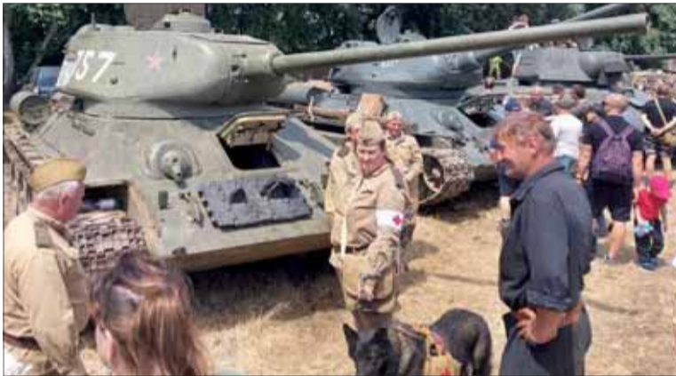
Prelomenie Hrona – Momentka po boji.