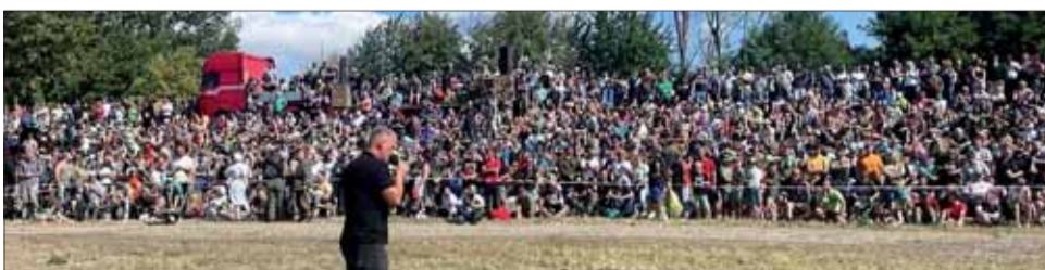
Prelomenie Hrona – Jednoznačný dôkaz o záujme.