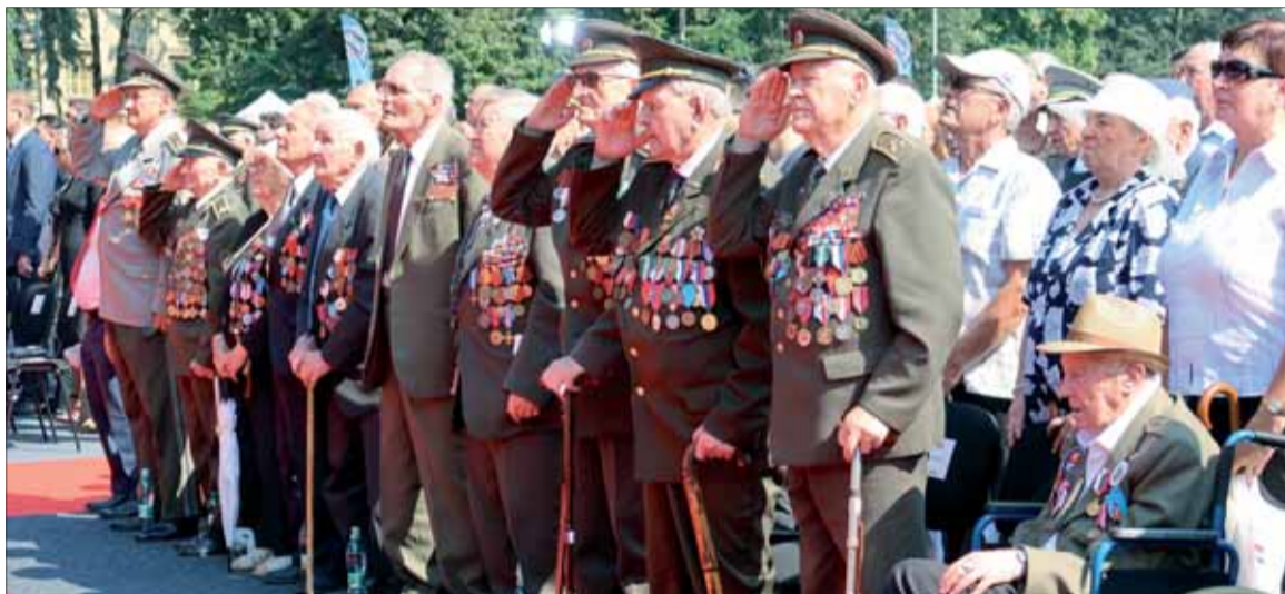
Naši hrdinovia, B. Bystrica 2019.