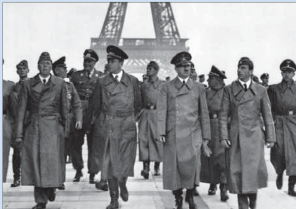
Na ovládnutie západnej Európy stačilo Hitlerovi 39 dní.

1939: 28. august. V novom osobnom posolstve Hitlerovi (prvé bolo 22. augusta) britský premiér Chamberlain naznačil, že Veľká Británia negarantuje poľské hranice a opäť ponúkal rokovania o dosiahnutí kompromisu. Britský veľvyslanec Henderson navštívil 29. augusta nemeckého ministra zahraničia Ribbentropa. No nič to neriešilo, nacistická vláda už bola rozhodnutá pre vojnu.