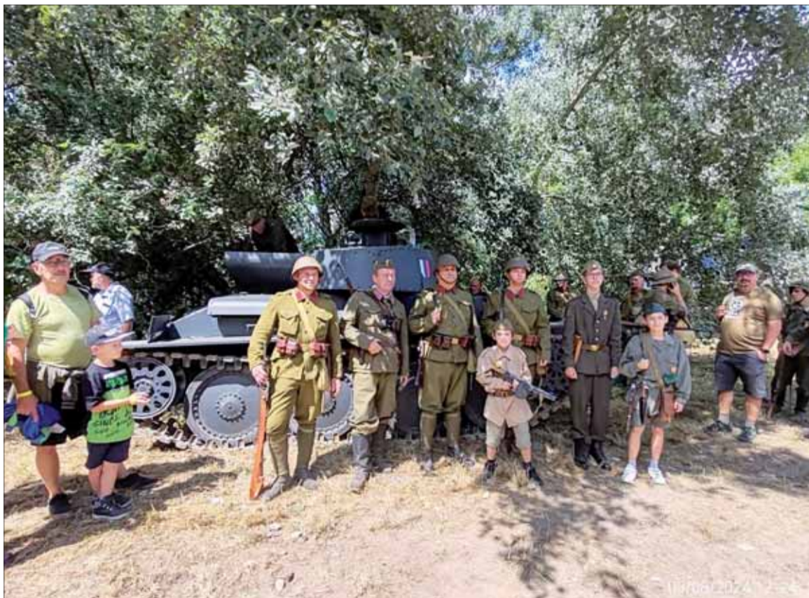
Prelomenie Hrona – Obdivovaní a obdivovatelia.