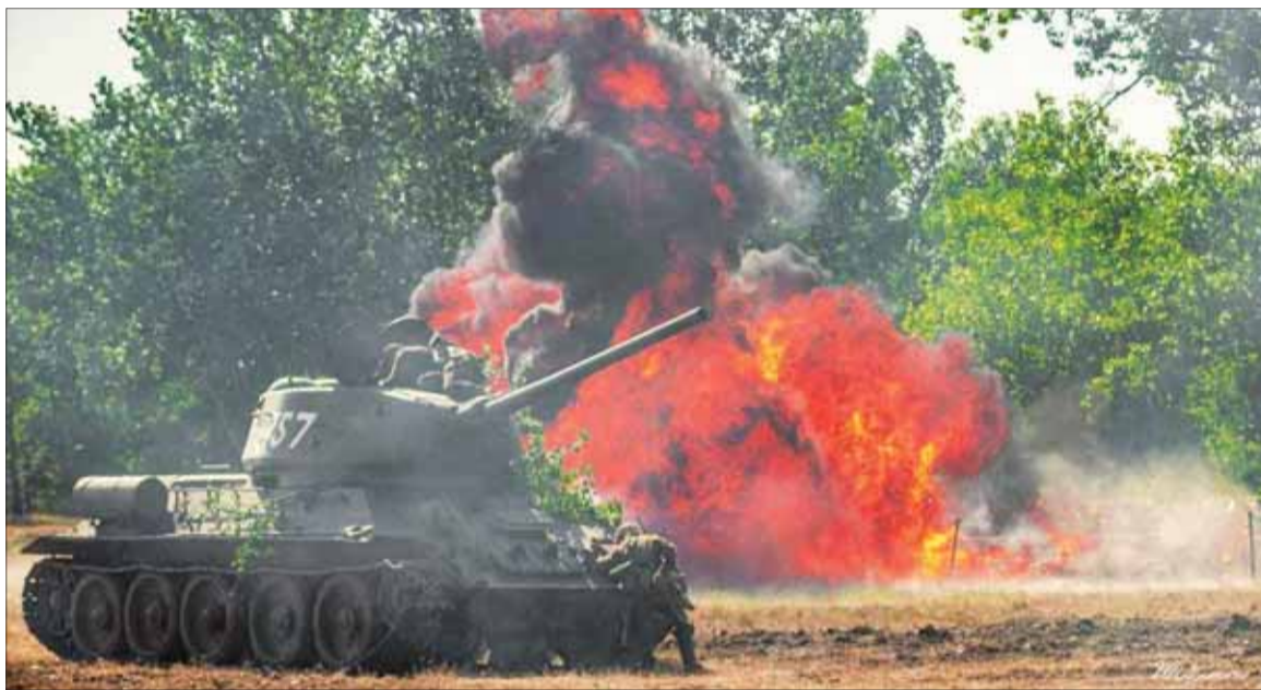
Prelomenie Hrona – Ozvalo sa nepriateľské delostrelectvo.