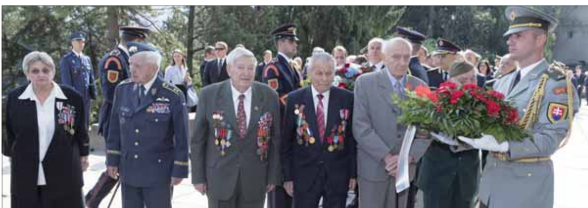
SNP B. Bystrica 2018.