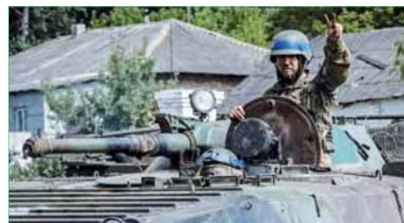
Príliš skoro javili znaky víťazstva.