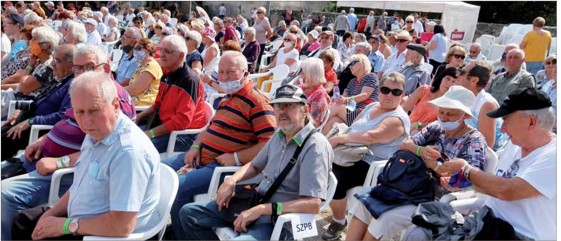
Spomienka na 76. výročie SNP.