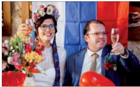
Svadba bola veľkolepá! Za svadobníkmi bola zástava Slovenska, po stranách zástavy USA a Turecka. Na svadobných stoloch boli zástavky aj z Japonska, Švajčiarska, Kanady.

ke Tatry sa tiahnu stredom Slovenska, majú krásnu flóru, faunu a sú nádherným vyhlídkovým miestom na Pohronie, Liptov, Vysoké Tatry... Prechod hrebeňom Nízkyh Tatier utužuje zdravie, upevňuje vôľové vlastnosti, prispieva k nadviazaniu nových priateľstiev s domácimi ale aj so zahraničnými turistami. Samozrejme, aj na tohtoročnom jubilejnom pochode sme venovali náležitú