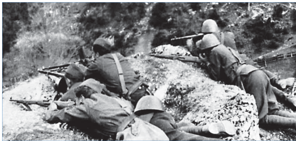
SNP. Obrana povstaleckého územia.

1943: 30. januára príslušníci 1. čs. samostatného poľného práporu v ZSSR skladajú prísahu a 1. februára 1943 od-