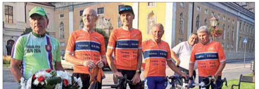
Na štart 46. ročníka sa postavili aj Účastníci – veteráni, ktorí sa zúčastnili prvého ročníka v roku 1974.

Dňa 11. júla 2024 o 3.45 hod. odštartovali pred internátu Materiá-