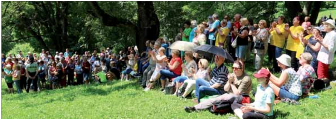
Toto sú skalní protifašisti a slovenskí vlastenci! Koľko ich prišlo na Kalište v tomto roku? Výrazne menej ako v tom minulom, pretože objednaných bolo len 900 porcií gulášu, kým minulý rok 1 500.