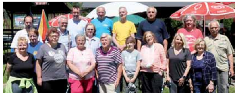
Účastníci športových hier zo ZO SZPB Košice-Juh.