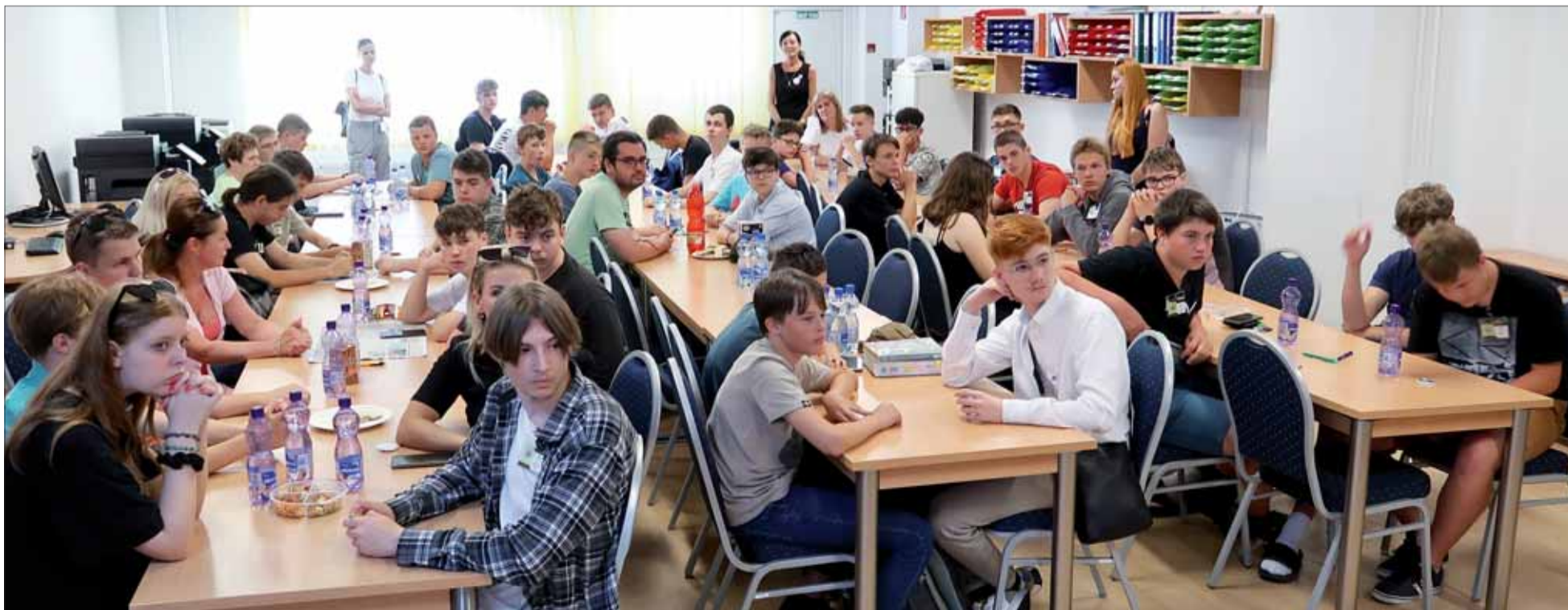
Tohtoroční finalistí „Medzníkov...“. Nie je trochu čudné, že tu súťažili len tri dievčatá?