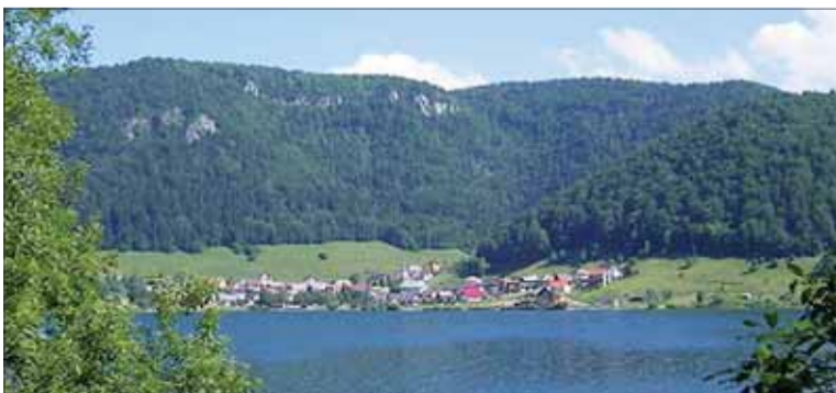
Obec Dedinky dnes.