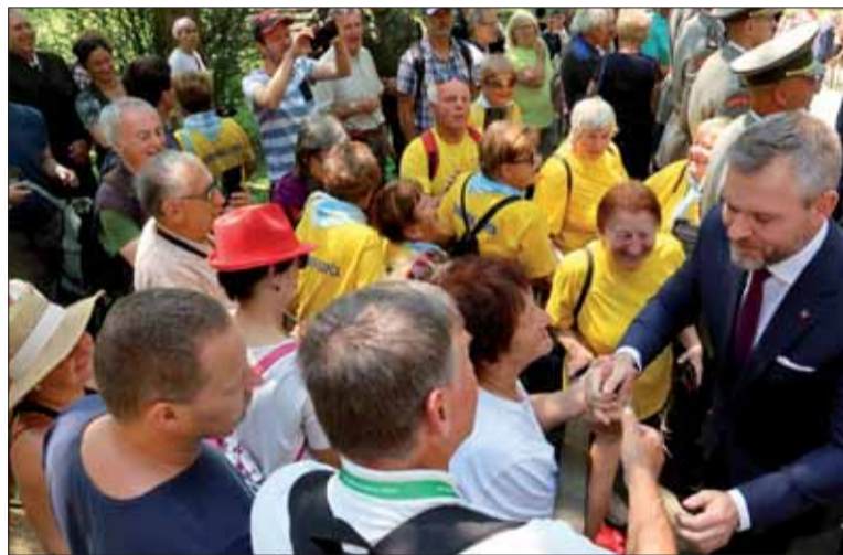
Aj na tomto zábere je vidieť, že Peter Pellegrini oslovil Kalište srdcom všetkých prítomných.