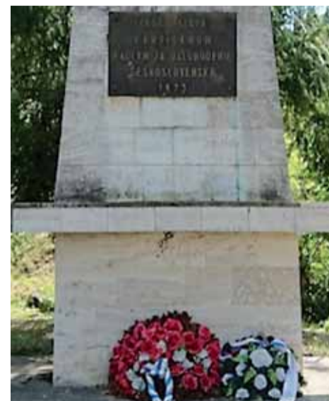
Pamätník padlým v Obišovciach.

Jediný veľký predfrontový boj na území súčasných košických okresov, ba aj súčasného KSK