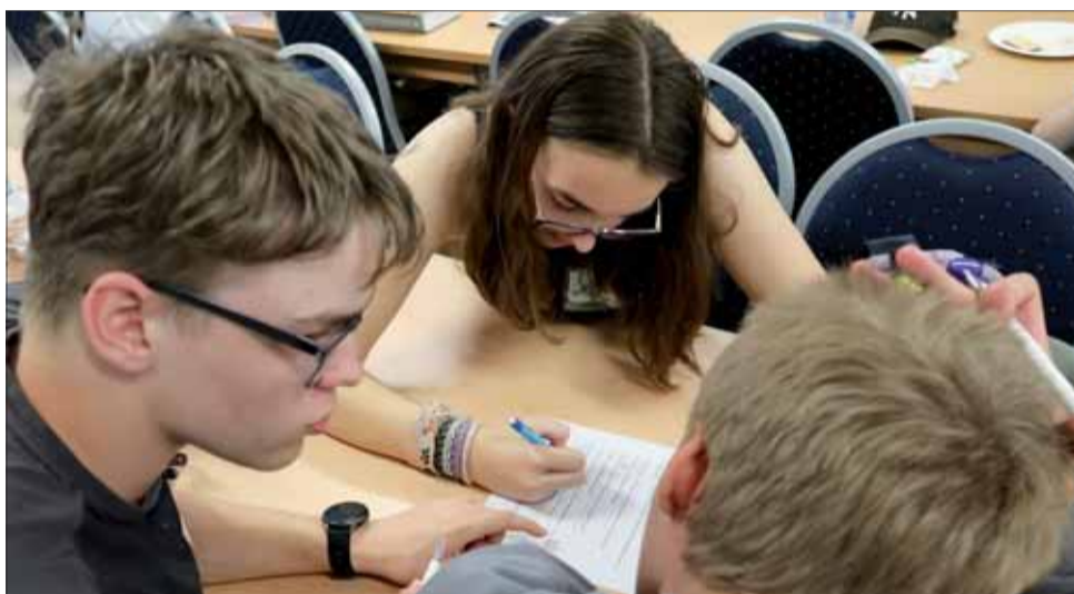
Prvá momentka zo súťaže.