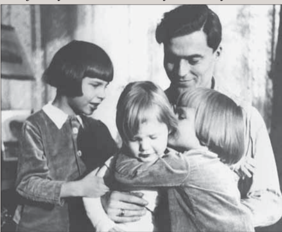
Aj týmito svojimi deťmi riskoval Claus von Stauffenberg.