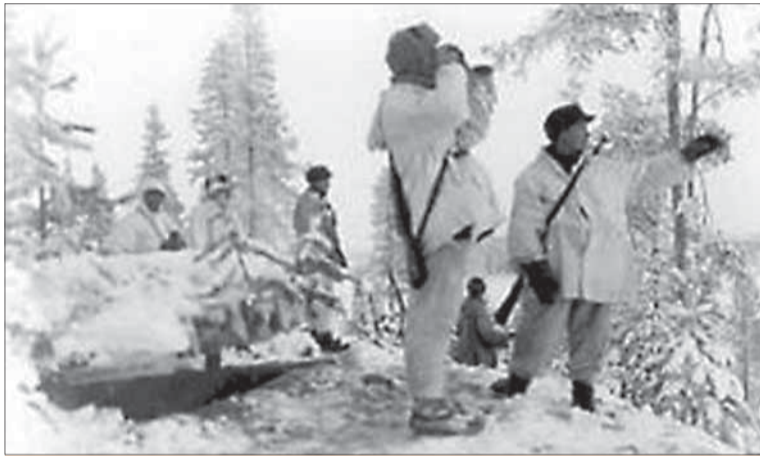
Fínski vojaci sledujú sovietske postavenia.

Generálna prokuratúra RF tvrdí, že celková škoda, ktorú okupanti spôsobili Republike Karélie, je v prepočte na súčasný kurz rubľa vyše 20 biliónov rubľov.