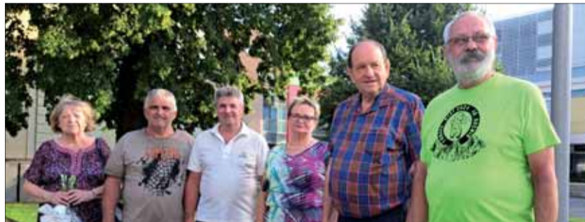
Spoločné foto hlavných organizátorov cyklojazdy a členov oblastného výboru SZPB Trnava.

slušníkmi 2. čs. paradesantnej brigády v ZSSR utvorili partizánsky oddiel, s ktorým operoval v priestore Vepor – Poľana – Bukovina. Začiatkom roku 1945 sa prebil so svojou jednotkou pri Hrončeku k sovietskym vojskám a prihlásil sa do 1. čs. armádneho zboru v ZSSR. Tu od 18. 2. 1945 vo funkcii veliteľa 3. samostatného práporu automatčikov 4. čs. brigády