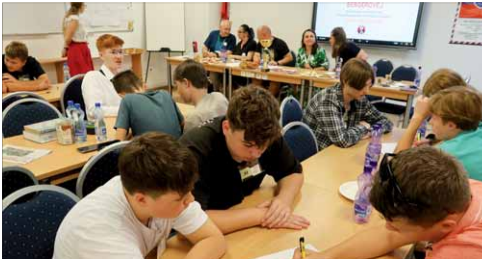
Pohľad na súťažiacich a porotu.