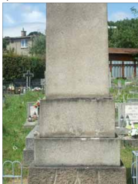
Pamätník nad vojnovým hrobom deviatich padlých 1. 9. 1944 na starom cintoríne v Kysaku.

Dňa 1. septembra 1944 mali vybrané jednotky brigády Čapajev podniknúť niekoľko útokov na nemecké jednotky s cieľom prekaziť dokončenie odzbrojovania dvoch východoslovenských divízií a oslobodiť internovaných vojakov, ktorých ešte nedeportovali do ríše. No a za priaznivých okolností zabezpečiť kontakt s centrom povstania, resp. vytvoriť koridor medzi dvoma oblasťami stredoslovenskou a východoslovenskou, keďže medzičasom nemecká armáda a ďalšie ozbrojené skupiny, výrazne sťažili túto možnosť.