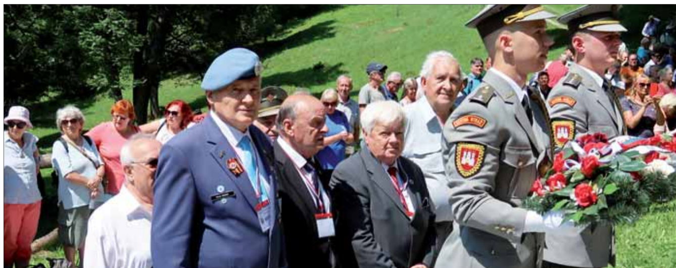
Úctu ide vyjadriť delegácia SZPB.

„Vďaka nášmu projektu MOREtime sa snažíme presláviť a propagovať náš unikátny životný spôsob, ponúkajúc ľuďom možnosť omnoho kvalitnejšie vyplniť svoj čas, zaoberajúc sa takou činnosťou, ako je rybolov, poľovníctvo, výučba nových rečí alebo len rozprávanie sa s blízkymi,“ zdôraznila primátorka v liste zaslanom EK. Podľa Politiko