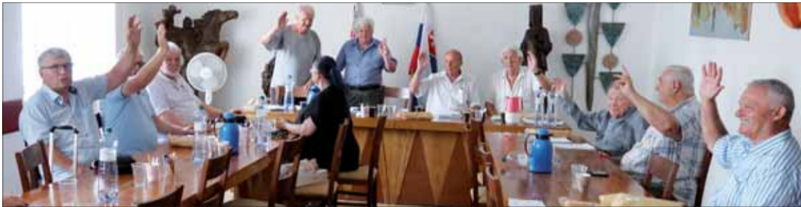
Uznesenie bolo prijaté jednohlasne. Informácia o neexistujúcej pôžičke od nejakej banky proti zálohu budovy SZPB bola schválená v rámci „Informácie predsedu SZPB o stave zväzu“.