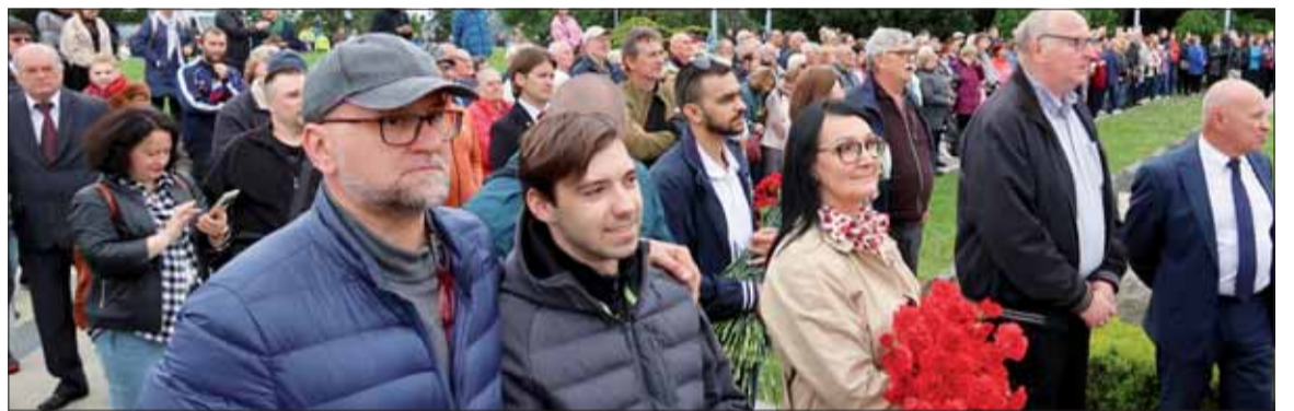
Návštevníci z Bratislavy i celého Slovenska.