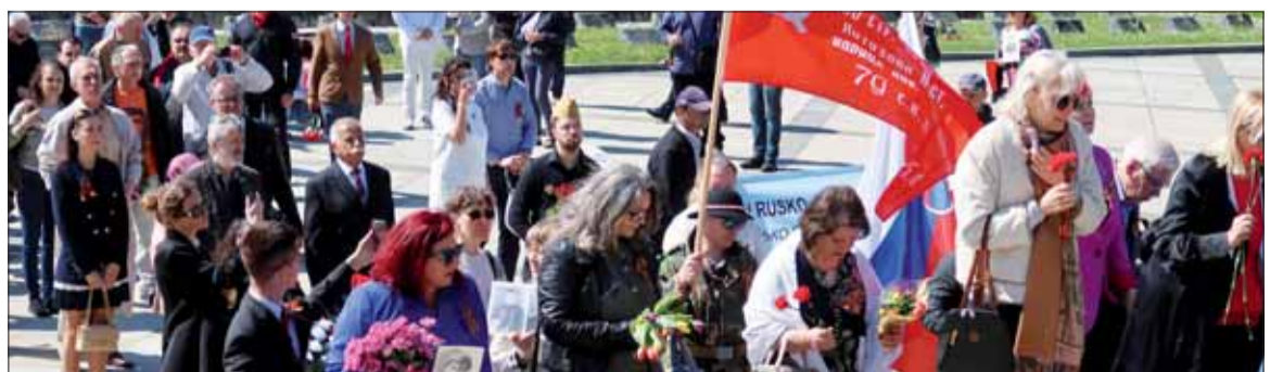
Vence a kvety položili na Slavíne aj členky Slovensko-ruského klubu Arbat a vokálnej skupiny „Devčata“.