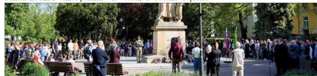
Sad SNP vyjadril vďaka osloboditeľom aj počtom návštevníkov.