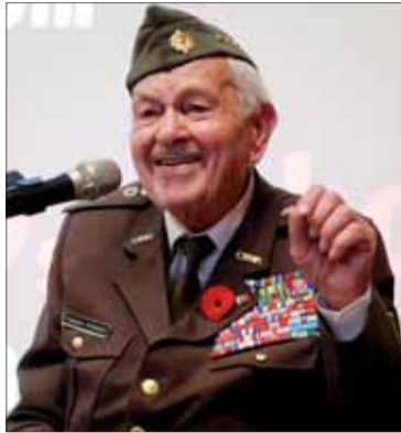
Vladkov kontakt bol s publikom stále živý.

Z ďalších otázok bolo: Kedy dostal prvé vyznamenanie?