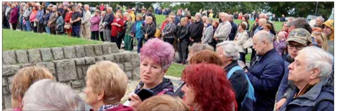
Ďalší pohľad na návštevníkov Slavína.