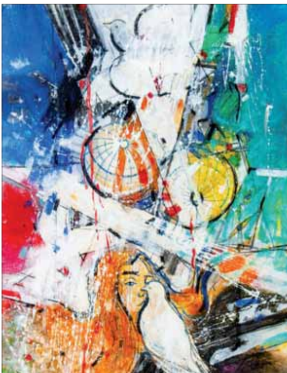
Stanislav HARANGOZÓ: Za svetový mier I., komb. technika 1979–2022, 58 x 42 cm