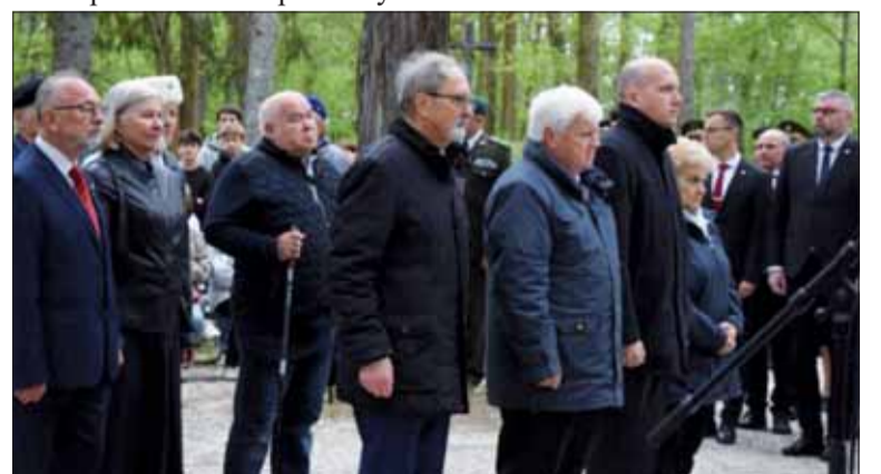
Delegácia Slovenského zväzu protifašistických bojovníkov.