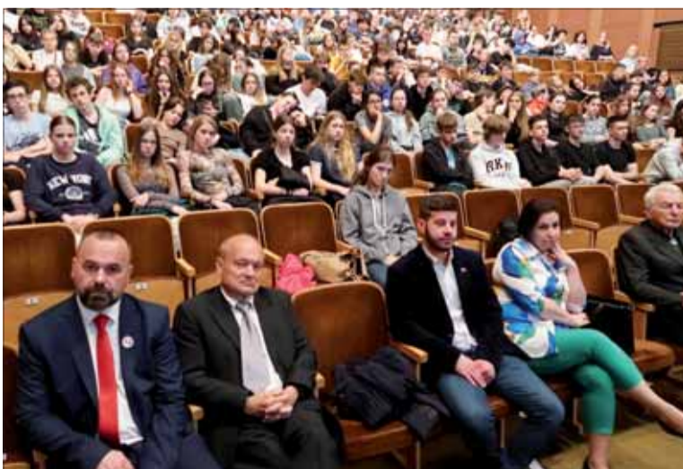
Druhý pohľad do sály, vpredu samosprávnici funkcionári.