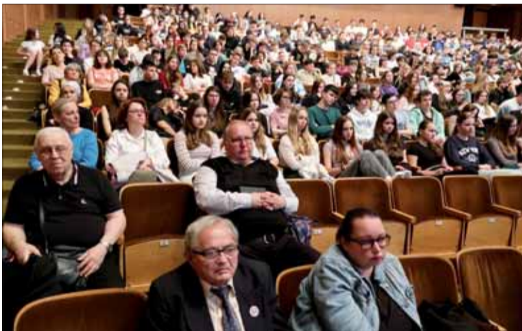
Prvý pohľad do sály, vpredu funkcionári SZPB.