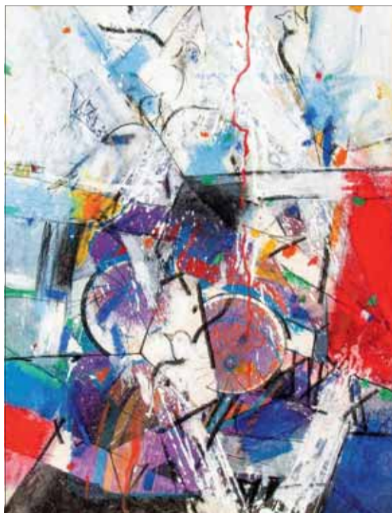
Stanislav HARANGOZÓ: Za svetový mier II., komb. technika 1979–2022, 58 x 42 cm