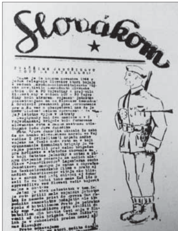
Prvá strana partizánskych novín v slovenskom jazyku, ktoré vychádzali v Srijeme pod názvom: Slovákom .