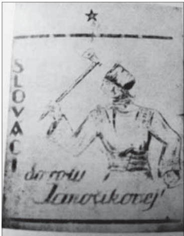
Faksimile prvej strany partizánskych novín v slovenskom jazyku: Slováci do roty Jánošíkovej!