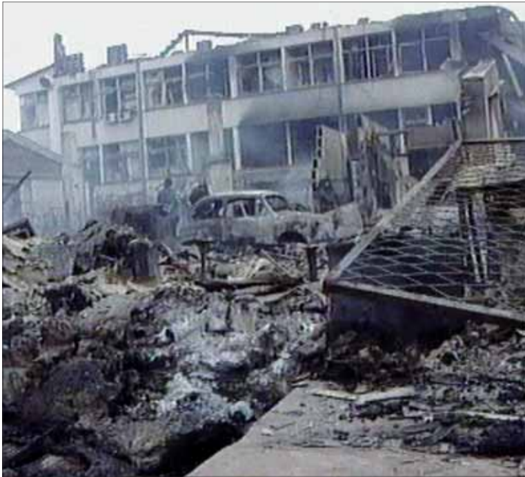
Policijné kasárne v Prištine po bombardovaní 29. 3. 1999.

Lockheed F-117 Nighthawk je prvé sériovo vyrábané lietadlo na svete, ktoré bolo skonštruované s využitím technológie stealth. Od čias, ako ho srbskí vojaci zostrelili, každoročne sa na toto výročie Američanom ospravedlňujú: „Prepáčte, nevedeli sme, že je neviditeľné!“