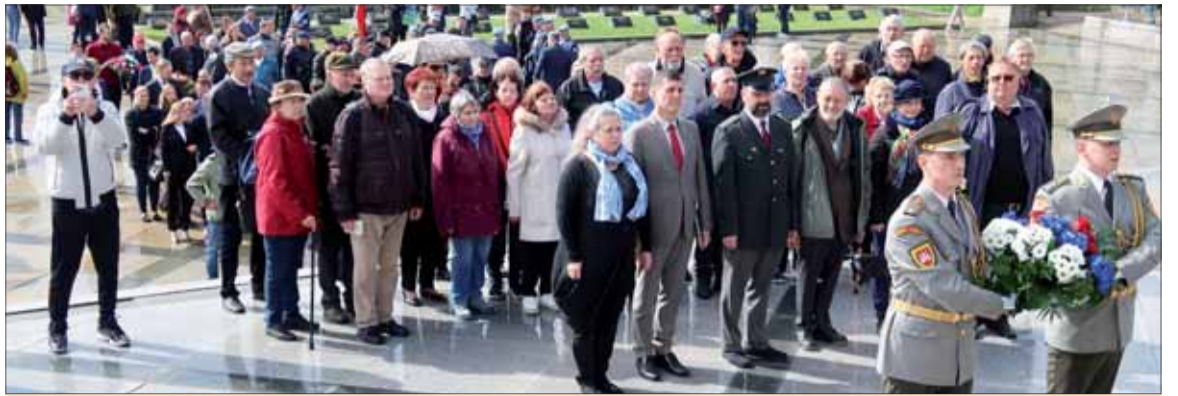
Členovia bratislavskej oblastnej organizácie SZPB.

Áno, je pravda, že sú tu tendencie spochybňovať úlohu národov bývalého Sovietskeho