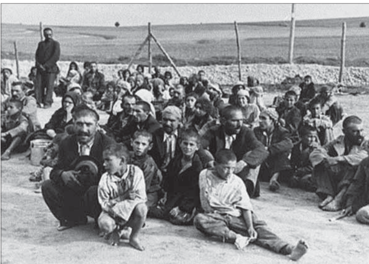
Historici odhadujú, že nacisti a ich spolupracovníci zabili 220 000 až 500 000 Rómov. Wikipedia udáva počet 285 650 Rómov. SRN formálne uznala genocídu Rómov v roku 1982.

Na Slovensku sa zosťrené opatrenia voči Rómom prejavili vydaním Vyhlášky Ministerstva vnútra z r. 1941 „O úprave niektorých pomerov Cigánov“. Rušili sa im kočovnicke listy, majetky (kone, vozy) mali byť rozpredané. Usadení Rómovia nesmeli mať príbytky pri hlavnej ceste, ale až dva km od nej.