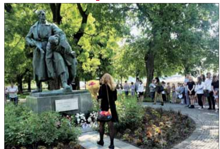
Pamätník bulharským partizánom v Bratislave.