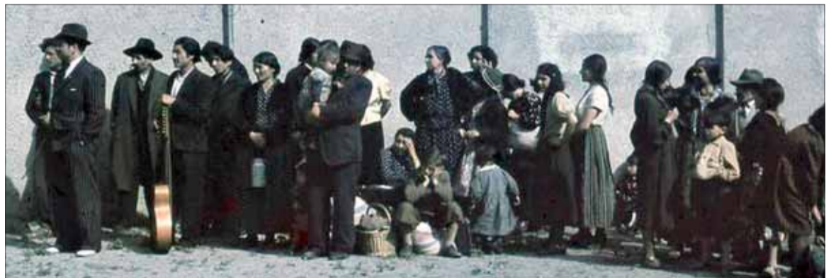
Keďže v zaisťovacom tábore pre Cigánov v Dubnici nad Váhom vypukol škvrnitý tyfus, Nemci 23. februára 1945 zavraždili všetkých chorých Rómov. Odohrali sa aj ďalšie prípady vraždenia Rómov na Slovensku, napr. v Kremničke, vo Zvolene, Brezne a pod. Celkový počet rómskych obetí „porajmos“ na Slovensku sa odhaduje na približne 1000.

Viera Nociarová, ZO SZPB Zvolen Zlatý Potok