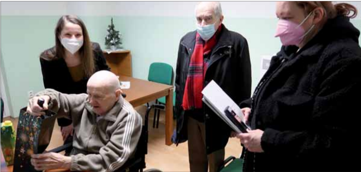
Pred Vianocami sme neprišli s prázdnyimi rukami.