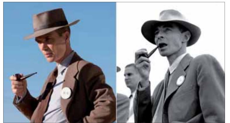
Cillian Murphy (vľavo), ktorý stvárnil Roberta Oppenheimera vo filme, a otec atómovej bomby na archívnej snímke.

– Áno aj nie. Oppenheimer ako vedec dobre chápal, že nie je možné, aby ľudia prestali bádať. Keby štiepenie jadra atómu neopísali v roku 1939, stalo by sa to niekedy inokedy. Skôr či neskôr by niekto vytvoril atómovú bombu. Áno, tak ako ste povedali, Bohr sa 31. decembra 1943, keď navštívil Los Alamos, Oppenheimera opýtal, či bomba bude dostatočne veľká na to, aby ukončila všetky vojny. Vedci dúfali, že zbraň