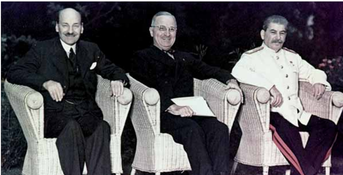
Zľava C. Attlee, H. Truman, J. Stalin.