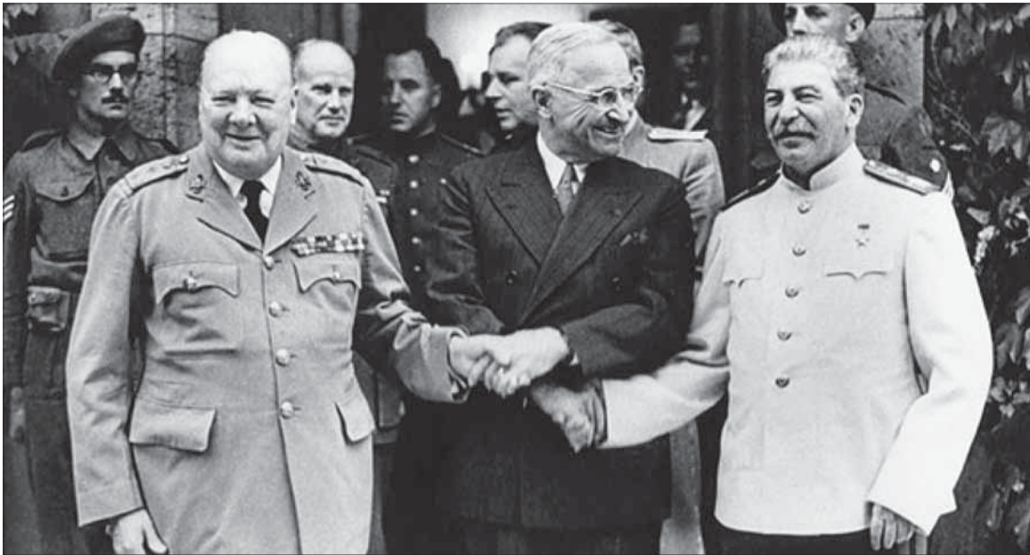
Postupimská konferencia mala naozaj zložitú úlohu: upevniť výsledky vojny, zachovať plody víťazstva a zároveň nedopustiť rozkol medzi spojencami.