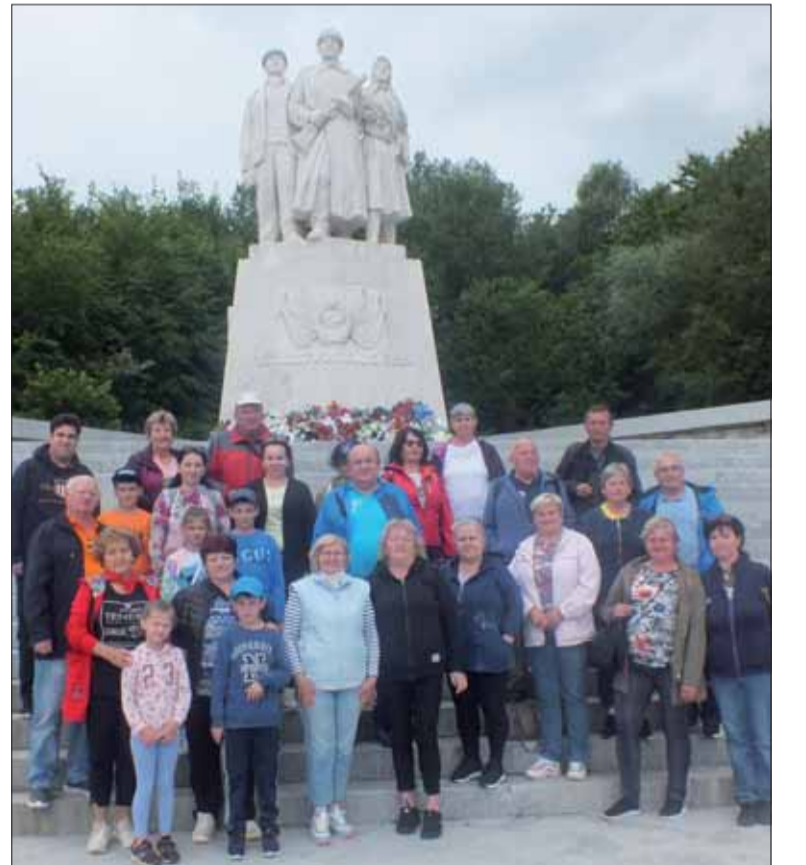
Už prvý pohľad na túto snímku dokazuje, že SZPB pracuje pri výchove občanov k hrdosti na svoje dejiny naprieč všetkými generáciami.

Po presune do Leteckého múzea v Košiciach si účastníci prezreli expozíciu leteckej techniky od jej začiatkov až po súčasnosť. Všetade sme sa stretli s ústretovosťou zamest-