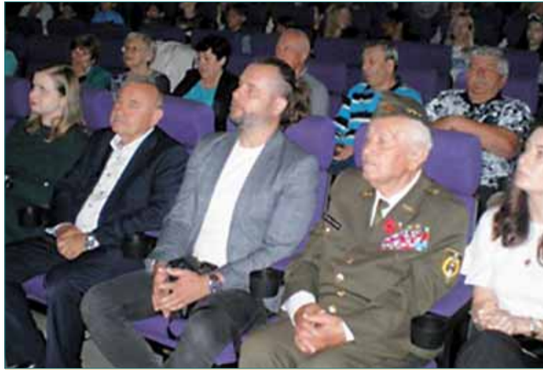
Pohľad do sály.