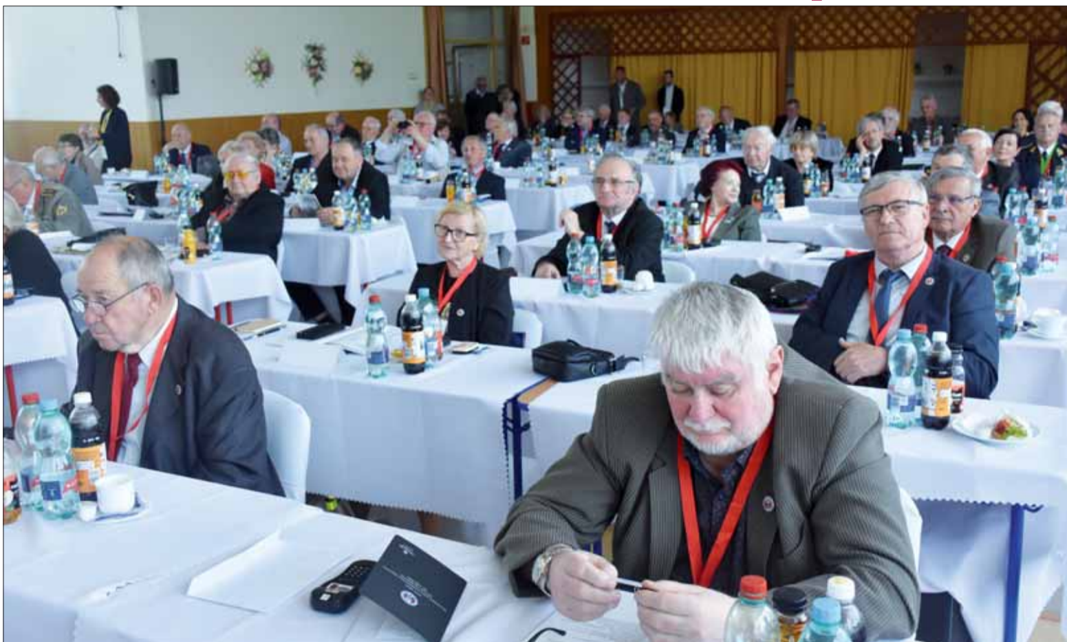
XVIII. zjazd SZPB odhalil okolnosti, na ktoré musíme v nasledujúcich štyroch rokoch do XIX. zjazdu SZPB reagovať návrhmi zmien v rade našich vnútorných dokumentov.

Keď sa predsedu RoK na rokovaní ÚR SZPB jej členovia pýtali, či ním prezentované stanovisko je stanoviskom komi-