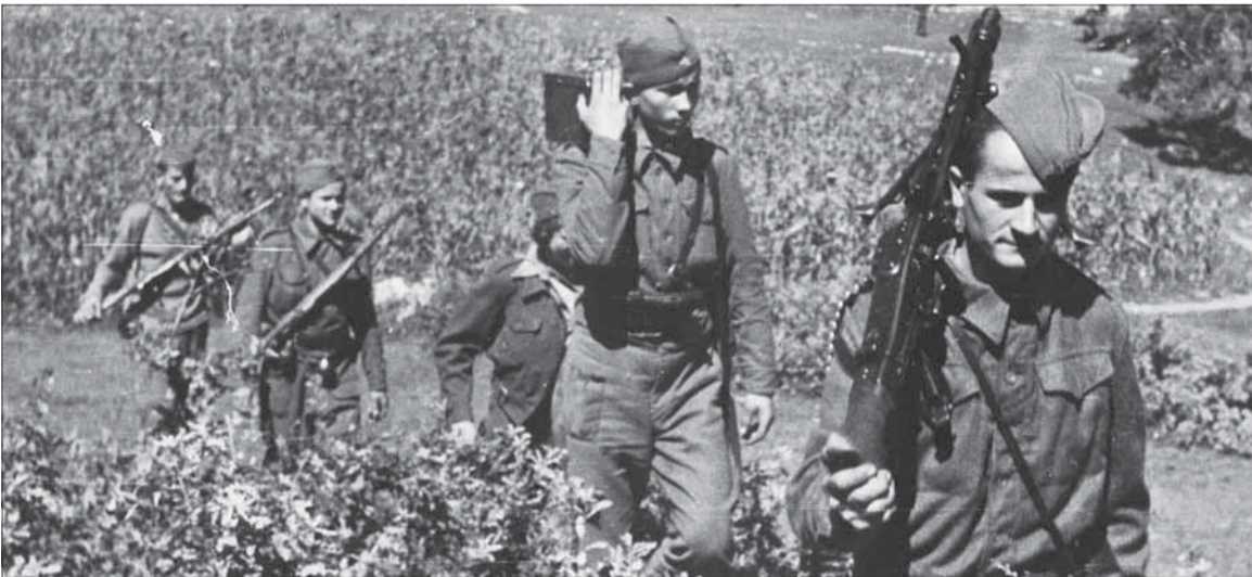
Najväčší partizánsky odboj v 2. svetovej vojne rozpútali Juhoslovania. Ten náš je pre protifašistický odboj tiež významný. Na snímke partizáni z Druhej dalmátskej údernej brigády počas pochodu pri dedine Vilusi v Čiernej Hore.