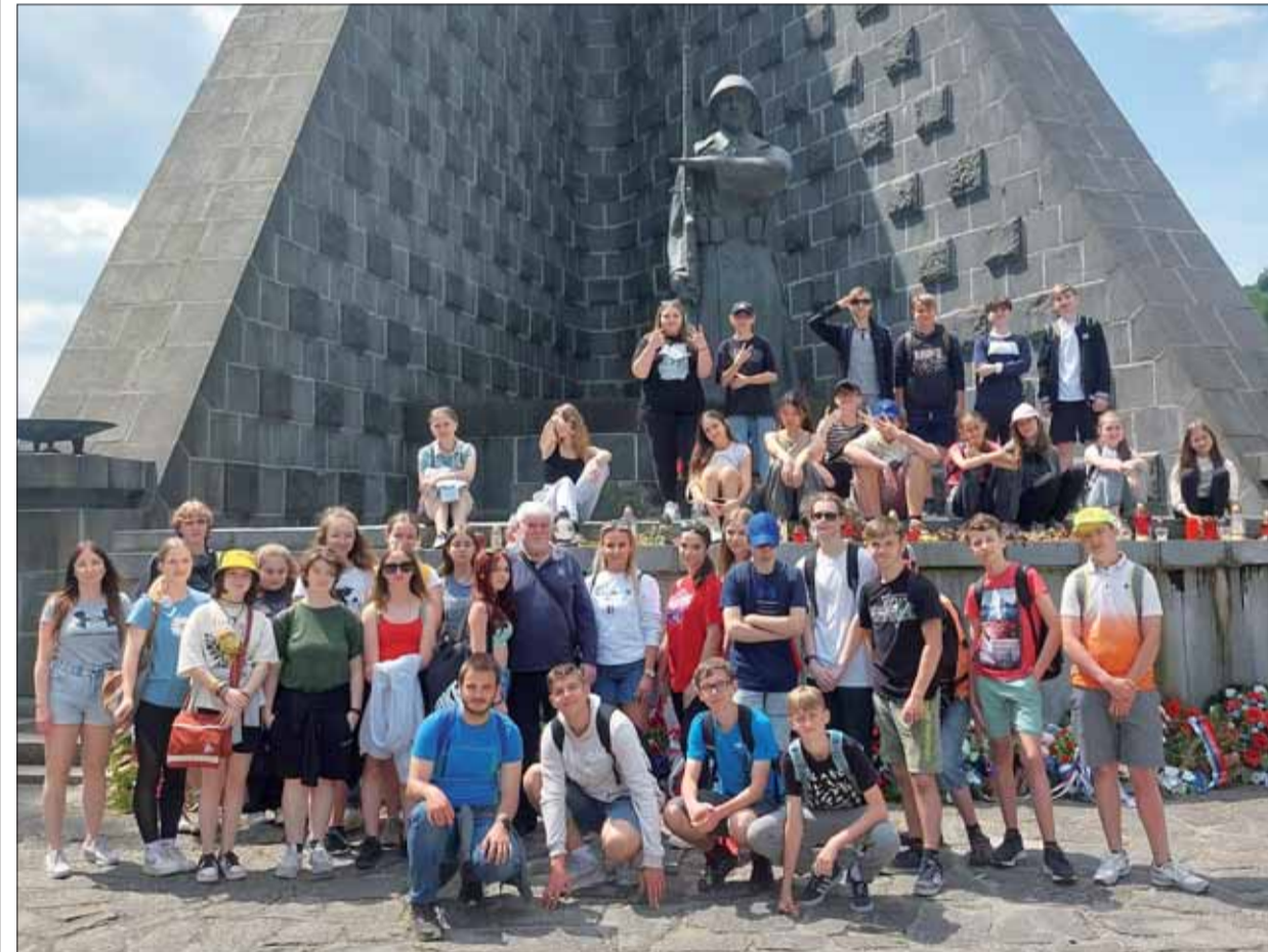
Táto snímka bude žiakom pripomínať Duklianske boje aj keď budú už seniori. Lebo všetko, čo sa tu do- zvedeli, je jednoznačná pravda.