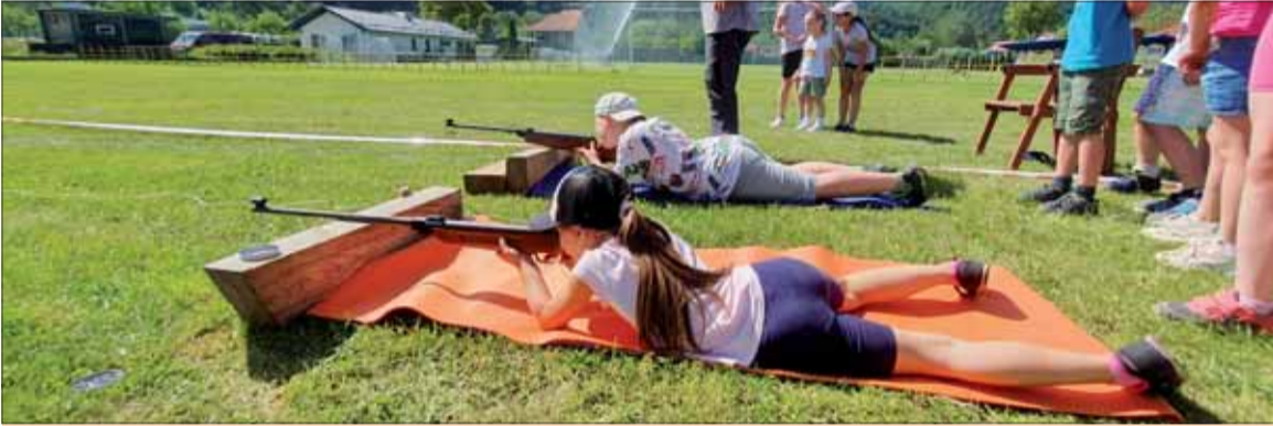
Nádych, zadržanie dychu, presné oko a guľka je v cieľi.

Žiaci boli rozdelení do dvoch kategórií a to spoločne prvý a druhý ročník a druhá hodnotená kategória boli žiaci tretieho a štvrtého ročníka. Obe kategórie súťažili v štyroch disciplínach a to v hode granátom na cieľ, v člnkovom behu, v streľbe zo vzduchovky a poslednou disciplínou bol skok vo vreci.