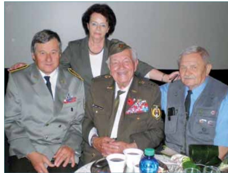
Organizátori a aktéri.

Celkove sa úspešného stretnutia zúčastnilo štyristo ľudí, z toho vyše 360 žiakov a študentov.