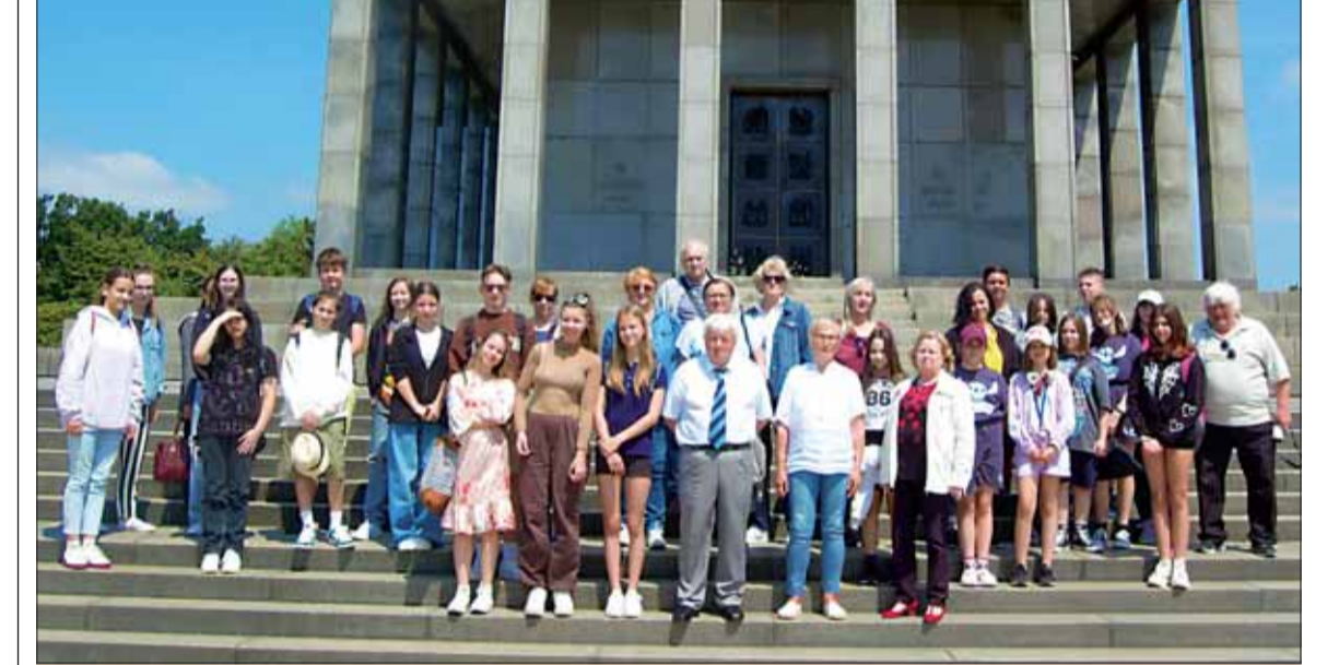
Keby nebolo seneckej ZO SZPB, kto vie, koľkí z týchto mladých ľudí by prišli na Slavín?