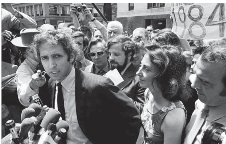
Daniel Ellsberg v mladosti...

Takým bol aj Američan Daniel Ellsberg (7. 4. 1931–16. 6. 2023), ktorý ako prvý vyniesol na svetlo sveta prísne tajnú správu o americkej účasti vo Vietnamskej vojne.