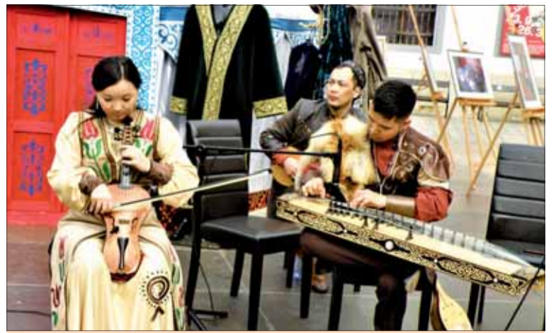
Podujatie oživilo aj tradičné kazašské hudobné nástroje.