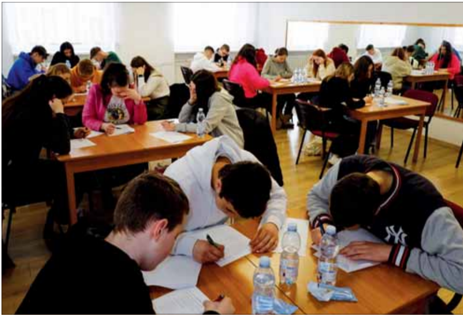
Sústredení žiaci sú najlepším dôkazom, že súťaž ich opäť zaujala.