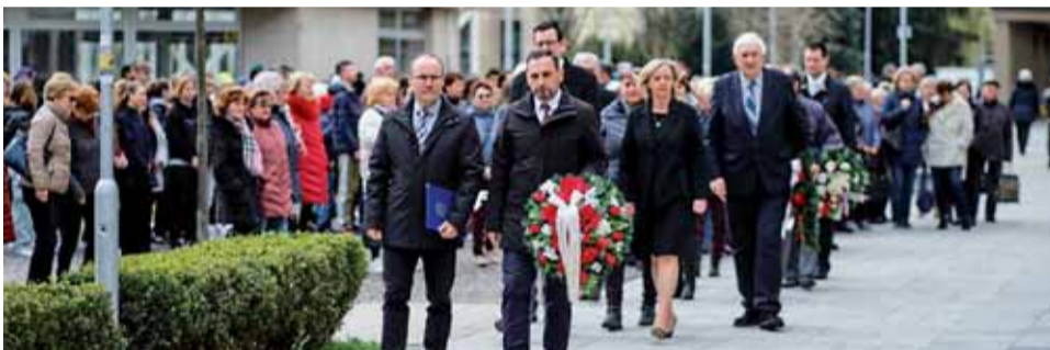
Pietny akt k 78. výročiu oslobodenia Žiaru nad Hronom.

Najskôr to bolo na slávnostnej schôdzi v zasadačke okresného úradu s vyše stovkou účastníkov, potom s predstaviteľmi mesta, okresu, Jednoty dôchodcov Slovenska a členmi politických strán. Napokon sme si oslobodenie mesta pripomenuli aj so žiakmi základných a stredných škôl a pri Pamätnej tabuli osloboditeľov.