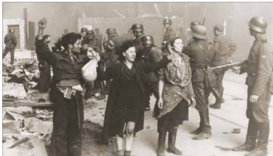
Zatknuté ženy počas povstania vo varšavskom gete.

čo sa do povstania zapojili. Pre Poliakov a celú židovskú diaspóru sú symbolom odvahy a odhodlania. Herzog povstalcov nazval „symbolmi hrdinstva v najtemnejšej hodine ľudstva“.