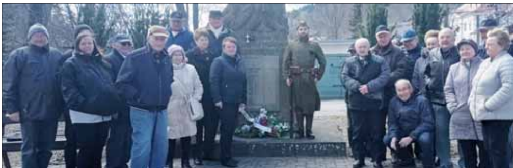
Oslavy oslobodenia Španej Doliny.