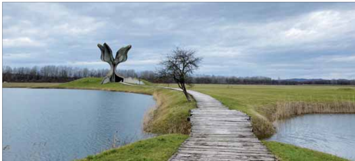
Cesta ku Kamennému kvetu.