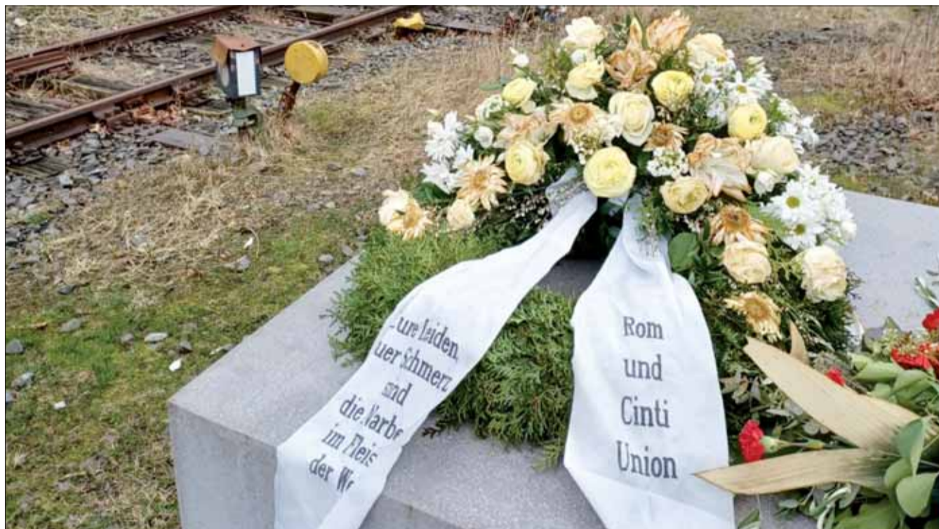
Vence pri pamätníku obetiam (aj) rómskeho holokaustu v Hamburgu.

Medzníkom v živote organizácie, ktorú založili účastníci bojov za slobodu v roku 1946, bude tohtoročný 20. máj, deň 18. zjazdu SZPB. Ako každý živý organizmus, aj my sme si prešli mnohými vývojovými fázami. Opäť zažívame chvíľu, keď treba vytýčiť ciele a spôsoby, ako ich v budúcnosti štyroch rokoch dosiahneme. Musíme predovšetkým vybrať schopných a oduševnených ľudí, ktorí to zvládnu. Verím, že sa nám to podarí.