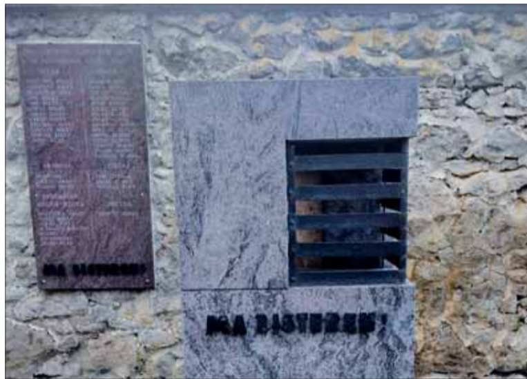
Pamätník obetiam rómskeho holokaustu vo Zvolene.

V čase nastolenia ľudáckeho režimu žilo na Slovensku približne 26-tisíc Rómov, no rov-