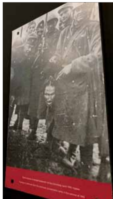
Odňatie hlavy bolo v Jasenovaci bežným trestom.

Na stenách v expozícii sú napísané desaťtisíce mien obetí, ktorým sa toto miesto stalo osudným. Ustašovci zvykli mŕtvolý obetí svojho vyčinenia neskôr hádzať do neďalekej rieky Sáva. Okrem mien a dobových fotografií tu vystavujú aj nástroje aj nástroje vraždenia – sekyry, kladivá či nože.