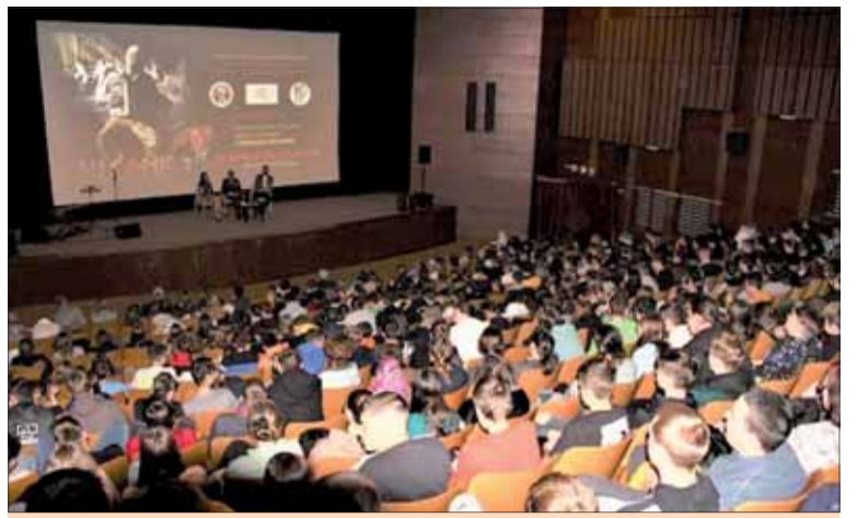
Premietanie dokumentárneho filmu Mlčanie .