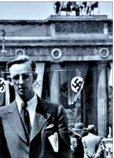
Adelou počas Olympijských hier v roku 1936.