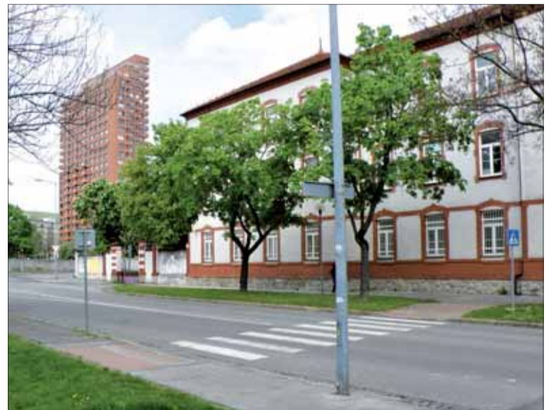
Táto krátka časť ulice by mala naďalej niesť pomenovanie Kutuzovova.