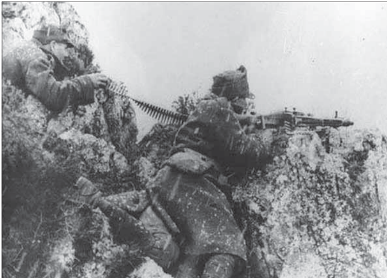
Rumunskí vojaci v slovenských horách počas bojov proti nemeckým okupantom.

Dobrovoľné vzdanie sa moci bolo pre ľudákov nemysliteľné. Veľmi dobre vedeli, že ich politická zodpovednosť je priveľkým bremenom. To ich nútilo až do konca zotrvať pri nacistickom spojencovi. Pred vyše 78 rokmi sa našťastie slovenská opozícia napriek rozličným názorom dokázala dohodnúť a najmä konať.