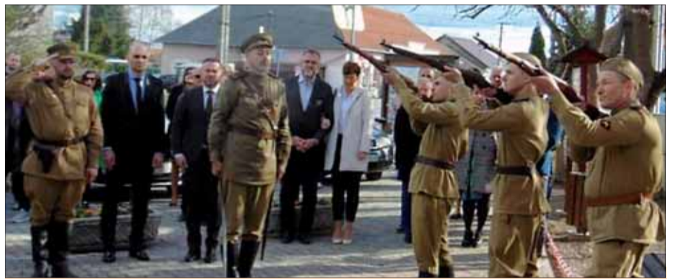
Čestná paľba na počesť padlých červenoarmejcov v Dolnom Ohaju.

Prvý aprílový deň sa v Dolnom Ohaji uskutočnil akt kladenia vencov k pamätnej tabuli venovanej príslušníkom Červenej armády. Obec oslobodili 28. marca 1945. Na slávnostnom podujatí sa zúčastnili predstavitelia miestnej samo-