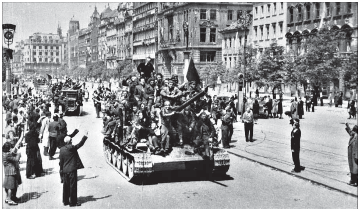
Pražania vítajú sovietskych tankistov.

V sebaklame, že HSLS reprezentuje celý národ, vôbec ne-