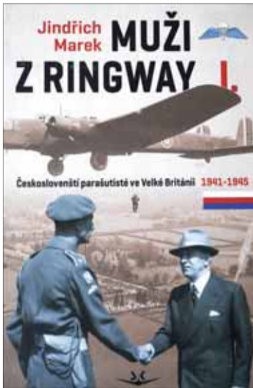
Muži z Ringway, obálka knihy.

Za najväčší nedostatok knihy považujem absenciu odkazov na zdroje, z ktorých autor čerpa. Pri záplave údajov je náročné zistiť, kde sa konkrétne údaje nachádzajú. V monografii je viditeľné bádanie, no rozhodnutie vydať knihu ako populárno-náučnú len so súpisom použitej literatúry je nešťastnou voľbou. Napokon, cenná je bohatá, 35-stranová obrázková príloha s množstvom fotografií. Dôležitý je aj menoslov padlých, zomrelých a popravených čs. parašutistov s výcvikom vo Veľkej Británii v rokoch 1941–1945. (bal)