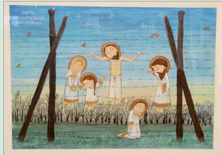
Z vernisáže 4. apríla 2023.