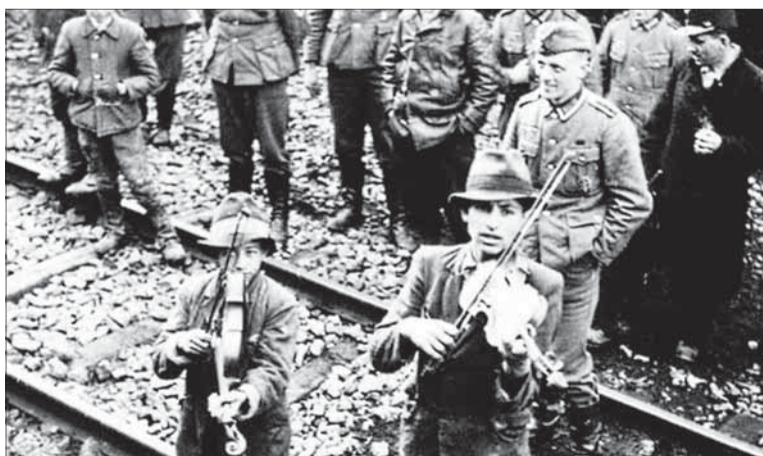
Pri transportoch do koncentračných táborov si nemeckí trýzniteľia vynútili, aby im odvlčení Rómovia zahráli.

Na pamiatku obetiam rómskeho holokaustu ako prvú na Slovensku v roku 2005 umiestnili pamätnú tabuľu v Múzeu SNP v Banskej Bystrici. Ďalších osem pamätníkov nájdete v Dubnici nad Váhom, Dunajskej Strede, Hanušovciach nad Topľou, v Lutile, Nemeckej, Slatine, vo Valaskej Belej a Zvolene. Drevený pamätník je aj v obci Barca, ide o dielo rómskeho rezbára z Gemera.