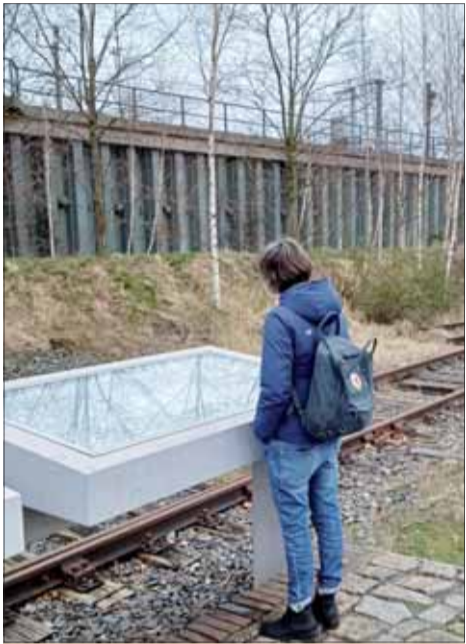
Tabule pri železničnej trati uvádzajú mená zavraždených do koncentračných táborov.

Samotný holokaust Rómov bol v Nemecku dlho nepoznaný. Až v 70. rokoch minulého storočia sa začali ozývať hla-