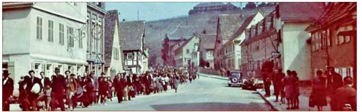
Rómsky holokaust, vysídľovanie Rómov smerujúcich do koncentračných táborov.

Podľa historikov z Ústavu pamäti národa perzekúcie Rómov sa uskutočnili v dvoch etapách: v rokoch 1939–1944, keď Slovenský štát likvidoval kočovníctvo, zriaďoval pracovné útvary pre tzv. asociálne osoby a presadzoval perzekúcie brancov v armáde. Druhé obdobie