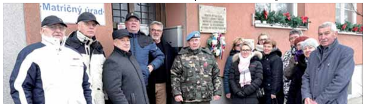
Pri pamätnej tabuli vo Veľkej Lomnici.

Členovia našej ZO a obyvatelia obce si 27. januára 2023 pripomenuli 78. výročie oslobodenia pietnym aktom pri pamätnej tabuli umiestnenej na budove obecného úradu položiením kytice vďaky.