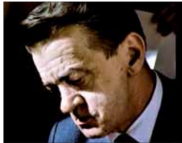
Básnik Miroslav Válek

Básnika a niekdajšieho ministra kultúry Miroslava Váľka oce-