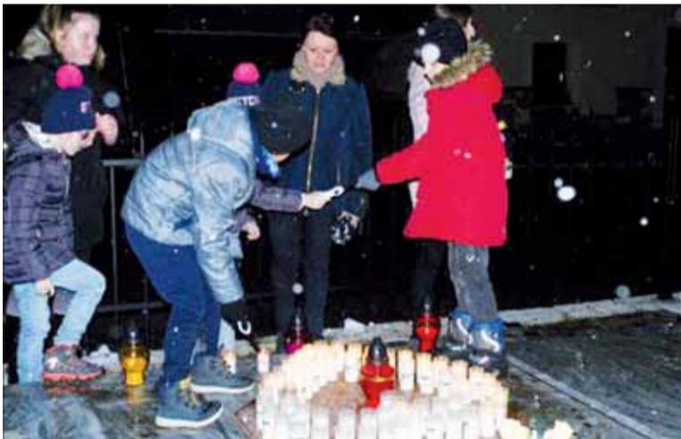
Tohtoročné uctenie si pamiatky obetí masaku v Ostrom Grúni.