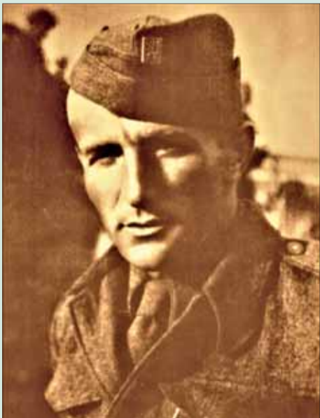
Hrdina Sovietskeho zväzu Otakar Jaroš

Dekrétom Prezídia Najvyššieho sovietu ZSSR zo 17. apríla 1943 mu udelili posmrtno za majstrovské riadenie jednotky, za hrdinstvo a preukázanú obetavosť titul Hrdina Sovietskeho zväzu . Jaroš sa tak stal prvým cudzincom, ktorého Sovieti ocenili svojím najvyšším vyznamenaním. V tom istom roku bol posmrtno vyznamenaný aj Radom V. I. Lenina a neskôr v roku 1943 Vojenským krížom 1939, v roku 1944 medailou Za zásluhy a v roku 1948 Radom Bieleho leva Za víťazstvo I. stupňa. (IS)