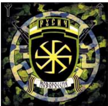
Logo jednotky Rusič.

Podľa niektorých novinárov a analytikov však pokusy o depolitizáciu neboli veľmi úspešné. Otvorenejší bol izraelský historik a lovec nacistov Efraim Zuroff, ktorý v apríli 2022 odmietol tvrdenia, že obvinenia voči pluku Azov sú súčasťou ruských dezinformácií. Pre súčasný stav je do istej miery príznačná marginalizácia pôvodného ideologického radikalizmu a najextrémnejších elementov. Azov však zostáva pod krajne pravicovým velením a v jeho radoch bojujú aj neonacisti. Hlavnou motiváciou väčšiny jeho členov je však reputá-