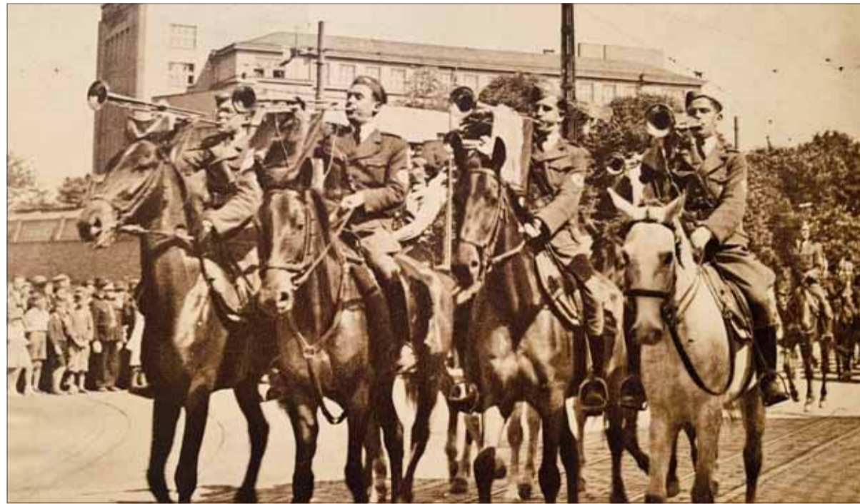
Osľavy Hlinkovej mládeže pred ministerstvom vnútra 9. júna 1940 v Bratislave.

ty, lebo všetko starostlivo zničili nielen nacisti, ale aj ľudáci. Na predmestiach slovenskej metropoly hrmeli sovietske delá, no