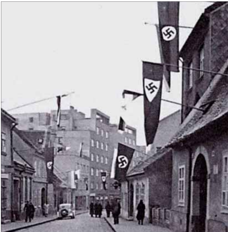
Vysoká ulica s nacistickými zástavami.