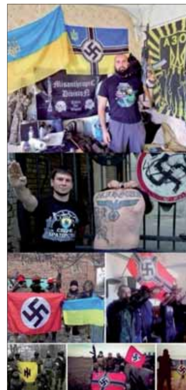
Ukrajinskí neonacisti, Misanthropic Division.

Ako vo svojej knihe Putino- vi fašisti o vzťahu ruského štá-