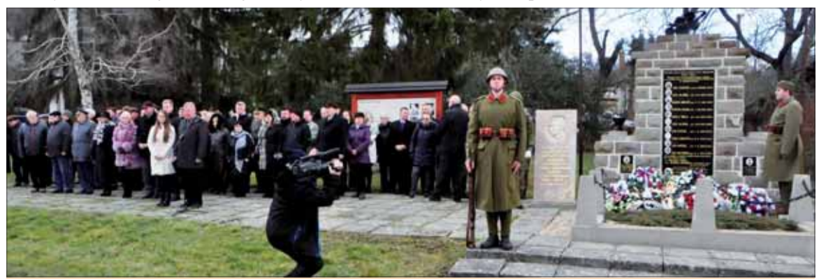
Spomienková slávnosť v Cetune.