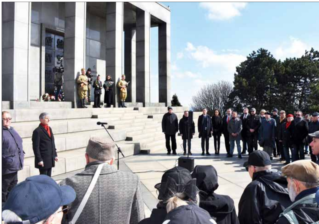
Na oslavách oslobodenia Bratislavy na Slavíne sa zúčastnili takmer dve stovky ľudí.

Preto by nikto nemal spochybňovať obeť červenoarmejcov pri oslobodzovaní Slovenska. Ani kvôli tomu, že sa nám z dobrých dôvodov nepáči veľmocenská Putinova agresia voči suverénemu ukrajinskému štátu. Tí mŕtvi na Slavíne a ďalších cintorínoch za ňu predsa nemôžu. Oni len pomohli zabrániť tomu, aby náš národ stratil svoju reč, aby sa jeho príslušníci narodili ako otroci otrokom kdesi na Sibíri. 4. apríla predsa neoslavujeme Stalinove gulagy a zločiny, ktorých sa dopustil. Pripomíname si obeť zväčša mladých mužov i žien v mene ukončenia utrpenia, ktoré Slovensku i celej Európe spôsobilo nacistické Nemecko, v mene zabránenia ďalšej genocídy v Hitlerovej Novej Európe.