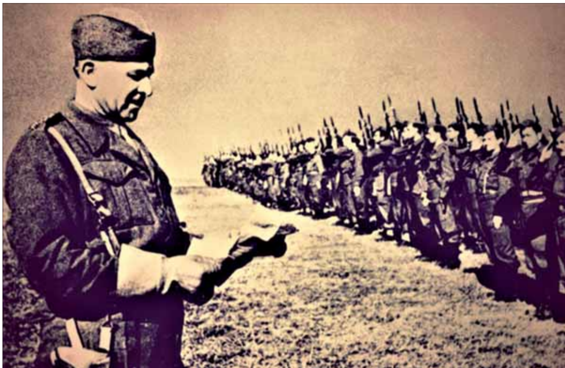
Plk. Ludvík Svoboda pred nastúpenou čs. jednotkou v Sovietskom zväze

Piatu batériu pluku pričlenili 4. marca k čs. práporu, ktorý prevzal obranu v priestore farmy Mírgorod. Na základe rozkazu plk. Svobodu ju pripojili por. Otakarovi Jarošovi, vzápätí zaujala obranné postavenia