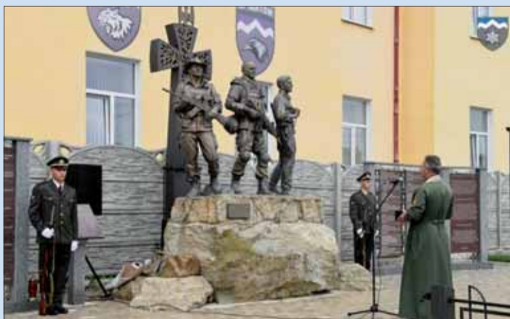
V roku 2019 pribudla k pamätníku v Kolomyji tabuľa s Modlitbou ukrajinského nacionalistu (pri čestnej strážii vľavo).

Viacerí politológovia a historici upozorňujú na fakt, že horské vojenské jednotky neraz siahajú práve po symbolike plesnivca alpínskeho, pre-