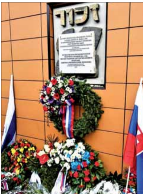
Pamätná tabuľa na popradskej železničnej stanici pripomínajúca prvý transport židovských dievčat do Auschwitzu-Birkenau.