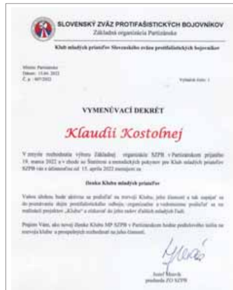
Všetci členovia nášho Klubu mladých priateľov SZPB sa môžu pochváliť dekrétom.