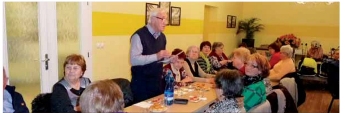
Živá diskusia na schôdzi v Dobrej Nive.

Slávnostný deň sme ukončili v kultúrnom dome divadelným predstavením ochotníkov z Divadla Zelenka „Detvianska nátura“. Výborné herecké výkony nám ponúkli pekný umelecký zážitok.