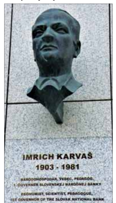
Imrich Karvaš, busta na NBS.

Ak sa teda po 2. svetovej vojne Československo zaradilo medzi víťazné štáty, bolo to aj zásluhou Imricha Karvaša a jeho blízkych spolupracovníkov.