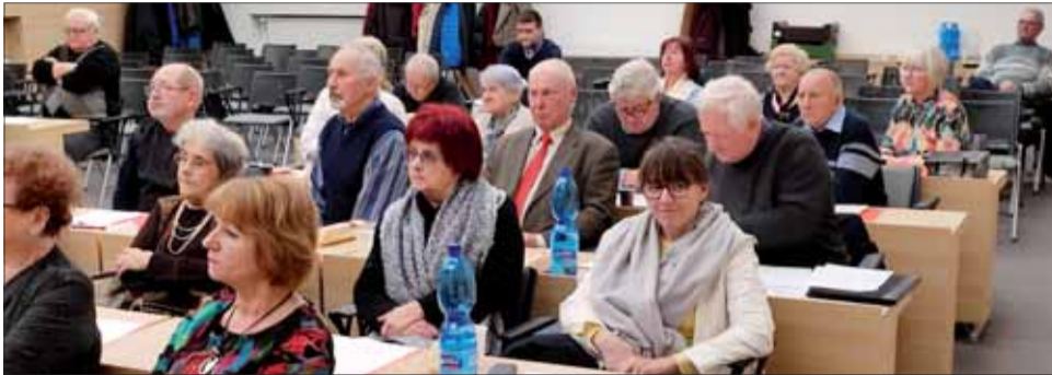
Účastníci oblastnej konferencie vo Zvolene.

Takmer stopercentnú účasť mala oblastná konferencia SZPB vo Zvolene. Jej účastníci zhodnotili uplynulé volebné obdobie ako mimoriadne špecifické pre našu oblastnú organizáciu.