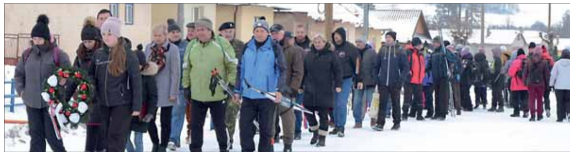
Napriek zasneženej zime pochodovalo z Jarabiny do Litmanovej vyše 100 ľudí.