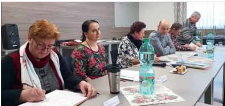
Členovia výboru počas výročnej schôdze v roku 2023.