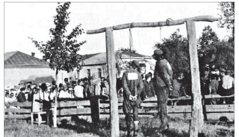
Poprava sovietskych partizánov príslušníkmi slovenskej Rýchlej divízie.