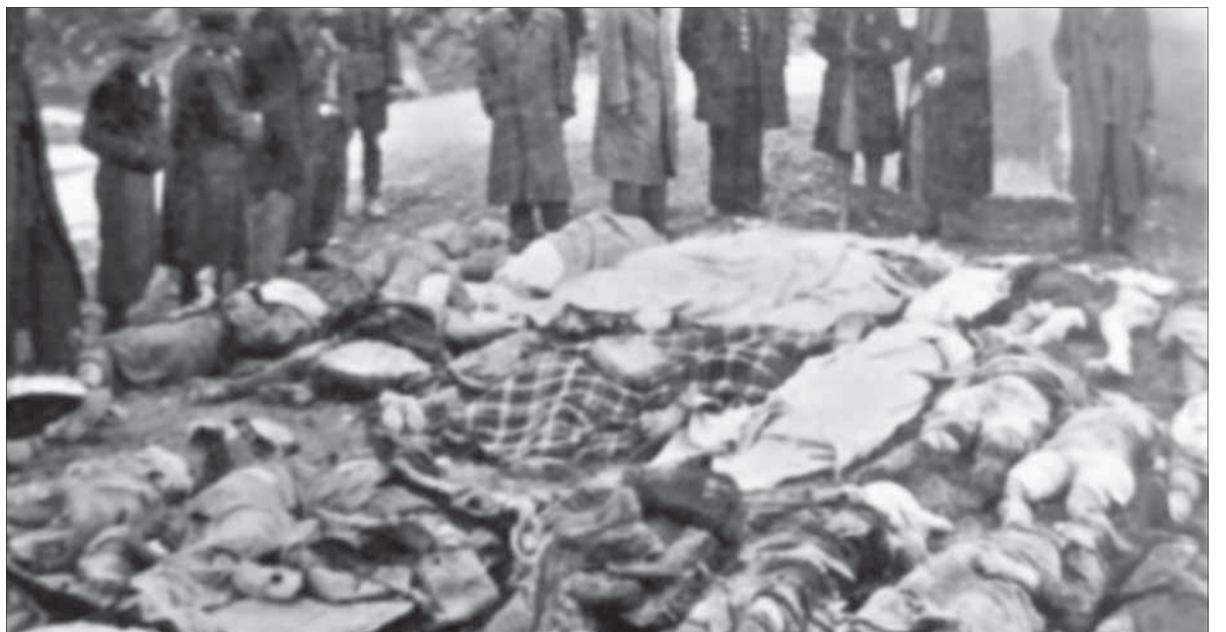
Identifikácia mŕtvych obetí.

hol 345. Išlo zväčša o civilistov. Bombardéry štartovali z letiska nad Budapešťou a tam sa po zhodení nákladu aj vrátili. Bol totiž plánovaný aj druhý nálet, ktorý sa mal uskutočniť popoludní. To sa však už neudialo. Veliteľstvo ČA ho zrušilo a namiesto toho sa rozhodlo bombardovať pevnosť v Komárne.