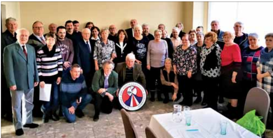
Účastníci oblastnej konferencie v Prievidzi.