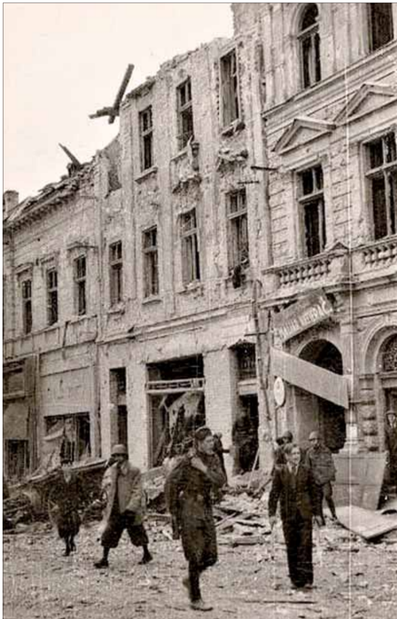
Dnešná Štefánikova trieda po bombardovaní vyzerala desivo.