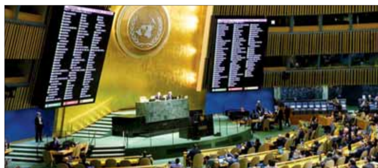
Valné zhromaždenie OSN vyzvalo Rusko, aby sa stiahlo z Ukrajiny.

„Valné zhromaždenie OSN dnes prehovorilo veľmi jasne,“ reagoval na schválenie rezolúcie šéf diplomacie EÚ Josep Borrell. „Toto hlasovanie ukazuje, že medzinárodné spoločenstvo stojí pri Ukrajine.“ K nemu sa pridal japonský minister za-