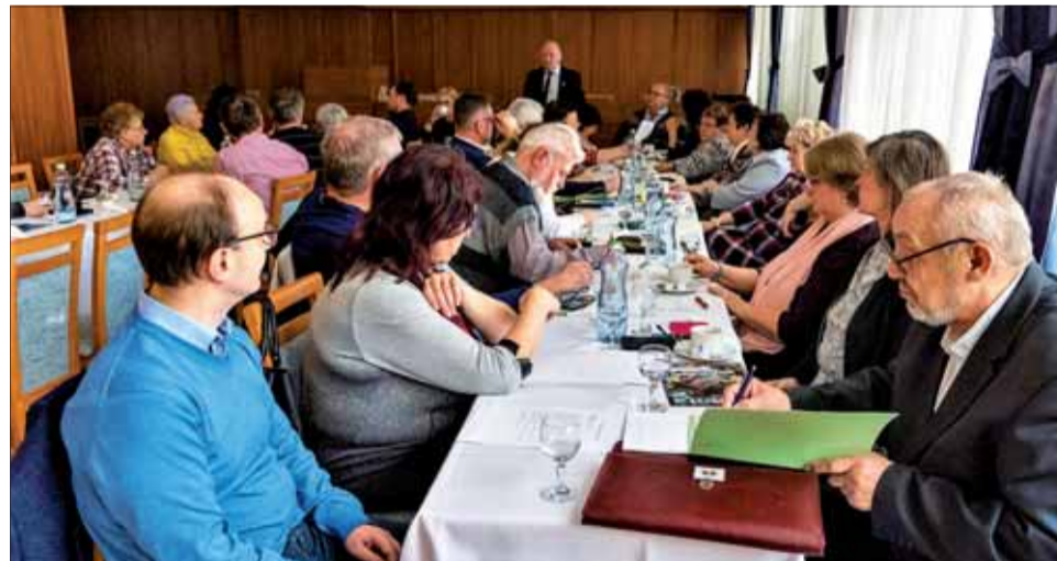
Februárová oblastná konferencia v Senici.