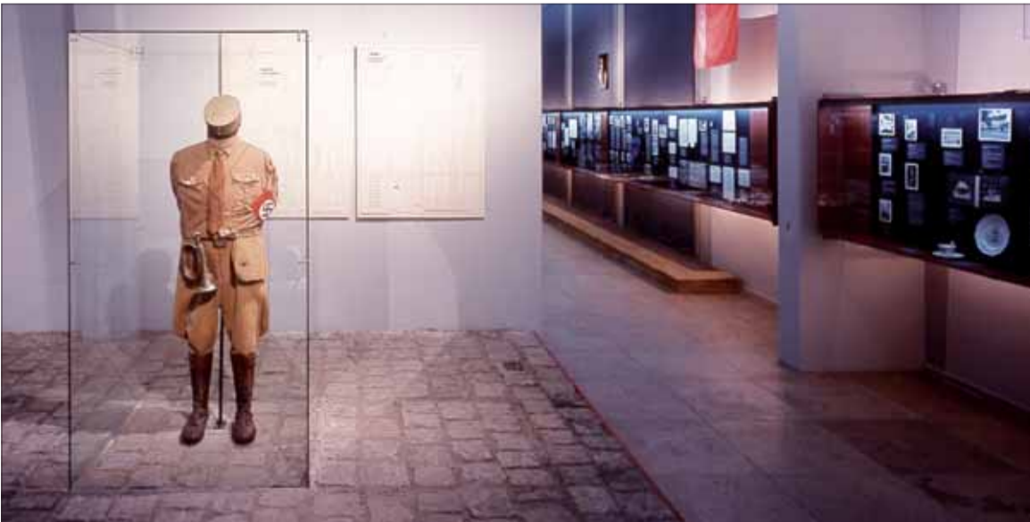
Stála výstava v koncentračnom tábore Oranienburg 1933–1934, na snímke uniforma dozorcov SA.

(Podľa sachsenhausen-sbg.de spracoval Branislav Balogh)