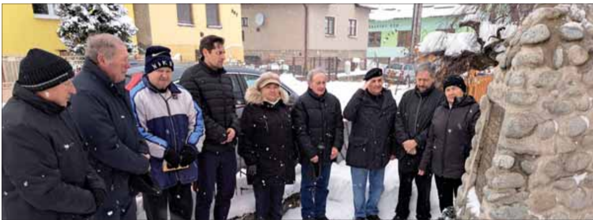
Pri pomníku padlých partizánov v Liptovskej Kokave.