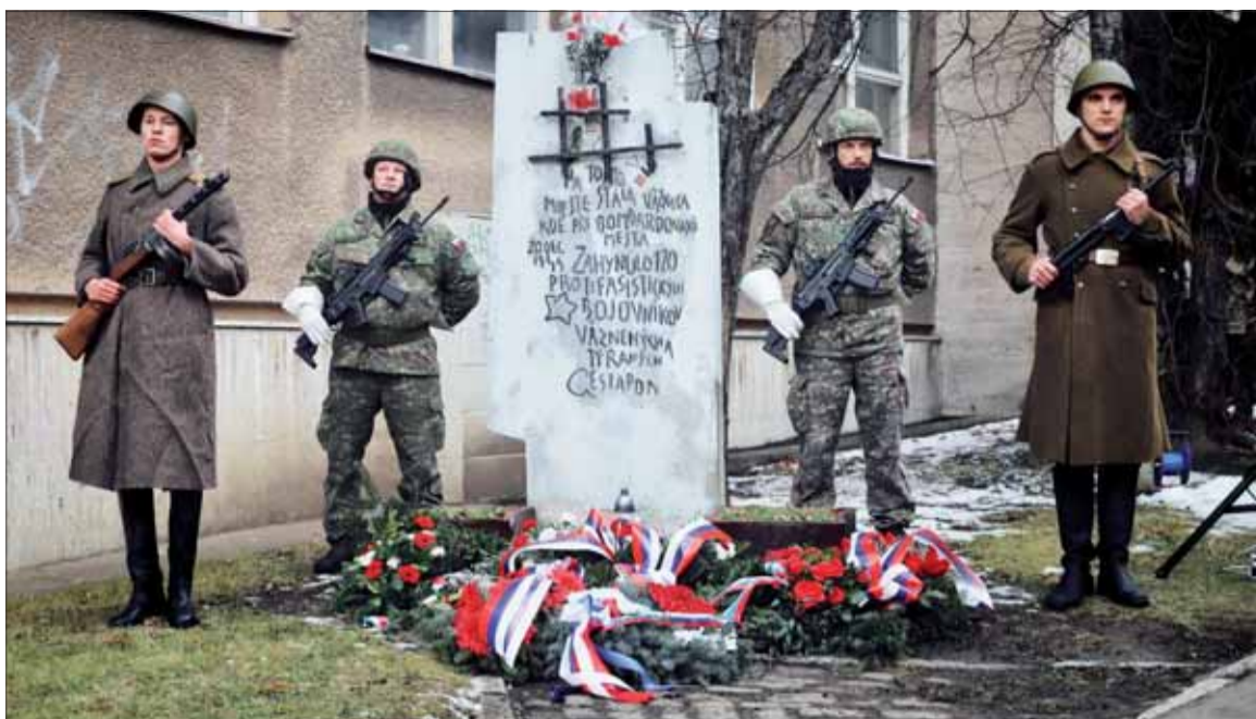
Pomník protifašistickým bojovníkom, ktorí zahynuli vo väznici prešovského gestapa.

Na Solivare si smrť vybrala krutú dať i z radov tých najslabších. Pri hrách vo vodnej nádrži Mindžala nastal výbuch míny a navždy prešiel krehkú niť života trom malým chlapcom. Vojna sa nepýta, či si dospelý alebo dieťa. Vojna nie je počítačová hra, v ktorej máme ďalšie „životy“. Nezabúdajme a nedopusťme nástup neonacizmu v zemi našich predkov pod krásnymi Tatrami.