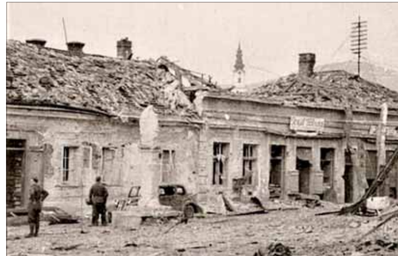
Párovce, vyústenie Piaristickej na Mariánsku ulicu po bombardovaní 26. marca 1945. V pozadí vidno baziliku, ktorá je integrálnou súčasťou Nitrianskeho hradu.