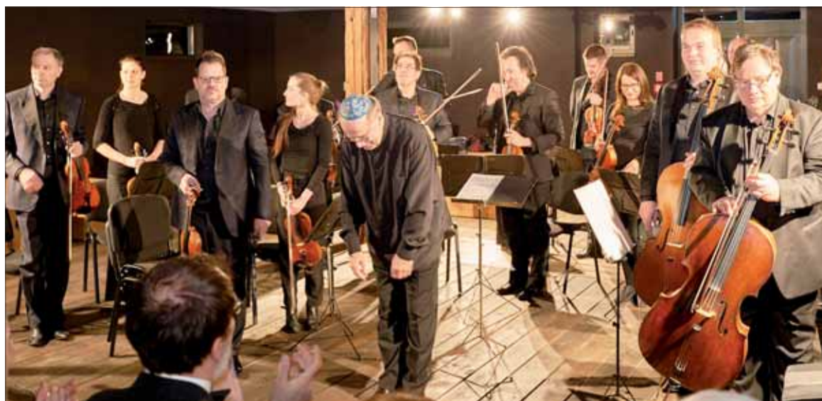
Umelci zožali zaslúžený potlesk.

Symfonický orchester vznikol v roku 2004 na Hudobných dňoch Bruna Waltera v Bratislave. Jadro tvoria hudobníci z orchestrov medzi Viedňou, Bratislavou a Budapešťou. Spoluúčinkujú aj medzinárodne renomovaní sólisti. „Orchester roz-