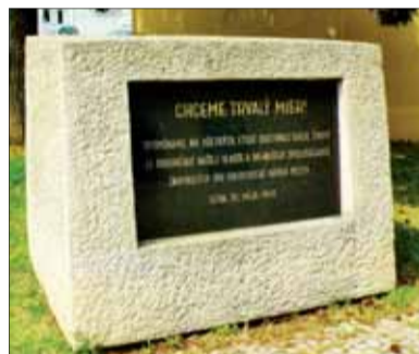
Pamätná tabuľa pri Kaplnke sv. Michala pre Nitranov, ktorí zahynuli počas 2. svetovej vojny.

Okolo deviatej ráno sa na oblohe objavilo smerom od Šale spolu 27 bombardérov Boston, ktoré mali Sovieti vo svojej výzbroji. Na mesto zhodili náklad bômb. Následkom toho bolo úplne zničených 48 budov a 289 čiastočne poškodených. Počet obetí dosia-