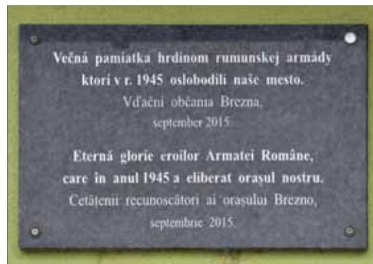
Pamätná tabuľa Brezno.