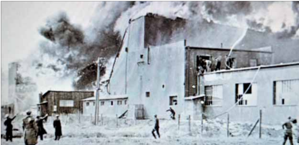
Hasenie požiaru v zasiahnutej Tabakovej továrni.

Správy z frontovej línie a intenzívne prelety sovietskych lietadiel spojené s ostreľovaním a bombardovaním zhromaždísk techniky a vojska Wehrmachtu vo Vrábľoch a Komjaticiach už 25. marca zreteľne naznačovali, že onedlho sa bude bojovať aj o Nitru. Nemci vedeli, že front sa k nej nezadržateľne blíži, a preto urýchlene evakovali poľnú nemocnicu z kláštora na Zobore