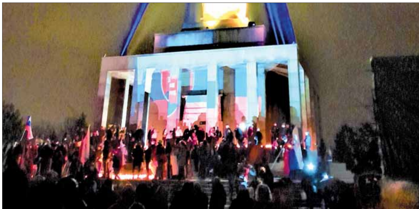
Slavín sa v deň výročia ruskej invázie na Ukrajinu ponoril do množstva svetiel.

V každom prípade zúžiť debatu na oblastných konferenciách iba na tento problém by nebolo správne. Aj nášmu Zväzu ide o budúcnosť, ktorá by bola životne ohrozená v prostredí plnom nenávisti, vzájomnej nevráživosti a v neustálom hľadaní vnútorných nepriateľov a zradcov.