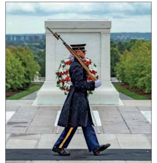
Washington – Hrob neznámeho vojaka.

Miestom odpočinku neznámeho vojaka je Arlingtonský národný cintorín v štáte Virgínia. Mohutný náhrobok z jurského mramoru bol slávnostne odhalený 11. novembra 1921. Pod ním spočinuli ostatky vojakov z amerických poľných cintorínov z prvej svetovej vojny, nachádzajúcich sa vo Francúzsku. Finálnu po-