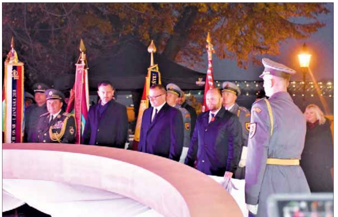
Odhaleniu pomníka asistovali premiér Eduard Heger, predseda NR SR Boris Kollár a minister obrany Jaroslav Nad' (zľava).