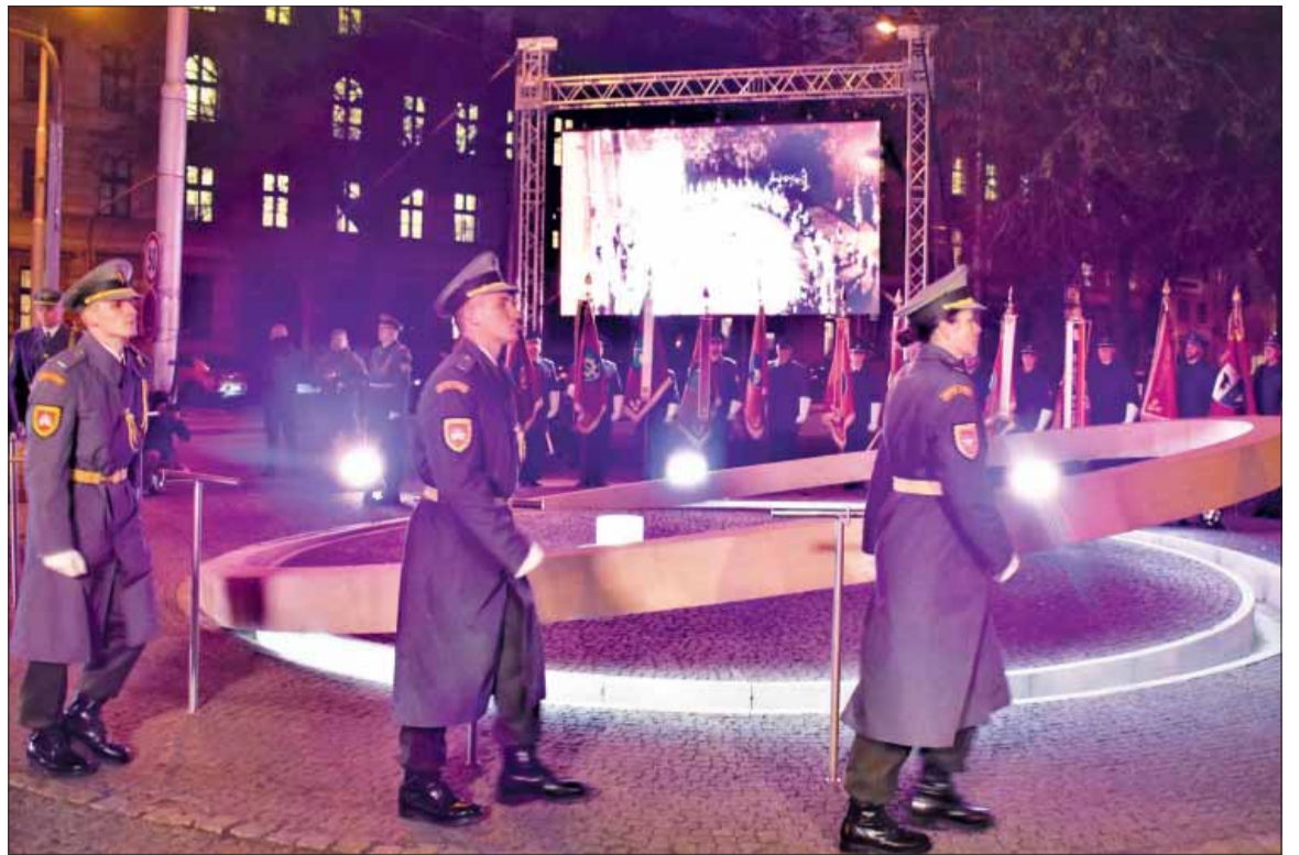
Odhalenie pomníka nad Hrobom neznáameho vojaka s levitujúcim kruhom večnosti.

Pod dlažobné kocky uložili truhličku s kosťami príslušníka 1. čs. armádneho zboru, ktoré objavili v roku 1997 v Duklianskom priesmyku a doteraz ich uchovávali vo Vojenskom múzeu vo Svidníku. Keď sme vo večerných hodinách a po prežitých dojmach sklamaní odchádzali z Rázusovho nábrežia, ktosi potichu zanôtil známy verš z piesne Karla Kryla: „A čo na to neznámy vojak?“