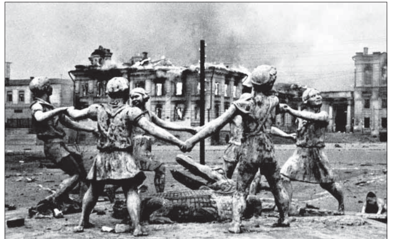
Slávna fontána tancujúce detí boje v Stalingrade ako-tak prežila.

Nemecké velenie zasadilo hlavný úder silami 6. armády v smere na Stalingrad po najkratšej ceste cez veľký ohyb Donu zo západu a juhozápadu. Mali takmer dvojnásobnú prevahu síl. Každým dňom oča-