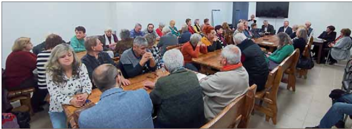
Výročná členská schôdza ZO SZPB v Strážskom je vždy veľkým a príjemným stretnutím.

Naša vďaka za aktívnu a prínosnú spoluprácu patrí aj miestnemu klubu dôchodcov, michalovskej okresnej organizácii Únie žien Slovenska, krúžku paličkovanej čipky Pavučinka, MO Matice slovenskej, Speváckemu zboru Rozkvet a krúžku poézie a prózy Zrkadlenie. Spoločné podujatia obohacujú činnosť všetkých zmienených organizácií a spolkov.