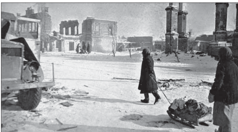
Krutá zima sa začala v roku 1942 v Stalingrade veľmi skoro.

Hlavnými podmienkami pre konečnú porážku Sovietskeho zväzu bolo podľa najvyšších generálov Wehrmachtu dobytie Kaukazu s jeho bohatými zdrojmi ropy, úrodných poľnohospodárskych oblastí Donu, Kubáňa, severného Kaukazu a dolného Povolžia. Očakávané dobytie Stalingradu by nielen blokovalo zásobovanie Sovietov, ale otváralo by aj novú možnosť útoku na Moskvu z juhozápadu,