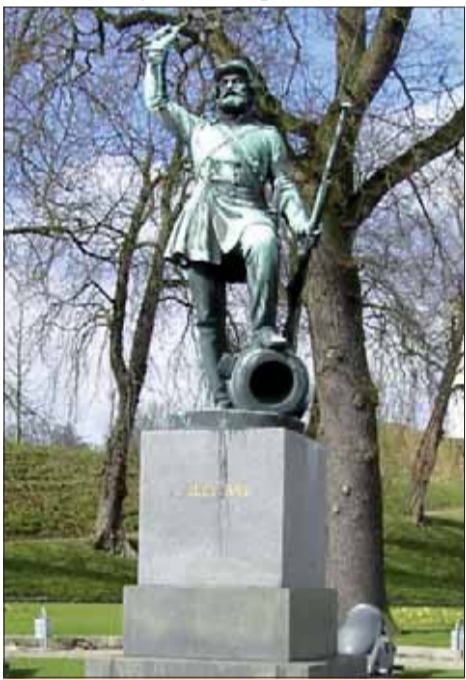
Fredericia Dánsko, prvý hrob neznámeho vojaka v Európe.

Moderná myšlienka vytvoriť Hrob neznámeho vojaka však pochádza z obdo-