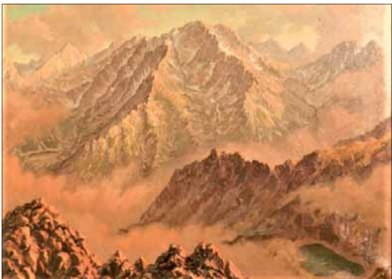
Štefan Kraker: Tatry v lete, olej na plátne, 1950.