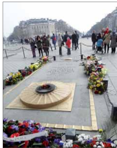
Paríž – Hrob neznámeho vojaka.

V Paríži uložili ostatky neznámeho vojaka do kaplnky vo Víťaznom oblúku 10. novembra 1920. Pôvodne mali byť v Panteóne, od toho sa však po protestoch verejnosti upustilo. Samotné uloženie na dnešné miesto (pod Víťazný ob-