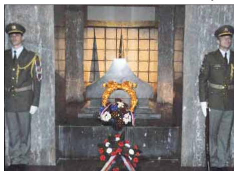
Praha – Hrob neznámeho vojaka.

Nacisti si uvedomovali, že hrob zosobňuje vojenské tradície bývalého Československa, resp. Čechov. Karl Hermann Frank v snahe oslabiť vôľu národa vydal