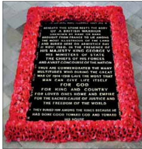
Westminster – Hrob neznámeho vojaka.

Westminsterskom opátstve, mieste posledného odpočinku britských panovníkov. Miestom sa snažil premiér David L. George a kráľ Juraj V. zdôrazniť význam vojnových obetí. Ostatky neznámych vojakov padlých na viacerých francúzskych bojiskách boli exhumované vo Francúzsku 8. novembra 1920 a so všetkými poctami prevezené do Veľkej Británie. Úctu im ešte pred nalodením vzdal osobne maršal Ferdinand Foch, vrchný veliteľ spojeneckých síl. Štátny pohreb sa konal vo Westminsterskom opátstve presne 11. novembra 1920 za účasti kráľa Juraja V. a mnohých