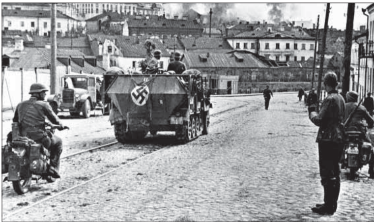
Príchod nemeckých vojsk do Stalingradu v lete 1942.

nonádou a zákopovými bojmi púšťal žilou červenoarmejcov. Úspech pri Charkove (12.–28. mája 1942) bol tiež pre Nemcov istým signálom, že sa môžu pokúsiť o viac, teda zvrátiť vývoj vo vojne. Cieľom nového, masívneho útoku sa mal stať Stalingrad, nové veľké hospodárske centrum ZSSR a zároveň strategický dopravný koridor z juhu na sever. Po Volge a železnici sa transportovali strategicky dôležité pohonné hmoty a potraviny.