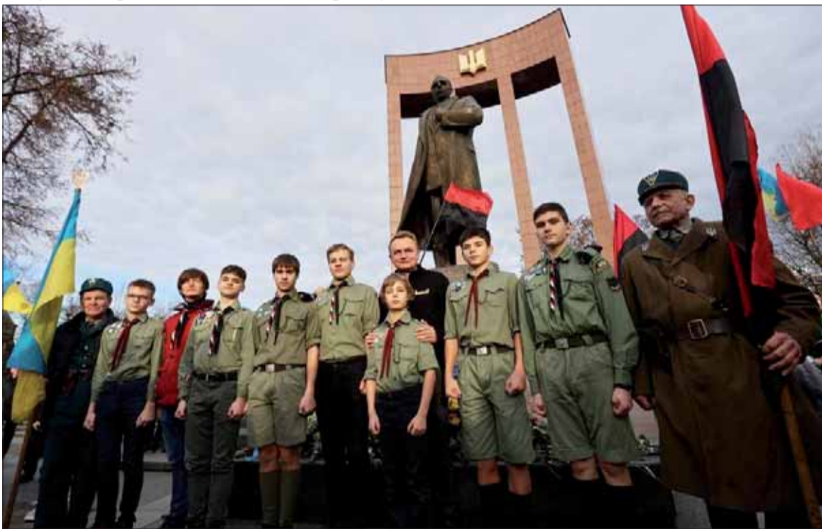
Pred pomníkom Stepana Banderu v Lvove.