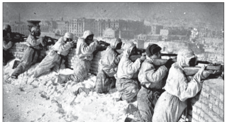
Sovietski strelci v Stalingrade.

„Konečné riešenie českej otázky musí so sebou priniesť to, že tento priestor musia definitívne osídliť Nemci. Tento priestor je srdcom Ríše a nemôžeme strpieť, ako ukazuje vývoj nemeckej histórie, aby z neho znova a znova prichádzali rany dýkou proti Ríši.“