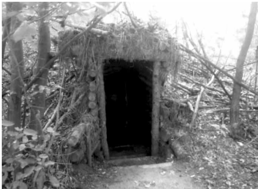
Bunkre v lese nad Dargovským priesmykom