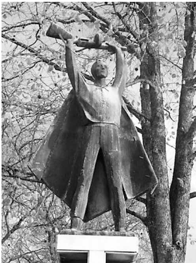
Vladimír KOMPÁNEK - Ferdinand MILUČKÝ Pomník SNP v Ilave, bronz 1959