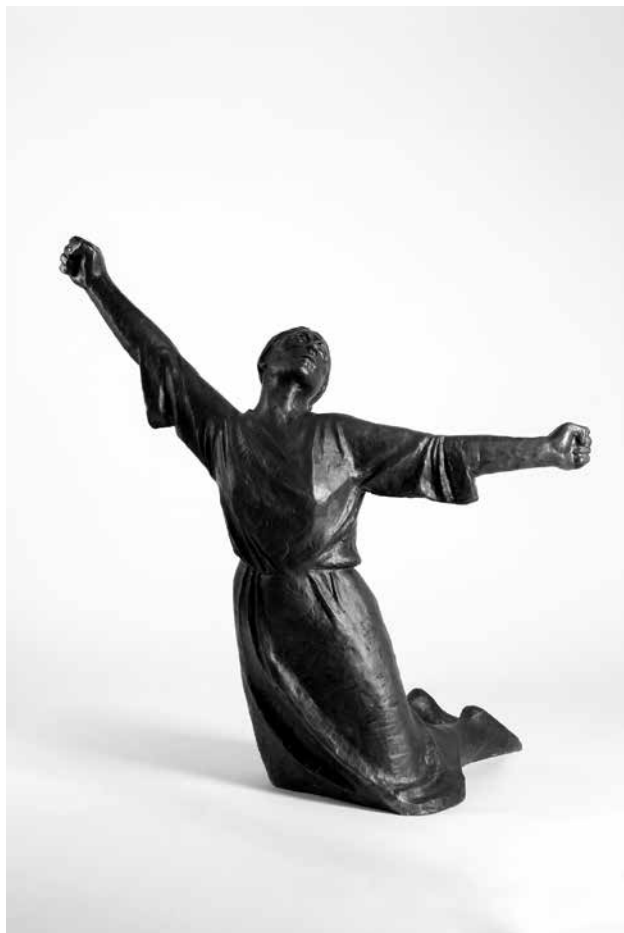
Klára PATAKI Ústredná plastika Pamätníka SNP v Nemeckej, bronz 1960-61