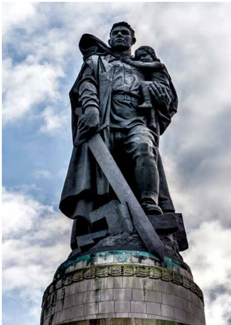
Jevgenij VUČEŤIČ Ústredná plastika vojaka osloboditeľa na pamätníku-cintoríne Sovietskej armády v Treptowe v Berlíne - bronz 1949