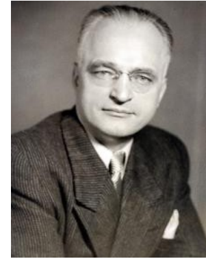
Gustáv Husák a Ján Ursíny